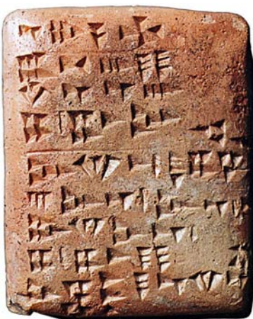
Tablilla de arcilla que muestra la escritura cuneiforme, en donde se plasmaban las cuentas de las civilizaciones antiguas

Alrededor del año 3000 a.c., culturas como los Sumerios, los Acadios, los Babilonios y los Asirios florecieron en las ciudades-Estado, en donde se dieron importantes avances como la escritura cuneiforme, el derecho, las matemáticas, la rueda, la arquitectura (con adelantos como la bóveda y la cúpula), la astronomía, el riego artificial, entre otros.