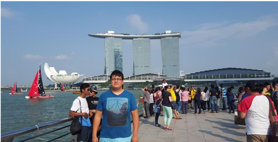
Foto con vista a Marina Bay tomada desde Merlion Park.

Cuando se me informo que había sido asignado a esta universidad, fue cuando me puse realmente a investigar todo lo que pude sobre de Singapur, cosas como su fuerte economía a pesar de no contar con prácticamente ningún recurso natural, sus estrictas leyes, su cultura única por ser una mezcla, ver las fotografías de sus imponentes construcciones como Marina Bay, Merlion Park, Sentosa, Gardens by the Bay y muchos otros, su rara mezcla de platos típicos con influencia británica, china, india y malaya, entre muchas otras cosas, pero por más que se investigue, lo cierto es que nada de lo que se pueda ver se compara con ya estar en una ciudad como Singapur.