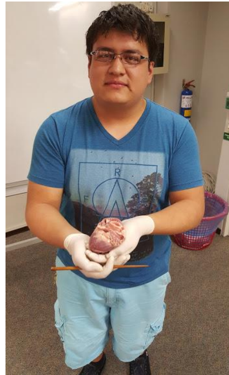
Foto con corazón de cerdo clase de Biomecanica.

La vigilancia constante combinada con los fuertes valores inculcados en las personas, hacen que sea que Singapur sea una de las ciudades más seguras del mundo.