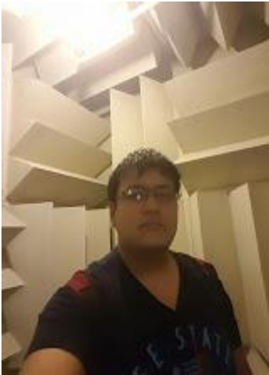
Foto en camara naecoica clase de Control de ruido y vibraciones.

Estudias en una de las universidades que están el en top 20 de a nivel mundial y en el top 5 en Asia (sigo convencido que el IPN es la mejor escuela para estudiar en México, pero lo cierto es que estudiar en una escuela como la NTU es totalmente diferente).