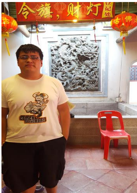
Foto de viaje a Malasia.