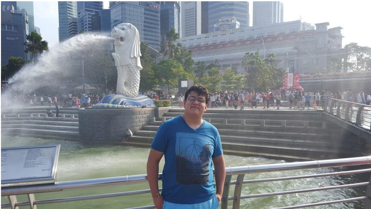
Foto en el Merlion Park.

Así podría seguir mucho tiempo describiendo lo increíble pero como ya lo mencione arriba nada de lo que pueda decir, se compara con venir y vivirlo en persona.