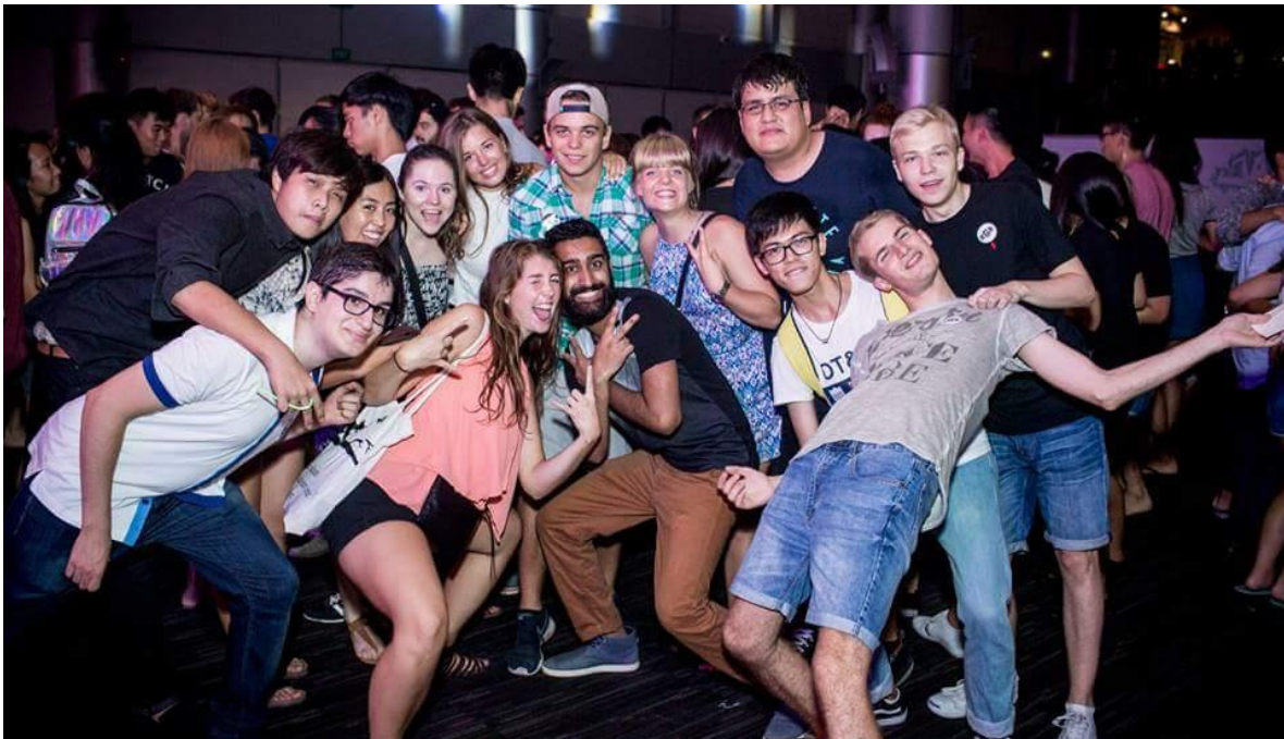
Foto de fiesta de bienvenida a los estudiantes de extranjero.

No solo conoces personas de Singapur sino de todo el mundo este año la NTU recibió más de 1000 estudiantes de intercambio de todo el mundo así que no solo te acercas a la cultura asiática si no también conoces más formas de pensar.