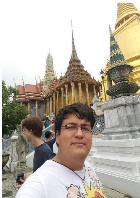
Foto de viaje a Tailandia.

Los profesores son muy accesibles a la hora que le preguntas por algunas dudas y en caso de no poder asistir a alguna clase por lo general estas son grabadas y se suben a la plataforma de la escuela para que puedas repasar tus clases las veces que quieras.