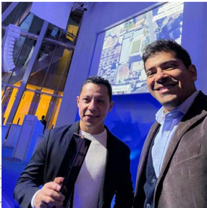
En la gala de premiación Architizer A+Awards