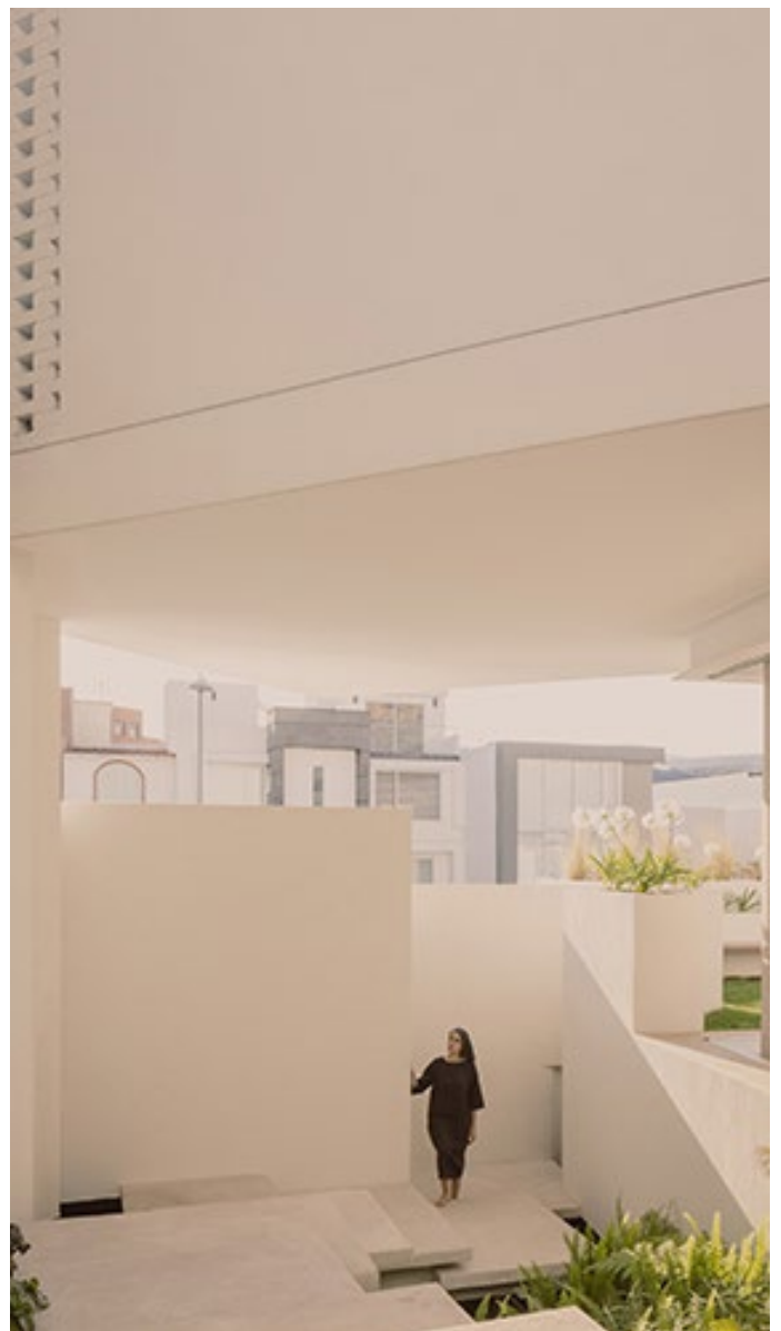
Los politécnicos ganaron el primer lugar, en la categoría residencial

Identificados con esta pareja que, al igual que ellos, empezó desde abajo con un negocio propio y que vivieron de alquiler durante muchos años, los egresados politécnicos platicaron con cada integrante de la familia para plasmar en la construcción las necesidades de cada uno, de tal manera que fuera lo más confortable posible.