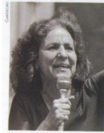
Rosario Ibarra de Pineda, candidata del PRI a la presidencia de la República, 1962.