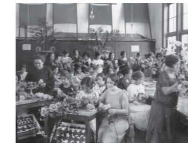
Taller de florería.