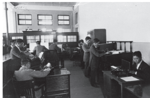
La escuela de Bacteriología.

En el siglo XX surgieron más de estas escuelas, acción que se aceleró al triunfo de la Revolución de 1910 y proclamarse la Constitución Política de los Estados Unidos Mexicanos en 1917, que en su Artículo 3° establece la política nacional sobre educación.