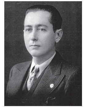
Juan de Dios Bátiz.