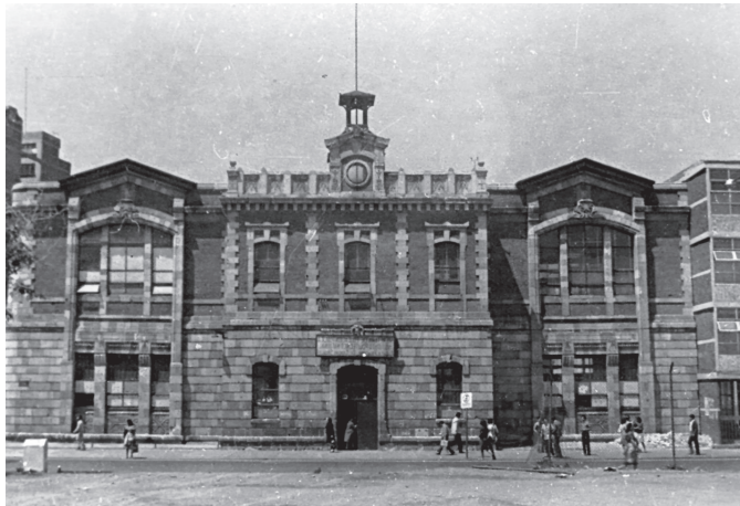
Escuela Superior de Comercio y Administración, ESCA.

La educación técnica se impulsó a partir del nacimiento del México independiente, a pesar de que el siglo XIX se distinguió por la turbulencia e inestabilidad reinante en el país ocasionada por revueltas internas, intervenciones militares de naciones extranjeras, pérdida de territorio y de soberanía durante varios años. No obstante, existieron grandes hombres que promovieron el establecimiento de escuelas para que los jóvenes cursaran carreras técnicas, tan necesarias para el progreso de la nación.