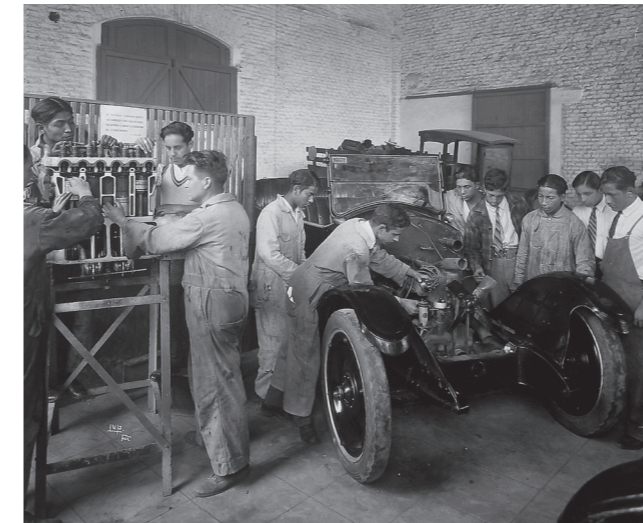
Taller de automóviles.