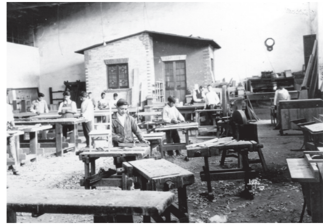
Escuela Técnica de Maestros Constructores.

Algunos centros de educación aparecieron con estas características, siendo importantes para el IPN, el creado en 1915 por Venustiano Carranza, al transformarse la Escuela de Artes y Oficios en la Escuela Práctica de Ingenieros Mecánicos y Electricistas (EPIME), actual Escuela Superior de Ingeniería Mecánica y Eléctrica (ESIME), y los formados durante la presidencia de Álvaro Obregón: en 1922, la Escuela Técnica de Maestros Constructores (actual Escuela Superior de Ingeniería y Arquitectura, ESIA) y, en 1924, el Instituto Técnico Industrial, el cual dio origen a los Centros de Estudios Científicos y Tecnológicos (CECyT) “Gonzalo Vázquez Vela” y “Wilfrido Massieu”. En la presidencia de Abelardo Rodríguez, en 1933, se estructuraron dos escuelas federales de la industria textil, una en Río Blanco, Veracruz, y la otra en el Distrito Federal (actual Escuela Superior de Ingeniería Textil, ESIT). En 1934 nace la Escuela de Bacteriología (hoy Escuela Nacional de Ciencias Biológicas, ENCB) dentro de la Universidad Gabino Barreda, con el impulso de Vicente Lombardo Toledano.