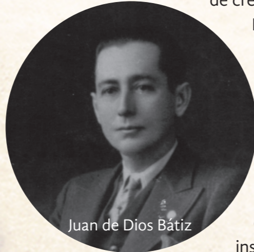
Juan de Dios Bátiz

de la Escuela Politécnica: el primero, referente a la construcción y adaptación de los edificios; y el segundo, relacionado con el estudio de los programas de enseñanza. Sin embargo, se hizo evidente que la creación de la Escuela Politécnica superaba el potencial del personal directivo y técnico del DETIC, lo que llevó a Gonzalo Vázquez Vela, secretario de Educación Pública a ordenar la integración del Consejo Técnico de la Escuela Politécnica para lograr mayor efectividad en los trabajos de creación de la nueva institución.