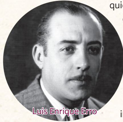
Luis Enrique Erro

La responsabilidad directa del proyecto de la entonces denominada Escuela Politécnica -nombre que evolucionó de la Escuela Politécnica Nacional formada en 1932 por el licenciado Narciso Bassols, secretario de Educación Pública y Luis Enrique Erro, jefe del Departamento de Enseñanza Técnica, Industrial y Comercial (DETIC)- quedó en manos del ingeniero Juan de Dios Bátiz,