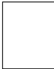
CÓNYUGE (PADRE, MADRE)