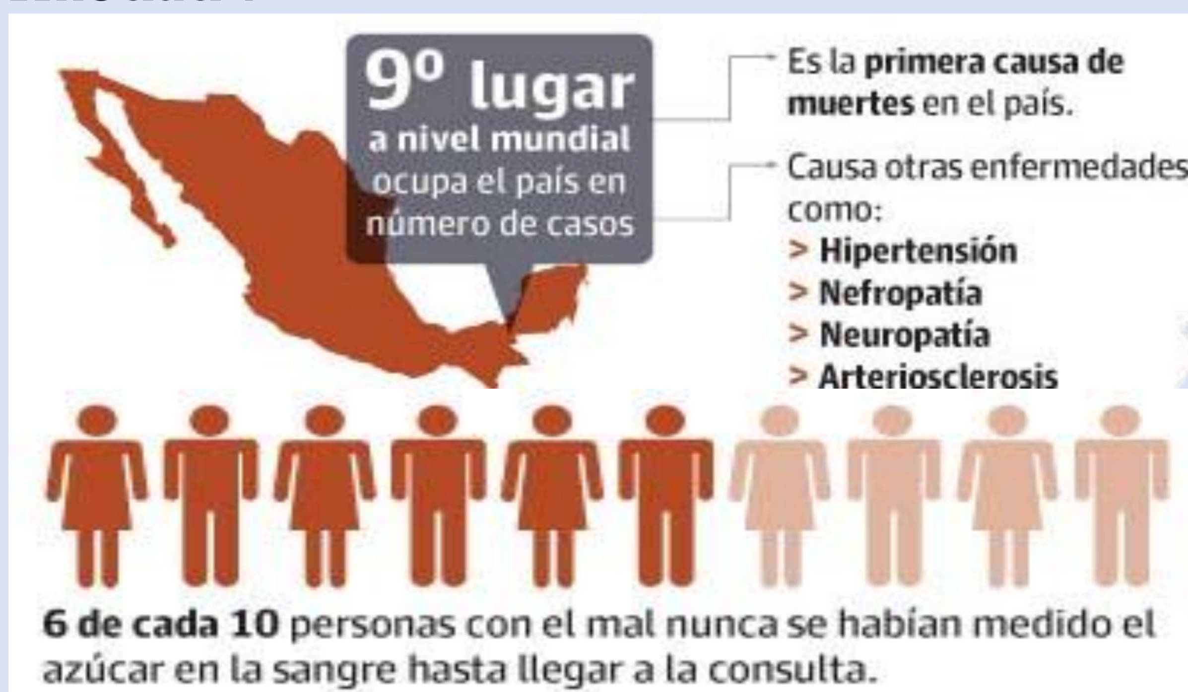
ENSUT. 2016 panorama de la Diabetes Mellitus en México.

Según la encuesta nacional en salud, 10 millones de habitantes están diagnosticados con la enfermedad 2 .