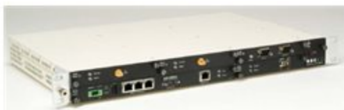
28 Equipos Aviat modelo Eclipse

Fortalecer el intercambio de información entre las diferentes unidades académicas del área metropolitana a través de la Red Institucional con los servicios de voz, datos y video.