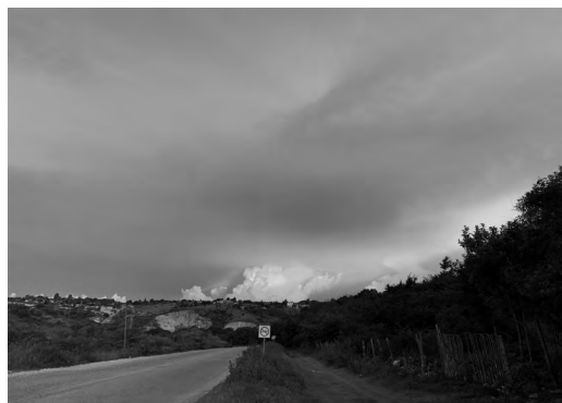
Imagen 1: Rumbo a Ceiba en la urbe marginal de Comitán Chiapas.

En lugar de físicas, las citas de los colectivos comenzaron a hacerse por medio de plataformas virtuales. El aire estaba mezclado con un olor a incertidumbre. En las llamadas se escuchaban preocupaciones, temores, angustias por no saber el verdadero significado del virus y la implicación de un encierro. Las primeras reuniones lle-