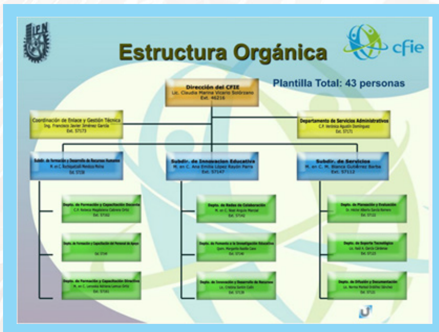
Figura 2. Organigrama del CFIE en diciembre del 2005.

esenciales reflejados en su nombre: un modelo de formación y otro de innovación educativa. Sin embargo, esta visión se amplió para integrar también un modelo de investigación, uno de administración del conocimiento y un modelo de evaluación de la calidad (véase la figura 3).