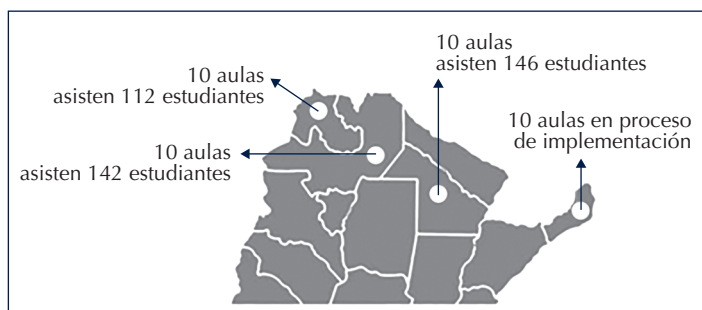
Mapa 2. Secundarias de zonas rurales favorecidas por entornos virtuales.