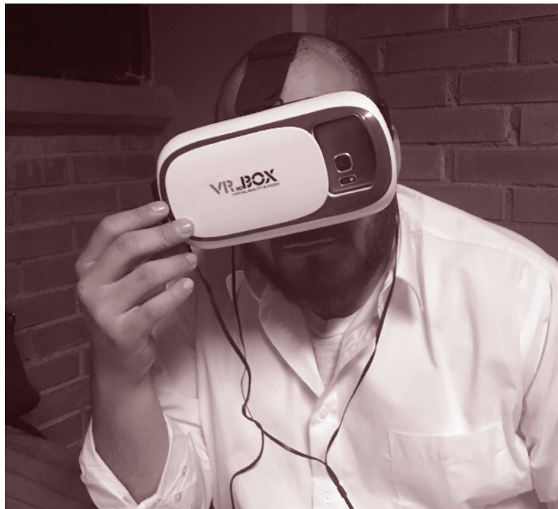
Fotografía 3. Presentación del proyecto de RV con uso de lentes.

La tercera etapa consistió en la presentación del aparato o sistema, mediante el uso de los lentes de RV fabricados o adquiridos por ellos. Las presentaciones tuvieron una duración aproximada de 5 a 10 minutos; fueron expuestas al profesor y al menos a tres compañeros (coevaluación). Esta última parte fue evaluada mediante una escala estimativa, compuesta por seis dimensiones o indicadores a evaluar, así como un puntaje determinado por el nivel de alcance hacia el proyecto (fotografía 3).