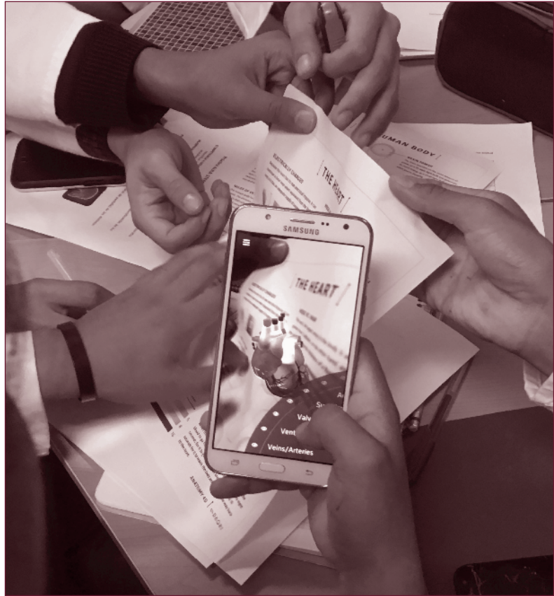
Fotografía 1. Uso de triggers o marcadores impresos para práctica de planimetría del corazón humano.