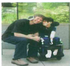
Personas con discapacidad múltiple

Son personas portadoras de una disfunción mental, que presentan deterioro de la funcionalidad y el comportamiento y que es directamente proporcional a la severidad y cronicidad de dicha disfunción. Las discapacidades mentales son alteraciones o deficiencias en el sistema neuronal que aunado a una sucesión de hechos que la persona no puede manejar, detonan una situación alterada de la realidad.