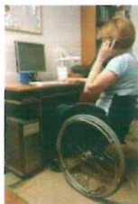
Personas con discapacidad física, neuromotora o motriz.

La Convención define; que "las personas con discapacidad incluyen a aquellas que tengan deficiencias físicas, mentales, intelectuales o sensoriales a largo plazo que, al interactuar con diversas barreras, puedan impedir su participación plena y efectiva en la sociedad, en igualdad de condiciones con las demás.