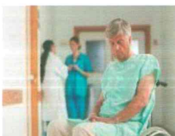
Persona con discapacidad mental o psicosocial

Es la dificultad en ejecutar actividades, por ejemplo, caminar o comer.