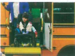
Personas con discapacidad intelectual

Son todas las personas que tienen dificultad para moverse, caminar, mantener ciertas posturas o para desarrollar habilidades como sostener objetos. Estas dificultades pueden solucionarse a través de la utilización de ayudas técnicas, prótesis u órtesis.