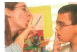
Personas con discapacidad auditiva

Son personas que presentan una deficiencia del sistema de la visión, las estructuras y funciones asociadas con él. Es una alteración de la agudeza visual, campo visual, motilidad ocular, visión de los colores o profundidad, que determinan una deficiencia de la agudeza visual, y se clasifica de acuerdo a su grado.