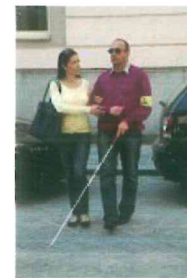
Personas con discapacidad visual o baja visión

Son problemas que involucran cualquier área de la vida, por ejemplo, ser discriminados en el empleo o en el transporte.