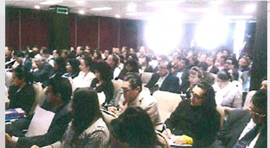
Personal que asistió al curso de transparencia