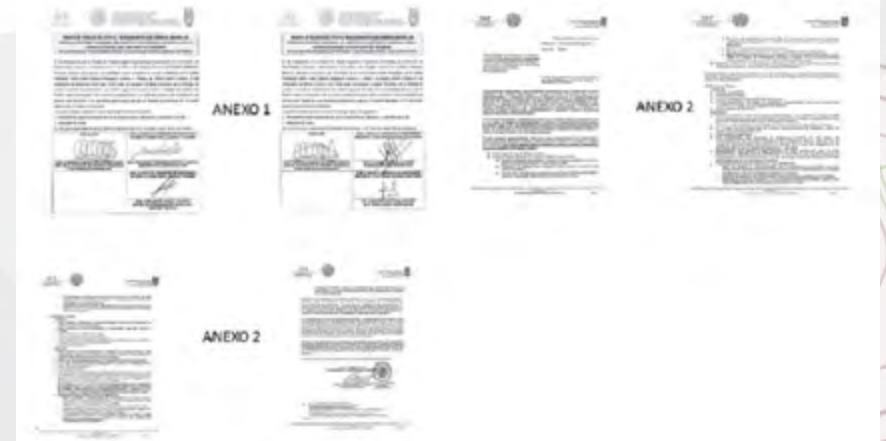
Anexos 1-2-3 espacios físicos

C) Mediante oficio AG-01-15/1300 el Abogado General del Instituto Politécnico Nacional, Maestro David Cuevas García, instruyó a los Directores, Directores Interinos y Maestros Decanos autorizados para asumir la Dirección de las Unidades Académicas del Instituto, para que el Acta a que se refiere el numeral 6.1.1 de los "Lineamientos para el otorgamiento o revocación de permisos a terceros para el uso, aprovechamiento o explotación temporal de espacios físicos en el Instituto Politécnico Nacional", incluya la información mínima enlistada en dicho oficio y adicionalmente se les solicitó confirmen que las personas físicas y morales que resulten seleccionadas por el Consejo Técnico Consultivo Escolar o, en su caso, el Colegio de Profesores para usar un espacio físico presenten la documentación legal y administrativa citada en ese oficio. Anexo 2.