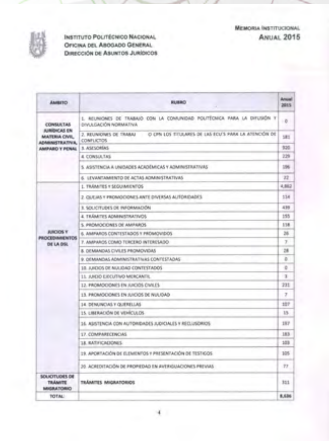
Tabla consultas jurídicas en materia civil, administrativa, amparo y penal

En ese orden y, en apego a la normatividad politécnica y a la que resulta aplicable, esta Dirección contribuye al cumplimiento de los objetivos establecidos por la normatividad institucional a la Oficina del Abogado General programados por esta Dirección de Asuntos Jurídicos, acciones y representaciones que forman parte del acervo de la memoria institucional de la anualidad 2015 de esta Casa de Estudios.