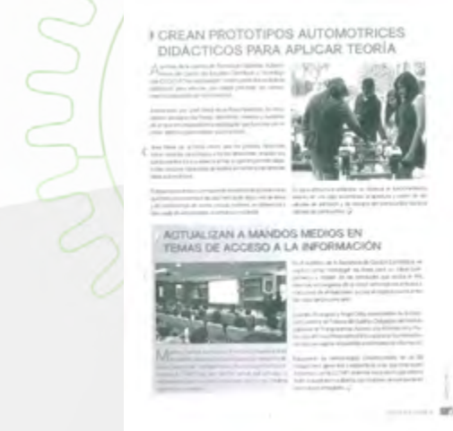
Curso en Materia de Transparencia

Cabe señalar que dicho curso se transmitió por videoconferencia y streaming y, se contó con la asistencia de 143 personas presenciales y 43 virtuales