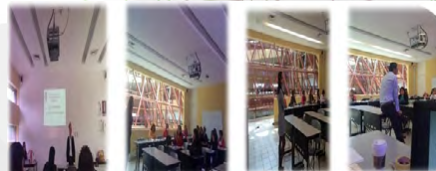
CURSO GENERALIDADES DE LA ADMINISTRACIÓN PÚBLICA

Respecto a la capacitación a los mandos medios y cuerpos directivos del Instituto Politécnico Nacional, esta Dirección de Asuntos Jurídicos dependiente de la oficina del Abogado General impartió un curso denominado “Generalidades de la Administración Pública” en el Centro General de Formación e Innovación Educativa “CGFIE” los días 9, 16, 23 y 30 de julio del año 2015, como se muestra con las siguientes fotografías: