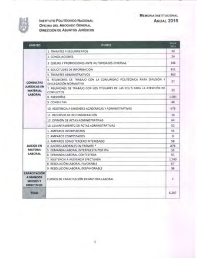
Tabla de consultas jurídicas en materia laboral y juicios en materia laboral

En esta materia, se efectuaron un total de 6,207 acciones de seguimiento y representación en los asuntos laborales, correspondientes a los rubros arriba indicados, de los cuales cabe hacer mención que el sentido de los Laudos, se emite de acuerdo a los criterios del Tribunal Federal de Conciliación y Arbitraje, de los cuales se obtuvo en el año 2015 un incremento favorable en el número de fallos sin responsabilidad laboral y económica a esta Casa de Estudios, como se visualiza en el cuadro en materia de juicios.