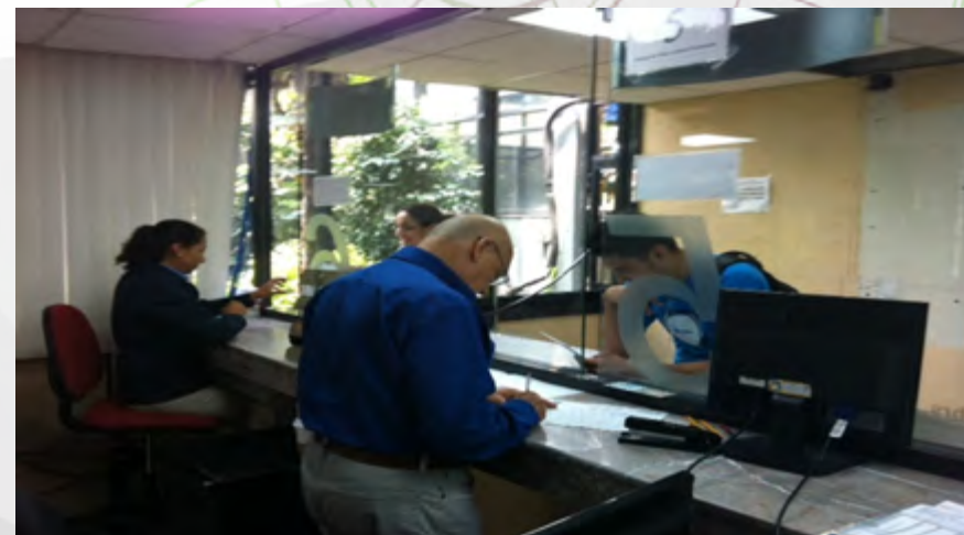
Documentos probatorios de escolaridad.

Se realizó la emisión de 76,834 documentos probatorios de escolaridad, certificados, cartas de pasante y títulos a los alumnos del Instituto Politécnico Nacional de los Niveles Medio Superior y Superior y de planteles particulares con RVOE, otorgado por el Instituto.