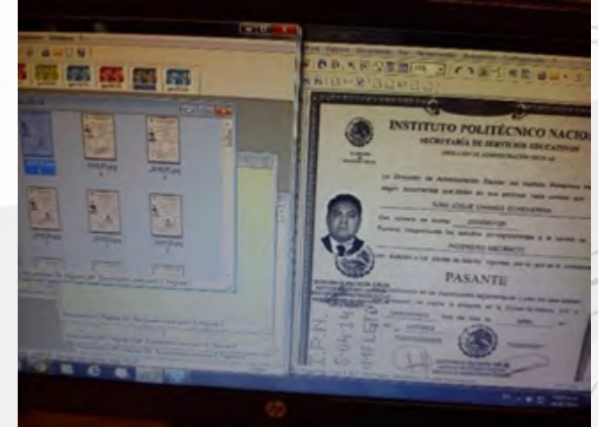
Digitalización de expedientes 2

Se realizó la digitalización de 22,975 expedientes escolares de alumnos de nuevo ingreso de la modalidad escolarizada y no escolarizada en el Nivel Medio Superior y Nivel Superior.