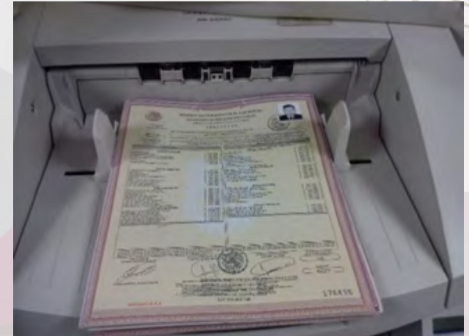
Digitalización de expediente