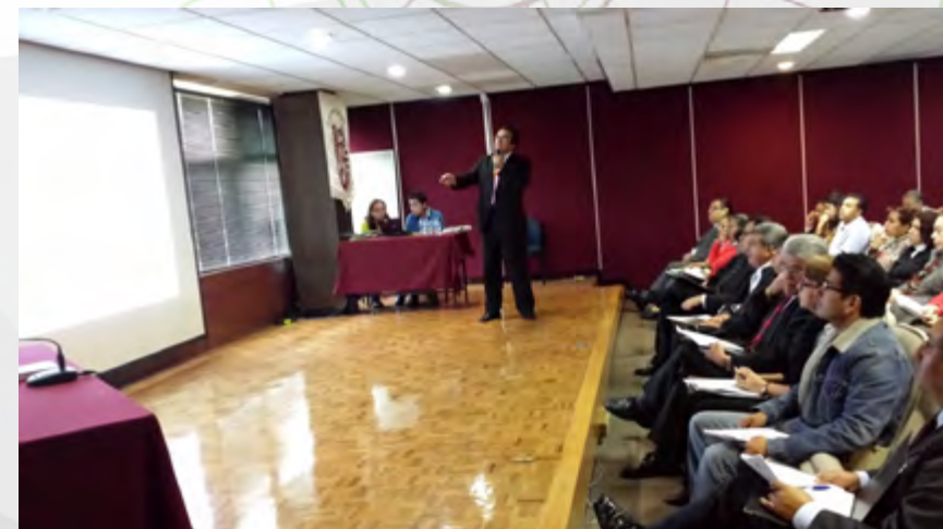
Aplicación de Evaluación del Desempeño 2015

Durante los meses de enero y febrero se aplicó la Evaluación del Desempeño 2015 a 129 Servidores Públicos de Carrera Titulares.