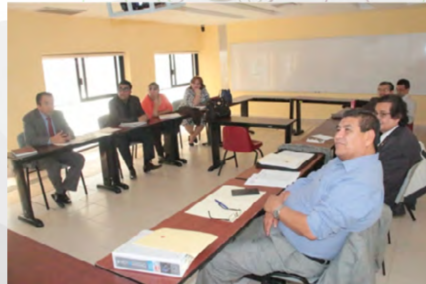
Programa Extraordinario de Basificación de Interinos.