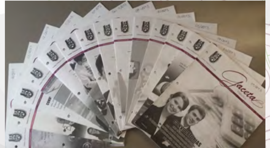
Convocatorias SPC publicadas en la Gaceta Politécnica

En cuanto a los 22 Servidores Públicos que ocuparon un puesto al amparo del Art. 34 de la Ley del Servicio Profesional de Carrera, el 41% de ellos se determinaron ganadores.