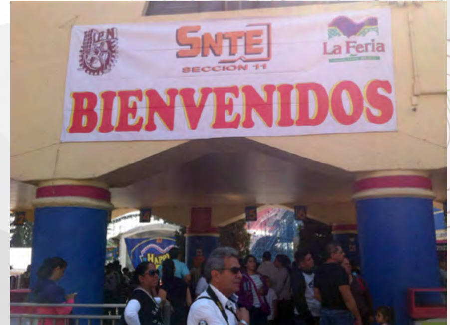
Evento Magno Conmemorativo del Día del Niño en “La Feria de Chapultepec” para los hijos del Personal de Apoyo y Asistencia a la Educación.

Derivado de los Acuerdos que suscriben las representaciones del Instituto Politécnico Nacional y la Sección 11 del Sindicato Nacional de Trabajadores de la Educación, (Prestaciones Económicas y Sociales 2013-2015 del Personal de Apoyo y Asistencia a la Educación), se llevó a cabo el Evento Magno Conmemorativo del Día del Niño en “La Feria de Chapultepec” para los hijos del PAAE, en la cual se contó con la asistencia de 7,000 trabajadores. En dicho evento se llevó a cabo la rifa (por parte de la Representación Sindical) entre los asistentes, de 276 bicicletas y 300 balones para fútbol soccer.