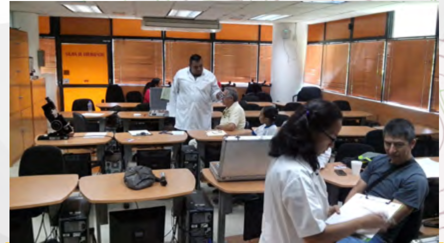
Prestación de anteojos con el apoyo del CICS Sto. Tomás.