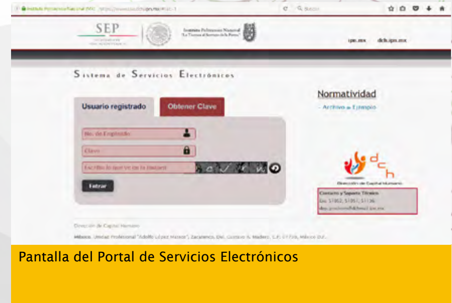
Pantalla del Portal de Servicios Electrónicos

Con la finalidad de reducir el uso del papel en cuanto a la emisión de comprobantes de nómina, se comenzó el diseño del Portal de Servicios Electrónicos el cual en una primera etapa permitirá a los empleados descargar sus comprobantes de nómina personalizados con imagen institucional y que cumpla a la vez de Comprobante Fiscal Digital por Internet (CFDI), a fin de año ya se había concluido con el portal de acceso y la primera versión del CFDI institucional para el visto bueno de la División de Remuneraciones.