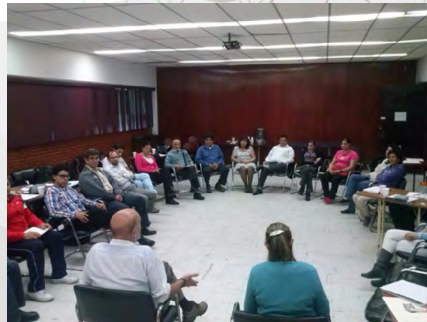
Formación de instructores CECyT No. 6