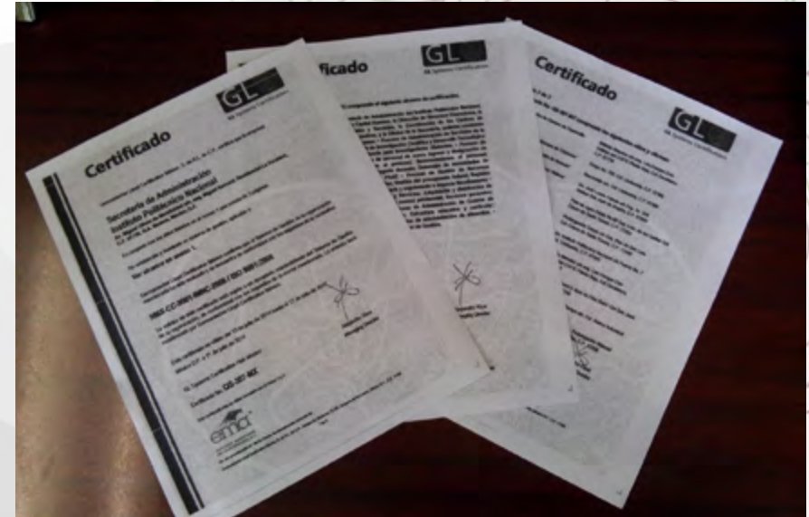
Certificado Sistema de Gestión de la Calidad SAD/DCH

Asimismo, ha propiciado el logro de un mejor clima laboral y una mayor conciencia en el personal respecto a la importancia de documentar y medir el desarrollo del quehacer.