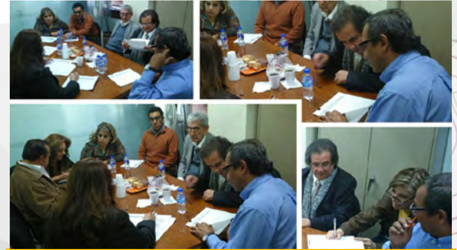
Reuniones con la Comisión Mixta Paritaria IPN - Comisión Ejecutiva del SNTE Sección 60 de Incremento de Horas.