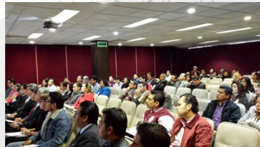
Capacitación y Certificación del Servicio Profesional de Carrera