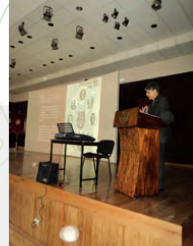
xv aniversario CICS

Dar a conocer el pensamiento y filosofía del Instituto Politécnico Nacional es un objetivo que se logra alcanzar mediante la realización de conferencias de Identidad Politécnica, que se ejecutan durante todo el año. Esta función es desempeñada por el Presidente del Decanato, por los integrantes del Departamento de Investigación Histórica y por todos y cada uno de los Maestros Decanos del IPN.