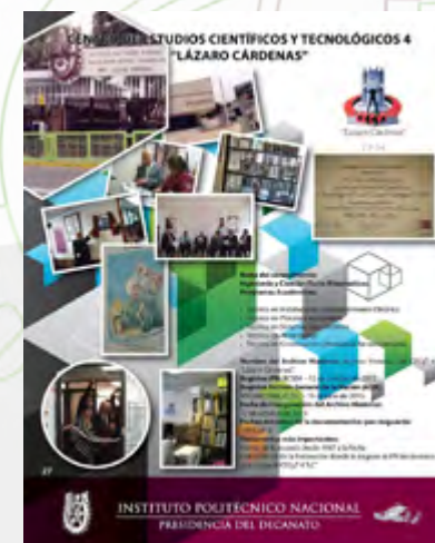
Registro Archivo histórico

Un Archivo Histórico es el espacio donde se resguarda debida y correctamente el patrimonio histórico documental de dependencias públicas y privadas; se vigila sea preservado en las condiciones adecuadas que eviten su destrucción, y se propicia su consulta a los investigadores. Adicional a todas estas actividades se mantiene una constante comunicación y participación en cuanto a normatividad y actualizaciones con el Archivo General de la Nación, quien es nuestro órgano rector en materia de Archivos. Durante este año se registró un archivo histórico de la Escuela: CECyT 4 Lázaro Cárdenas; logrando así un total de 26 Archivos Históricos debidamente formados y registrados.