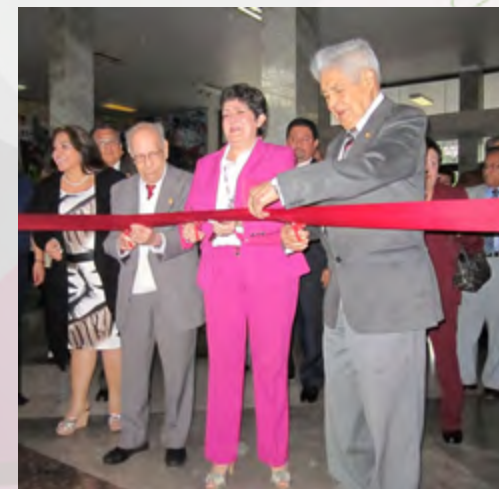
Inauguración xv aniversario