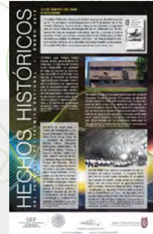
publicación Hechos históricos enero

Otra forma de divulgación y difusión de la historia del Instituto Politécnico Nacional, se realiza a través de impresos como los son, diversos carteles de hechos históricos mensuales y especiales; tesoros históricos que son publicados durante el transcurso de todo el año, así como la serie de folletos Historia-Identidad-Difusión.