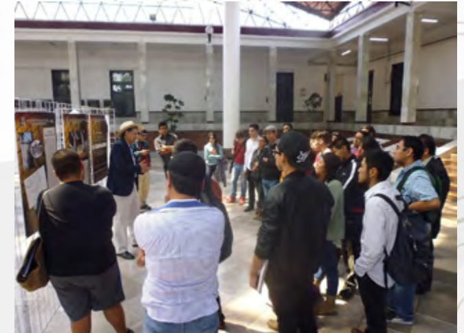
Recorrido visita guiada

En la unidad se atiende al todo el público en general que solicita información de carácter histórico para sus investigaciones de interés particular. Así como también se atiende a usuarios que solicitan visitas guiadas al recinto histórico Juan de Dios Bátiz, con ello plasamos interna y externamente una buena perspectiva de nuestro instituto.