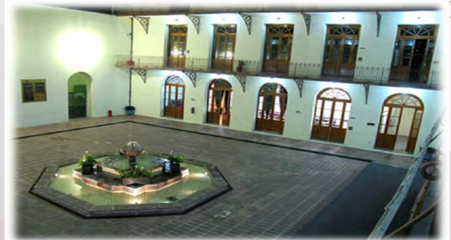
Patio principal del Centro de Educación Continua Ingeniero Eugenio Méndez Docurro.

Cuadro informativo de ingresos captados por diversos conceptos.