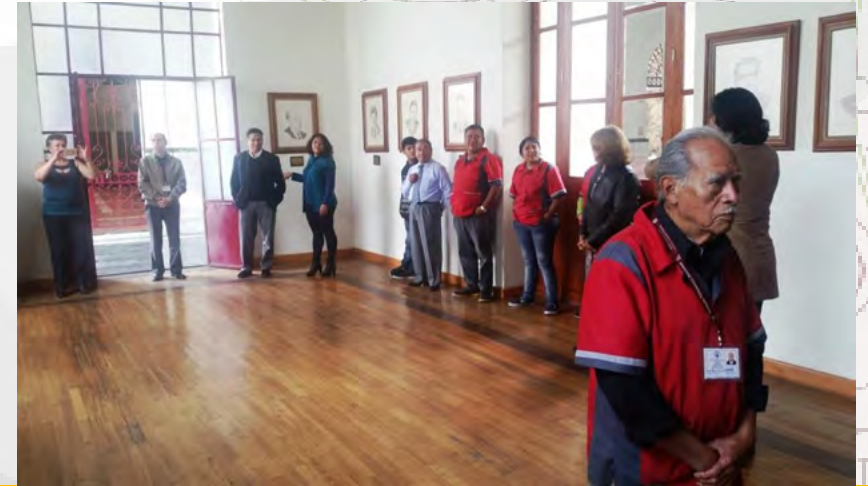
Conferencia relativa a la sensibilización de personas con capacidades diferentes.

Se adecuaron las instalaciones con servicios y espacios accesibles, para personas con alguna discapacidad.