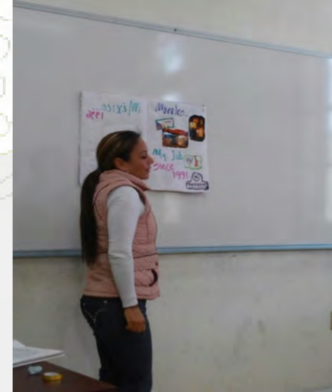
Clase de idiomas.

Renovación del Registro No. DFLE-CELEX021-Act-15 del Programa General de Inglés por Competencias, bajo los parámetros de la Dirección de Formación de Lenguas Extranjeras, así como lo establecido por el Marco Común Europeo de Referencia para las Lenguas, con una vigencia de 4 años (2015-2019).