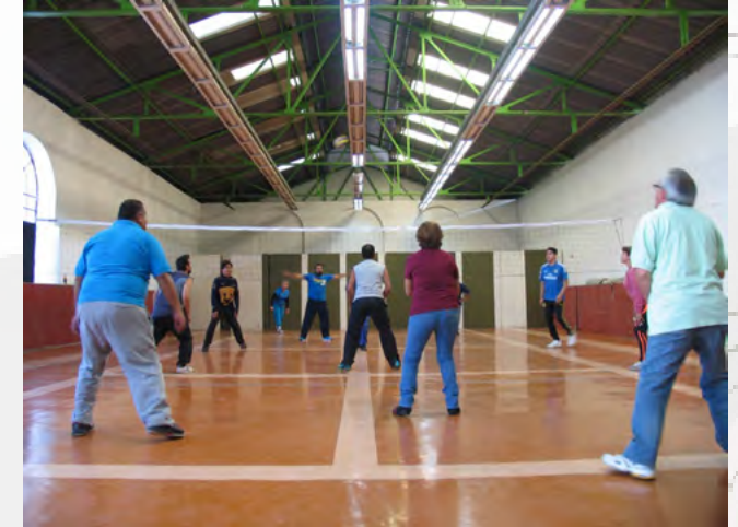
Competencia interna de voleibol.