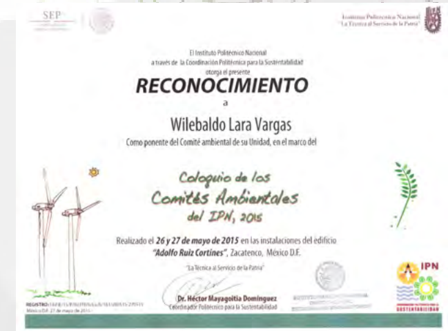
Coloquio de los Comités Ambientales.