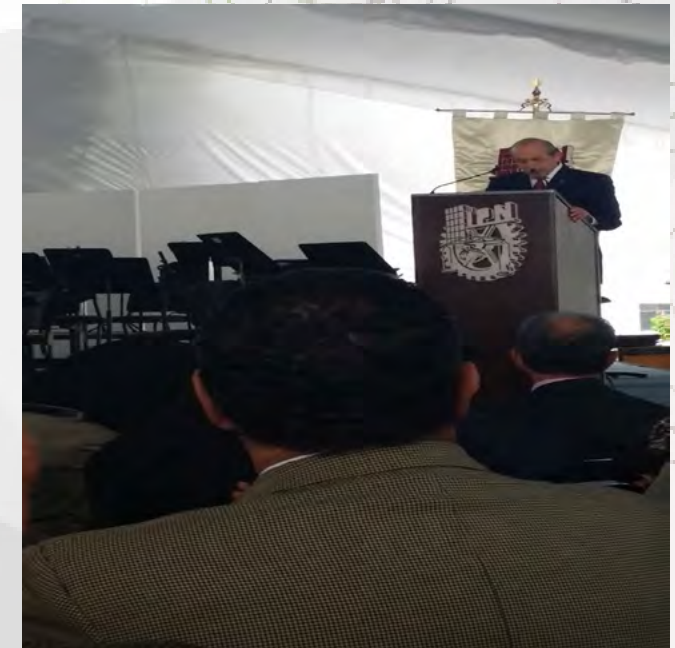
Director General del Instituto Politécnico Nacional en el homenaje Póstumo al Ingeniero Eugenio Méndez Docurro.

XII Congreso Nacional y VIII Congreso Internacional de Innovación Estratégica para el Futuro, organizado por el Centro de Investigaciones Económicas Administrativas y Sociales (CIECAS), entre otros eventos de gran relevancia institucional.