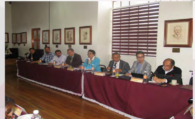
Reunión "Feria de capacitación del servicio profesional de carrera para el Personal de Apoyo y Asistencia a la Educación de la SEP".