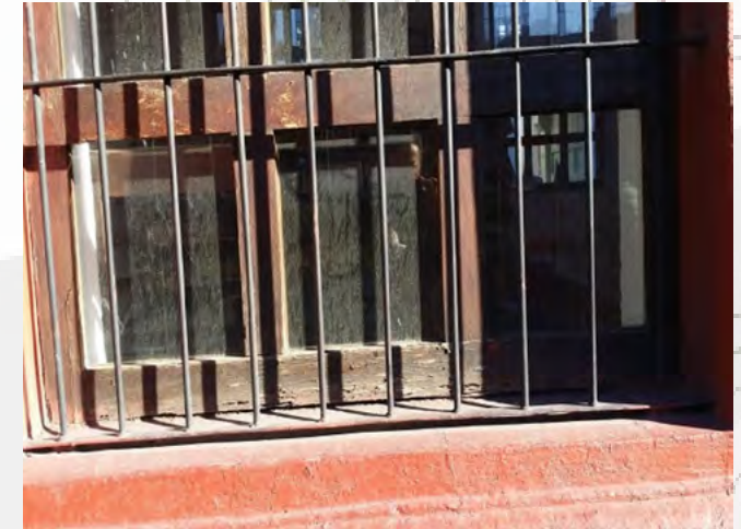
Área sin reparar.