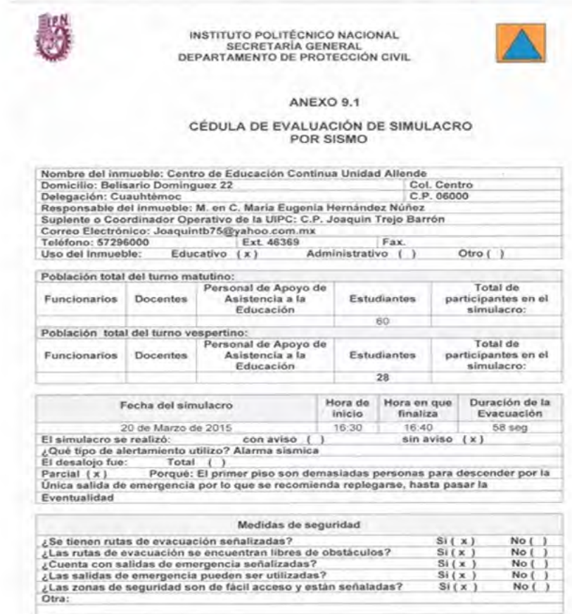
Cédula de evaluación de simulacro por sismo.

Se cumplió en tiempo y forma con el programa de simulacros.