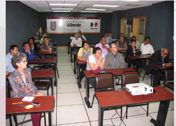
Personal del Centro de Educación Continua Ingeniero Eugenio Méndez Docurro.