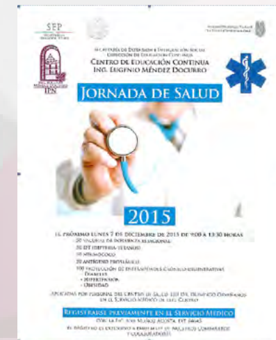
Tríptico "Jornada de Salud"