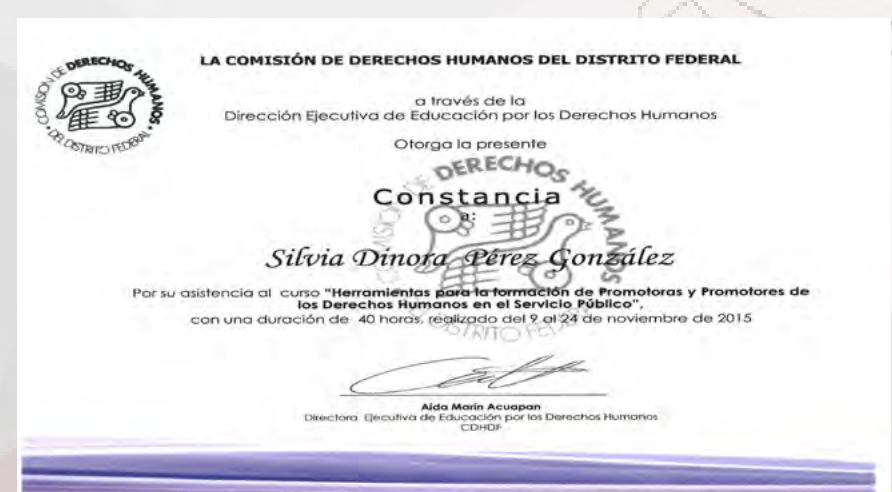
Constancia curso “Herramientas para la formación de Promotoras y Promotores de los Derechos Humanos en el Servicio Público”.