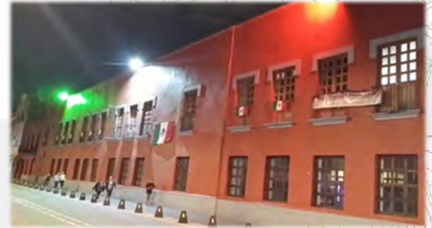
Fachada del Centro de Educación Continua Ingeniero Eugenio Méndez Docurro.

El 30 de septiembre en la Gaceta Extraordinaria 1187 se emitió el acuerdo en donde se aprueba la modificación a la denominación Unidad Allende por el del Centro de Educación Continua Ingeniero Eugenio Méndez Docurro (CECIEMD). El CECIEMD ha destacado su participación en algunos proyectos que inciden a nivel nacional, como la Lotería Nacional para la Asistencia Pública y la Secretaría de Educación Pública, entre otros. Asimismo el Centro ha mantenido un primer lugar por los servicios que ha prestado a la comunidad y a diferentes sectores, da continuidad al compromiso de servicio a la sociedad elevando la calidad y el nivel de vida comunitario, al impartir capacitación y actualización de diferentes temas actuales de manera permanente a lo largo de la vida a la sociedad. Es necesario reconocer que en la Ciudad de México tenemos una gran competencia con diversas Instituciones Educativas de Nivel Superior, así como Unidades Académicas del propio Instituto Politécnico Nacional.