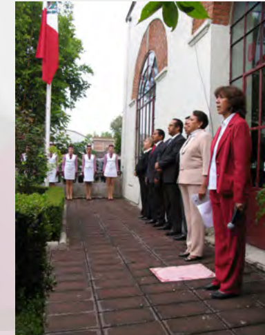
Conmemoración de la Independencia.