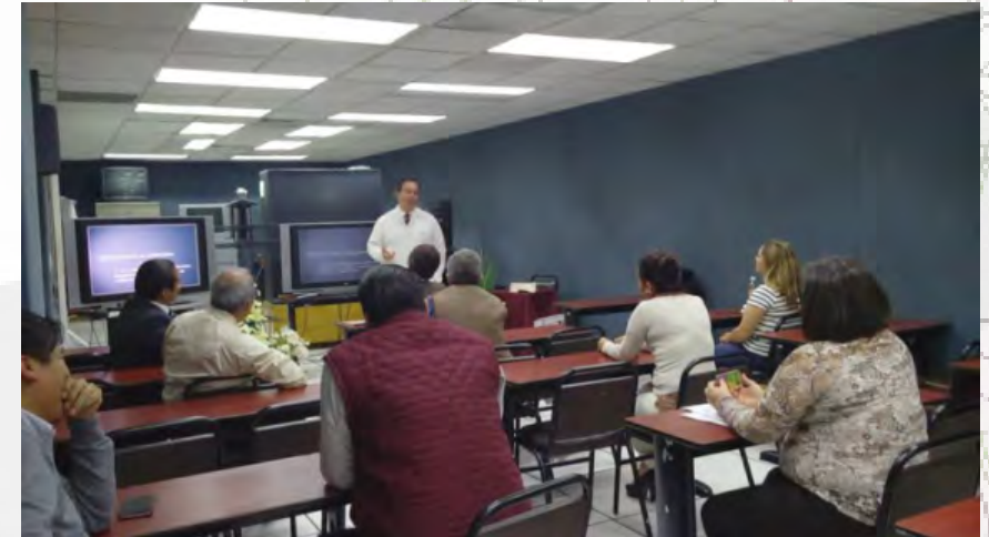
Conferencia "Hipertensión arterial"