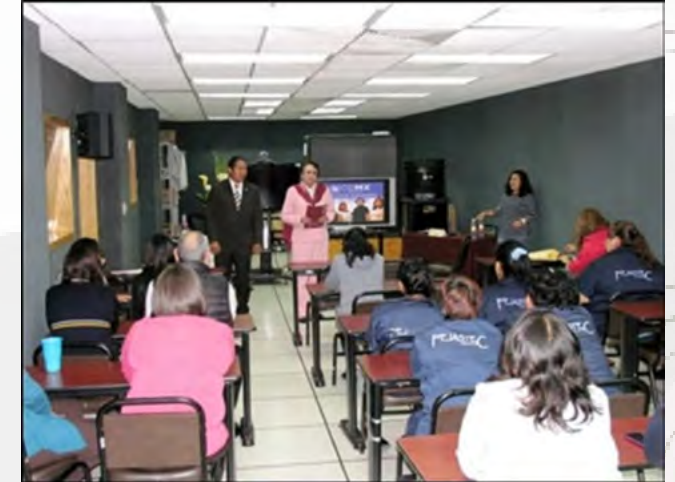
Conferencia “Violencia familiar”.