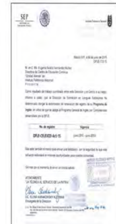
Renovación del registro del Programa de Inglés.

Renovación del Registro No. DFLE-CELEX021-Act-15 del Programa General de Inglés por Competencias, bajo los parámetros de la Dirección de Formación de Lenguas Extranjeras, así como lo establecido por el Marco Común Europeo de Referencia para las Lenguas, con una vigencia de 4 años (2015-2019).