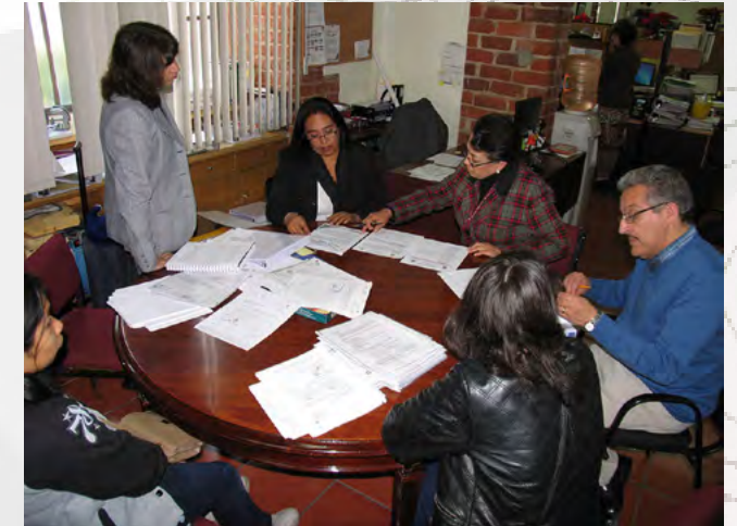
Auditoría de Calidad.

Se dieron pláticas sobre la sensibilización al personal de ambos turnos, enfocadas al Sistema de Gestión de Calidad, así como los procedimientos que se deben seguir para apoyar el proceso sustantivo.