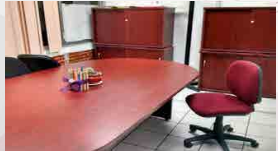
Sala de reunión de Orientación Juvenil.