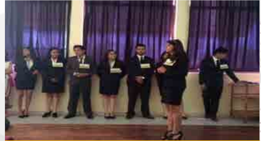
Presentación de Proyecto Aula, grupos de sexto semestre.

Se realizaron dos procesos, uno para el ciclo 2014-2015 “B” y 2015-2016 “A”, donde ejecutaron la actividad los grupos de sextos semestre. Se logró la incorporación a las dinámicas centradas en el estudiante, desarrollo de habilidades, actitudes, conocimientos y trabajo colaborativo tanto entre los alumnos como entre los docentes responsables del mismo. Participaron más de noventa grupos y los resultados fueron satisfactorios en los trabajos integradores, así como la presentación de proyectos.