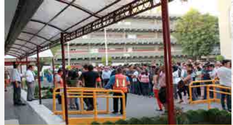
Actividades del programa de protección civil en el Cecyt 13.

Realización de la estructura orgánica de la Unidad Interna de Protección Civil designó a los responsables de las diferentes brigadas, así mismo se determinó a los responsables de cada uno de los edificios que conforman la Unidad Académica. Se elaboró el programa de funciones de cada una de las brigadas, entregándoles a los responsables su folder de funciones y responsabilidades, esto se llevó a cabo en la junta semanal del 1 ro. de diciembre.