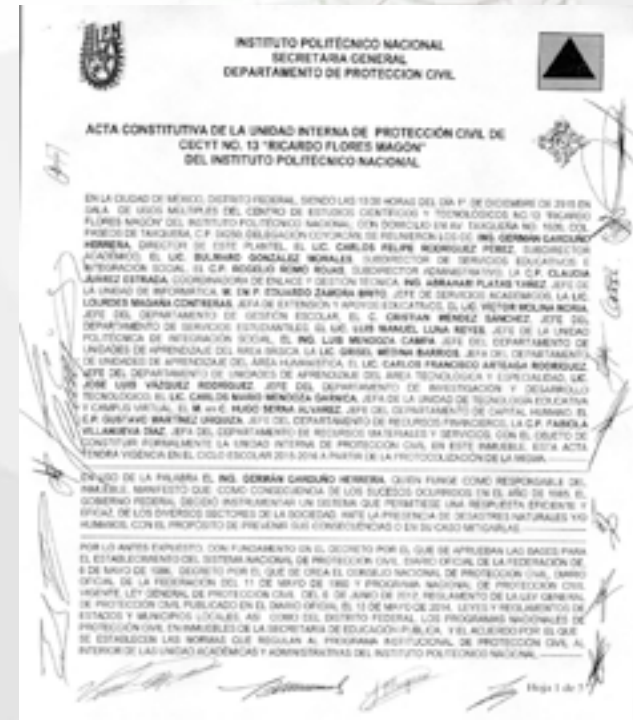
Acta Constitutiva de Protección Civil.

Con base a la estructura organizacional, se elaboró el acta constitutiva de la Unidad Interna de Protección Civil, la cual fue aprobada por el Consejo en las sesión ordinaria el día 1 ro. de diciembre enviándola a Secretaria General el día 4 de diciembre.