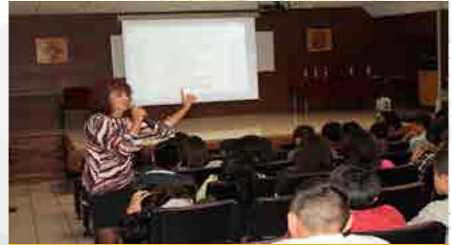
Conferencias a grupos de 4to. y 6to. semestre.

30 de noviembre 16:00 a 17:00 hrs. “Cultura de la denuncia”