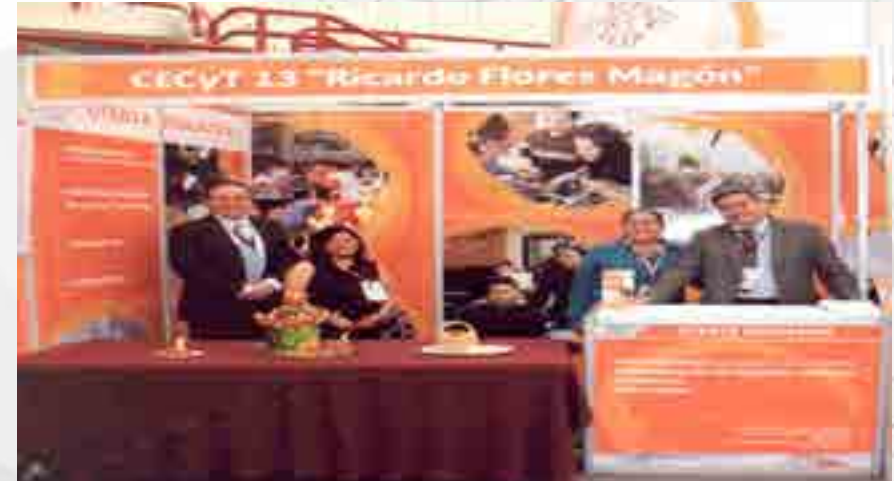
Oferta Educativa a Nivel Medio Superior.