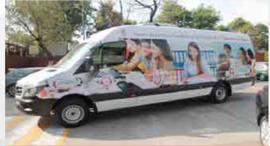
Donación de Fundación Politécnica al Cecyt 13.