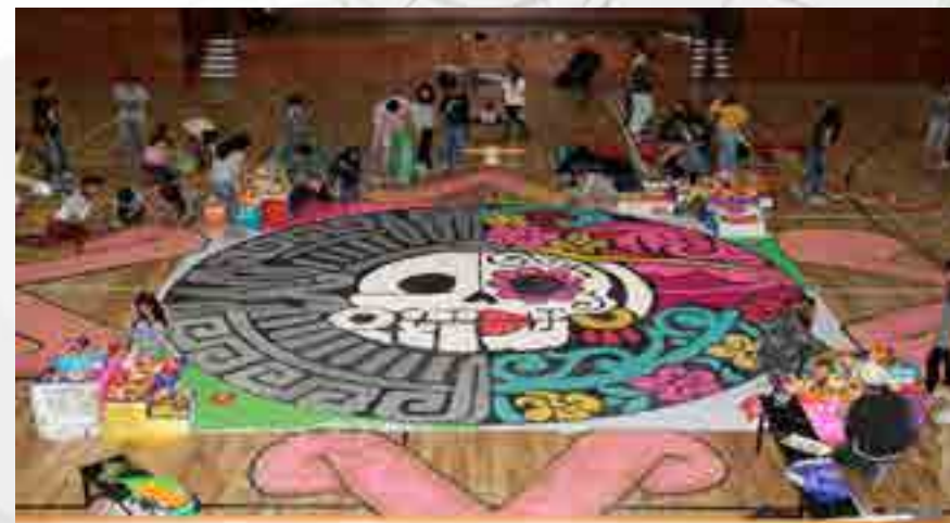
Muestra de día de muertos en el Gimnasio-Auditorio.

Coordinación y apoyo de los trabajos en conjunto con la carrera de Turismo ambos turnos, para fomentar en los alumnos las costumbres mexicanas celebrando el Día de Muertos con un concurso de ofrendas y la elaboración de una catrina.