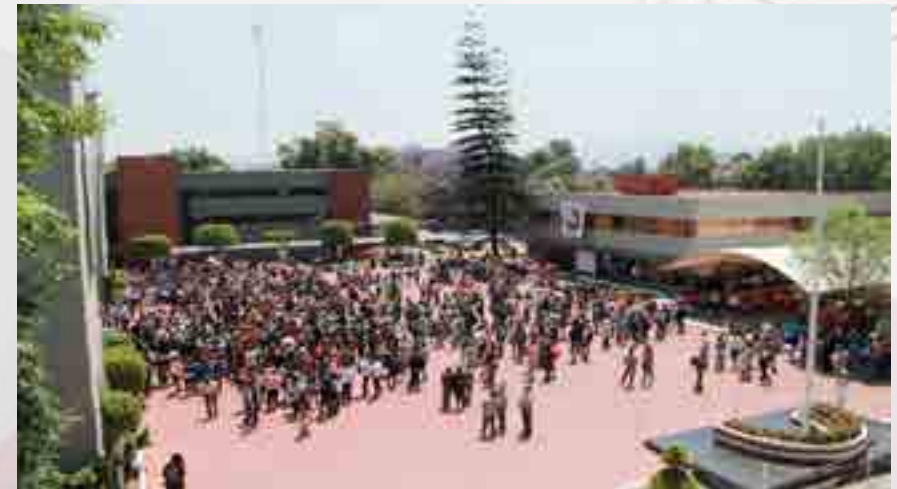
Actividades del programa de protección civil.