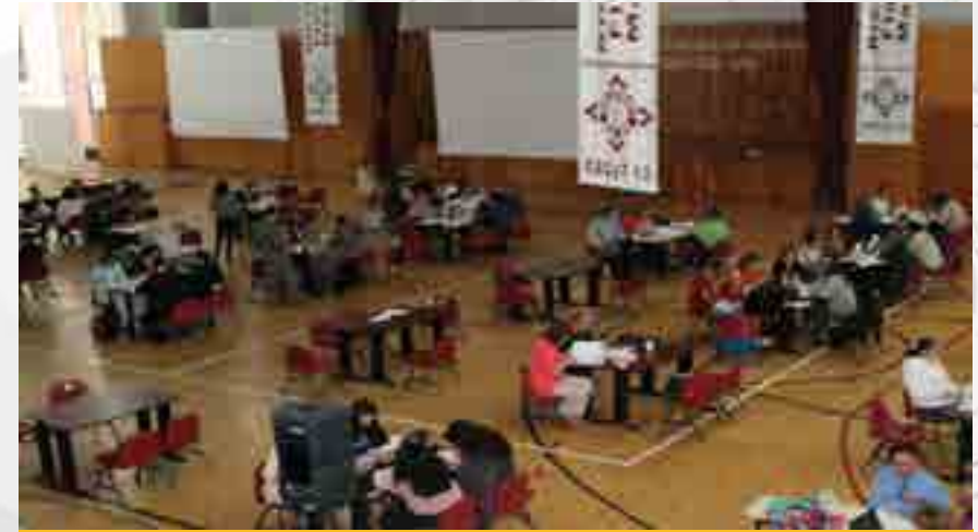
Capacitación y Actualización Docente.