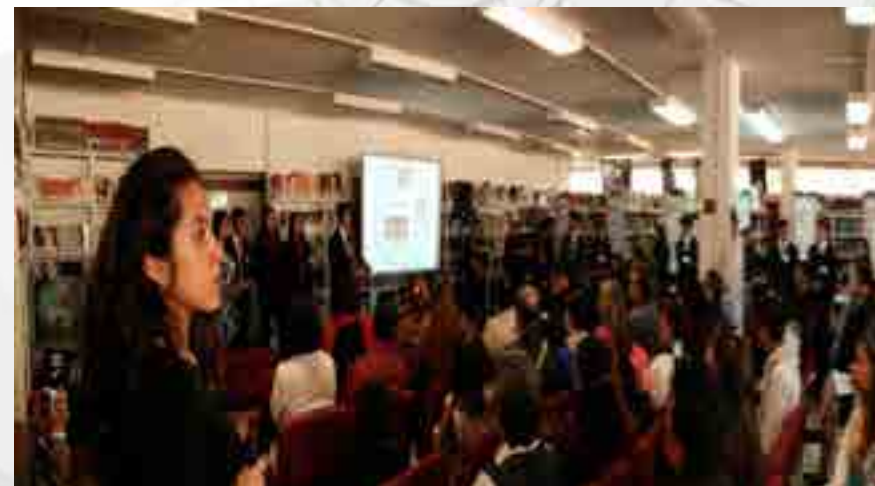
Muestra de Proyecto Aula.

Coordinación de proyecto aula. La afinidad es que el evento se presente de manera innovadora, ordenada y fluida con los maestros y alumnos, en donde el alumno aplicará los conocimientos pedagógicos y cognoscitivos aprendidos a lo largo del semestre.