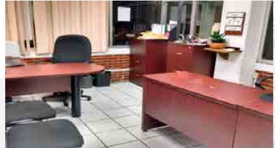
Cubículo de Orientación Juvenil.

Tras una ardua y constante comunicación con Fundación Politécnica, se obtiene la donación de equipo para las aulas de esta unidad académica entre los que destacan butacas, proyectores, scanner, escritorios y mobiliario para el área de orientación.