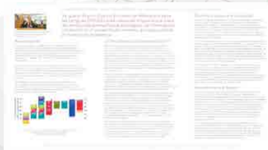
Certificación de alumnos en Lenguas Extranjeras.

Reunión de trabajo de la Academia de Inglés ambos turnos, para gestionar la presentación de la Universidad de Cambridge y saber los beneficios que tienen los programas de certificación para los alumnos que egresan de esta Unidad Académica. Presencia de los Presidentes de Academias de Inglés ambos turnos e integrantes de las academias de Inglés, para que conozcan los beneficios de las certificaciones en los diferentes niveles. Con el personal representativo de Cambridge Assesment , que es la División que sugiere los centros Certificadores dentro de la Ciudad de México.