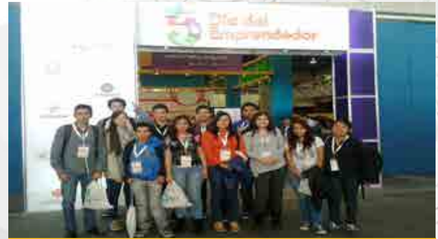
Alumnos Ganadores del Cecyt 13.

Se participó en los concursos de Poliemprende y Prototipos, obteniendo los primeros lugares en ambas categorías del Nivel Medio Superior.