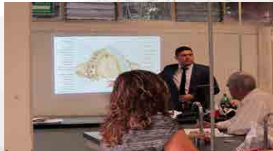
Curso “Prevención de Enfermedades Estomatológicas por el uso de Piercing en Cavidad Oral”.

Se realizó el curso “Prevención de Enfermedades Estomatológicas por el uso de Piercing en Cavidad Oral”, en el Laboratorio de Biología con un total de 10 asistentes acreditados.