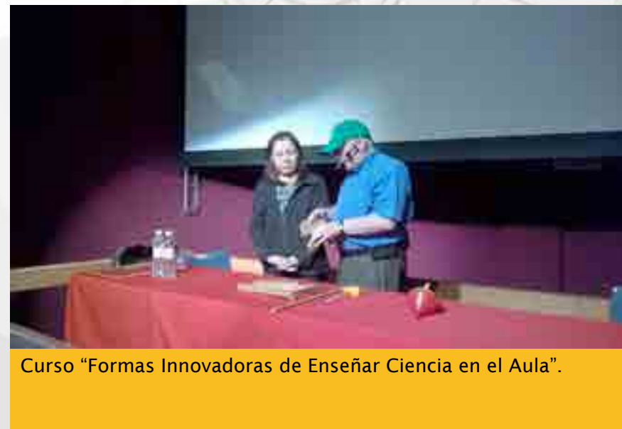
Curso “Formas Innovadoras de Enseñar Ciencia en el Aula”.

Se llevo a cabo el curso “Formas Innovadoras de Enseñar Ciencia en el Aula”. Este taller fue impartido en las instalaciones del CeDiCyT. Se proporcionó transporte de ida y regreso a los docentes participantes. El Taller contó con 28 asistentes acreditados.