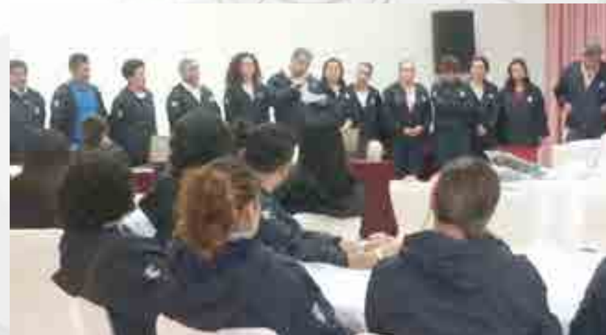
XVII Convención Anual.

El objetivo general fue fortalecer el trabajo académico a través de la participación activa de los docentes, a efecto de elevar el nivel de calidad educativa en el CECyT 8 “Narciso Bassols”. Para lograrlo, se delineó un programa de actividades centradas en hacer relevante las acciones llevadas a cabo por los presidentes de academia. Este evento se integró con la participación de algunos jefes de academia que conforman el CECyT 8 “Narciso Bassols” así como docentes, el total de participantes fue de 73 personas, se llevó a cabo en Silao, Guanajuato.