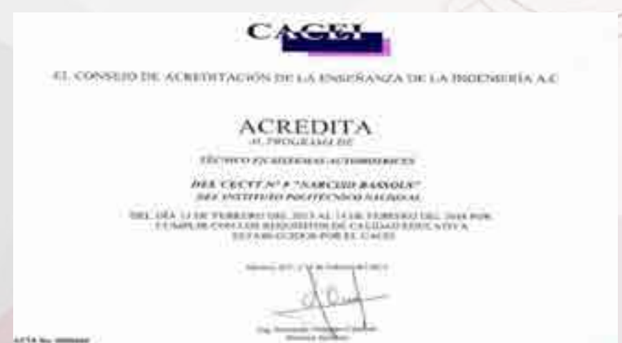
Acreditación de la Carrera de Sistemas Automotrices.