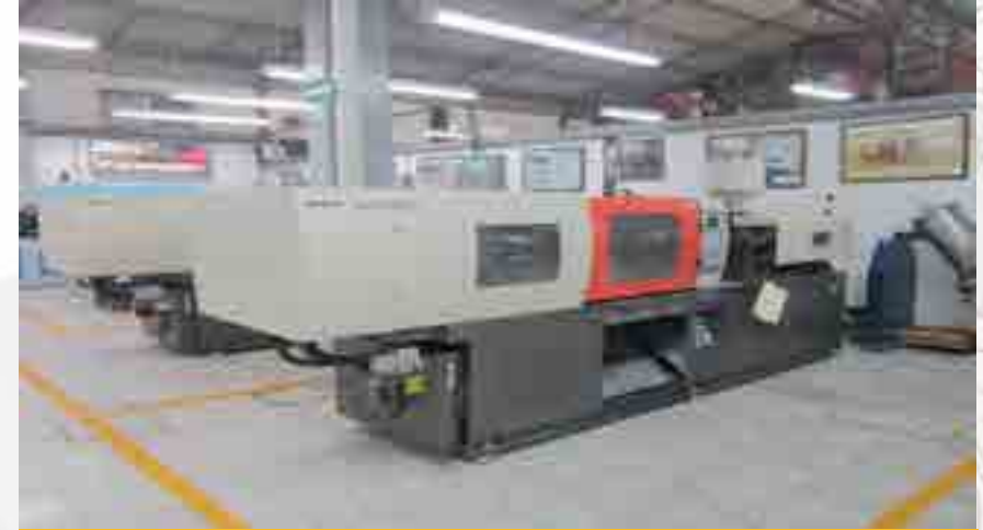
Carrera de plásticos.

La Unidad cuenta con la acreditación del programa académico de la carrera de Técnico en Plásticos que imparte en Modalidad Escolarizada y sus respectivos programas por el Consejo de Acreditación de la Enseñanza de la Ingeniería (CACEI).