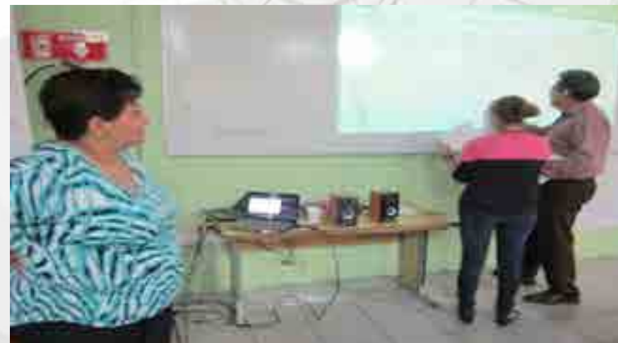
Personal Docente participando en el Curso Taller “Diseño de Reactivos basado en un enfoque por Competencias”.

Se llevo a cabo el Curso Taller “Diseño de Reactivos basado en un enfoque por Competencias.” , en el laboratorio “G” de Computación, con un total de 23 participantes acreditados. Este curso fue impartido por un facilitador externo.