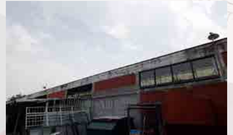
Fachada de patio de servicio.