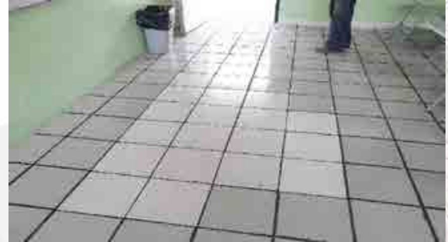
Mantenimiento a pisos de loseta en aulas.

Se realizó revisión a los muebles sanitarios, cambiando piezas en mal estado.