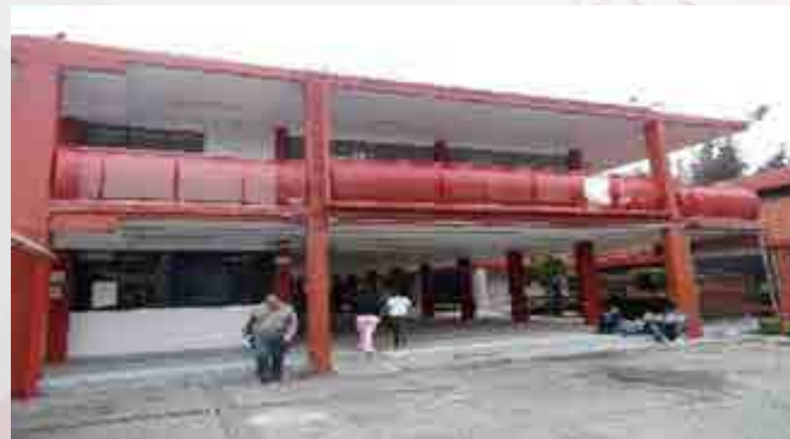
Sustitución de barandal.