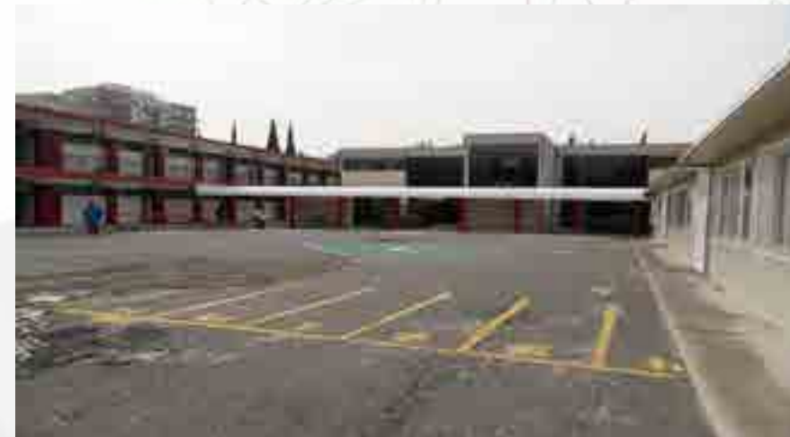
Construcción de andador.

Se construyó un andador metálico en pasillo a la Biblioteca de cuatro bases de concreto armado con postes circulares y largueros metálicos como estructura metálica, con cubierta de policarbonato para protección de intemperie hacia Biblioteca.