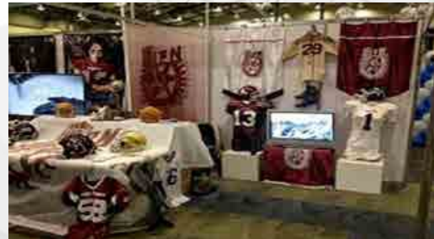
Stand del Instituto Politécnico Nacional.

El Equipo SIOUX del Centro de Estudios Científicos y Tecnológicos (CECyT 8) “Narciso Bassols” participó en la “2da. Expo Futbol Americano en el World Trade Center de la Ciudad de México”. Fue el único equipo invitado de la categoría juvenil en participar en la “2da. Expo Futbol Americano en el World Trade Center de la Ciudad de México”. Donde estuvo presente en el stand del Instituto Politécnico Nacional. Y ahí dió a conocer el Modelo Académico-Deportivo con el que está trabajando.