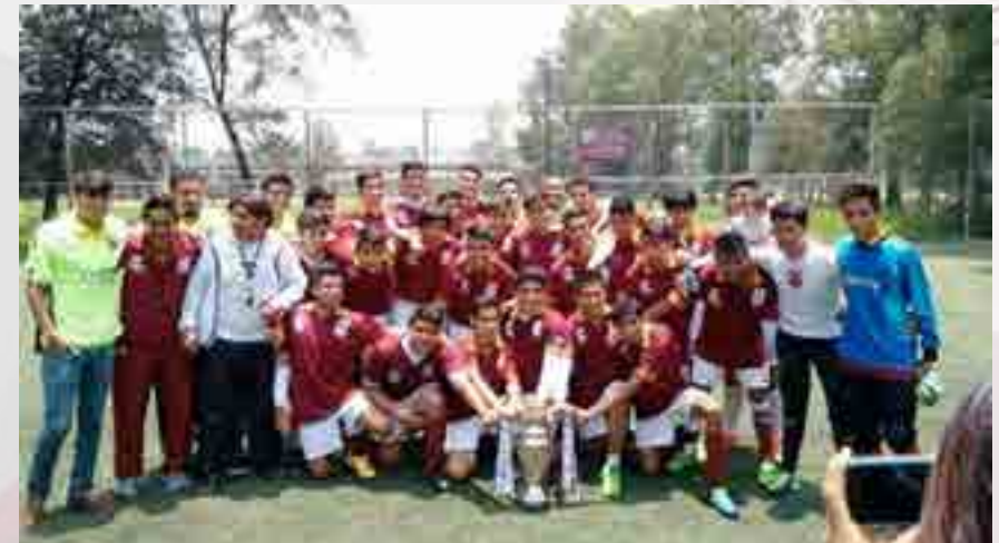
Interpolitécnicos fútbol primer lugar.