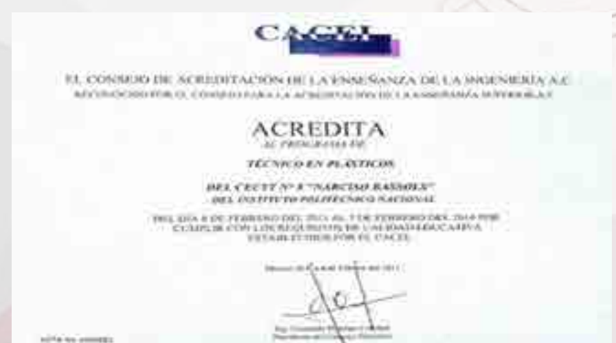
Certificación de la carrera de plásticos.