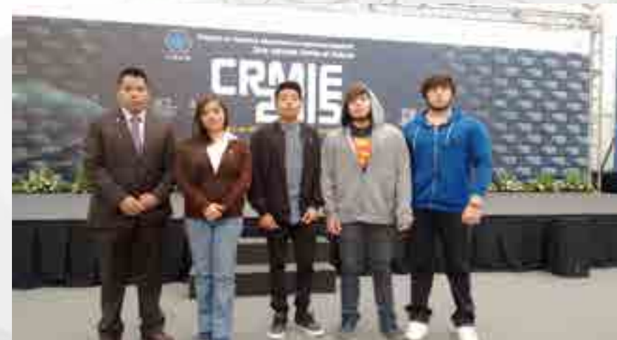
Club de Minirrobótica del CECyT en el Coloquio CRMIE.

Participación en el “Coloquio de Robótica, Mecatrónica e Ingeniería Espacial, una Mirada hacia el Futuro” (CRMIE).