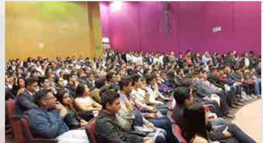
Alumnos en la ceremonia de Entrega de Diplomas.