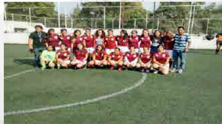
1er. lugar de Fútbol Rápido en la rama femenil.

Se participó en la disciplina de fútbol asociación, fútbol rápido, fútbol 7, en las ramas femenil y varonil. Se llevó a cabo la competencia contra todas las vocacionales formando cuatro grupos, pasando los mejores ocho equipos a la siguiente fase hasta obtener al campeón. Obteniendo el 1er. lugar de Fútbol Rápido en la rama femenil.