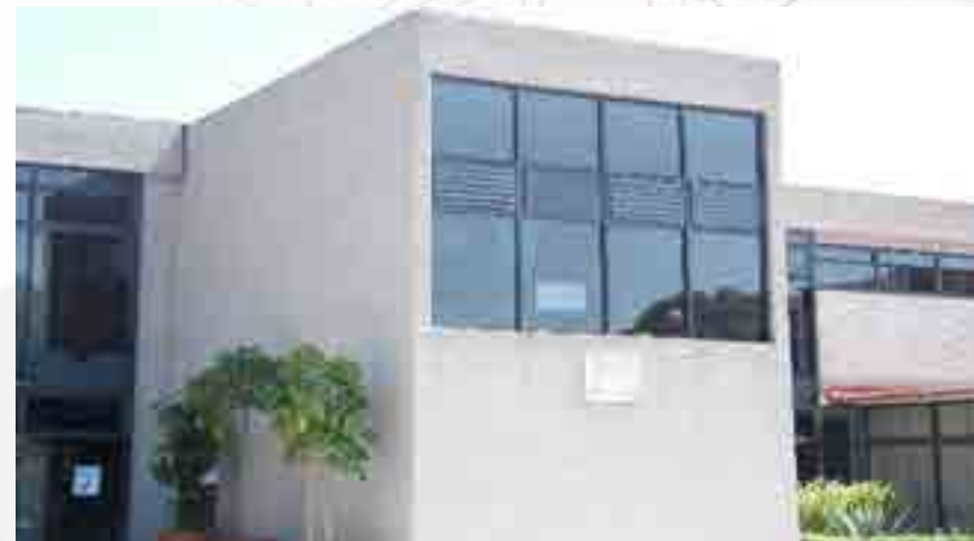
Habilitación de ventanal de edificio de Academias.

Se sustituyeron en el edificio “B” barandales metálicos a base de soleras por barandales de lámina perforada calibre 14 troquel circular con una base estructural, se aplicó pintura esmalte color rojo.