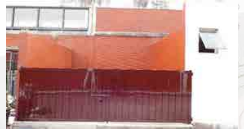
Puerta abatible de doble hoja.

Se reacondicionó el área de almacenamiento temporal de basura. Se levantó un murete y se colocó una puerta abatible de doble hoja; se aplicó pintura vinílica color rojo óxido. Se retiraron ventanas de perfil metálico por aluminio en laboratorios de Química, taller de Plásticos y taller de Máquinas y Herramientas en fachada de patio de servicio. Se retiraron ventanas tubulares de diferentes medidas, formadas por módulos fijos. Se colocó un cancel de aluminio formado por dos hojas abatibles y cristal claro. Se habilitaron ventilas de proyección en cancelería. Se colocaron ventilas de proyección en cancelería de aluminio con brazo de 16” tipo inglés y manija tipo española color duranodic.