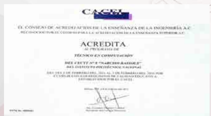
Acreditación carrera de computación.