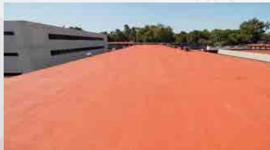
Mantenimiento a impermeabilizante.