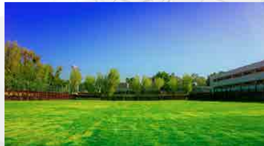
Empastado del campo de fútbol.

Reparación y empastado del campo. Se niveló el campo, se instaló el sistema de riego automatizado y se plantó pasto nuevo.