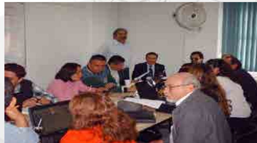
Curso “Metodología para la Elaboración de Secuencias Didácticas en el Nivel Medio Superior”.

Se llevo a cabo el Curso “Metodología para la Elaboración de Secuencias Didácticas en el Nivel Medio Superior”. En el Taller de Mantenimiento Industrial con un total de 32 asistentes acreditados.