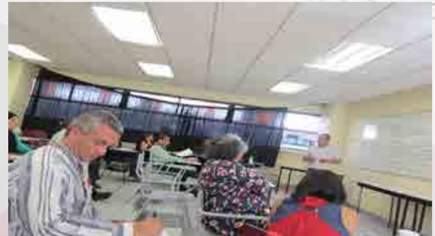
Curso “La intervención del Profesor en el Acompañamiento de sus alumnos” Turno Vespertino.