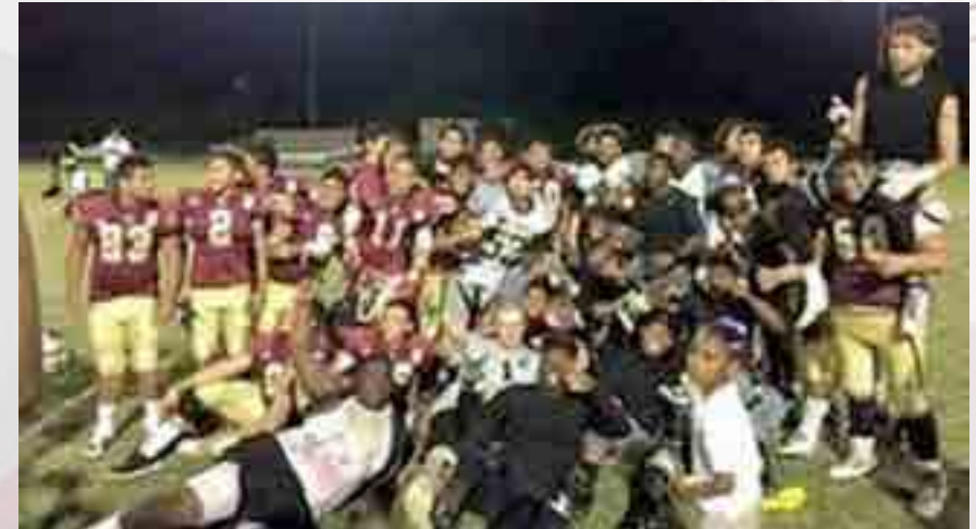
Práctica Constorm Taca.