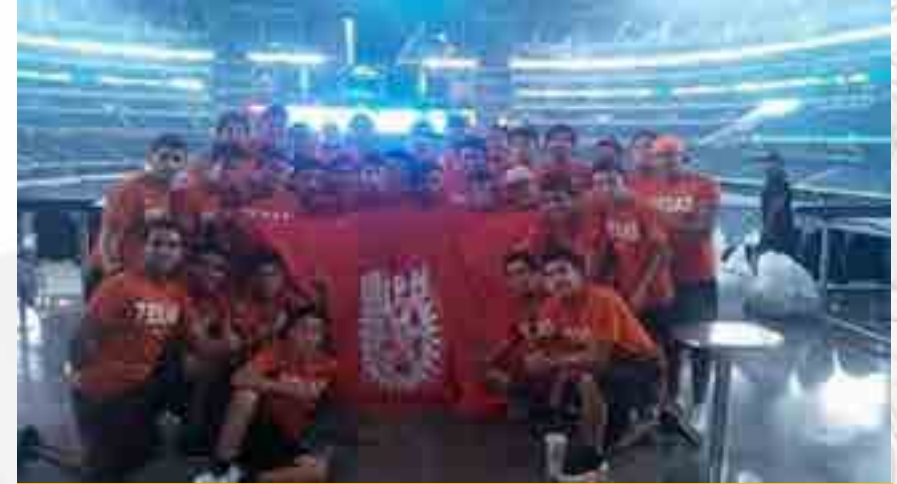
Juego NFL Cowboys VS Giants.

Cinco Entrenadores y 30 Alumnos - Jugadores del Centro de Estudios CECyT 8 “Narciso Bassols”, viajaron por segundo año consecutivo a Texas en Estados Unidos, con el fin de vivenciar el modelo Académico - Deportivo de los estudiantes norteamericanos y con esto motivarse a estudiar y Mejorar en Técnica y Fundamentos de Football. Tuvimos una práctica en conjunto con el equipo Taca Storm Texas Alliance Of Christian Athletes , además de visitar la universidad de Texas y el juego de NFL entre Dallas Cowboys vs New York Giants.