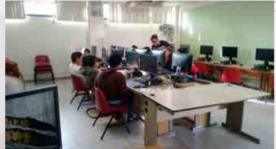
Laboratorio B de Computación.