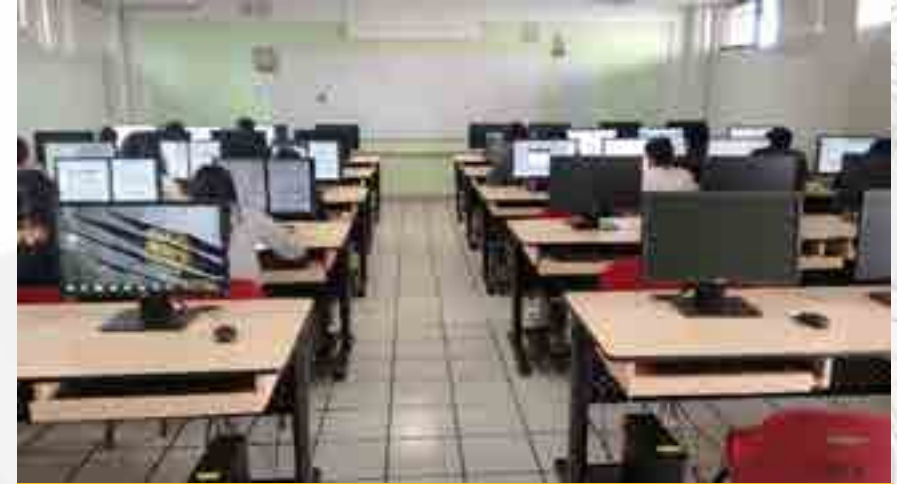
Laboratorio A de Computación.