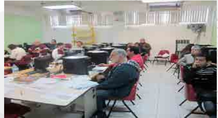
Curso atención a alumnos.

Se llevo acabo el curso “Atención a alumnos”, con un total del 24 asistentes en la Unidad Académica.