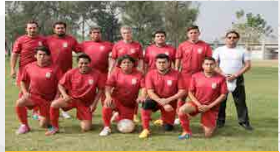
Interpolitécnicos de Docentes.

Se llevó a cabo la competencia en la categoría libre, participando todas las escuelas del Instituto Politécnico Nacional de Nivel Superior y Nivel Medio Superior, compitiendo en fase de grupos hasta obtener el campeón. El torneo Interpolitécnico de Docentes se llevó a cabo en las instalaciones deportivas de la Unidad Profesional “Adolfo López Mateos”, Zacatenco, obteniendo el 1er. lugar.