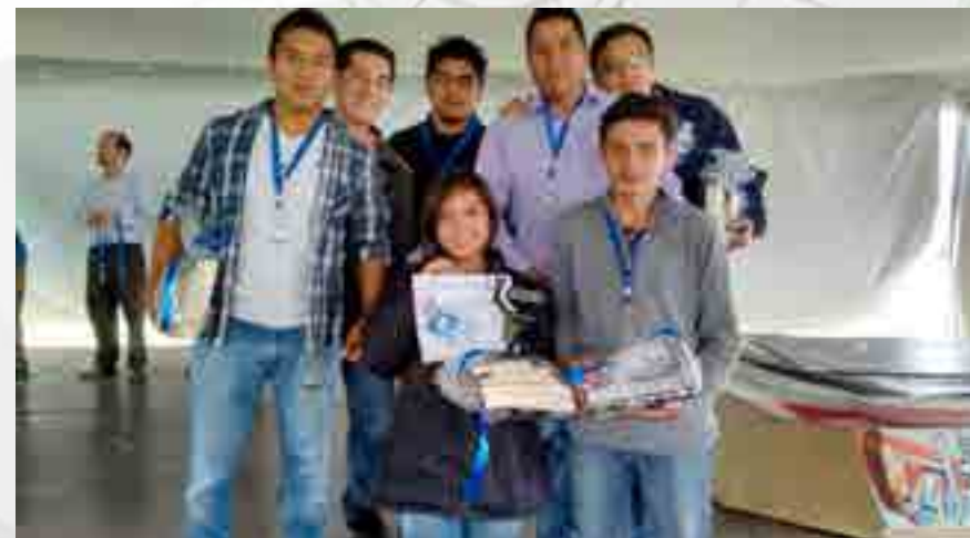
Club de Minirrobótica con sus premios en ESCOM.

Participación en el Concurso “CMRE”, llevado a cabo en la Escuela Superior de Computo (ESCOM). Obtención del segundo lugar en la categoría seguidor de líneas avanzada.