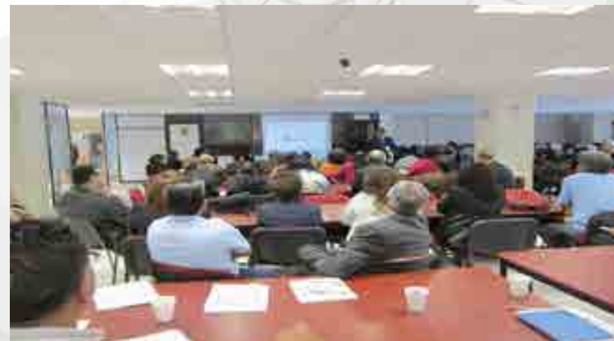
Docentes en el Taller de “Planeación y Evaluación”.

Se llevo a cabo el Taller de “Evaluación y Planeación”, para dar a conocer la importancia de saber con exactitud qué es evaluar, por qué realizar una planeación, su importancia, pros y contras, con una asistencia de 169 docentes en ambos turnos.