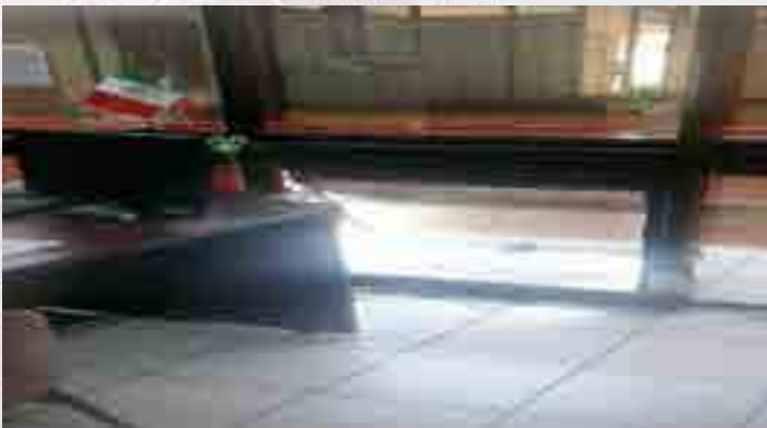
Habilitación de ventilas de proyección.