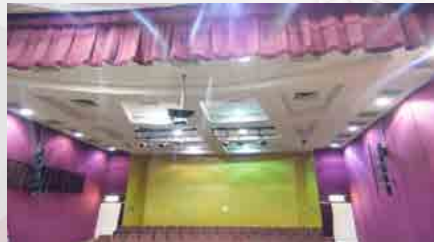
Reparación de luminarias