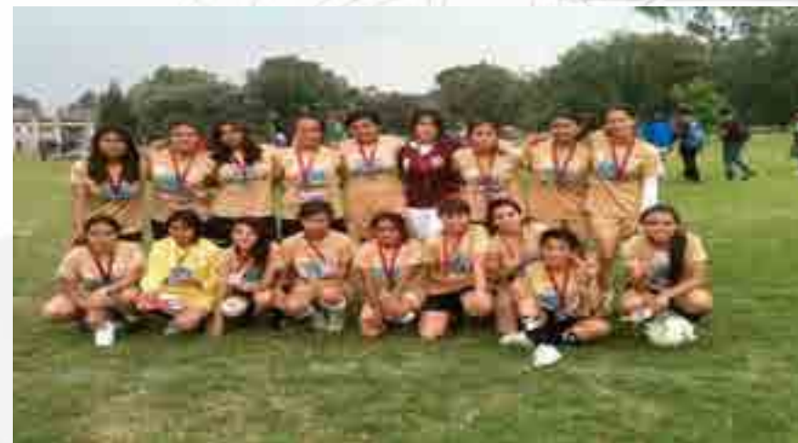
Copa Telmex, Femenil.

Se participó en la disciplina de fútbol asociación en las ramas femenil y varonil. En el mes de marzo se hizo una competencia donde solo participaron las mejores ocho vocacionales, donde el primer lugar se ganó el derecho de representar al Instituto Politécnico Nacional en la categoría juvenil en el torneo copa Telmex a nivel nacional.