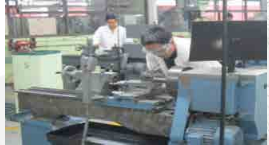
Carrera de Técnico en Mantenimiento Industrial.

La Unidad cuenta con la acreditación del programa académico de la carrera de Técnico en Mantenimiento Industrial que imparte en Modalidad Escolarizada, y sus respectivos programas por el Consejo de Acreditación de la Enseñanza de la Ingeniería (CACEI).