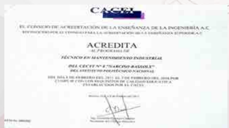
Acreditación de la Carrera de Técnico en Mantenimiento Industrial.