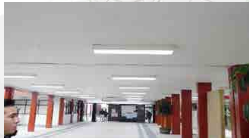
Mantenimiento de luminarias.

Se realizó el mantenimiento preventivo y correctivo a todas las luminarias de la Unidad Académica, cambio de tubos fluorescentes, piezas en mal estado, limpieza de gabinetes y acrílicos.