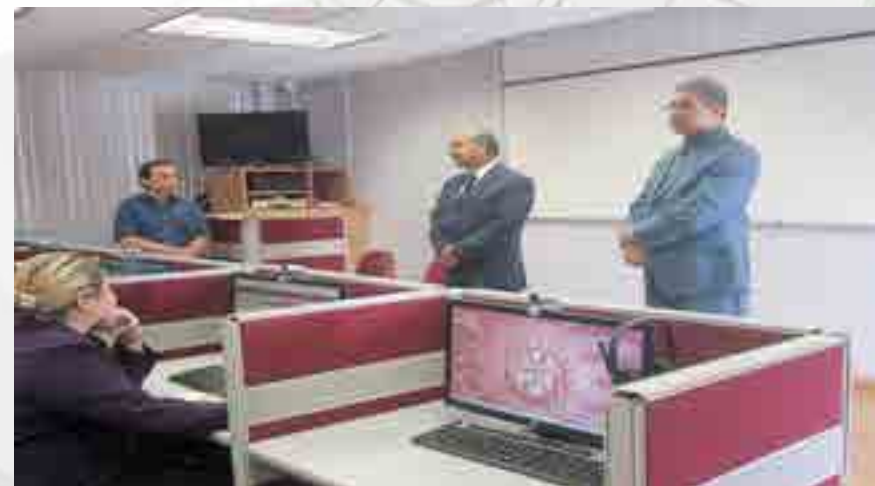
Curso Excel Intermedio.

Se impartió el curso llamado “Excel Intermedio”, con un total de 25 asistentes, realizado en el aula siglo XXI de la Unidad Académica.