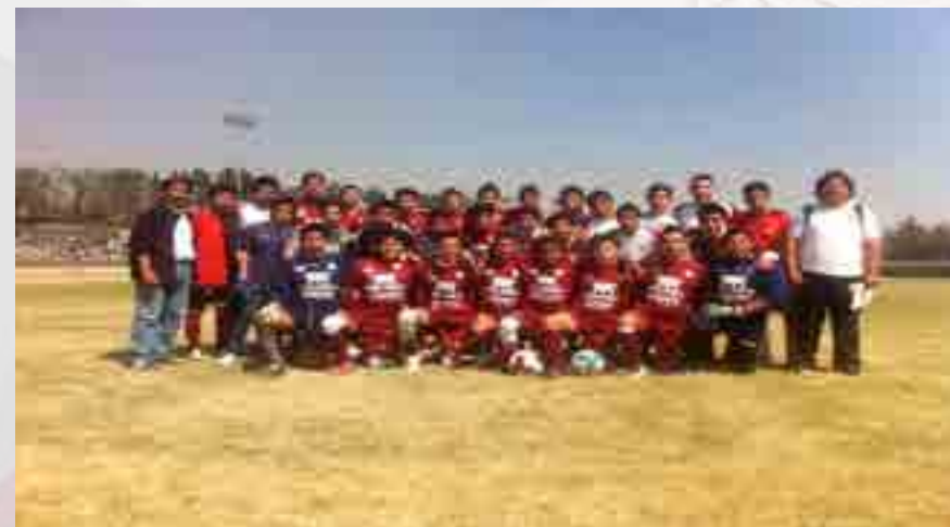
Copa Telmex, Varonil.