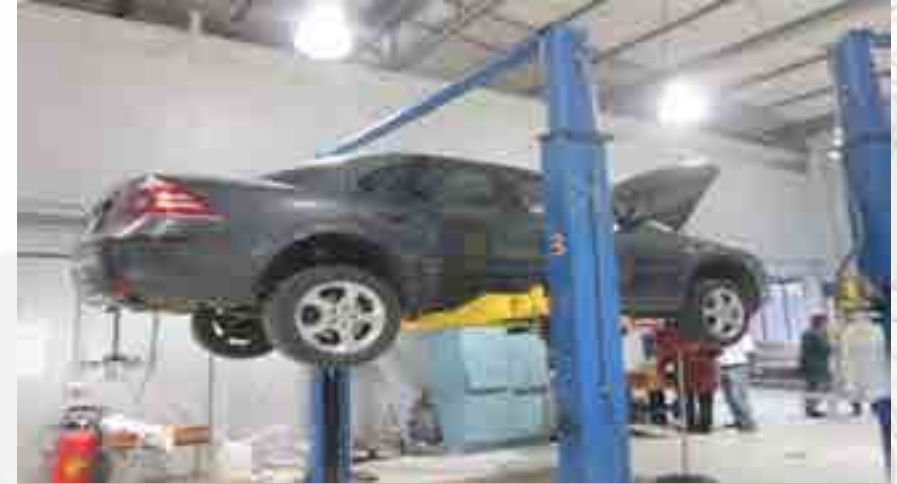
Carrera de Técnico en Sistemas Automotrices.

La Unidad cuenta con la acreditación del programa académico de la carrera de Técnico en Sistemas Automotrices que imparte en Modalidad Escolarizada, y sus respectivos programas por el Consejo de Acreditación de la Enseñanza de la Ingeniería (CACEI).