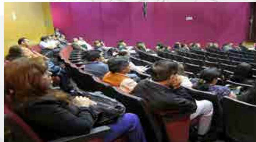
Docentes en la reunión de inicio de actividades Académicas Intersemestrales.

Se llevó a cabo el “Taller de Planeación Académica” que permitió la recalendarización de actividades, reuniones de academia, evaluaciones, etc. Después del paro General de Labores de 2014.