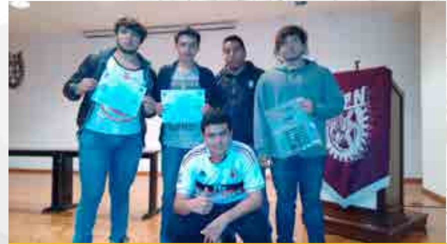
Club de Minirrobótica del CECyT en el Christmas Challenge.

Se participó en el concurso Christmas Challenge , llevado a cabo en la Escuela Superior de Ingeniería Mecánica (ESIME) Azcapotzalco. Alumnos del Centro de Estudios Científicos y Tecnológicos (CECyT 8) “Narciso Bassols” Obtuvieron el primer y segundo lugar en la categoría seguidor de líneas persecución.