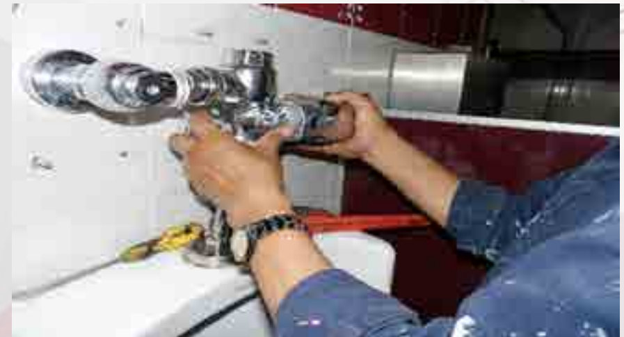
Cambio de piezas.