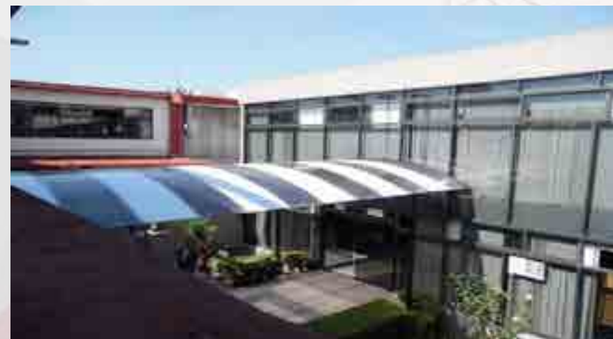
Construcción de andador metálico.