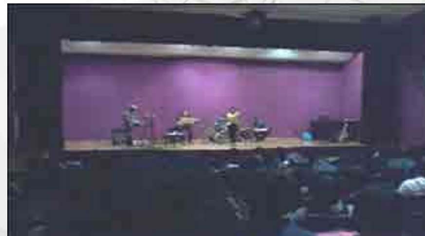
Concierto de Jazz Madame Gorgona.

En el Auditorio “Carmen de la Fuente” se llevó a cabo el concierto de jazz y blues de Madame Gorgona, teniendo como particularidad que la cantante además toca la flauta transversa.