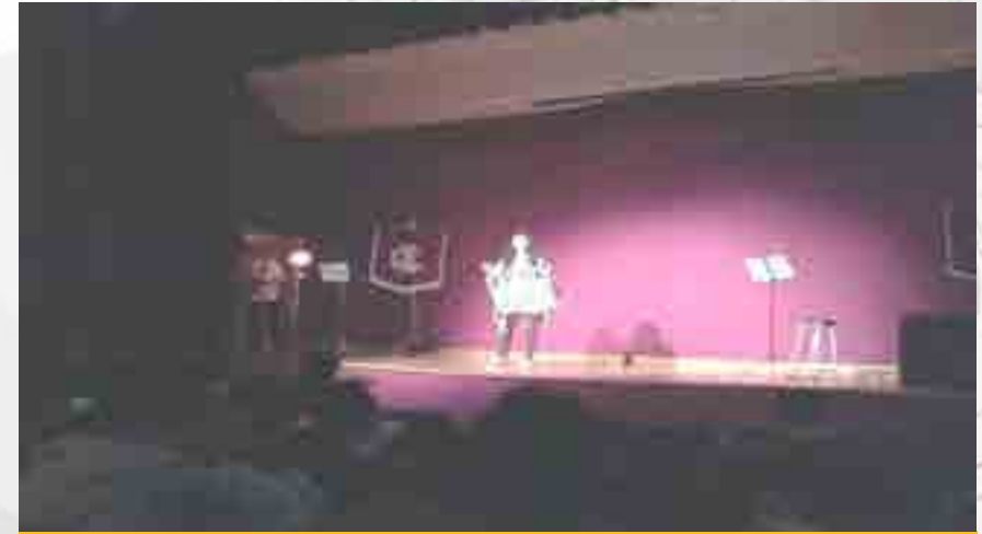
Grupo Covarrubias Project.

En el Auditorio “Carmen de la Fuente” se realizó un concierto de música alternativa por el grupo Covarrubias Project, voz e instrumental.