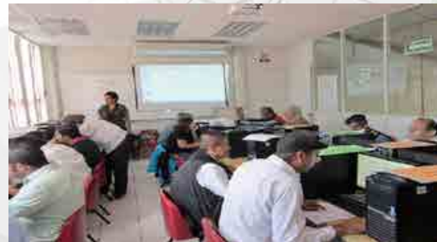
Curso “Solidworks Intermedio Avanzado”

Se llevo a cabo el Curso “Solidworks Intermedio Avanzado” con un total de 32 asistentes acreditados. Este curso se llevó a cabo en el Laboratorio de Solidworks del Taller de Sistemas Automotrices.