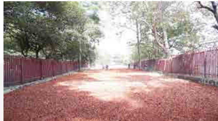
Colocación de tezontle.

Se realizó el mantenimiento a impermeabilizante a base de dos capas de acriltecho rojo y reforzado con membrana geotextil.