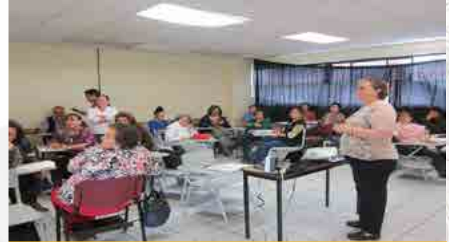
Curso “La intervención del Profesor en el Acompañamiento de sus alumnos” Turno Matutino.

Se llevo a cabo el Curso “La intervención del Profesor en el acompañamiento de sus alumnos”. Fue impartido en el Salón C2. En el turno matutino. Se contó con un total de 30 asistentes acreditados. En el turno vespertino. Se contó con un total de 19 asistentes acreditados.