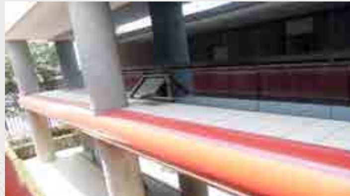
Ventilas de proyección.