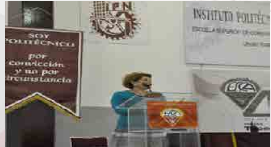
Inducción de estudiantes de nuevo ingreso