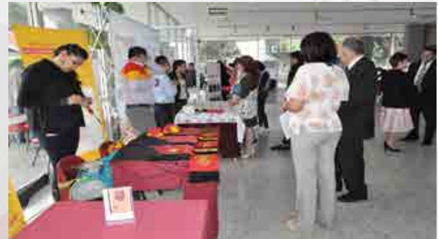
Feria de Empleo