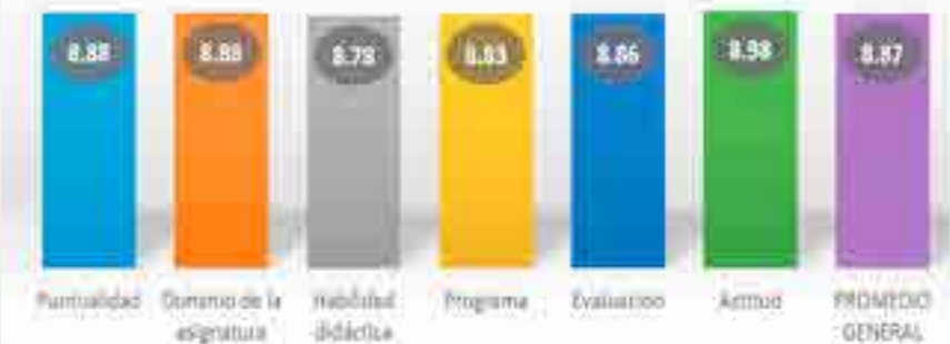
Gráfica de evaluación Docente General