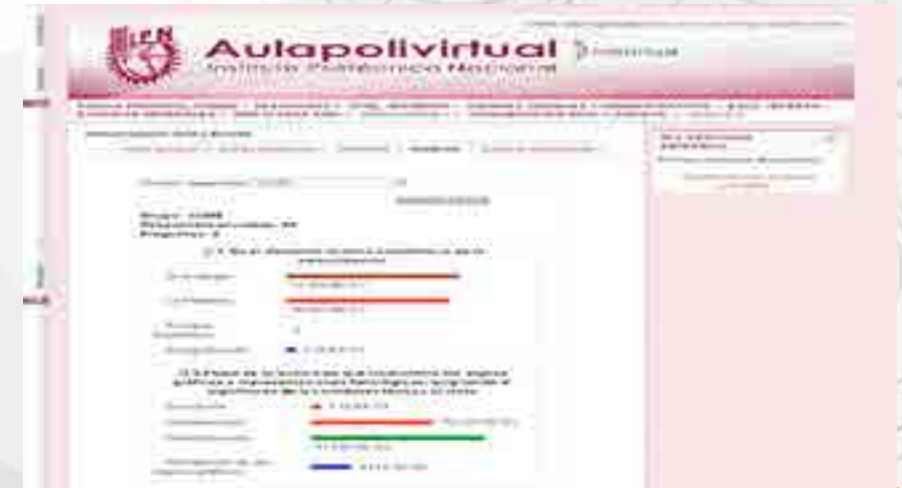
Gráficos de resultados de la Evaluación Diagnóstica

Se llevó a cabo el proceso de evaluación diagnóstica de los estudiantes del semestre lectivo 2015/2, utilizando la plataforma educativa institucional Moodle. El procedimiento se inició revisando y colocando en la plataforma institucional los reactivos de 122 unidades de aprendizaje, ofertadas para cada uno de los períodos escolares. La aplicación de dicha evaluación se llevó a cabo en las aulas de la unidad de informática y se aplicó a los estudiantes de todos los niveles de cada una de las carreras impartidas en esta Unidad Académica. La evaluación diagnóstica fue aplicada aproximadamente al 30% de la población. El departamento de Innovación Educativa informó a los docentes, conforme al grupo que tenían asignado, los resultados obtenidos en la evaluación, a fin de que tuvieran una referencia de los conocimientos previos de los estudiantes para el desarrollo de su planeación didáctica específica.