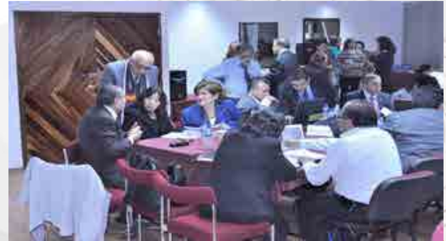
Reunión de trabajo para la reestructuración de los planes y programas de estudio

Ante las necesidades presentadas en la evaluación diagnóstica del 2013 se retomaron junto con la Unidad Académica de Santo Tomás, los trabajos de reestructuración de los planes y programas de estudio de las Licenciaturas en Relaciones Comerciales, Negocios Internacionales y Contador Público, con la finalidad de mejorar y actualizar los programas académicos impartidos en dichas unidades.