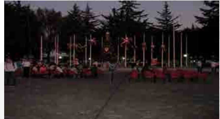
Festival de Navidad

Se llevó a cabo la semana de celebraciones de fiestas navideñas: El día 1 de diciembre, se inició con el encendido del árbol y del pesebre ubicados en la explanada principal del plantel, además se contó con la participación especial de alumnos del programa académico de Relaciones Comerciales y del CELEX, deleitando a los presentes con unos villancicos y canciones de navidad. Al día siguiente, se llevó a cabo el Cine Club con temática navideña, dentro del auditorio Lázaro Cárdenas del plantel. En dos turnos diferentes, se presentó la pastorela a cargo del grupo de teatro del plantel. Otra de las actividades fue el concierto a cargo del coro invitado “El esforzador”. Como último evento, se llevó a cabo la posada a cargo de las áreas de Difusión Cultural y Actividades Deportivas, teniendo invitados a diferentes Departamentos del plantel. Para amenizar el evento, se preparó el magno concierto con las presentaciones de diversos grupos musicales. El festival concluyó con la representación del nacimiento viviente a cargo de administrativos, alumnos y maestros.