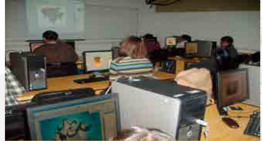
cursos de informática

La Escuela Superior de Comercio y Administración Unidad Tepepan, a través de la Unidad Politécnica de Integración Social impartió, a lo largo de los cuatro trimestres, cursos sabatinos en el área de informática, particularmente Excel en tres niveles: básico, intermedio y avanzado dirigido a la población en general y a la Comunidad Politécnica: alumnos, egresado, docentes y empleados y con duración de veinte horas por cada nivel. También se impartió, a los alumnos de la licenciatura de Relaciones y Comerciales, el curso Photoshop. En su totalidad, fue atendida una población de 363 personas, conformada por comunidad politécnica y externos.