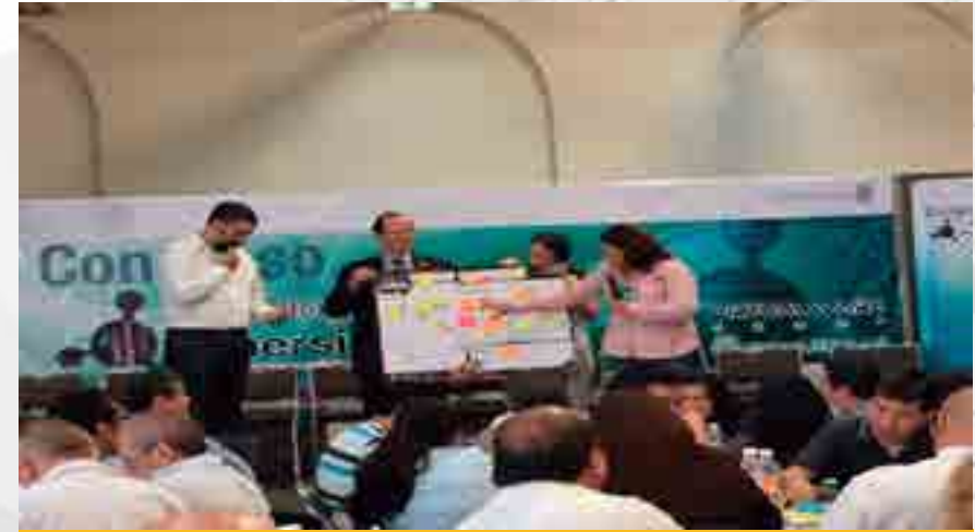
Congreso de Tecnologías inmersivas en el aula

Se celebró el “Congreso de Tecnologías Inmersivas en el Aula”, Experiencias Vivenciales para una Aprendizaje Significativo que tuvo lugar en el Centro de Educación Continua (CEC), Unidad Allende, del Instituto Politécnico Nacional. Un congreso en el que participó la Unidad de Tecnología Educativa y Campus Virtual Tepepan y miembros de la comunidad académica del IPN. Se instaló un túnel de tecnologías inmersivas compuesto por 16 objetos digitales educativos distintos, generados a partir de tecnologías de Realidad Aumentada, Realidad Virtual y Aplicaciones Multitáctiles para ser utilizados a través de diversos medios digitales, tales como dispositivos móviles, mesas multitáctiles, pantallas, lentes de realidad virtual aumentada y PC´s. Se tuvo interacción con dichas tecnologías y se vivenció la experiencia permitiendo generar un pensamiento crítico del uso de las tecnologías en el Aula. Adicionalmente, se identificaron las oportunidades de aplicación, uso en necesidades educativas específicas de los diferentes programas académicos y específicamente en algunos laboratorios y talleres del Instituto Politécnico Nacional para su posible aplicación con perspectiva educativa de estas tecnologías.