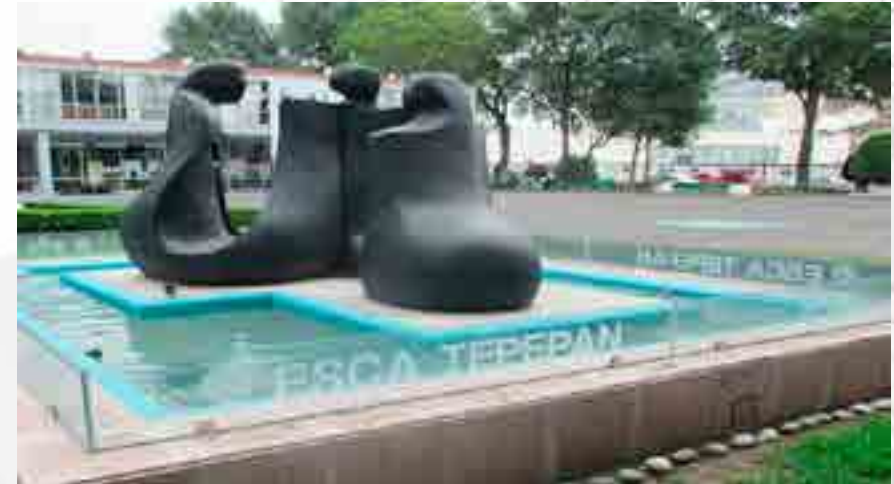
Rehabilitación de la Fuente