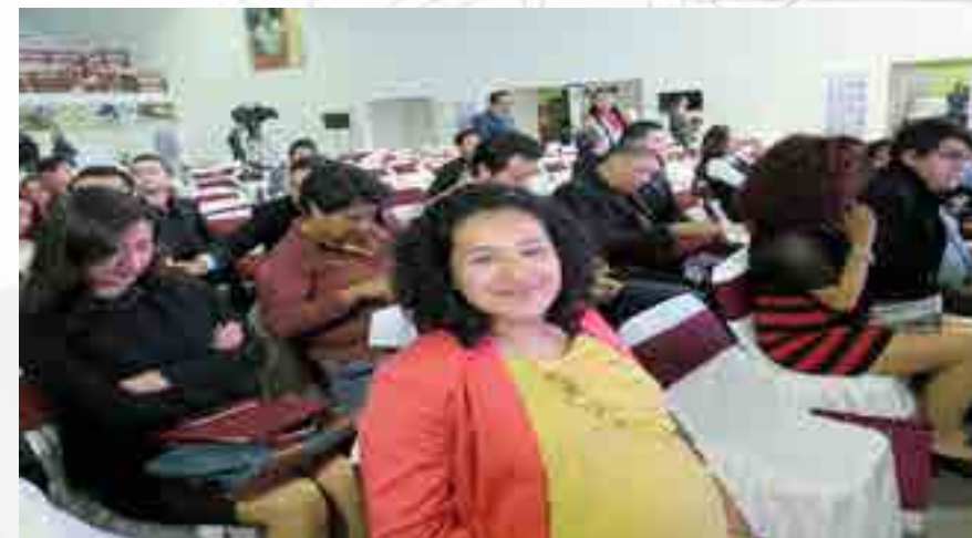
Reconocimiento a alumna graduada del programa de Maestría.