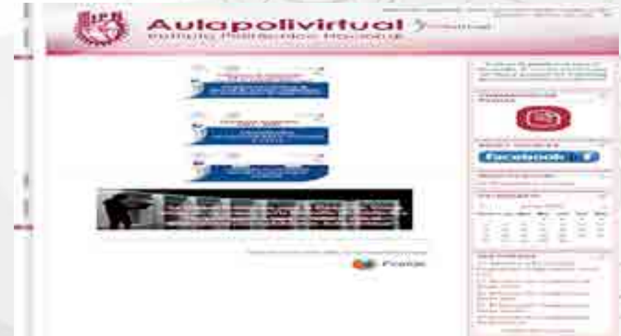
Plataforma de Evaluación Diagnóstica

Se llevó a cabo el proceso de evaluación diagnóstica del estudiantado, del semestre lectivo 2016/1, mediante el uso de la plataforma educativa institucional Moodle. Se revisó y colocó en plataforma los reactivos de las unidades de aprendizaje ofertadas en el periodo. La aplicación de dicha evaluación se llevó a cabo en las aulas de la unidad de informática y se aplicó a los estudiantes de todos los niveles de cada una de las carreras impartidas en esta Unidad Académica. Se aplicó aproximadamente a un 30% de los alumnos. El departamento de Innovación Educativa informó a los docentes, conforme al grupo que tenían asignado, los resultados obtenidos en la evaluación, a fin de que tuvieran una referencia de los conocimientos previos de los estudiantes para el desarrollo de su planeación didáctica específica.