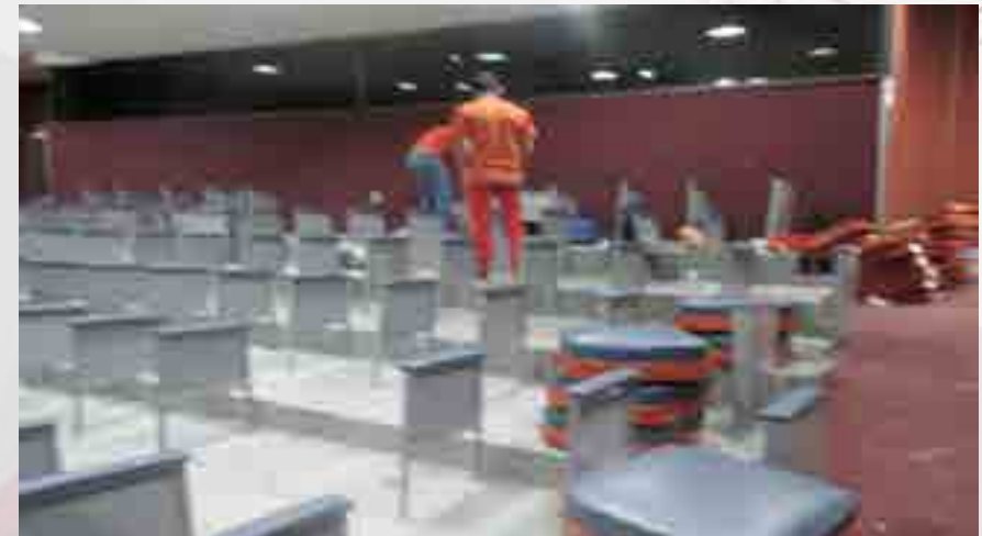
Remodelación del Auditorio