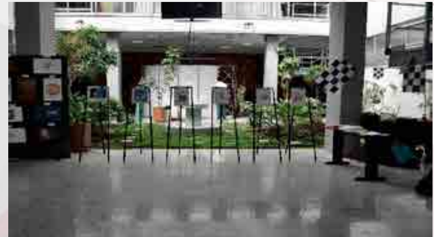
Maratón de mercadotecnia 2