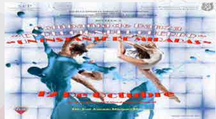
Danza Un Instante de Miradas