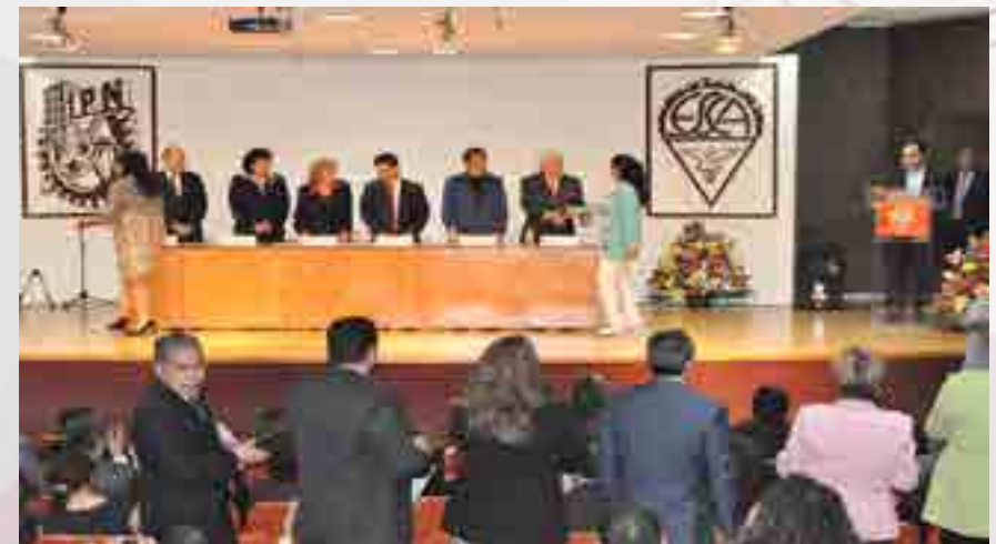
Reunión de Egresados