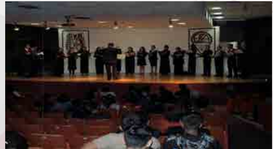
Coro “El Esforzador”