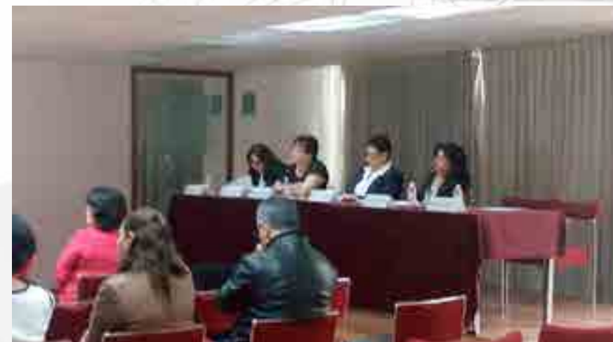
Diplomado en Formación en Competencias Tutoriales

El diplomado estuvo integrado por cuatro módulos, donde los docentes realizaron productos específicos de acuerdo a las temáticas de cada uno. Participaron docentes de ambos turnos y realizaron como producto final un blog de internet en el que especificaron las actividades sustanciales del Plan de Acción Tutorial.