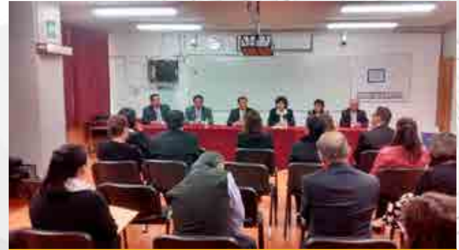
Conclusión de los trabajos de reacreditación por parte de los evaluadores de CACECA

Se realizaron los trabajos para la Reacreditación del Programa Académico de Relaciones Comerciales que incluye: la capacitación del personal a cargo, la recopilación de evidencias y la conformación del instrumento armonizado del Consejo de Acreditación en Ciencias Administrativas, Contables y Afines (CACECA), la logística para la evaluación y la atención de los evaluadores, quienes visitaron las instalaciones y la recepción del Dictamen con un puntaje de 891.35.