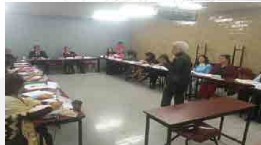
Curso relaciones interpersonales

Derivado del resultado de la Detección de Necesidades de Formación y Capacitación (DNFC) por parte de la Coordinación General de Formación e Innovación Educativa (CGFIE), se impartieron los siguientes cursos en esta Unidad Académica: -Relaciones interpersonales, para 20 participantes -Administración en el trabajo, para 14 participantes -Ortografía y redacción, para 14 participantes -Organización y conservación de archivos, para 20 participantes -Educación para la salud, autocuidados y medidas preventivas, para 15 participantes.