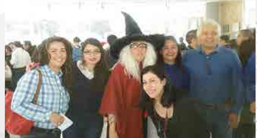
Enseñanza de lenguas extranjeras

Se ha logrado mantener convenio de colaboración con el Instituto Mexicano de Medicina Genómica (INMEGEN) y el Instituto de la Propiedad Industrial (IMPI), así como con la “Financiera Nacional de Desarrollo”, mediante los servicios de enseñanza ofertados, por la ESCA Tepepan: del idioma inglés avanzado y FCE y diversos cursos de capacitación y actualización, como liderazgo, actitud de servicio, comunicación efectiva, control y ejecución de procesos, finanzas básico, finanzas intermedio, habilidades de negociación y manejo de conflictos, lectura rápida, ortografía y redacción, planeación estratégica, trabajo en equipo. El Convenio de Colaboración con el “Instituto Mora” fue reflejado en el Diplomado en “Contrataciones Públicas” (adquisiciones y obras).