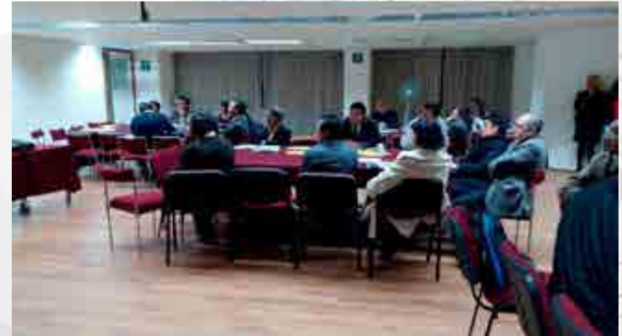
Juntas de Academia previas al inicio de los Periodos Polivirtual

Durante el Ciclo Escolar 2015/2 (Enero - Junio 2015) y el Ciclo Escolar 2016/1 (Agosto - Diciembre 2015), se realizaron un total de seis juntas de academia para dar información general en cada periodo Polivirtual sobre la operación y gestión de la plataforma, calificaciones y procesos de reinscripción de los estudiantes de manera calendarizada, con el fin de contar con la colaboración de los asesores y profesores tutores y brindar la atención debida a nuestros estudiantes. Estas sesiones de trabajo fueron coordinadas por los presidentes de academia de las áreas Institucional, Científico-Básica, Profesional de las Licenciaturas de Contador Público, Negocios Internacionales y Relaciones Comerciales. Estas figuras se encuentran representadas por un total de 10 docentes, en cada periodo Polivirtual se trabaja con un aproximado de 120 profesores Asesores.