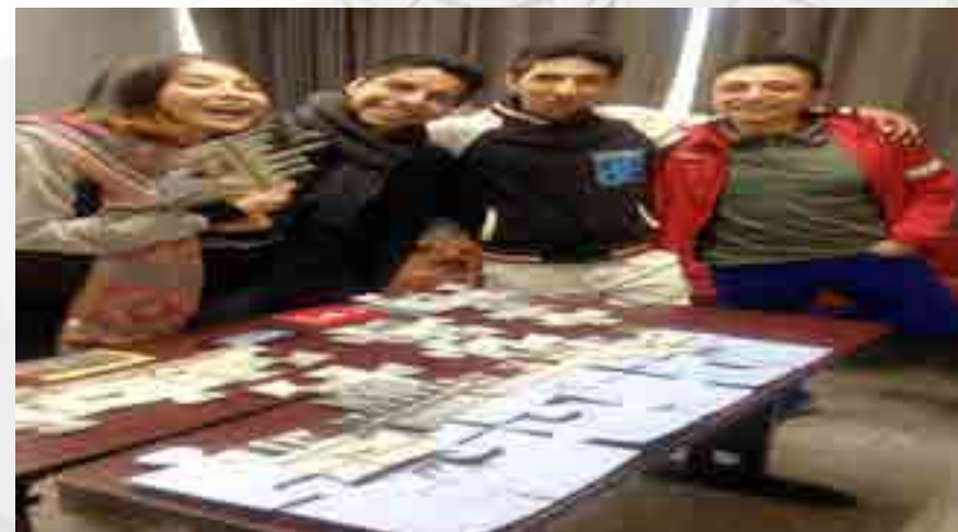
Cursos de Lenguas extranjeras

En los cursos Extracurriculares de Lenguas Extranjeras (CELEX), se impartieron 12 periodos de cursos con una duración de 40 horas, atendiendo una matrícula de 20,145 alumnos a los cuales se les brindaron diferentes servicios: (inscripciones, exámenes de ubicación, reembolsos, credenciales y constancias). Lo anterior con la participación activa del personal de la UPIS, de los CELEX, representantes de academia y el apoyo de profesores de los distintos idiomas en los procesos académicos - administrativos y prestadores del servicio social.