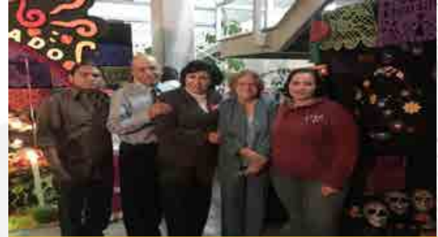
Inauguración del festival

El evento se inauguró el martes 27 de octubre con la presencia de los directivos de nuestra unidad académica, los cuales cortaron el listón, para pasar a observar cada una de las ofrendas participantes de dos categorías: la de alumnos y otra de administrativos junto con docentes. Este mismo día, se inauguró el panteón de tamaño real en el jardín ubicado a un costado de la cafetería. El día 28, se llevó a cabo el concurso de calaveritas literarias, concluyendo el evento el jueves 29 de octubre, con un magno concierto en la explanada del plantel a cargo de nueve grupos de música variada. De igual forma, ese día se realizó un desfile de modas de material reciclado llamado “Ecorunway”, así como un concurso de disfraces, ambos contando con la participación de alumnos y comunidad del plantel. Alrededor de las 8 de la noche se llevó a cabo la premiación de las ofrendas, calaveritas literarias, disfraces y catrinas.