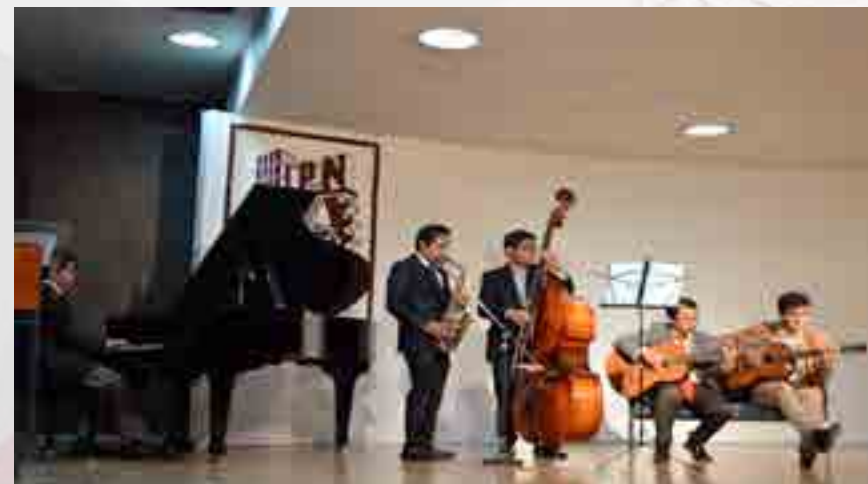
Evento cultural de la 7a. Jornada de Negocios Internacionales