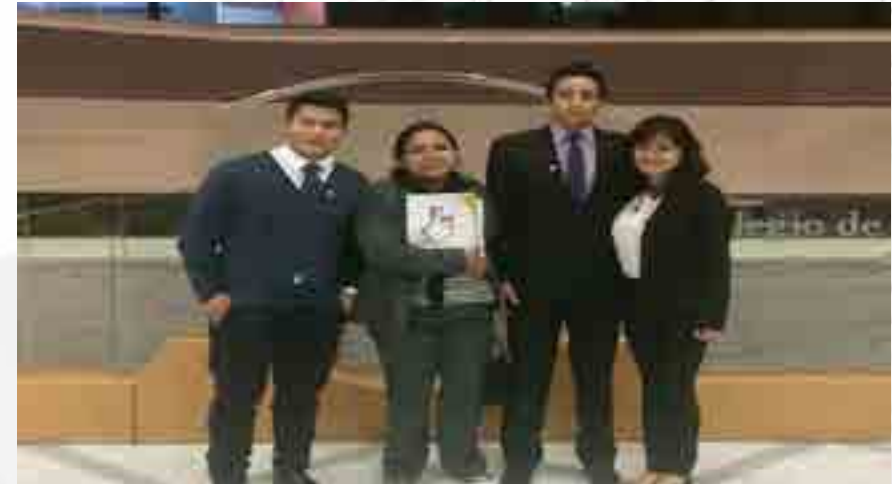
Maratón de Ética

En las instalaciones del Colegio de Contadores Públicos de México, A.C., tuvo lugar el Maratón de Ética, y en el que la Escuela Superior de Comercio y Administración Unidad Tepepan, fue representada por un equipo de siete integrantes, y en el que los participantes compitieron con 40 equipos de otras escuelas y universidades del Área Metropolitana.