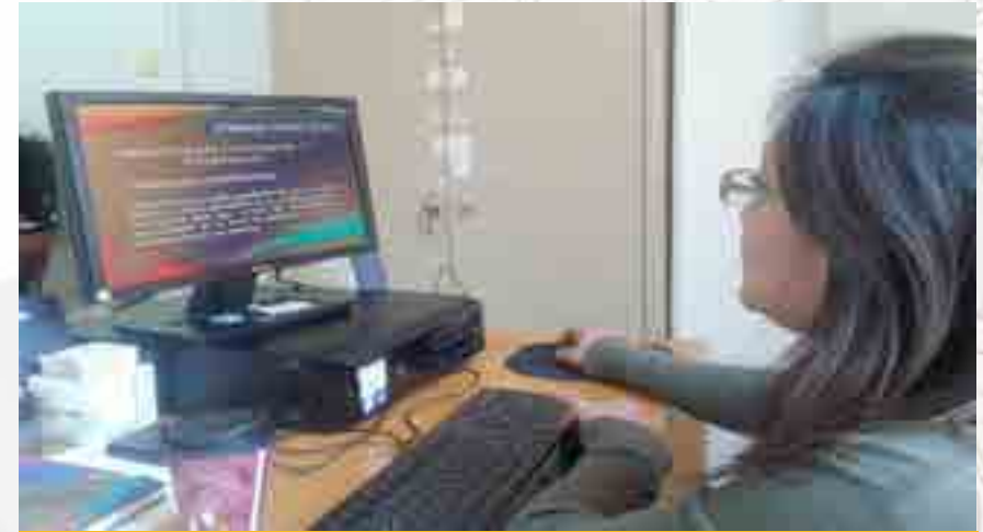
Revisión de Material Didáctico

Con la finalidad de mejorar la calidad de los materiales didácticos elaborados por los docentes de la escuela, este departamento les ofreció orientación didáctica pedagógica, concluyendo con un total de 23 materiales diseñados y entregados a las correspondientes jefaturas de formación profesional. Se revisaron, desde el punto de vista didáctico pedagógico, 11 seminarios de titulación en la modalidad escolarizada. En el caso del área de Polivirtual se realizó la actualización la planeación didáctica de 18 unidades de aprendizaje. Se realizaron mejoras continuas de Unidades de Aprendizaje, así como la adaptación de las planeaciones didácticas para la modalidad, se actualizó el curso propedéutico para los alumnos de nuevo ingreso.