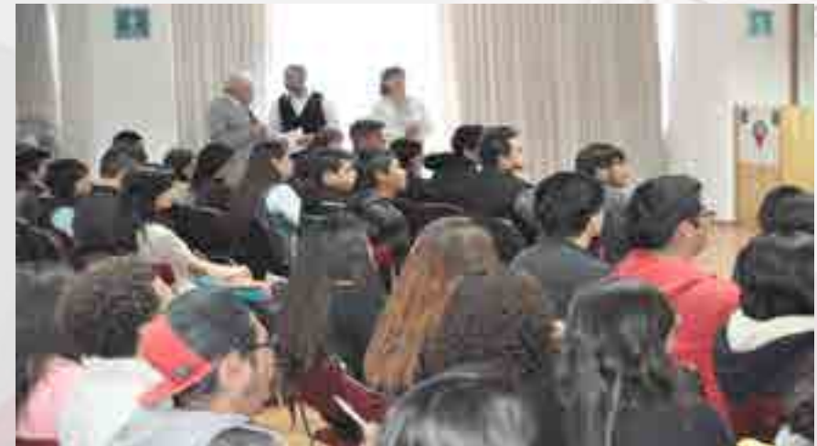
Curso de inducción