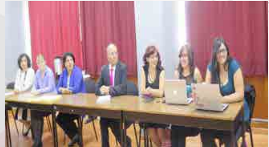
Alumnos del programa DELFIN