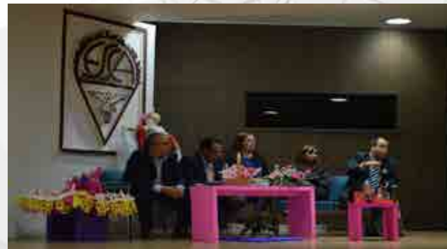
6ª Jornada de Negocios Internacionales

Se dictaron conferencias con la temática central “Los Nuevos Negocios Internacionales”, permitiendo a la comunidad académica evaluar los nuevos negocios internacionales, la nueva relación Estados Unidos-Cuba, las oportunidades de negocios en turismo, la exportación del café orgánico, así como emprendurismo y neuroempowerment.