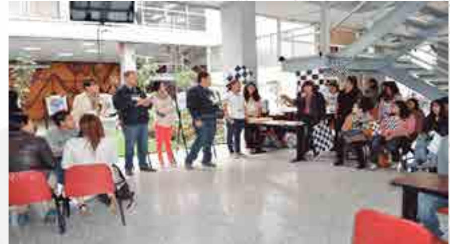
Maratón de Mercadotecnia

El objetivo primordial de esta actividad fue evaluar los conocimientos adquiridos en el área de mercadotecnia de los alumnos de I al V niveles de la Licenciatura en Relaciones Comerciales, y del Nivel I de Contaduría Pública y Negocios Internacionales, con el fin de propiciar la colaboración y mejora del acervo cultural durante su trayecto escolar. Se tuvo registro de siete equipos: cuatro de la Licenciatura en Relaciones Comerciales y tres de Contador Público. El evento se realizó dentro de las instalaciones de la Escuela Superior de Comercio y Administración Unidad Tepepan. Las actividades que se llevaron a cabo fueron: a) Presentación de cartel. b) Marketing concepts (actividad en el idioma inglés). c) Rally de marketing d) Actividad de baile e) Serpientes y escaleras de mercadotecnia. Posteriormente, se dieron a conocer los resultados de las actividades: CARTEL GANADOR: Equipo “Los Tikis” de Contador Público (Nivel III). PRIMER LUGAR: Equipo “Los Tikis” de Contador Público (Nivel III). SEGUNDO LUGAR: Equipo “Mevi” de Licenciatura en Relaciones Comerciales (Nivel I - Formación Básica). TERCER LUGAR: Equipo “Los Pikis” de Contador Público (Nivel III). Los tres equipos ganadores del Maratón y el equipo ganador del cartel, además de las medallas, recibieron un paquete de libros por parte de las editoriales PEARSON Y CENGAGE, como regalo por sus conocimientos y participación en el evento.