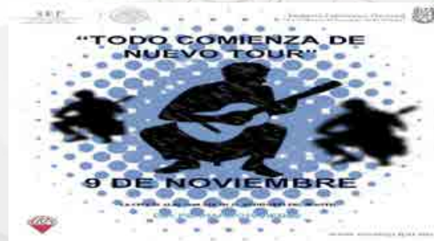
Concierto de trova

La presentación fue una de las más emotivas dentro del semestre ya que el intérprete contaba con un carisma nato, el cual lograba cautivar a su audiencia, contaba con varios aditamentos como una caja de ritmos lo cual hacía que sonara diferente a los trovadores comunes. El concierto duró alrededor de una hora, con canciones propias. El artista cuenta con 2 lanzamientos de discos los cuales se encontraban a la venta.