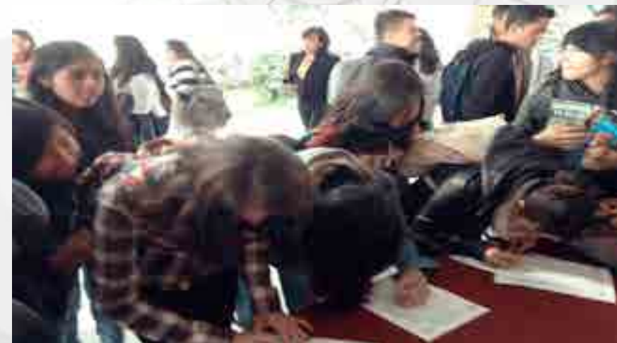
concurso “Minuto para Ganar”

En el Auditorio Lázaro Cárdenas de este plantel y en un ambiente ameno y lleno de emociones, se llevó a cabo el concurso “Minuto para Ganar”, el cual fue patrocinado por el Despacho Deloitte, y en el que ocho equipos conformados por cuatro alumnos cada uno, demostraron sus conocimientos generales además de algunos conceptos del área de contabilidad. Este concurso estuvo lleno de intensa emoción, ya que los ocho equipos contaron con la participación y apoyo de sus compañeros que los apoyaban con grandes porras. Cabe comentar que este tipo de eventos es de suma atracción para los jóvenes alumnos, ya que disfrutaban de un momento de esparcimiento poniendo a prueba sus conocimientos, habilidades y destrezas.