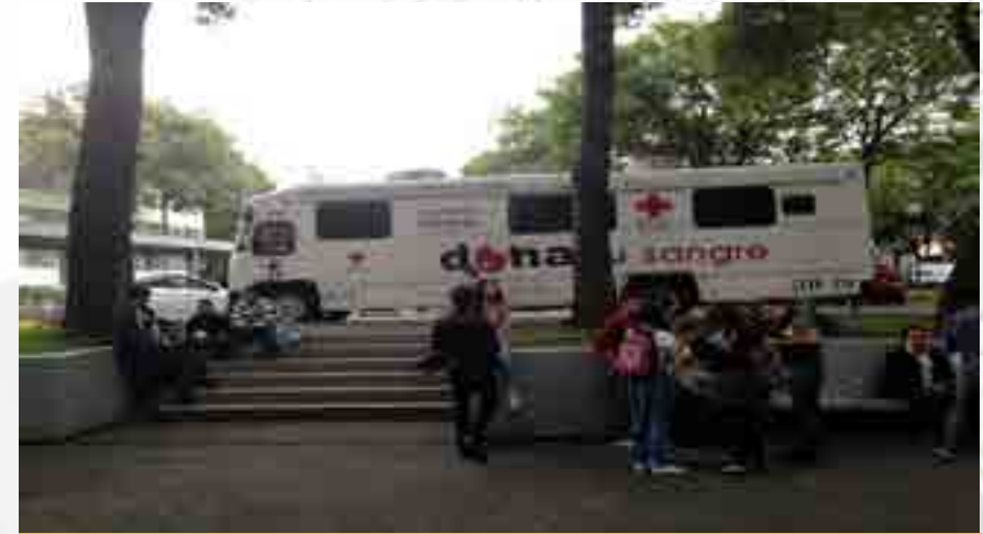
Programa Nacional de Donación Altruista de Sangre de la Cruz Roja

En el marco del Día Mundial de la Mujer, se buscó, por parte del Servicio Médico, acercar a las mujeres de la comunidad de este plantel, diferentes servicios de salud como son: vacunas de influenza, hepatitis y tétanos, exámenes de Papanicolaou y exploración de mama, promoviendo una cultura de prevención, seguimiento y atención de las principales enfermedades que afectan a las mujeres hoy en día. La Cruz Roja Mexicana mantiene un programa permanente de promoción a la comunidad para la Donación Voluntaria de Sangre, con la finalidad de poder cubrir las necesidades de su institución y de otras que así lo requieran. Por lo que, con apoyo de la comunidad de nuestra Unidad Académica, el Servicio Médico contó con una notable afluencia de donadores de sangre. Por otra parte, en conmemoración del Día Internacional del Hombre / Día Internacional de la No Violencia Contra las Mujeres, el Servicio Médico fomentó una cultura de cuidados y responsabilidad en materia de salud entre la comunidad de la Unidad Académica, mediante la aplicación de vacunas de influenza y neumococo, colocación del anticonceptivo "Mirena", pruebas de antígeno prostático y VIH (Virus de Inmunodeficiencia Humana).