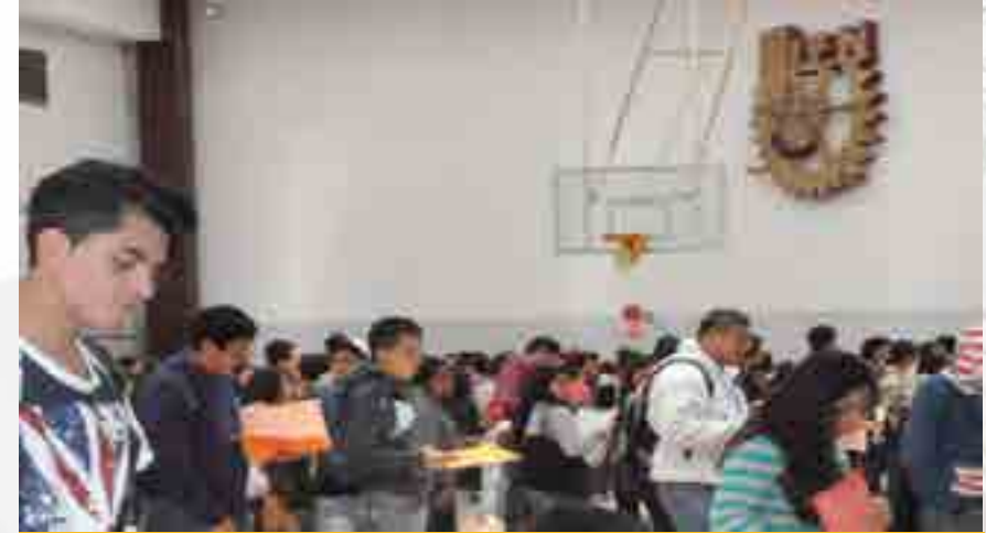
Proceso de admisión escolar

La Unidad Académica ofertó tres programas de licenciatura en la modalidad escolarizada, atendiendo una población de 5,449 alumnos, de los cuales 2,446 fueron inscritos en Contaduría Pública, 1,707 en Relaciones Comerciales y 1,296 en Negocios Internacionales. Estos tres programas también se ofrecieron en la modalidad no escolarizada, atendiendo a 719 estudiantes; de los cuales 321 se ubican en Contaduría Pública, 213 en Relaciones Comerciales y 185 en Negocios Internacionales. En el nivel Posgrado se ofertó una Maestría en Ciencias en Administración de Negocios y tres Especialidades, con una matrícula de 101 estudiantes de los cuales 72 se encontraban cursando Maestría, ocho la Especialidad de Marketing Estratégico en Negocios, 13 la Especialidad en Impuestos y ocho la Especialidad en Finanzas.