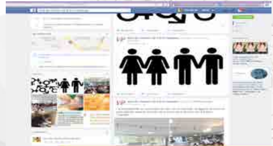
Facebook y Red de Género

Se difundieron artículos y anuncios en la página electrónica de la Unidad Académica y la página de Facebook Red de Género ESCA Tepepan alusivos a las siguientes fechas: 14 de febrero “Amor sin violencia”, 8 de marzo “Día internacional de la mujer”, 21 de marzo “Día Internacional para la eliminación de la discriminación racial”, 10 de mayo y día del padre.