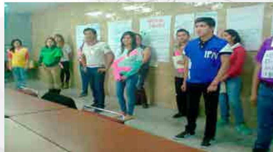
Feria Regional y Nacional Emprendedora (ANFECA)

La Escuela Superior de Comercio y Administración Unidad Tepepan participó en la IX Expo Regional y Nacional Emprendedora ANFECA, llevado a cabo en la Universidad Pedregal, con tres equipos: ECOLOGICAL BIKE TECH, OZONEBODY, Y NYAH. El proyecto OZONEBODY fue el ganador del 3er lugar.