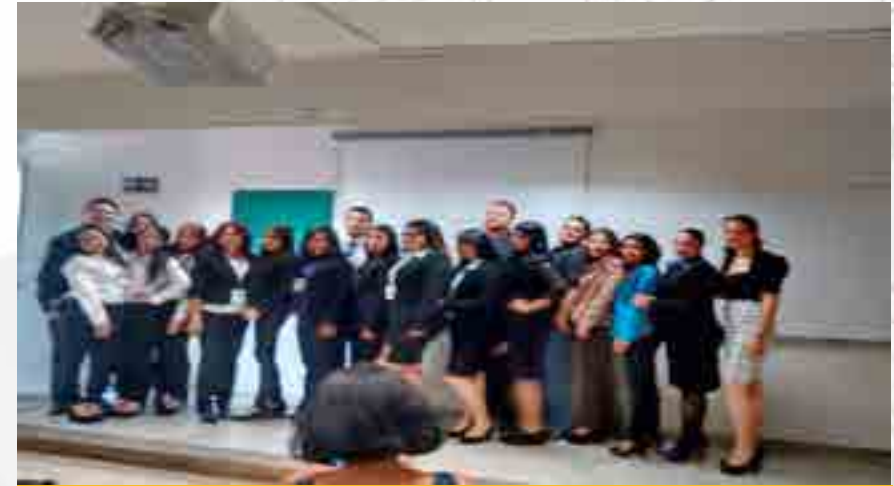
3er Encuentro Estudiantil de Intercambio Académico y Emprendimiento Social

La Escuela Superior de Comercio y Administración Unidad Tepepan tuvo el honor de ser representada por un grupo de entusiastas alumnos de las tres carreras que se imparten en la escuela. Con un total de 12 alumnos (cuatro por carrera) y el apoyo de seis profesores, acudieron a la cita en la Universidad Autónoma de Zacatecas, donde se llevó a cabo el 3er. Encuentro Estudiantil de Intercambio Académico y Emprendimiento Social organizado por la Asociación Nacional de Facultades y Escuelas de Comercio y Administración (ANFECA). Los proyectos con los que participaron, fueron: Bicicletas de Cartón (Bike Tech); Lámparas Solares (Future Light); Silos de Agua (TO2 Ha); Jugo de Berenjena (Beren Juice); Venta de Cuadros de Plantas (Eco Store).