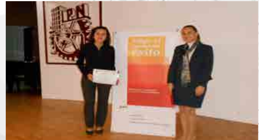
plática titulada “Liderazgo”

En el Auditorio Lázaro Cárdenas de la Escuela Superior de Comercio y Administración Unidad Tepepan, tuvo lugar la plática titulada “Liderazgo”, que es uno de los cuatro temas que componen el Taller “Creando tu Marca Personal”, que organiza el Despacho PwC. Esta serie de pláticas dirigidas a los alumnos pertenecientes al Programa Académico de Contador Público de la Escuela Superior de Comercio y Administración Unidad Tepepan pretende crear conciencia en la importancia de adquirir competencias, destrezas y habilidades que son clave en el desarrollo de su vida académica y profesional.