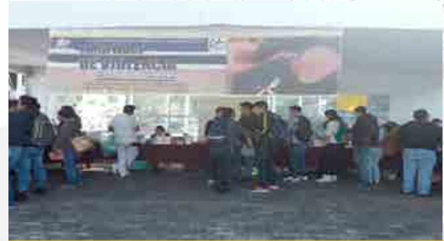
Día Internacional de la Eliminación de la Violencia Contra las Mujeres