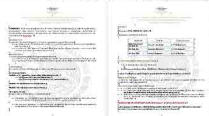
Convocatoria para el Diplomado

El “Diplomado en Educación Financiera a Distancia” de la Comisión Nacional de Protección y Defensa de los Usuarios de Servicios Financieros (CONDUSEF), en su 23va Generación, se ofreció a los alumnos de las tres carreras que se imparten en la Escuela Superior de Comercio y Administración Unidad Tepepan. El Departamento de Formación Profesional en Contaduría Pública es Coordinador ante la CONDUSEF para orientar y apoyar las actividades de cada uno de los participantes inscritos a dicho diplomado. 52 participantes concluyeron este diplomado con la aplicación de la 3era. Evaluación el día 17 de julio.