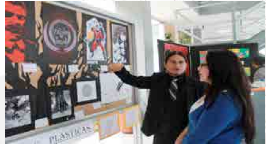
Expo de Talleres de Danza Artes y Música

Este evento es la culminación semestral de los talleres culturales y es el escenario donde los alumnos que los integran muestran a la comunidad de la escuela e invitados, las destrezas y habilidades adquiridas, en diversos foros del plantel como son el auditorio y lobby. Los talleres participantes fueron: artes plásticas; creación literaria, danza árabe, danza contemporánea, danza folclórica, danzas polinesias, fotografía 1 y 2, guitarra clásica; hip funky, iniciación musical, jazz, k pop, máscaras y cartonería, rondalla contemporánea y teatro.