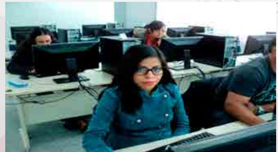
Cursos en área de informática