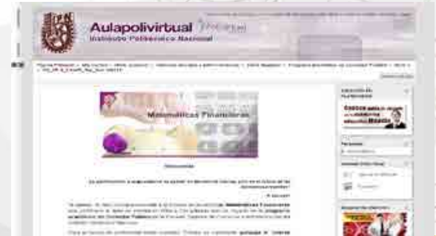
Plataforma Educativa Aulapolivirtual

La Unidad de Tecnología Educativa y Campus Virtual operó los tres programas académicos (“Contador Público”, “Relaciones Comerciales” y “Negocios Internacionales”) en la Modalidad No Escolarizada, como parte de la oferta educativa Institucional y en apoyo a la modalidad escolarizada de estudiantes. Se atendieron a 887 estudiantes aproximadamente de la Modalidad Escolarizada (Alumnos de Flexibilidad) y a 2,480 estudiantes de la Modalidad No Escolarizada. También se proporcionó atención a 803 estudiantes en el curso “Modelo de Operación del Polivirtual” para alumnos de flexibilidad que optaron por cursar y/o recursar unidades de aprendizaje en esta modalidad, para ofrecer la continuidad de la trayectoria académica y a 521 estudiantes en Curso Propedéutico en el Proceso de Admisión Escolar 2015 - 2016 conforme a la Convocatoria de Ingreso al Instituto Politécnico Nacional.