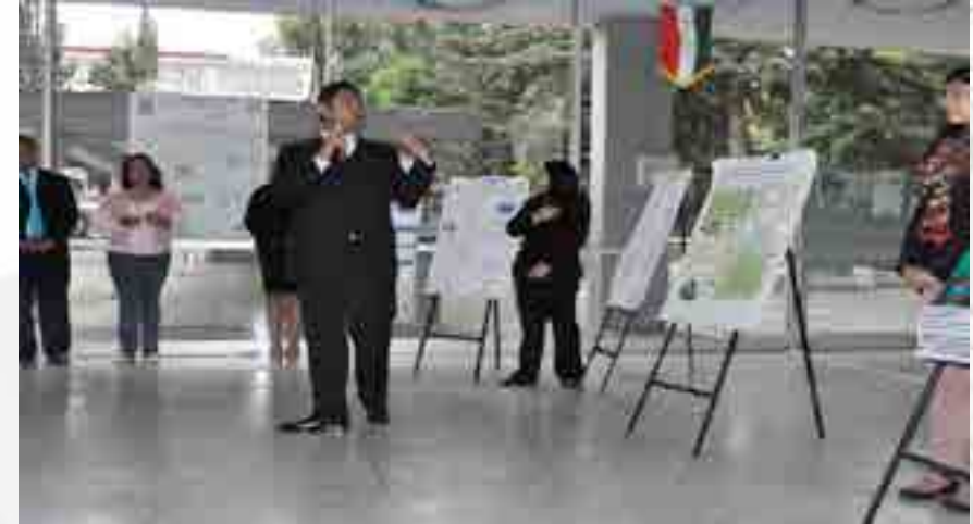
Alumno BEIFI en exposición de cartel

Como resultado de un intenso trabajo para fortalecer la investigación en el plantel, el número de proyectos registrados en la Secretaría de Investigación y Posgrado fue de 22. Referente a la Beca de Estímulo Institucional de Formación de Investigadores (BEIFI), en el año fueron aceptados 3 alumnos. En el “Programa Interinstitucional para el Fortalecimiento de la Investigación y Posgrado del Pacífico” -más conocido como Programa Delfín- constituido actualmente por 94 Instituciones de Educación Superior del país-, se recibieron en la Unidad Académica a un grupo significativo de alumnos provenientes de varias instituciones de educación superior del país.