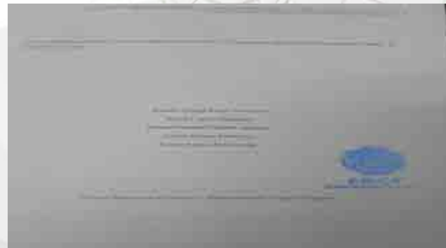
Encuentro Fiscal Universitario

Un equipo, integrado por 5 alumnos de la carrera de Contador Público, participó en el Encuentro Fiscal Universitario con el tema Análisis y Repercusiones Fiscales, Económicas y Ambientales del IEPS a Combustibles Fósiles en Gasolina. Este evento fue organizado por la Asociación Mexicana de Contadores Públicos de la Ciudad de México, A.C. (AMCP) y realizado en las instalaciones de esa honorable institución y con la participación de distintas universidades adscritas a la misma. Se obtuvo el quinto lugar, por debajo de la UNAM y la E.S.C.A. Santo Tomás; los estudiantes pusieron su mayor empeño, ya que su preparación fue de más de tres meses.