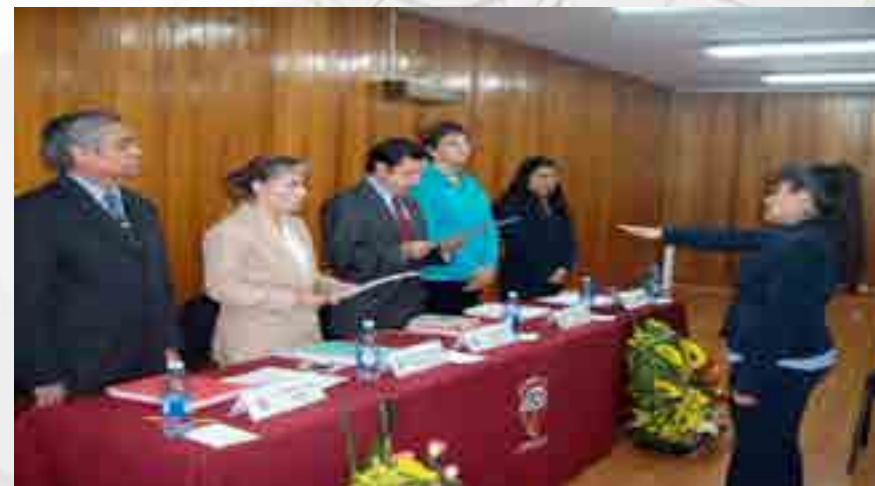
Toma de protesta de la alumna

En términos relativos, la formación de capital humano en los estudios de posgrado concluye en el momento que los estudiantes presentan examen para la obtención de diploma y grado académico. La graduación en la Sección fue de 47 alumnos egresados.