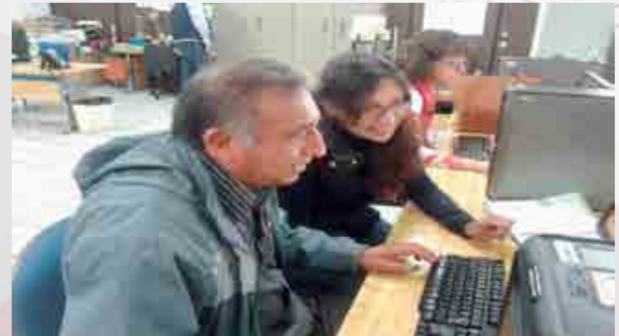
Revisión de Programas de Seminarios de Titulación