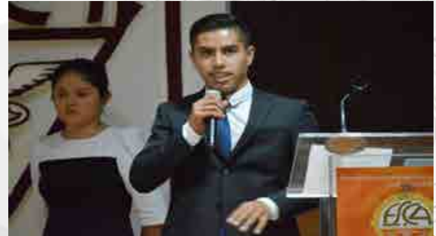
Proyecto Académico Interdisciplinario

Los estudiantes de la Licenciatura en Negocios Internacionales, ganadores del 1er. lugar en cada grupo, realizaron la presentación de los Proyectos Académicos Interdisciplinarios (PAI), con una importante participación en el Auditorio Lázaro Cárdenas. Como cada semestre, los alumnos de LNI realizaron trabajos de investigación, en donde los profesores de cada Unidad de Aprendizaje integran los conocimientos teóricos al desarrollo de competencias profesionales que se exigen en el mercado laboral. El PAI es una estrategia de aprendizaje idónea para lograr conocimientos significativos en los estudiantes y desarrollar las competencias profesionales señaladas en el Programa Académico de Negocios Internacionales. Lo anterior promueve la enseñanza situada, atendiéndose ésta como la experiencia de aprendizaje en el aula, lo más cercano posible a la realidad laboral a la que se enfrentará el egresado.