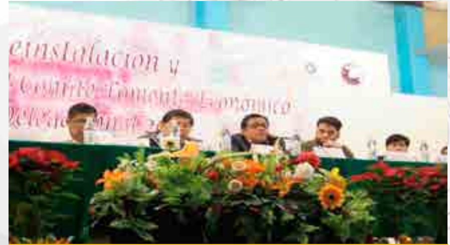
Reunión de trabajo con el Comité de Fomento Económico de Xochimilco

En el el Área de Posgrado del plantel se tiene relación de trabajo colaborativo con el sector productivo. En la vinculación con los sectores público, privado y social, se realizó trabajo colaborativo con la Dirección de Fomento Económico y Cooperativo de la Delegación Política de Xochimilco, la Secretaria del Trabajo y Previsión Social, Manpower y la Asociación Mexicana de Creatividad; con estos organismos se tuvo participación en los coloquios anuales “Innovamarketing y Seminario Web”.