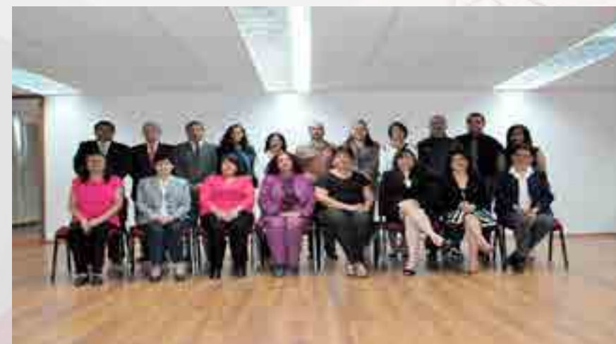
Diplomado en Formación en Competencias Tutoriales participantes