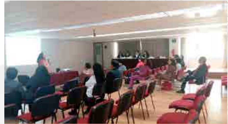
Reunión de Tutores

Se dio seguimiento a la acción tutorial de los períodos escolares 2015-1, 2015-2 y 2016-1, incluyendo la elaboración del Plan de Acción Tutorial, asignación de tutores, entrega y recepción de formatos de seguimiento, asesorías a estudiantes, informes finales y evaluaciones de tutores y tutorados, así como la elaboración y envío de constancias para validación de la Coordinación Institucional de Tutoría Politécnica (CITP). En total, fueron asesorados 1,366 alumnos. Se proporcionó asesoría y apoyo a los estudiantes que solicitaron inscribirse en el programa de alumnos asesores, se les asignó como asesores de las dos Unidades de Aprendizaje con mayor índice de reprobación, esto es Matemáticas para Negocios y Fundamentos de Contabilidad. En total fueron inscritos 5 alumnos que atendieron a 43 estudiantes. Se realizó el seguimiento de actividades de los alumnos tanto de estructura como de la Asamblea Legislativa del Distrito Federal (ALDF) durante los tres períodos polivirtuales del ciclo 2015-2 y los dos períodos desarrollados durante el semestre 2016-1. Se elaboró material visual para apoyo académico a los alumnos de la Modalidad No Escolarizada a través de plataforma.