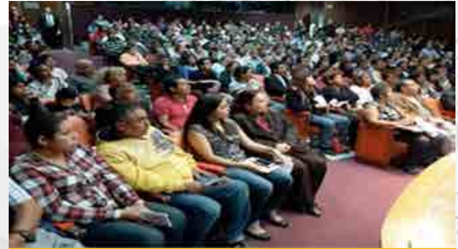
Reunión con padres de familia

Se llevó a cabo la reunión con los padres de los alumnos de nuevo ingreso los días 4 y 5 de septiembre de 2015 en el Auditorio “Lázaro Cárdenas del Río” con una asistencia de 746 padres de familia. Se impartió el curso taller “Escuela para Padres” 23ava Generación de septiembre a diciembre de 2015, para promover en el seno familiar ambientes saludables que beneficien y ayuden a nuestros educandos con una participación de 39 padres de familia.