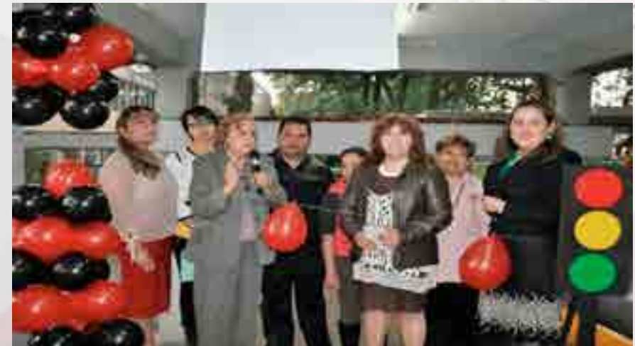
4to Foro Comercial de la Licenciatura en Relaciones Comerciales.