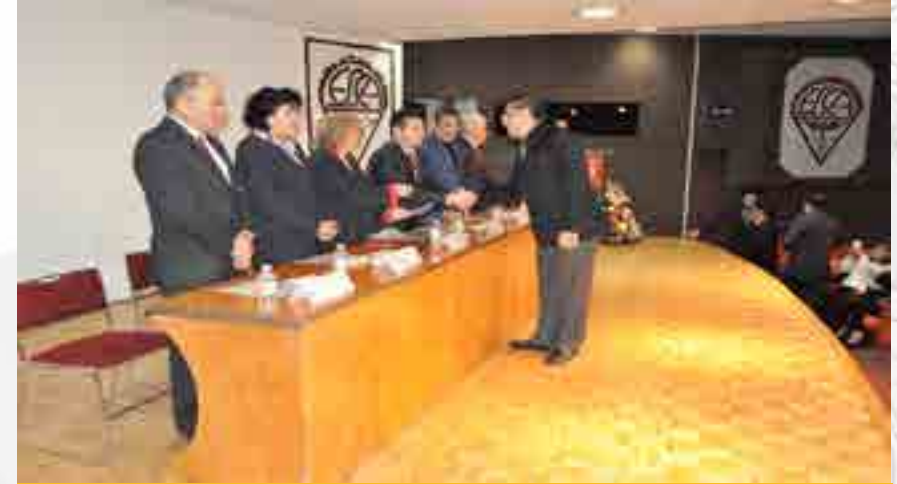
Evento de Egresados