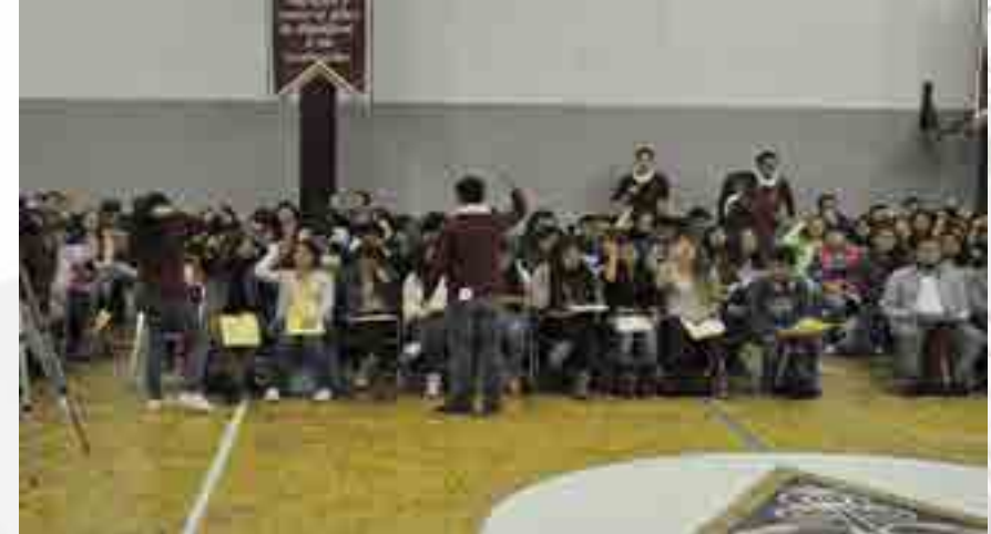
Alumnos en la semana de inducción

El Programa de Inducción se realiza dos veces al año, como lo estipula el plan de estudios vigente, el primer ingreso fue el 25 de marzo y el segundo, los días del 01 al 03 de septiembre de 2015, efectuándose el evento de bienvenida en ambos turnos a los alumnos de nuevo ingreso. Diferentes áreas académicas y de apoyo activamente participaron en la semana de inducción donde se atendió a 1190 alumnos de primer ingreso de los cuales 490 fueron de Contaduría Pública, 370 de Relaciones Comerciales y 330 de Negocios Internacionales. Se capacitó a 43 alumnos que fungieron como monitores para dar la bienvenida a los alumnos de nuevo ingreso en los meses de abril a junio para el ciclo escolar 2015/2016.