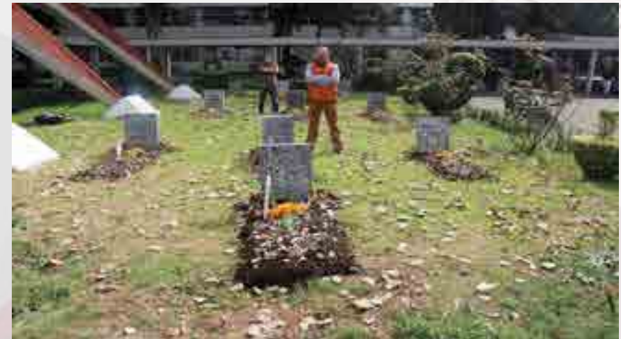
Celebración del Día de Muertos, panteón