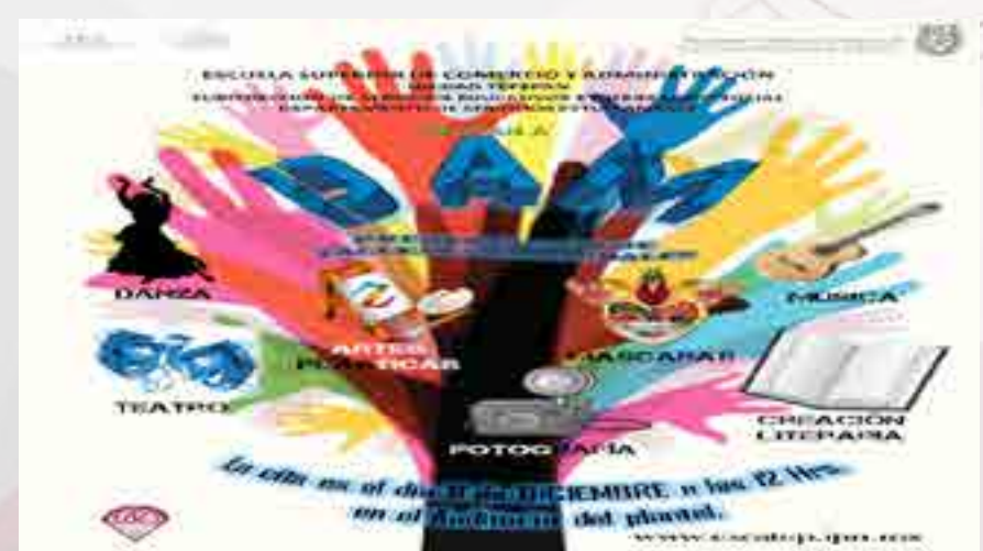
Presentación de talleres culturales