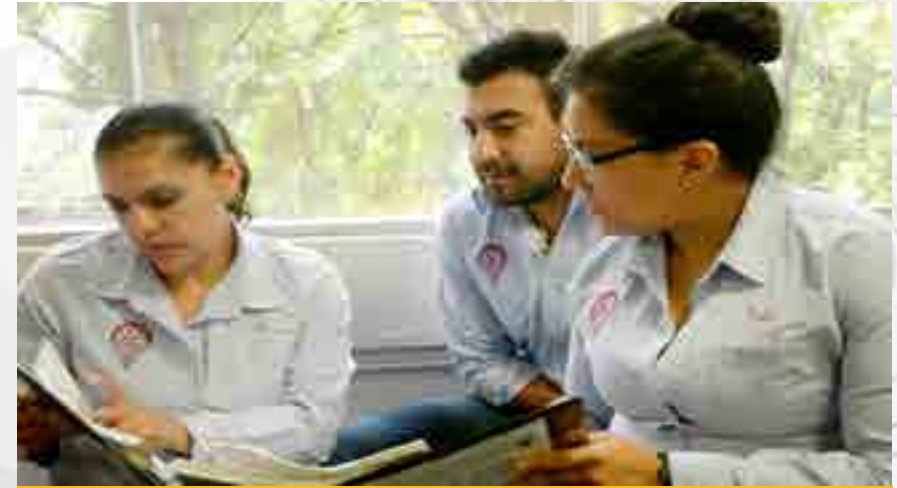
Integrantes de la Celda de Producción de Formación Básica Disciplinaria