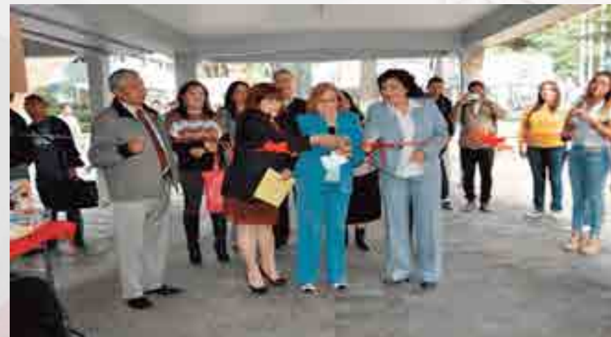
Semana de la Licenciatura en Relaciones Comerciales