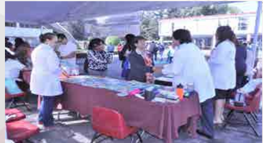
Día Internacional de la No Violencia Contra las Mujeres