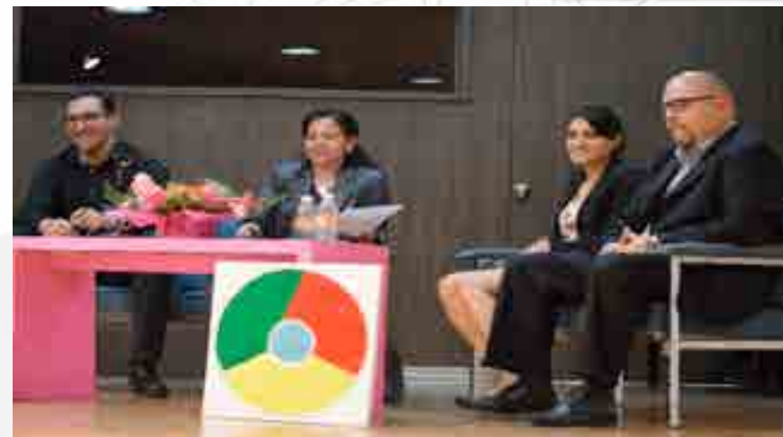
7a. Jornada de Negocios Internacionales

Se dictaron conferencias de “Negocios Inteligentes” con los siguientes temas: “Oportunidades en Negocios Creativos”, “Cómo llegar a los Insights del Consumidor”, “Oportunidades de Negocio de Alta Tecnología”, “Oportunidades en Negocios Electrónicos”, “Oportunidades en Negocios Verdes”, “Estrategías Exitosas en Emprendimiento”, y “Cómo convertirse en un empresario triunfador”.