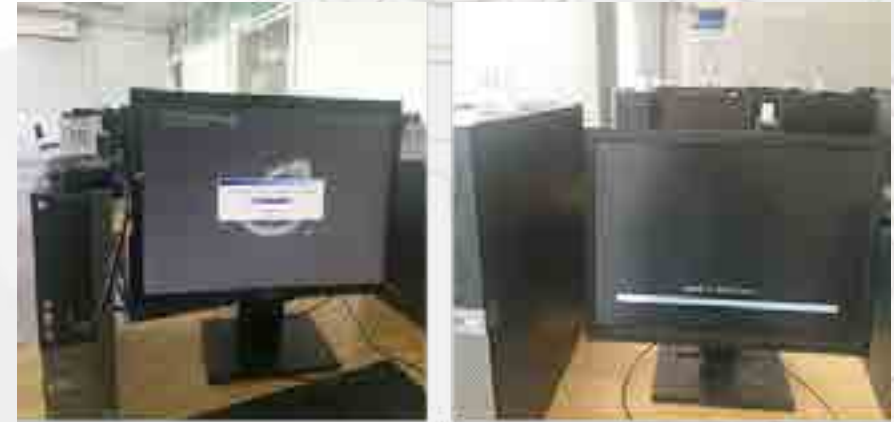
Mantenimiento en equipos de laboratorios de informática.

Se dio mantenimiento mensual en todo el año a 267 equipos en los laboratorios de cómputo y se clonaron 81 equipos en los laboratorios 1, 2 y 5 de la Unidad de Informática, así como los 96 equipos en salones de clase. Se recibieron, por donación por parte de la Comisión de Operación y Fomento de Actividades Académicas (COFAA), 200 licencias de “Contpaqi” y 840 licencias “Aspel” (168 de cada uno de sus sistemas). Adicionalmente, para mejorar el rendimiento en los equipos de cómputo de esta Unidad Académica se instalaron módulos de memoria RAM en diferentes equipos de cómputo de consulta y uso común para docentes y alumnos. Por otra parte, se instaló antivirus a 814 equipos de cómputo, antivirus proporcionado por la DCyC, también se instaló un total de 24 licencias de “Kaspersky Internet Security 2015” en equipos de subdirecciones y presidencias de academia.