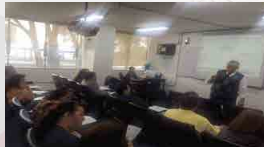
Curso Organización y conservación de archivos