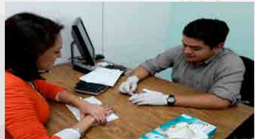
Examen de VIH