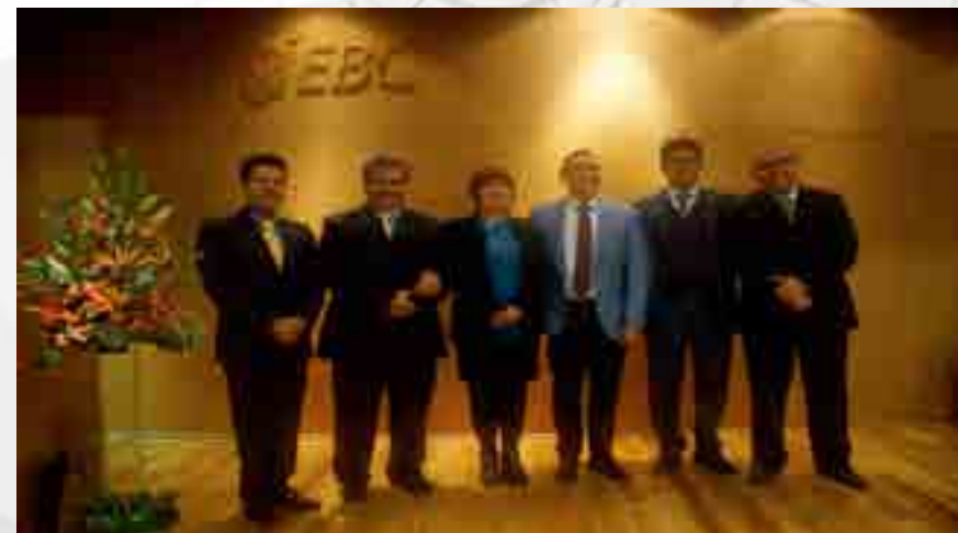
1er. Congreso de Negocios Internacionales

La Escuela Superior de Comercio y Administración Unidad Tepepan y la Escuela Bancaria y Comercial llevaron a cabo el 1er. Congreso de Negocios Internacionales, teniendo como objetivo el debate de temas de vanguardia y las oportunidades en el intercambio de bienes y servicios a nivel global. Durante el evento se señaló que para ser competitivos se requiere diferenciarse, responder a las necesidades y deseos de los consumidores, ofreciéndoles productos innovadores, que agreguen valor, a fin de conseguir la lealtad de aquéllos. Asimismo, se analizaron los tres factores de la competitividad: capital intelectual, cultura, y análisis de la competencia.