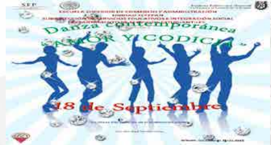
Danza Amor y Codicia

En el marco del Programa “Aliviánarte en tu escuela”, se llevaron a cabo presentaciones de danza contemporánea “Amor y Codicia”, así como “Un instante de miradas”, este último a cargo de la “Compañía Evolución de los Cuerpos”. Resultó muy gratificante tener esta muestra, ya que aparte de bailar, recitaron pequeños fragmentos de las obras del Marqués de Sade. Esas actividades culturales son parte de una serie de eventos para dar a conocer los diferentes tipos de artes que se encuentran dentro y fuera del Instituto.