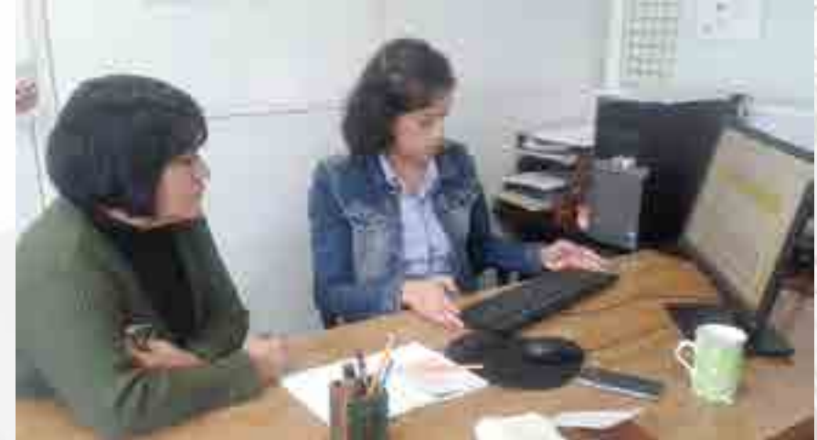
Revisión de Planeaciones Didácticas

Se revisaron, desde el punto de vista didáctico pedagógico 173 Planeaciones Didácticas Tipo. Se llevó a cabo el proceso de evaluación diagnóstica del estudiantado, de los semestres lectivos, 2015/2 y 2016/1 utilizando la plataforma educativa institucional Moodle. El procedimiento se inició revisando y colocando en la plataforma institucional los reactivos de 122 unidades de aprendizaje que se ofertaron en los períodos escolares. La aplicación cubrió el 30 % aproximadamente, de la población estudiantil y posteriormente, este departamento proporcionó los resultados de dicha evaluación a los docentes de acuerdo a los grupos en los que impartieron clases. A partir de los resultados de la evaluación diagnóstica, los docentes elaboraron su planeación didáctica específica bajo la asesoría didáctica pedagógica de este departamento. Se revisaron 209 planeaciones.