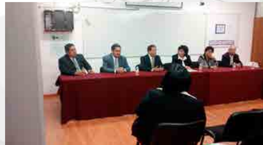
Reacreditación del Programa Académico de Contador Público

Se realizaron los trabajos para la Reacreditación del Programa Académico de Contador Público que incluye: la capacitación del personal a cargo, la recopilación de evidencias y la conformación del instrumento armonizado del Consejo de Acreditación en Ciencias Administrativas, Contables y Afines (CACECA), la logística para la evaluación y la atención de los evaluadores, quienes visitaron las instalaciones y la recepción del Dictamen con un puntaje de 920.22.