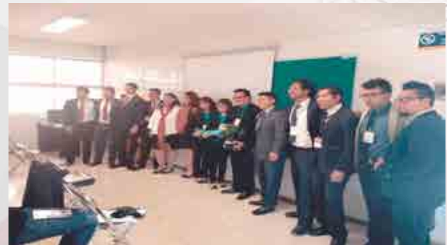
Semana del Emprendedor ANFECA