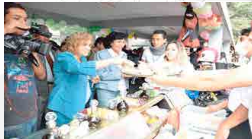
Celebración del 49 Aniversario de la LRC

Se realizó la semana del 49 Aniversario de la Licenciatura en Relaciones Comerciales (LRC), donde a lo largo de dicha semana se llevaron a cabo actividades académicas y culturales contando con la participación de conferencistas, talleristas, promotores culturales y empresas que enriquecieron el evento. Se realizaron 8 conferencias, 4 talleres académicos, 1 plática de emprendedores y 1 maratón de marketing, con la participación aproximada de 3,880 asistentes. A lo largo de esta semana, conferencistas, en su gran mayoría Licenciados en Relaciones Comerciales, compartieron una serie de conocimientos y herramientas que permitieron enriquecer la formación profesional de los alumnos, todo ello a través de ofrecerles herramientas de vanguardia y otras esenciales de desarrollo humano.