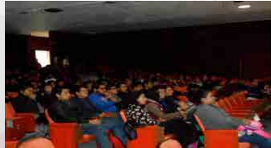
1era. Semana de la Contaduría Pública