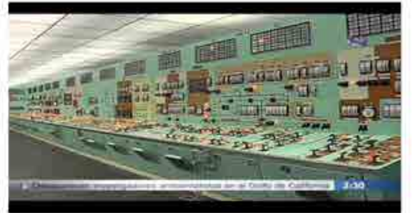
Sala de controles de la Central Nuclear.