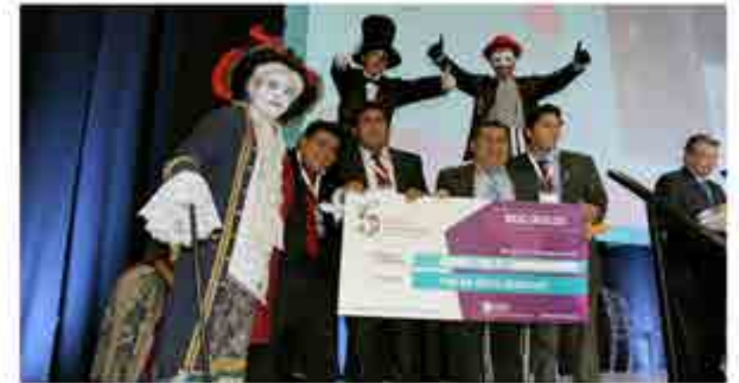
Alumnos obtuvieron el primer lugar en el evento Poliemprende.