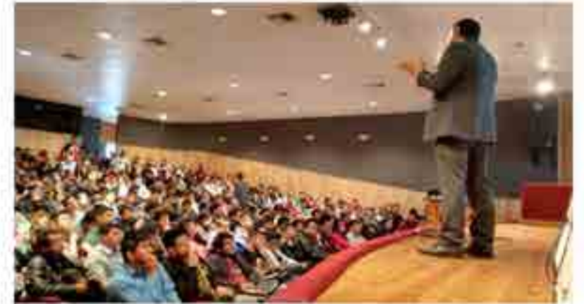
Curso de inducción para alumnos de nuevo ingreso.

Se participó en el curso de inducción a alumnos de nuevo ingreso del periodo 2016. La participación del Departamento de Gestión Escolar en el curso a los alumnos de nuevo ingreso, ayudó a que los nuevos integrantes de la comunidad estudiantil de la ESIME Unidad Culhuacán, conocieran el departamento de primer contacto y la importancia en su trayectoria académica y conocieron sobre la realización y gestión de trámites concernientes a su inscripción, reinscripción y el Reglamento General de Estudios.