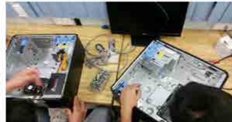
Actualización de 150 equipos.

Se actualizan 150 equipos con las refacciones proporcionadas a lo largo de todo el año, quedando con las siguientes características: procesador multicore 4 GHz 8 GB Ram y 1 TB de disco duro.