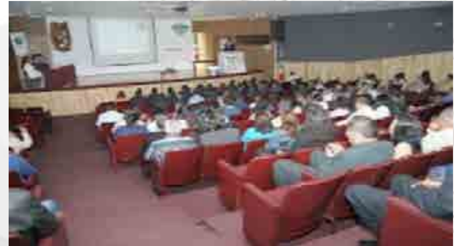
Asesoría para la titulación.

Se atendieron 5,253 personas en la ventanilla, de las cuales algunas acudieron para asesoraría con respecto a las opciones de titulación que tienen, algunas otras para enterarse del avance de su trámite y otras para recoger acta de titulación.