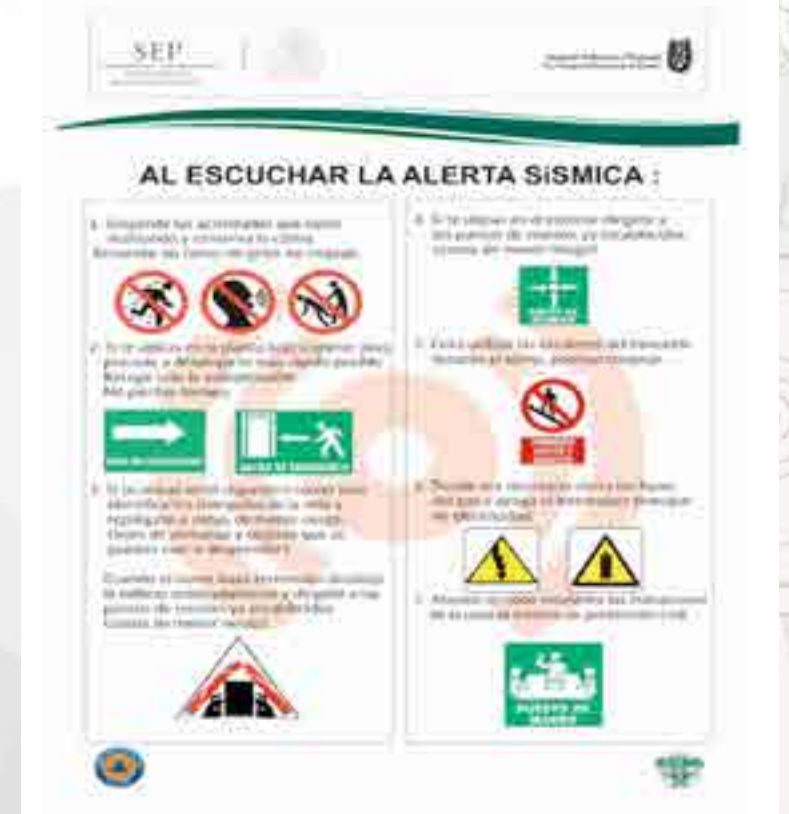
Cartel de acciones a seguir al escuchar la alerta sísmica.

Se realizó el diseño del contenido informativo de Protección Civil; se solicitó al departamento de Extensión y Apoyos Educativos la realización del diseño gráfico y a la Subdirección de Servicios Educativos e Integración Social la gestión ante el departamento de Comunicación Social del IPN, así como a la Subdirección Administrativa la creación e instalación de los mensajes, 67 en toda la Unidad Profesional.