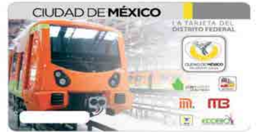
Proyecto de Tarjeta de acceso al sistema de transporte metro.

Se logró concretar el convenio para el proyecto vinculado denominado “Consultoría técnica y logística de captura, impresión y grabado de tarjetas sin contacto para el programa de libre acceso en las instalaciones del Sistema de Transporte Colectivo Metro”, desarrollado por alumnos de esta Unidad Académica.