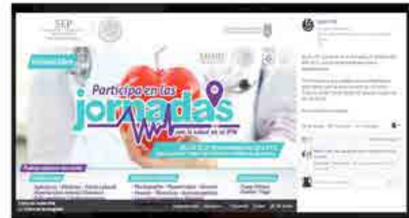
Transmisión en Radio de la Jornada de la Salud.

La estación de Radio ubicada en esta Unidad Académica, realizó los enlaces en vivo durante la programación de la emisora, en las que se realizaron entrevistas a los especialistas participantes. Asimismo en cada transmisión se brindaba información en materia de salud y por supuesto, se dieron a conocer todas las actividades de la jornada.