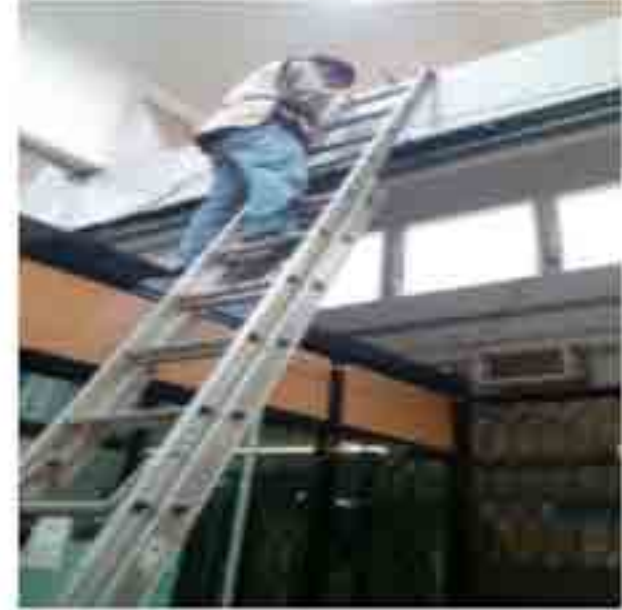
Colocación de campanas para alertamiento sísmico.

Se realizó la ampliación del sistema de alertamiento sísmico, mediante la instalación de 9 campanas y su respectivo cableado para ampliar la cobertura, en los edificios de laboratorios ligeros (2), laboratorios pesados (3), mantenimiento y servicios (1), gimnasio (1), recursos materiales (1) y librería (1). Instalación de nueve campanas adicionales a las 14 previamente existentes.