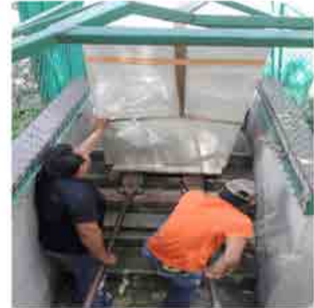
Instalación del Sistema de Suministro Ininterrumpido de Energía (UPS).

Con el fin de proporcionar un mejor servicio de energía y mantener los equipos en buenas condiciones se realizó la colocación de un Sistema de Suministro Ininterrumpido de Energía (UPS) y se ubicó en la cúpula-sótano, que se encuentra a un costado de la cafetería y cuya función es mantener la energía cuando se vaya la luz, en tanto arranca la planta de luz.