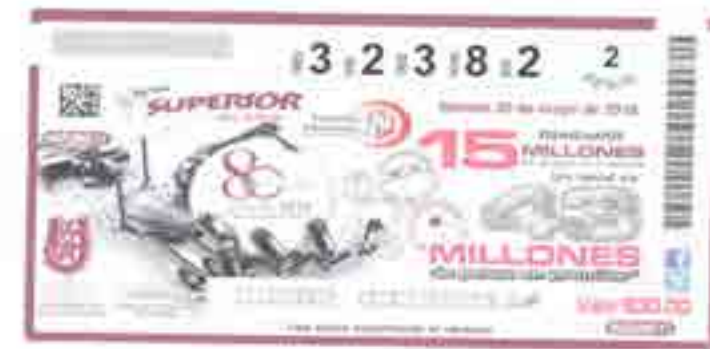
Billete premio mayor.