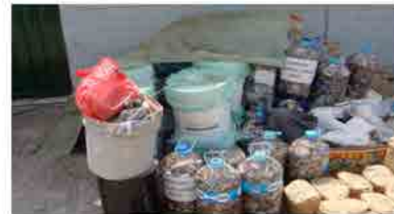
Residuos para reciclar evitando contaminar el medio ambiente.

Se realizó la “Jornada de Acopio de Residuos Electrónicos”, la cual se hace con la finalidad de que la comunidad haga conciencia del cuidado al medio ambiente y recicle estos artículos evitando contaminar. Aquí se pudieron recolectar: teclados, teléfonos fijos, celulares, cargadores, entre otros.