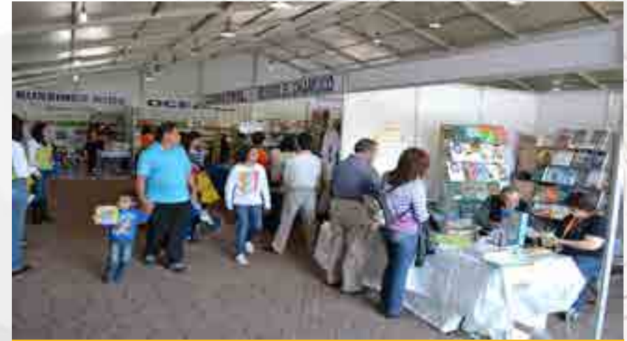
XXXIV Feria del Libro IPN.

La estación de Radio de esta Unidad Académica realizó la cobertura con transmisiones de algunas producciones como Mexicanísimo, Rock Azteca, Infopolitécnico y enlaces totalmente en vivo. En ellas, se llevaron a cabo entrevistas con autores e investigadores invitados y por supuesto, la continua invitación a la audiencia a participar y visitar la edición 34 de la FIL IPN.