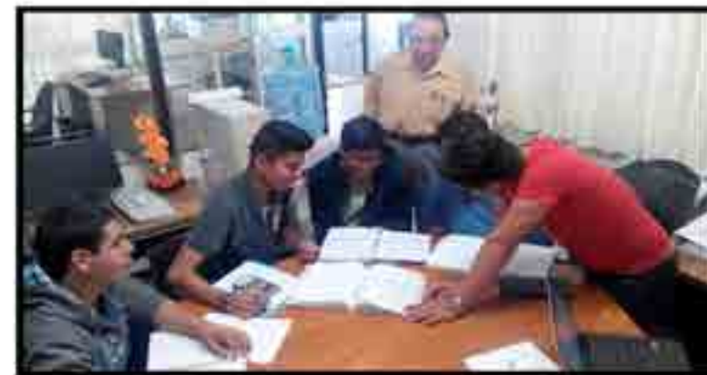
Asesoría en Ciencias Básicas.

Porcentaje de aprobación de exámenes : 93 %