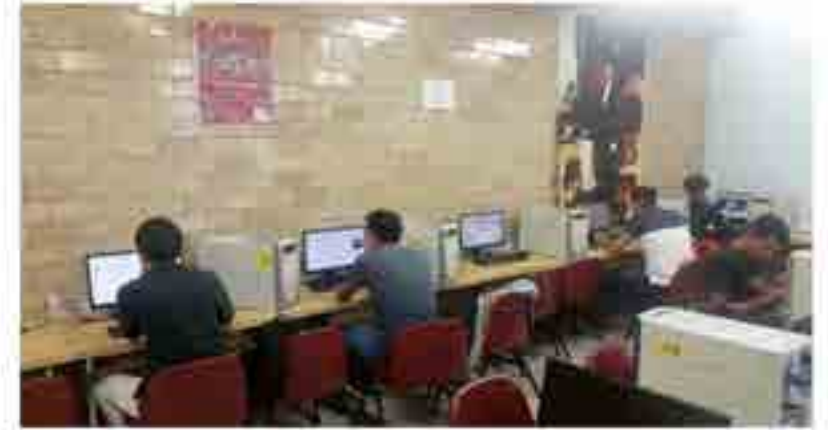
Curso de actualización Java.

La escuela ofrece cursos de certificación en las tecnologías Java, los cuales son impartidos por el canal certificado de la empresa Oracle Develop y ofrecen hasta un 70% de descuento para los estudiantes como parte del programa gubernamental México First .