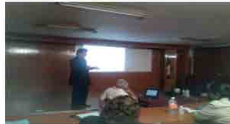
Diplomado de formación de competencias tutoriales.

Se gestionó con la Coordinación Politécnica de Tutorías del IPN, el Diplomado de Formación en Competencias Tutoriales, realizando diversas actividades de coordinación y logística para el ingreso al mismo, se registraron 21 docentes participantes y concluyeron 14 profesores de esta Unidad Académica.