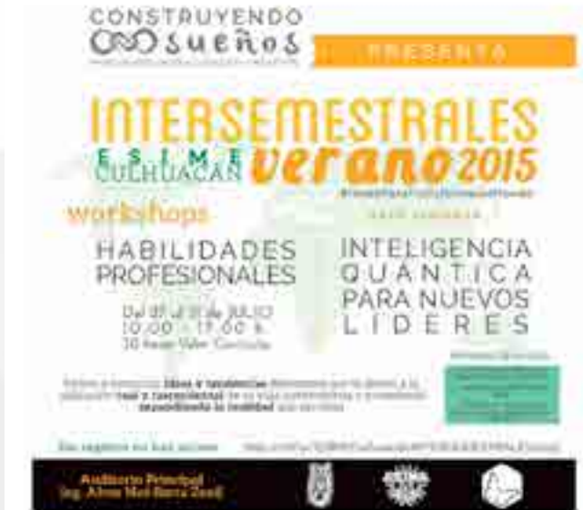
Publicación de cursos intersemenstrales de verano.

Se realizaron cursos que permiten formar de manera integral, impartiendo temas complementarios a la Ingeniería, dirigidos a personas externas y que pertenecen al IPN. Se impartieron de 10:00 a 17:00 horas, con una asistencia de 202 asistentes, de 14 a 55 años con nivel de estudio desde secundaria a Nivel Maestría de 69 escuelas diferentes, 31 de ellas del IPN, de las cuales 10 de CEcyT's y 21 escuelas de Nivel Superior.