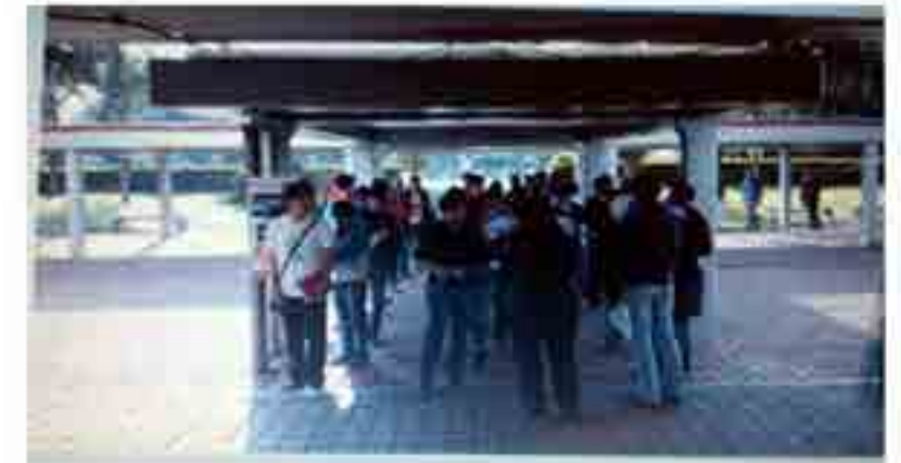
Alumnos en proceso de reinscripción.