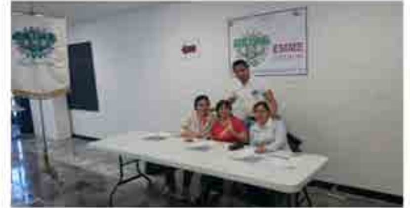
Recepción de documentación para alumnos de nuevo ingreso.

En el periodo de Inscripción 16/1, se recibió la documentación oficial de los aspirantes, inscribiendo a un total de 832 alumnos de nuevo ingreso en las cuatro carreras de esta Unidad Académica, asignándoles grupo y turno en las cuatro carreras, siendo para la carrera de Ingeniería en Sistemas Automotrices 63 alumnos, 245 para la carrera de Ingeniería en computación, en la carrera de Ingeniería Mecánica se recibieron 193 y para la carrera de Ingeniería en Comunicaciones y Electrónica 331, lo que hace un total de 832 alumnos de nuevo ingreso.