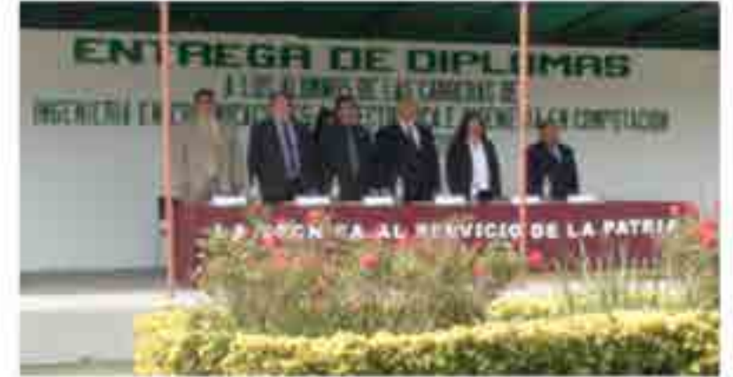
Videograbación de la entrega de diplomas.

Con el fin contar con un acervo videográfico de los diferentes eventos realizados durante el año, se realizó la videograbación de los eventos académicos, culturales y cívicos institucionales de la Unidad Académica y su correspondiente edición, producción y archivo.