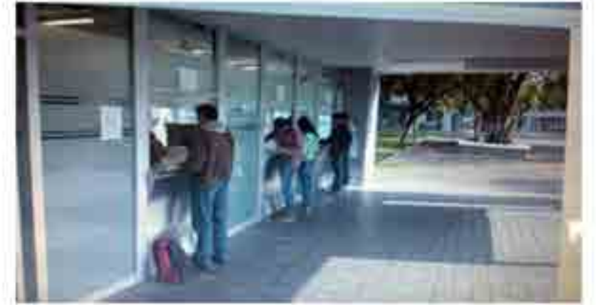
Alumnos en ventanilla para reinscribirse.

Ingeniería en Comunicaciones y Electrónica: 1,751 alumnos.