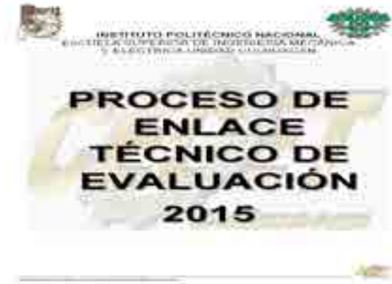
Proceso de Enlace Técnico de Evaluación.