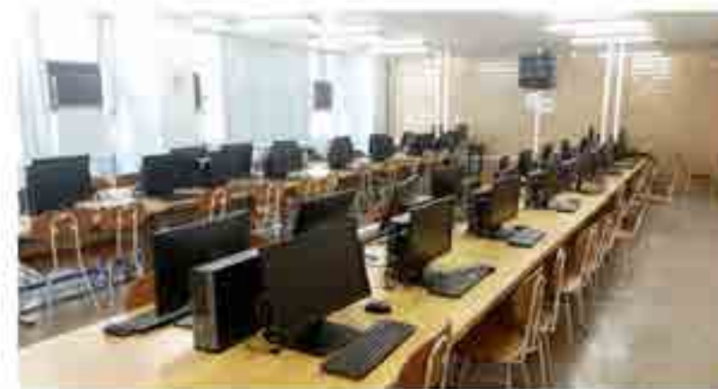
Reemplazo de 90 monitores para el área de la Unidad de Informática.