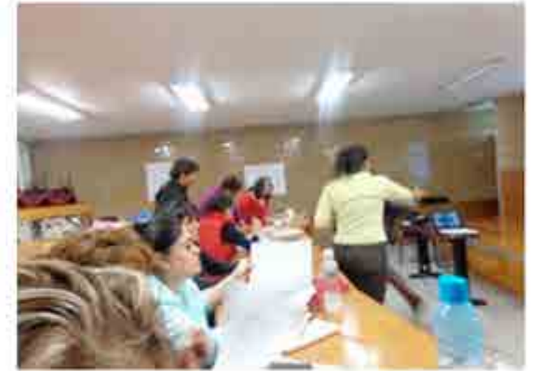
Curso de capacitación trabajo en equipo.

Se gestionó con la Coordinación de General de Formación e Innovación Educativa los siguientes cursos: Como relacionarse entre compañeros, Trabajo en equipo, Organización y Conservación de archivos, Sensibilizar a la comunidad en materia de discapacidad, también se apoyó a la Coordinación de enlace y Gestión Técnica en la logística para la impartición de cursos del Sistema de Gestión de la Calidad.