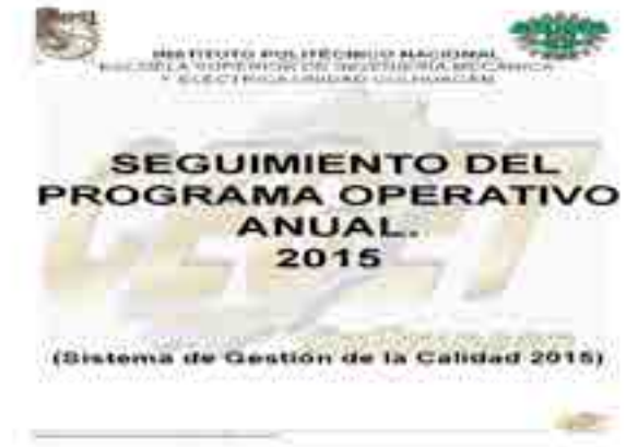
Seguimiento del Programa Operativo Anual 2015

Conclusión de la captura del Programa Operativo Anual.