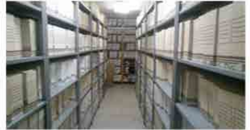
Remodelación del Archivo Histórico.

Se realizaron las gestiones correspondientes ante la Dirección de Recursos Financieros para la solicitud y el registro del proyecto de remodelación del archivo histórico, con el fin de preservar el acervo histórico recopilado desde la fundación de esta institución.