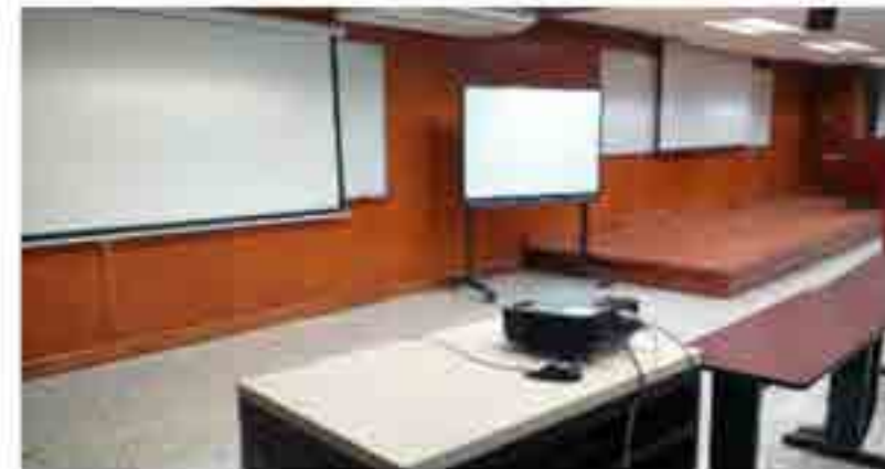
Restauracion del Aula Siglo XXI.

Se realizaron las gestiones para la reparación de daños generados por lluvias del año 2013, actualización de hardware de 31 equipos de cómputo, instalación de cortinas nuevas, retapicería de sillas, instalación de dos equipos mini-split de aire acondicionado, llevándose a cabo dichas actividades y actualmente se cuenta con el aula "Siglo XXI" acondicionada y con equipo actualizado.