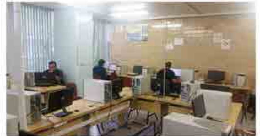
Curso de actualización java 2.