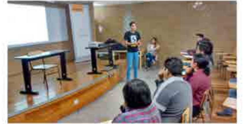
Visita de la empresa Continental.

Presentación del plan de desarrollo para becarios en ingeniería que ofrece la Empresa Continental the Future in Motión . El personal acreditado por la empresa impartió una conferencia del papel que la ingeniería juega en desarrollo de nuevas tecnologías que permiten a los automóviles ser más seguros, ello con la actividad interdisciplinaria de los profesionales en las distintas ramas de la ingeniería. Expuso el proyecto que desarrolla la empresa, para permitir la inserción laboral de egresados y alumnos en los semestres terminales e incluirlos en sus programas de becarios en entrenamiento a distintos niveles. Aplicando para el programa de ingenieros en entrenamiento varios egresados y alumnos del último semestre de esta Unidad Académica.