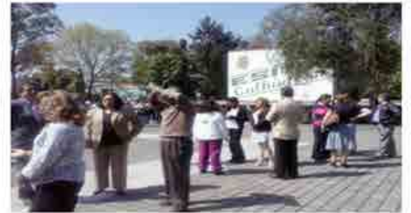
Participación en el Macrosimulacro.

La Unidad Interna de Protección Civil, realizó cada trimestre simulacros de sismo e incendio, para generar conciencia en la comunidad, saber como actuar en caso de una incidencia. Se realizó y supervisó el Macrosimulacro de sismo con una participación de 3,806 participantes, en ambos turnos.