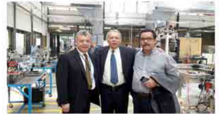
Visita de egresados en el 40 aniversario de la ESIME Culhuacan.

Egresados de las generaciones 1980 y 1984 de las carreras de Ingeniería Mecánica e Ingeniería en Comunicaciones y Electrónica, visitaron los diferentes laboratorios de la Unidad Académica para conversar sobre la posibilidad de realizar un esfuerzo y captar donaciones dirigidas a los laboratorios resaltando el de robótica.