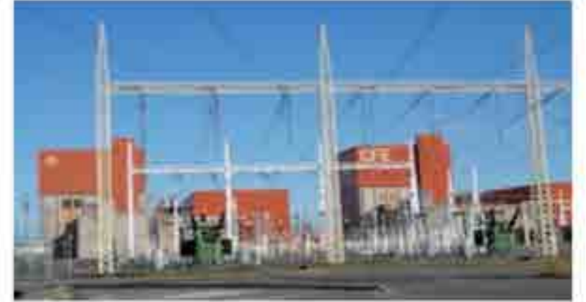
Central Nuclear Eléctrica 1.

Se realizaron 39 visitas escolares a las empresas: Hidroeléctrica La Yesca, Central Nucleoeléctrica Laguna Verde, General Motors, Volkswagen y Cervecería del Pacífico, con la participación de 811 alumnos y 45 docentes.