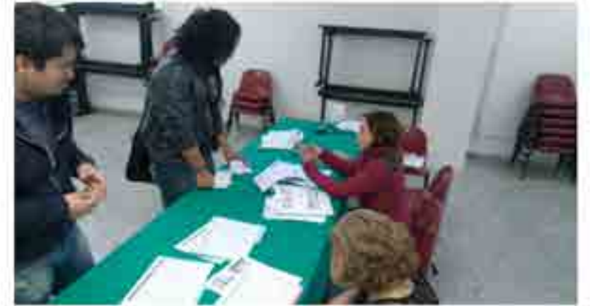
Proceso de otorgamiento de Becas.

De acuerdo a la Convocatoria de becas vigente para el ciclo académico 2015-1 y 2015-2 para los diferentes programas de beca que oferta el Instituto Politécnico Nacional, se llevó a cabo en apego al cronograma establecido por la Dirección de Servicios Escolares (DSE) la recepción, revisión y análisis de las solicitudes presentadas por nuevos candidatos a becarios, validantes y revalidantes. Beneficiando durante este proceso a un total de 2,914 alumnos inscritos en los distintos programas académicos que se imparten en esta Unidad Académica.