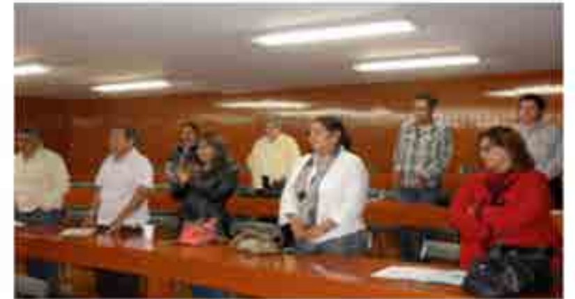
Estímulos al Personal Docente.

El objetivo institucional es favorecer la superación, estructura y nivel académico, profesionalizar las funciones de docencia e investigación, preservar y fortalecer la unidad institucional del personal académico y ofrecer mejores condiciones de trabajo y niveles de percepciones mediante los diferentes procesos de promoción obteniendo una participación total en estos procesos de: promoción docente: 38 profesores y evaluación de categoría: 30 profesores.