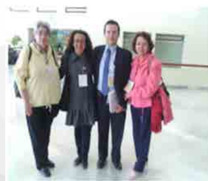
Participantes en el décimo encuentro de tutorías.

Se realizó la presentación de resultados de investigaciones docentes de la Unidad Académica en torno a la Tutoría. En el Encuentro de Tutoría del IPN, se presentaron ocho ponencias productos de las investigaciones de los docentes, un cartel y participaron como asistentes 23 profesores de la Unidad Académica.