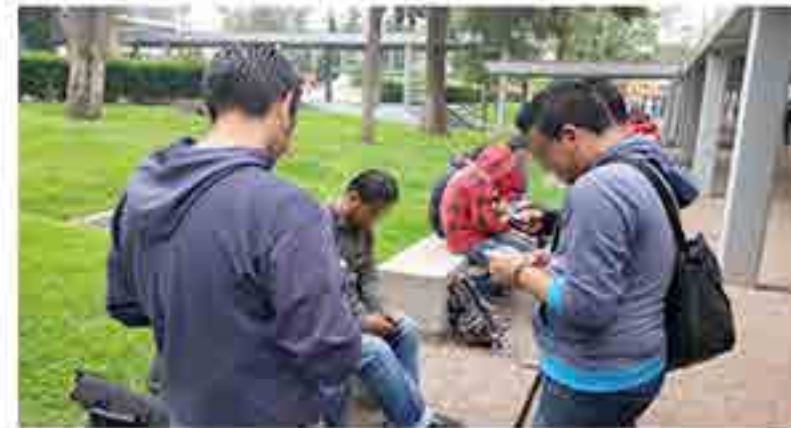
Disponibilidad de internet en espacios abiertos de la Unidad Académica.

Se realizó la instalación y configuración de puntos de acceso a exteriores que alimentan antenas omnidireccionales para dar cobertura en andadores y jardineras de la escuela y con ello los estudiantes tengan acceso a internet en estas áreas.