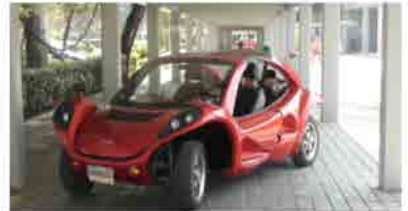
Videograbación del auto diseñado y armado por alumnos.