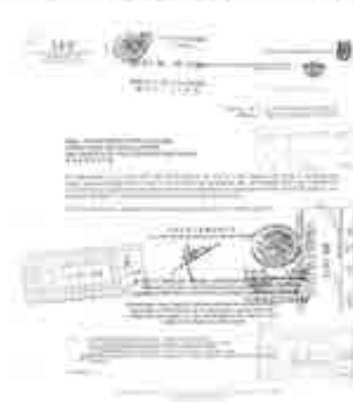
Cierre de captura del proceso de evaluación.

Se realizaron los procesos correspondientes a la Evaluación como son la Información Estadística del Formato SEP 912, Formato SEP 911.9, 911.9A, 911.9B; Estadística Institucional de inicio y fin de los ciclos escolares 2014-2015 y 2015-2016, Estadística Institucional de Inicio y fin de los ciclos escolares 2015-2016 y 2014-2015, Estadística Institucional 2014-2015, Estadística Básica, Anuario General Estadístico y Formato 911 de la SEP.