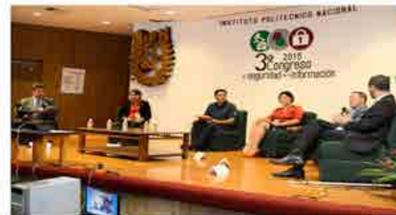
Transmisión en vivo del Congreso de Seguridad Informática por la Unidad de Informática.

La Unidad de Informática realizó la transmisión en directo del 3er. Congreso de Seguridad Informática así mismo se realizan la publicación de las conferencias realizadas en los dos días que duró el evento.