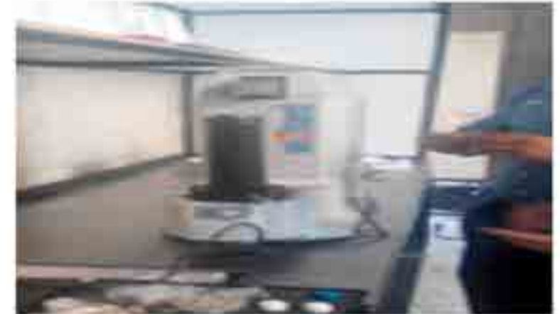
Durómetro Mitutoyo .