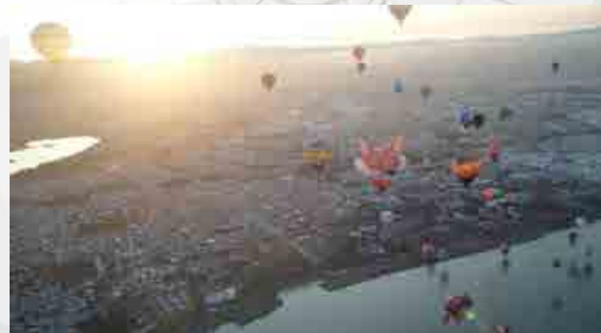
Transmisión del Festival Internacional del Globo por la Estación del Radio.

La estación de Radio ubicada en esta Unidad Académica realizó los enlaces, durante la transmisión de diversas producciones como: “Pase a la cultura”, “Al ritmo del sabor”, “Rastrack”, “Buenas Noches Gente”, desde León, Guanajuato, sobre las actividades, talleres, conciertos relacionados con la aerostación.