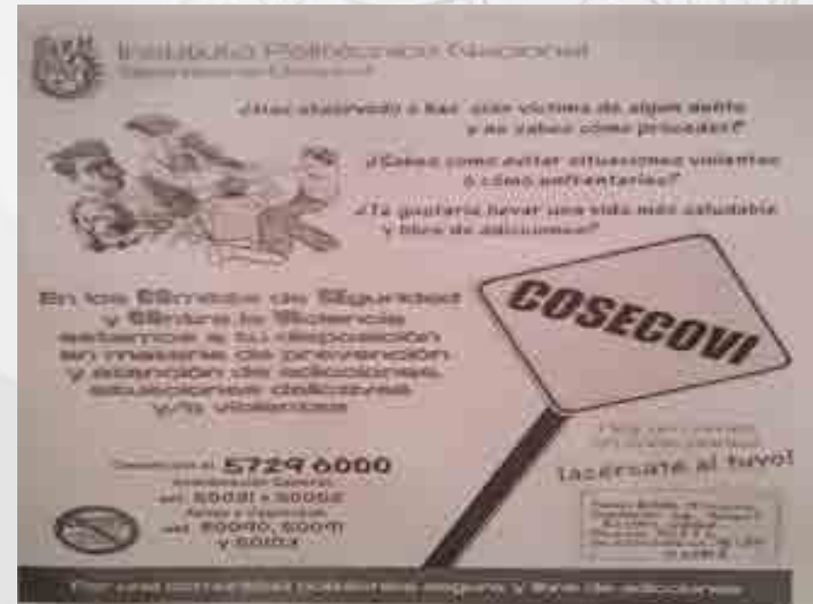
Cartel de COSECOVI.

Se ha mantenido la postura sobre la difusión de la campaña contra el humo del tabaco en lugares cerrados y se promovió la señalización en salones y oficinas, en el plantel. Se obtuvieron 5 luminarias de celdas solares que ya están en funcionamiento.