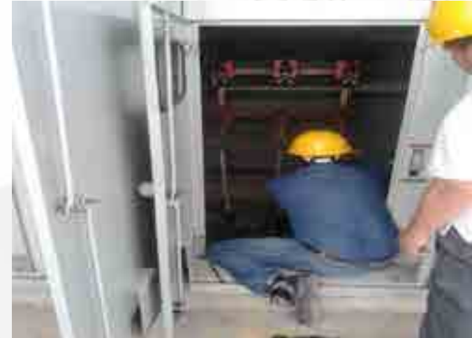
Instalación de luminarias.

Se instalaron lámparas led con tecnologías amigables con el medio ambiente mediante el aprovechamiento de la energía solar.