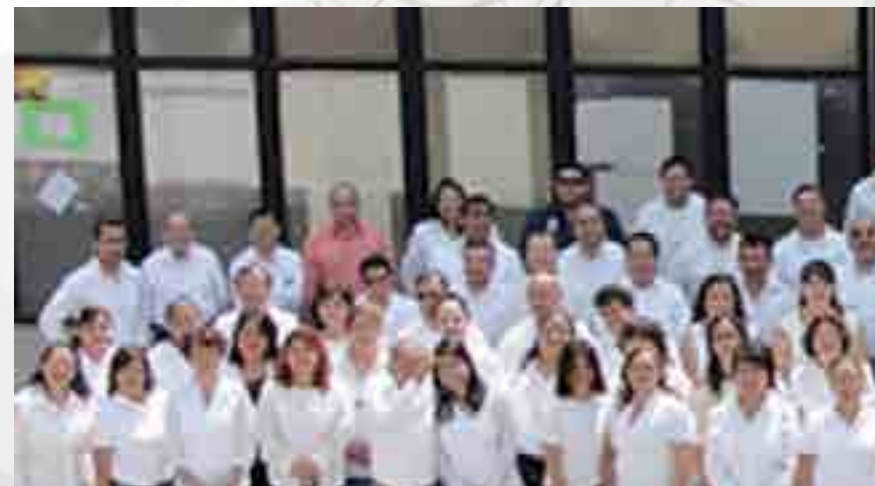
25 Aniversario ESIME Ticomán.

Se celebró el evento del XXV Aniversario de la Escuela Superior de Ingeniería Mecánica y Eléctrica (ESIME) Ticomán, con una ceremonia y un concierto con la Orquesta Sinfónica del IPN (OSIPN), realizado en el Centro Cultural “Jaime Torres Bodet” en la Unidad Profesional Adolfo López Mateos, Zacatenco, proyectándose el video titulado “25 Años de Historia de la ESIME Unidad Ticomán”, posteriormente se realizó la entrega de reconocimientos a los exdirectores de la escuela, así como la ceremonia protocolaria para la cancelación del Timbre Postal de ESIME Ticomán; y por último el Concierto de la Orquesta Sinfónica del Instituto Politécnico Nacional en honor al Aniversario de ESIME Ticomán.