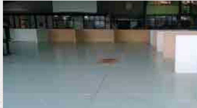
Total de mamparas reparadas.