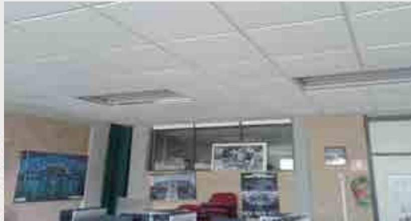
Reparación de la estructura metálica.