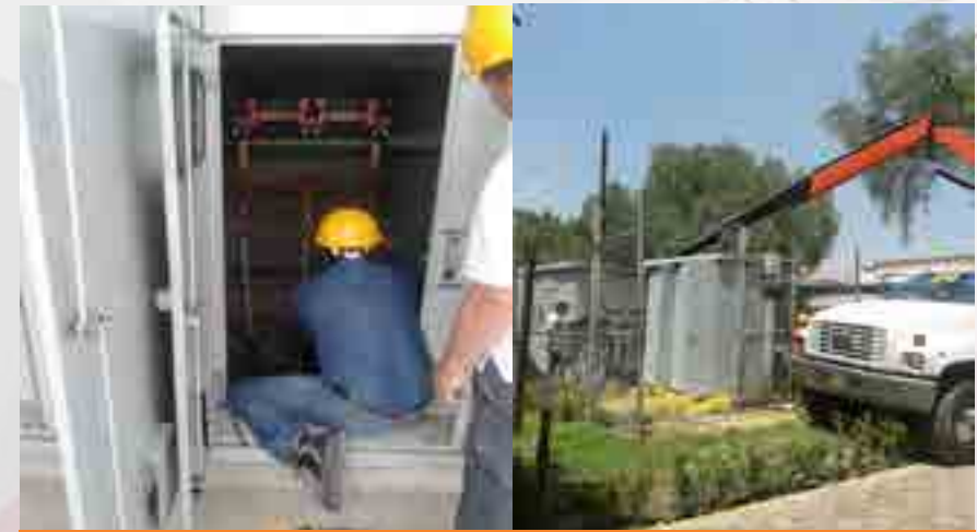
Mantenimiento de la subestación.