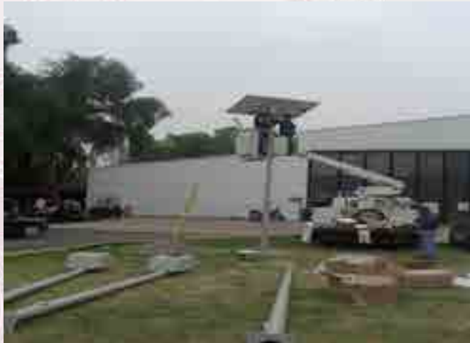
Instalación de lámpara de led