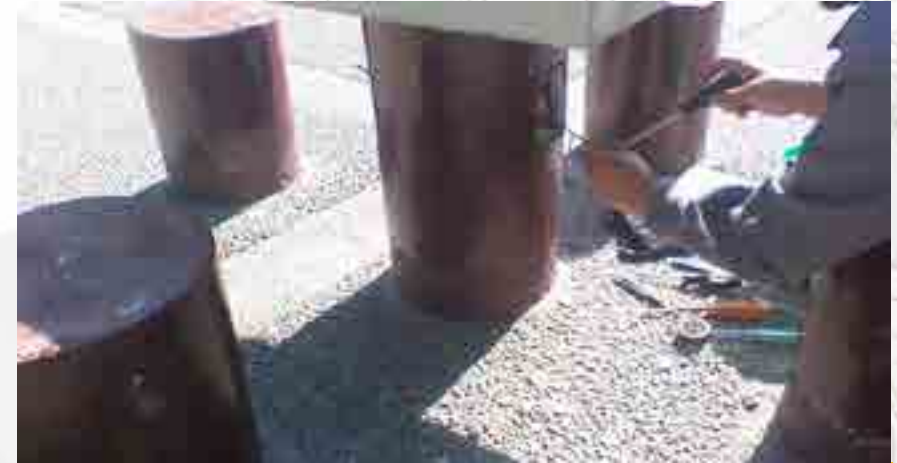
Reparación de contactos.