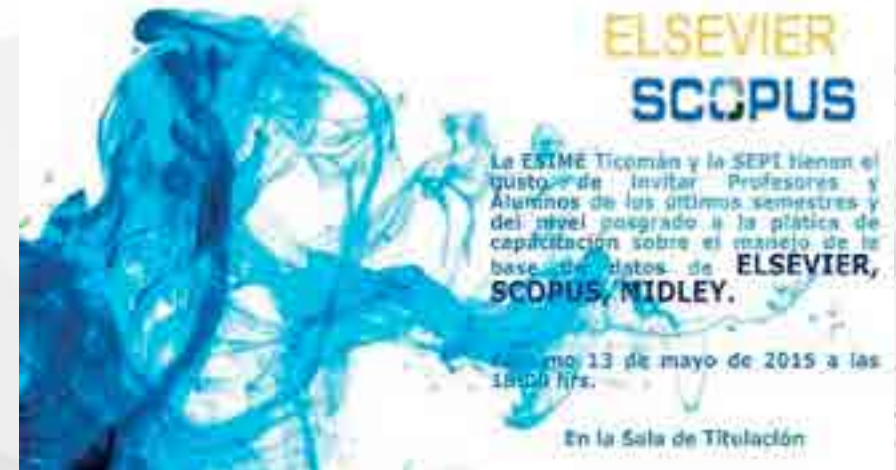
Plática de Capacitación.