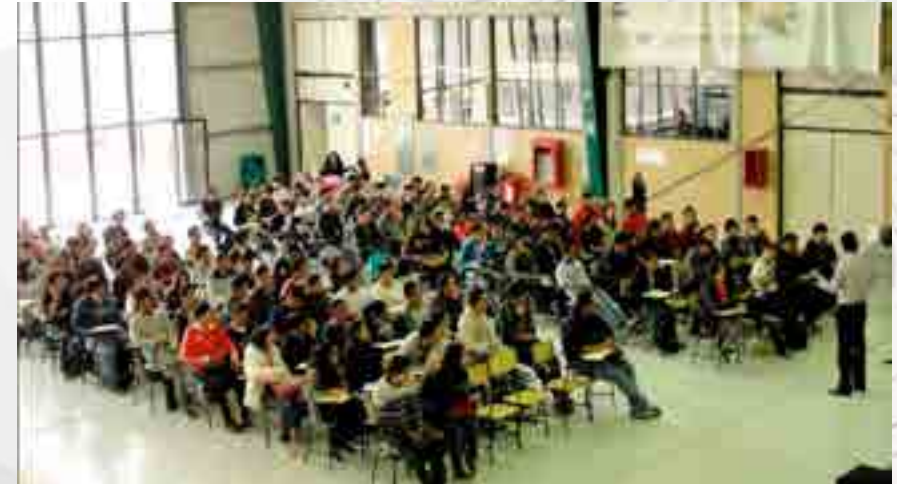
Semana de inducción.

Se llevó a cabo la Semana de inducción, donde alumnos de primer ingreso conocen la Unidad y comienzan a ubicar las instalaciones, aproximadamente 125 alumnos llegaron por primera vez a la Escuela Superior de Ingeniería Mecánica y Eléctrica (ESIME) Ticomán, fueron recibidos en el Hangar con una ceremonia de inauguración programada especialmente para ellos, dándoles la bienvenida el Director de la Unidad.