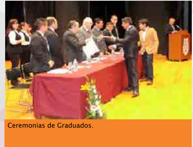
Ceremonias de Graduados.