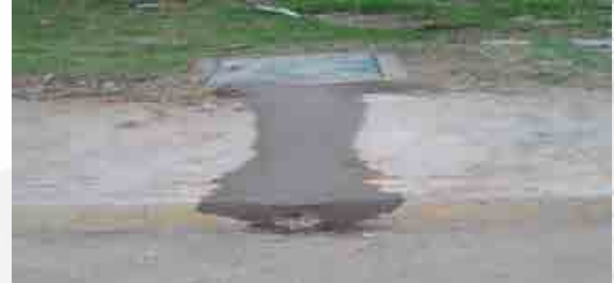
Limpieza y reparación de conductos de desagüe.