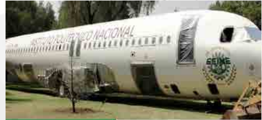
"Aterrizaje Exitoso del Airbus A320 en ESIME Ticomán"