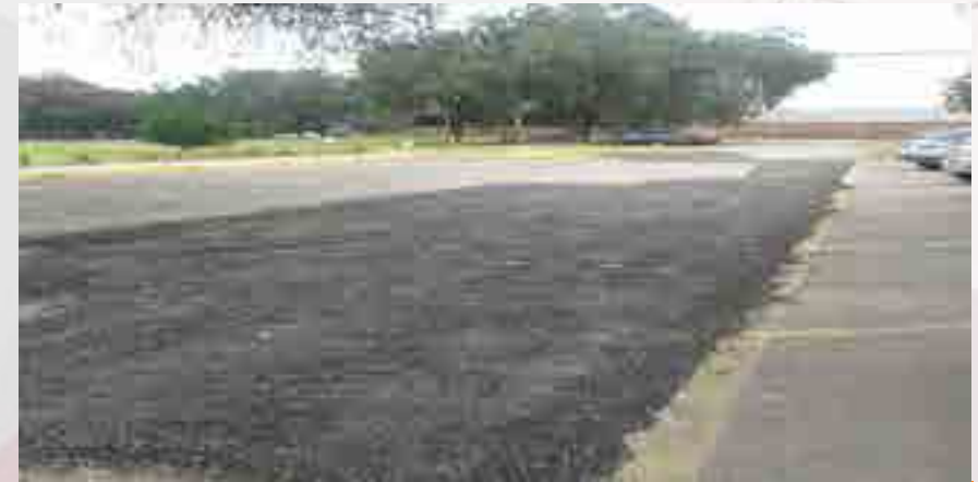
Reparación del estacionamiento.