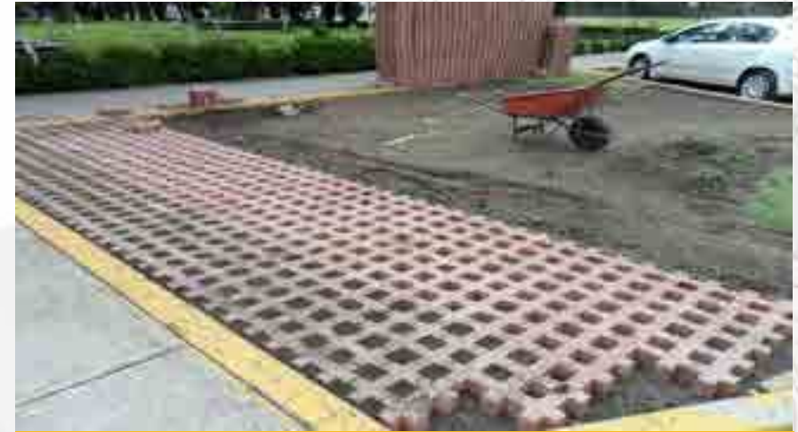
Nivelación mediante tepetate y tezontle.