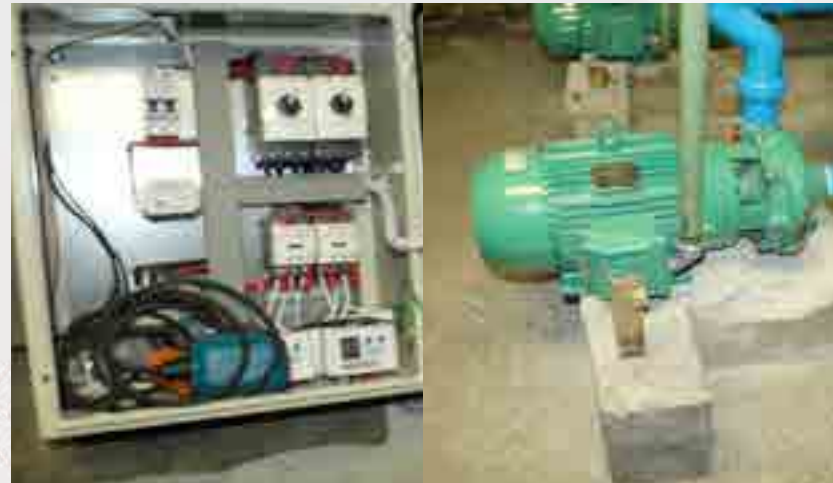
Limpieza y reparación de conductos de desagüe.