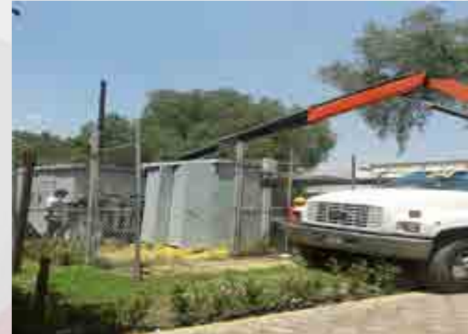
Instalación de centro de carga.