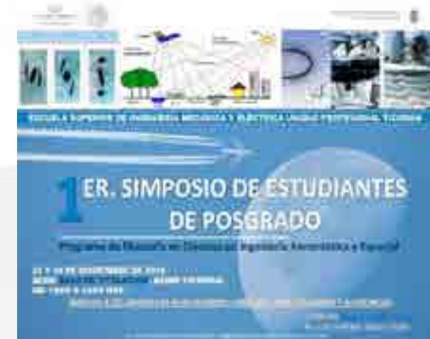
Cartel del Simposio de Posgrado.