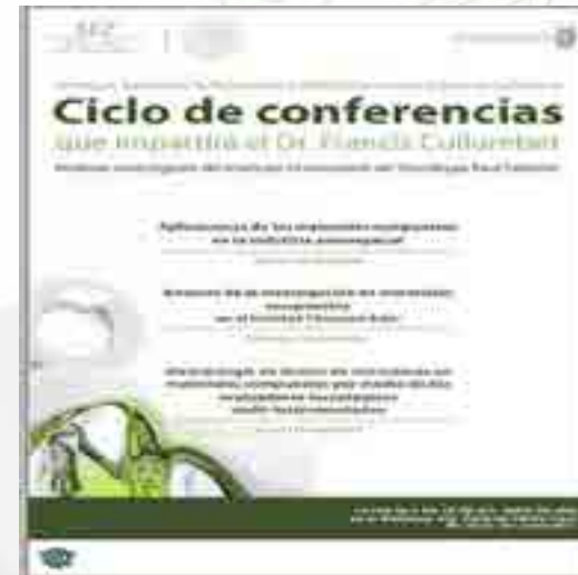
Cartel del Ciclo de Conferencias.