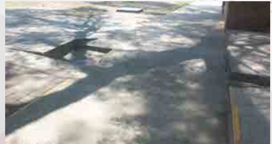
Rampa en zona de cafetería.