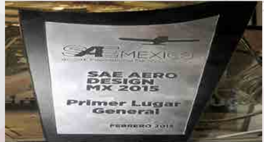
Primer lugar Aerodesign.