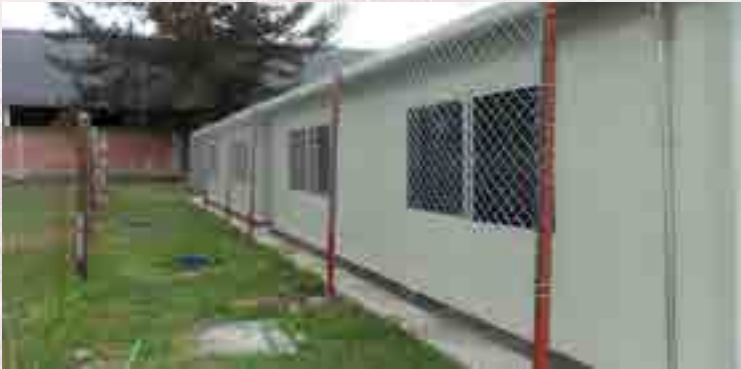
Instalación de malla ciclónica.