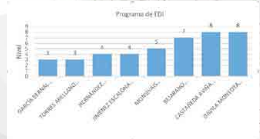
Programa de Estímulos al Desempeño.

Se le dió seguimiento al Programa de Estímulos al Desempeño Docente (EDD), apoyando a los profesores que solicitaban su ingreso o su reingreso. Investigadores que están activos en el Programa EDI 2014 - 2016 y 2015 - 2017.