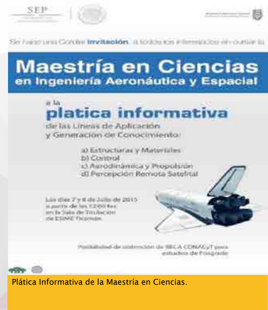
Plática Informativa de la Maestría en Ciencias.

Se impartieron pláticas por los Doctores e Investigadores de la Sección de Estudios de Posgrado e Investigación (SEPI) Ticomán, para dar a conocer entre los alumnos y profesores del Instituto, las diferentes líneas de aplicación y generación de conocimiento de la Maestría en Ciencias en Ingeniería Aeronáutica y Espacial, con la finalidad de promover la incorporación de alumnos en las diferentes maestrías que se imparten en esta Unidad.