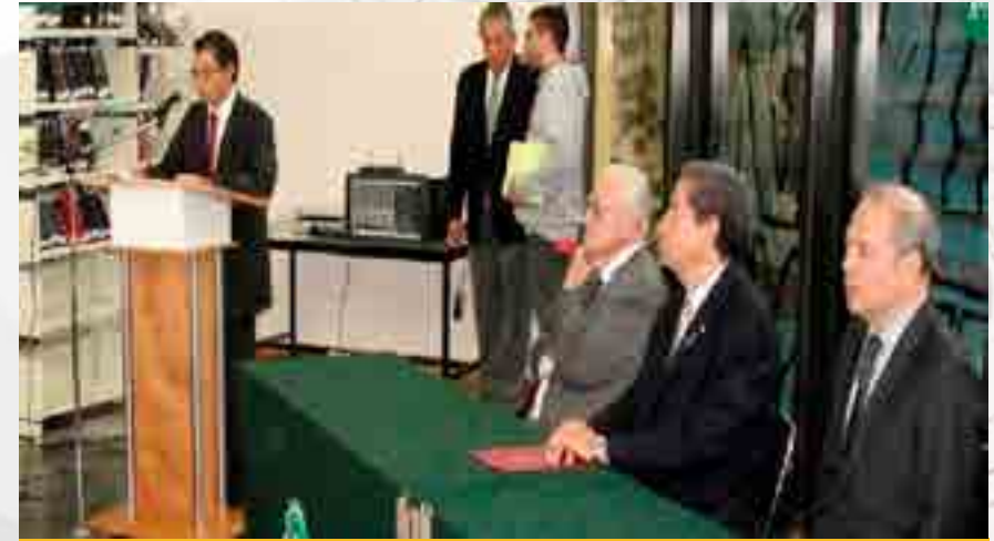
Nombramiento de Dirección.