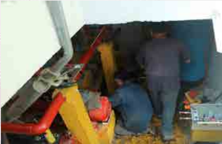
Mantenimiento al sistema hidroneumático.