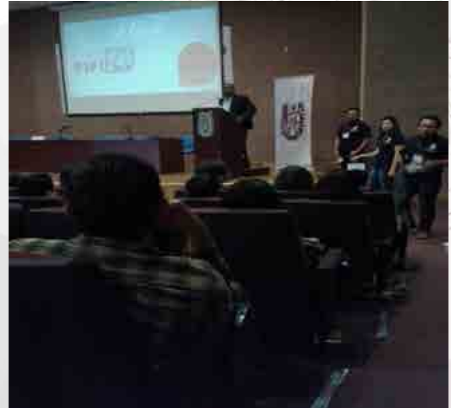
Décimo Foro PIFI.

Se tuvo la participación en el “10° Foro del Programa Integral de Fortalecimiento Institucional (PIFI) Tecnología y Emprendimiento”, los días 25 y 26 de junio, siendo sede la Unidad Politécnica para el Desarrollo y la Competitividad Empresarial (UPDCE), en la sesión de evaluación de carteles de los alumnos del Beca de Estímulo Institucional de Formación de Investigadores (BEIFI) otorgándoles el 1er., 2do. y 3er. lugar.