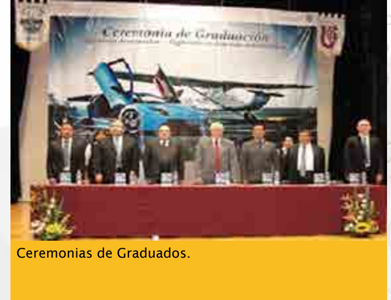
Ceremonias de Graduados.

El 17 de septiembre, alumnos pertenecientes a la generación 2011-2015 de las carreras de Ingeniería en Sistemas Automotrices e Ingeniería Aeronáutica, recibieron su diploma de graduación en una ceremonia protocolaria.