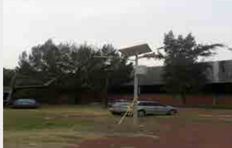
Lámparas de led instaladas