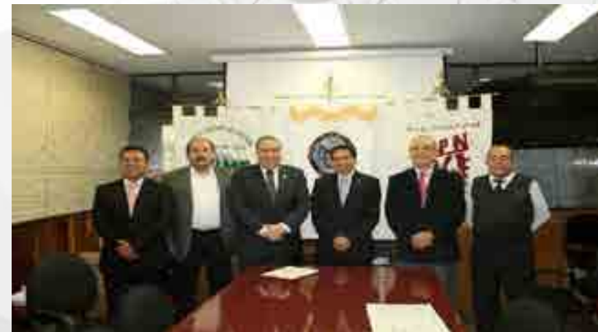
Convenio Colegio de Pilotos.

El 15 de diciembre se firmó el Convenio General de Colaboración con el Colegio de Pilotos Aviadores de México, A.C., llevándose a cabo una ceremonia protocolaria.