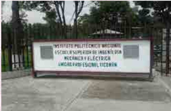
Reparación total del señalamiento.