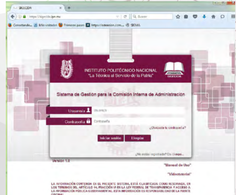
Pantalla del Sistema de Gestión para la Comisión interna de Administración (SIGECIDA)

El volumen total de ahorro de papel con el uso del SIGECIDA es de 108,000 hojas por año, el equivalente a 540 Kg de papel o 9.18 árboles con un peso promedio de 317 Kg por árbol al año, incluyendo el ahorro de 21,600 litros de agua y 3,780 KWh de energía eléctrica, si se deja de producir la cantidad mencionada de papel.