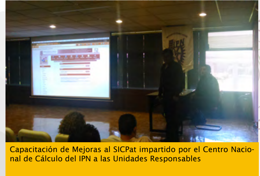
Capacitación de Mejoras al SICPat impartido por el Centro Nacional de Cálculo del IPN a las Unidades Responsables

También se realizaron las actividades de capacitación a los encargados de Activo Fijo de las Unidades Responsables, se generaron videos para apoyar el proceso de capacitación, se aplicó una encuesta de satisfacción a los usuarios y finalmente se implementó el proyecto, ver liga www.sicpat.ipn.mx