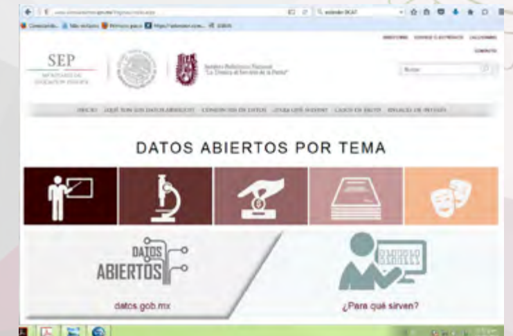
Creación y publicación del sitio www.datosabiertos.ipn.mx