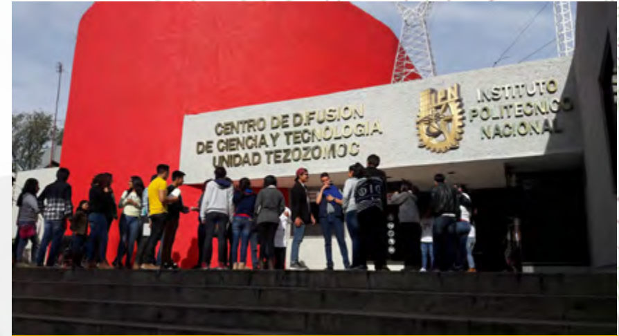
Asistentes al Museo Tezozómoc del Centro de Difusión de Ciencia y Tecnología

El Museo Tezozómoc es un espacio pensado para que sus invitados ¡Vivan la Ciencia en Acción! gracias al abanico de recursos, sitios, salas y actividades recreativas que ofrece. Este año se recibieron a 43,490 visitantes quienes experimentaron la ciencia y la tecnología a través de un viaje por más de 150 exhibiciones interactivas, divididas en exposiciones permanentes, temporales e itinerantes. Así mismo pudieron ver diversos documentales relacionados con la ciencia, particularmente sobre temas de la energía proyectados en diversos espacios del Museo.