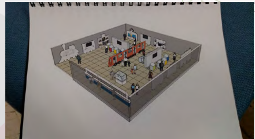
Exhibición “Caminando por las Vías de la Tecnología” maqueta.