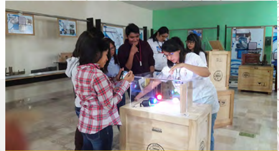
“Dispersión de la Luz”

Como apoyo a la Exhibición, se elaboró un video titulado “300 años de historia de la Luz”. Las 12 exhibiciones que conforman esta exposición son: “La Luz es Color”; “Dispersión de la Luz”; “Anillos de Newton”; “Observar Imágenes Bellas”; “Estabilizador UV”; “Fluorescencia”; “Efecto Tyndall”; “Reflexión Total Interna”; “Fibra Óptica”; “Tubos y Placas de Electroluminiscencia”; “Efecto Fotoeléctrico”; y “Comunicación con Luz”.