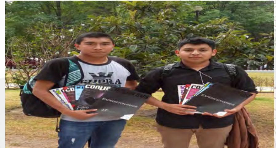
Los estudiantes leen "Conversus"

Un valor agregado es que la Revista Conversus por tres años consecutivos forma parte del índice de Revista Mexicanas de Divulgación Científica y Tecnológica del Consejo Nacional de Ciencia y Tecnología (CONACYT). Durante este año se editaron los números 112 "La Ciencia del Cine"; 113 "La Ciencia del Cerebro"; 114 "Arqueología Subacuática"; 115 "La Ciencia de la Luz"; 116 "La Ciencia de la Acústica"; 117 "Conoce tu Universo"; y el número especial "Expedicionarios".