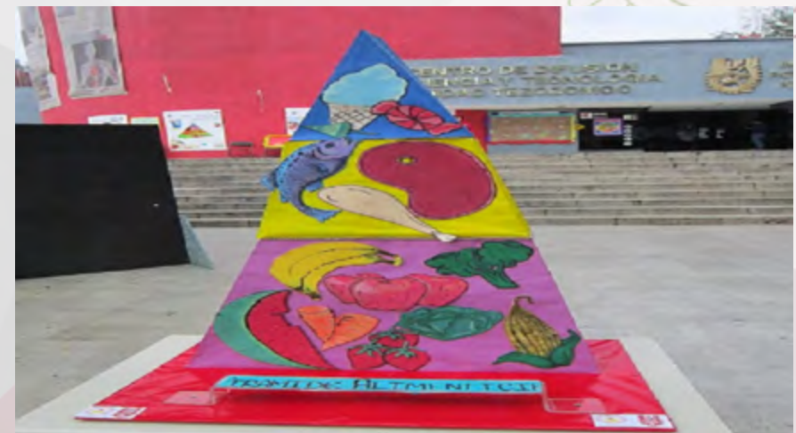
Día Mundial de la Alimentación. Museo Tezozómoc