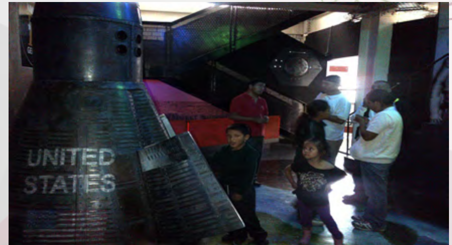
Asistentes a la Sala de Astronomía del Planetario “Luis Enrique Erro”.