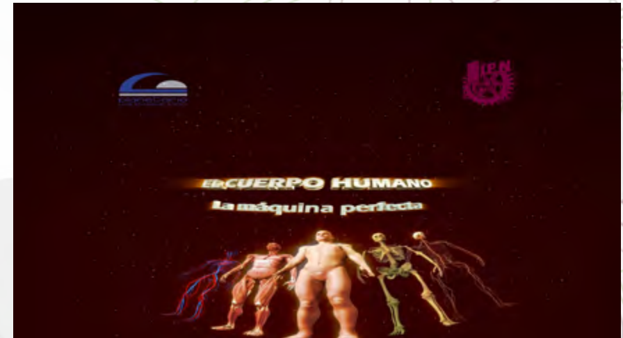
“Proyección 100% politécnica”

Este es un programa que pretende hacerle familiar al público, de forma lúdica, los elementos que integran los sistemas que componen el cuerpo humano; por medio de ella nos embarcamos en un extraordinario viaje visual a través de nuestro cuerpo; ésta, no sólo es la historia de una vida en concreto, es el relato de nuestra existencia contada desde una perspectiva única; desde el interior de un organismo vivo.