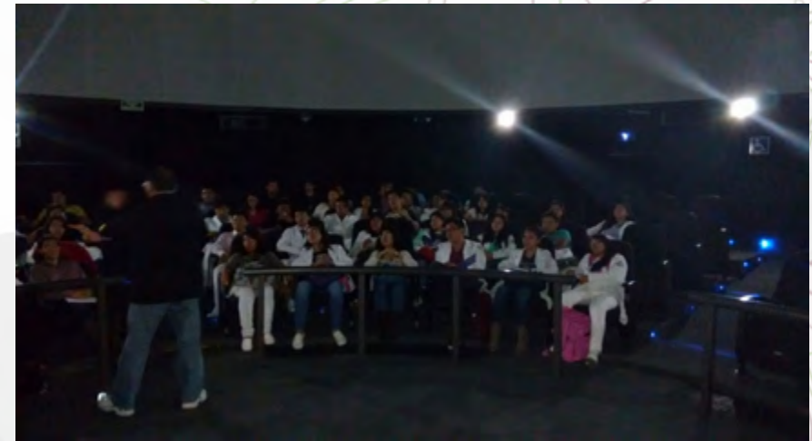
Estudiantes de ESIA Unidad Ticomán, Curso de Astronomía de Posición.

Finalmente, se afinan los conceptos astronómicos mediante exposiciones en el Auditorio "Harp Helú" del Planetario, donde se familiariza a los estudiantes con la astronomía contemporánea, para ampliar sus conocimientos en la materia y para generar en ellos un interés más allá de lo curricular y que tienda a enriquecer su bagaje cultural.