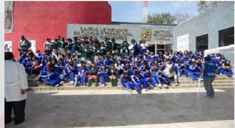
Se atrevieron a ¡Vivir la Ciencia en Acción!