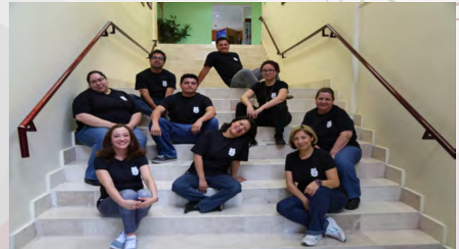
Equipo de Trabajo de la Revista Conversus