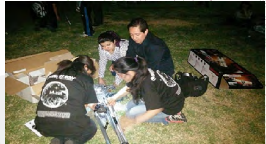
Festival “Noche de las Estrellas” 2015, Planetario Luis Enrique Erro.

Dependiendo del experimento, los alumnos y visitantes trabajaron y desarrollaron diferentes habilidades y aptitudes que los vinculan con el mundo científico y con la tecnología.