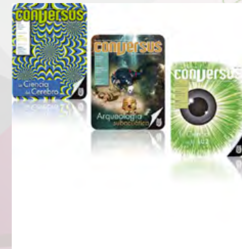
Portadas de las Revistas Conversus cuyas editoriales fueron premiadas