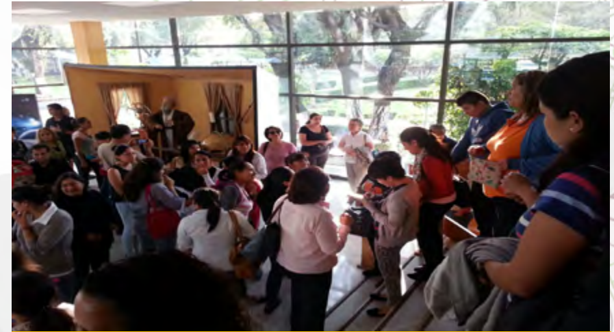
Planetario “Luis Enrique Erro”, visitantes en el Domo de Inmersión Digital

Este año se recibieron a 210,531 asistentes, quienes disfrutaron de una Cartelera Estelar. Después de ver la primera proyección y ¡Vivir la Astronomía en Acción!, los alumnos y público en general regresan a ver todas las proyecciones que ofrece el Planetario: “Últimas Noticias del Sistema Solar”; “El Futuro es Salvaje”; “Los Secretos del Sol”; “El Universo Maya”; “200 años de Historia en México visto desde las Estrellas”; “Dos pedacitos de vidrio: El Telescopio Maravilloso”; “Las Estrellas de los Faraones”; “Hoyos Negros: Al Otro Lado del Infinito”; “IBEX: En busca de los confines del Sistema Solar”; “Regreso a la Luna”; “En busca de nuestros Orígenes Cósmicos”; “Colores Cósmicos”; “Solaris; una aventura en el Sistema Solar” y “El Cuerpo Humano: La Máquina Perfecta”.