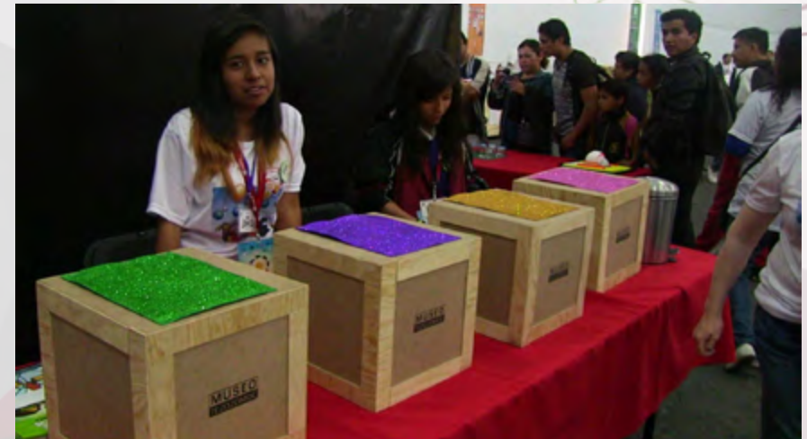
“Los Sentidos de la Luz”.