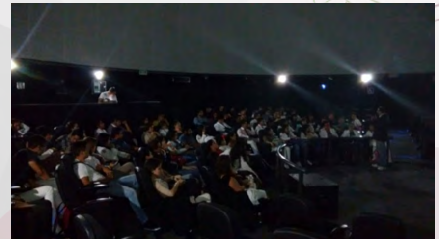
2do. Curso de Astronomía de Posición, Domo de Inmersión Digital del Planetario.