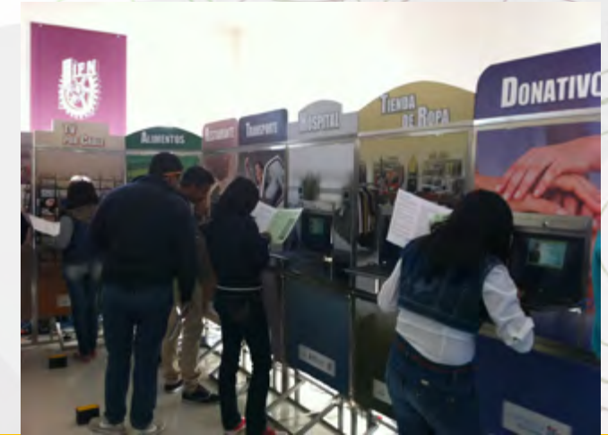
Estudiantes en la práctica

Con una asistencia de casi 300 jóvenes estudiantes en el “Parque Financiero Impulsa”, el IPN reitera su compromiso con la sociedad y espera inspirar a jóvenes para que aprendan cómo funciona la economía, qué influencia tiene en su vida diaria y cómo utilizarla adecuadamente para mejorar su calidad de vida.