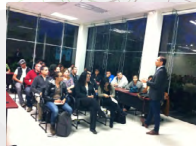
Plática de “Credito Joven”