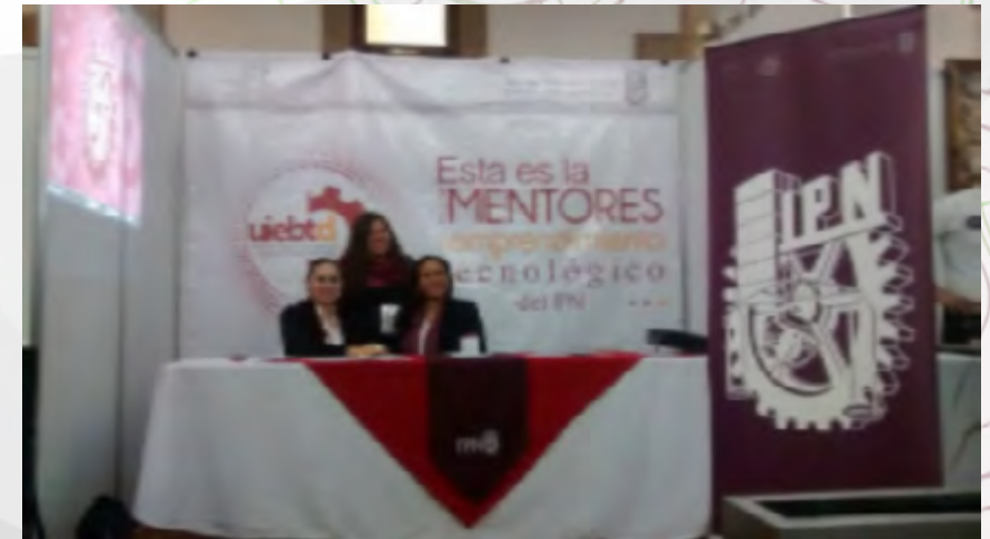
Mesa de difusión

Con un stand para difusión de los servicios de la incubadora y la presentación de proyectos en la pasarela empresarial.