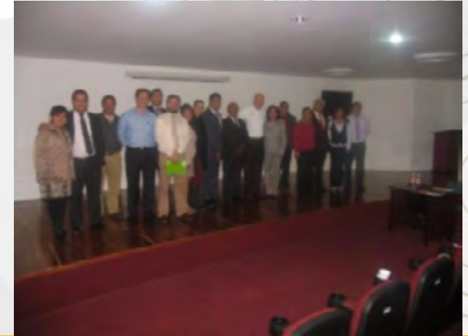
Red de mentores del IPN

El INADEM creó la red cuyo objetivo es propiciar la generación de un ambiente de intercambio de conocimientos y experiencias para impulsar micro, pequeñas y medianas empresas (Mipymes).La Red de Empresarios Mentores la conforman organismos como el Instituto Politécnico Nacional (IPN), el Instituto Mexicano de Ejecutivos de Finanzas (IMEF), Endeavor, Instituto Tecnológico y de Estudios Superiores de Monterrey (ITESM), Nacional Financiera (NAFIN), Universidad Autónoma Metropolitana (UAM), entre otros.