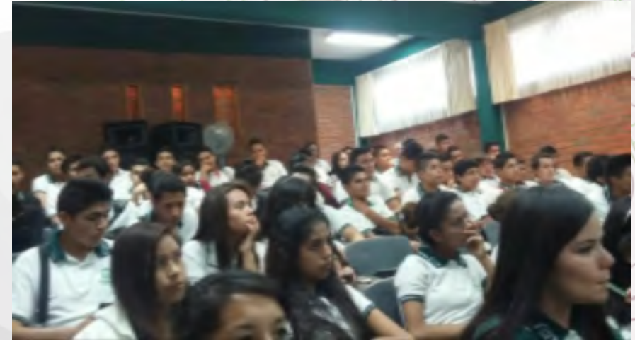
Estudiantes del COBAED