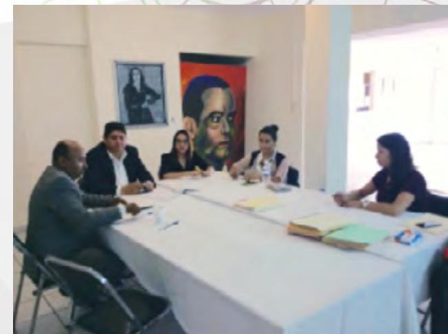
Creación del Consejo

El día 28 de agosto se formalizó la creación del Consejo Técnico Evaluador de proyectos del programa “Emprendedores 2015” con la presencia del Director de la Incubadora Durango (UIEBTD) para formar parte del mismo.