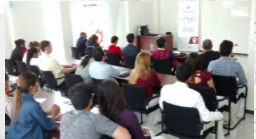
Punto de transmisión

la Unidad Incubadora de Empresas de Base Tecnológica Durango participó como punto de transmisión de las conferencias y paneles que se presentaron en la Semana Nacional del Emprendedor, el evento empresarial y de emprendimiento más importante de México, que organiza el Gobierno de la República, a través del Instituto Nacional del Emprendedor (IN-ADEM) y la Secretaría de Economía (SE), para ofrecer apoyos y soluciones concretas en el inicio de un negocio o el crecimiento de una micro, pequeña o mediana empresa.