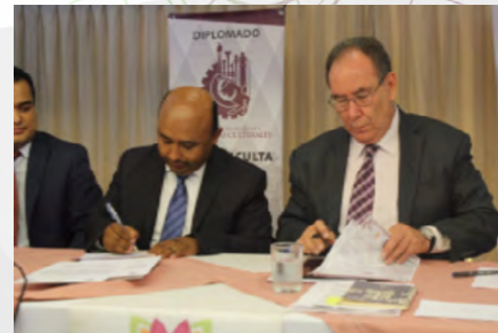
Firma de carta

Gran expectativa causó en la rueda de prensa la convocatoria del Consejo Nacional para la Cultura y las Artes (CONACULTA), Instituto de Cultura del Estado de Durango (ICED) y el Instituto Politécnico Nacional (IPN) a través de la Unidad Incubadora de Empresas de Base Tecnológica Durango (UIEBTD) de la firma de la Carta de Intención entre el ICED y la UIEBTD Durango y la presentación del diplomado “Desarrollo de Negocios e Industrias Culturales”.