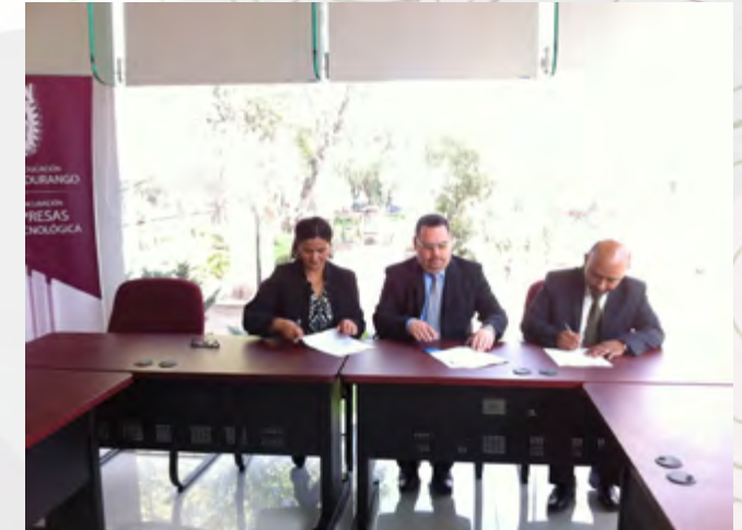
Momento de la firma