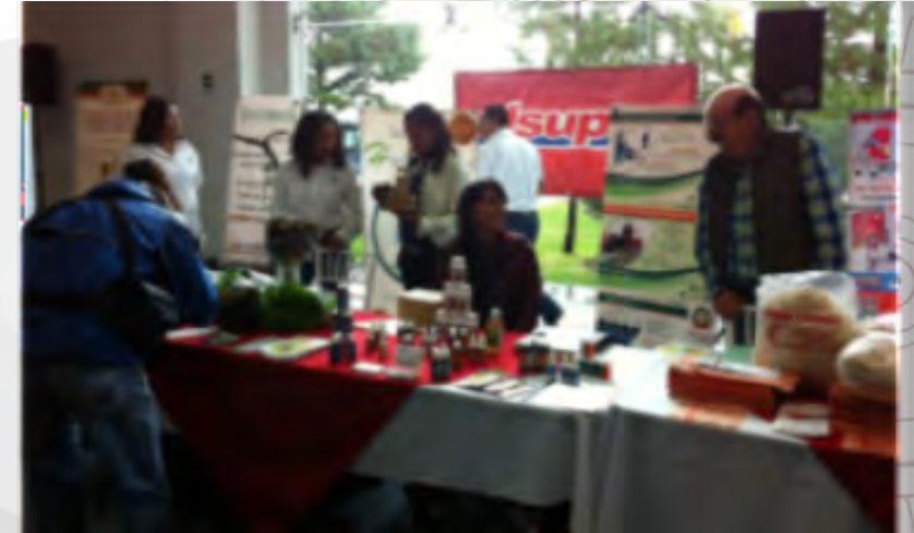
Mesas de exposición

El ejercicio consistió en presentar a los emprendedores y pequeños empresarios la oportunidad de mostrar sus productos a la cadena comercial, con la finalidad de hacer una selección de futuros proveedores originarios de la región y así promover la economía local.