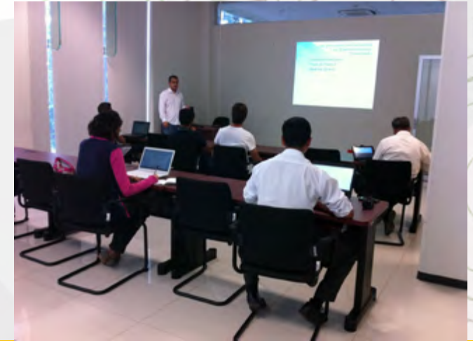
En uno de los talleres

Durante todo el año se atendió un aproximado de 1,000 personas en talleres, cursos, asesorías personalizadas, conferencias, pláticas informativas y diplomado “Desarrollo de Negocios e Industrias Culturales”.