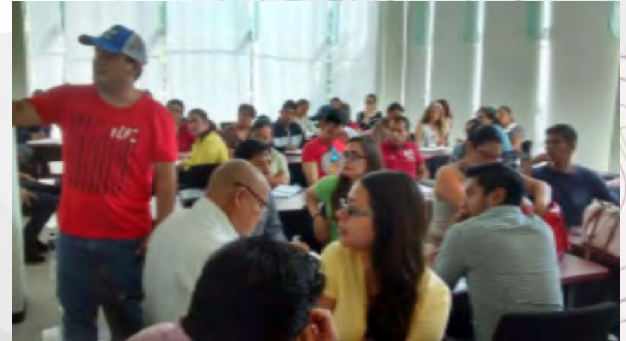
Taller “Agentes Creativos”

De mayo a noviembre se realizaron 5 bloques de talleres de: Agente Creativo, Observatorio y Enfoque; todas diseñadas para desarrollar proyectos en etapa de pre-incubación; otorgándoles a los emprendedores herramientas para innovar, dinámicas de networking, indicadores claves del negocio, vigilancia competitiva, identificación de la cadena de valor, estimación financiera, prototipo, entre algunas.