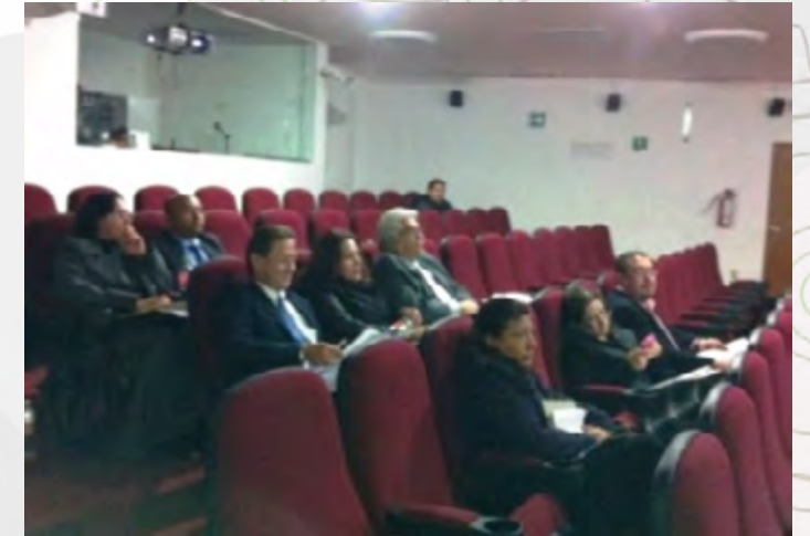
En el Auditorio Technopoli

Entre los días del 12 al 16 de enero, personal de la Unidad Incubadora de Empresas de Base Tecnológica Durango (UIEBTD) participaron en la “Reunión Técnica” en el auditorio “Technopoli” en la que se abordaron temas como: la importancia del capital humano de nuestra unidades, la evaluación y desempeño, presupuesto y programación, planeación, la normatividad y su alcance, recursos financieros, cooperación académica entre otros así como la participación en el taller “Trámites, prestaciones y servicios de capital humano” en la sala de autoevaluación de la Secretaría de Administración en Zacatenco.