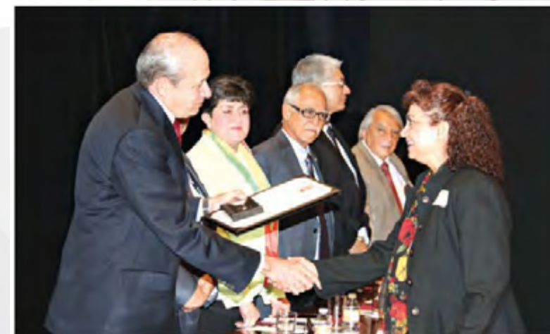
Ceremonia de entrega de preseas Juan de Dios Bátiz y Carlos Vallejo Márquez a docentes y Personal de Apoyo y Asistencia a la Educación con 30 y 50 años de servicio

La Secretaría de Educación Pública en reconocimiento a la trayectoria laboral otorga para el Personal de Apoyo y Asistencia a la Educación el “Estímulo por Antigüedad en la Secretaría de Educación Pública” y el “Premio Nacional de Antigüedad en el Servicio Público”; y para el Personal Docente la Medalla “Maestro Rafael Ramírez” y la “Condecoración Maestro Altamirano”. En el año 2015 la Secretaría de Educación Pública otorgó a diez trabajadores del CIC el “Estímulo por Antigüedad” y a siete el “Premio Nacional de Antigüedad en el Servicio Público”.