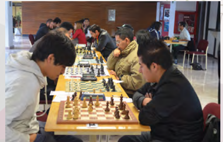
Torneo de ajedrez en el CIC