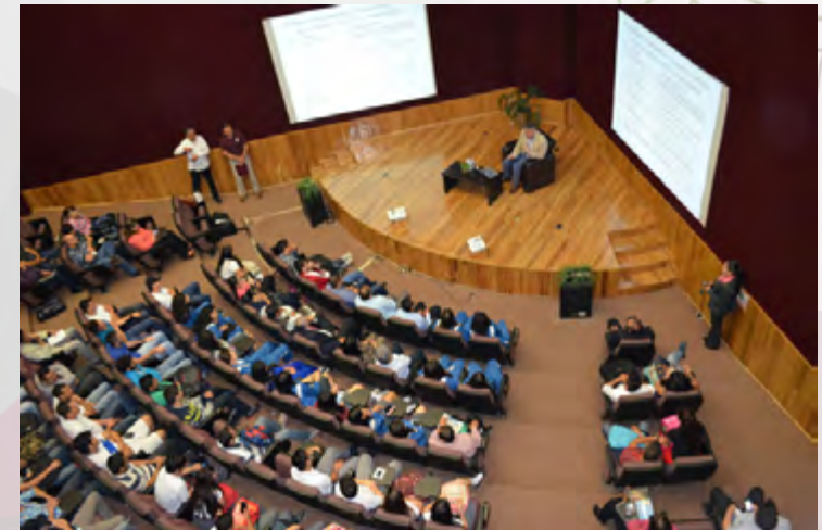
Conferencia Magistral sobre los posgrados del CIC en el CEC los Mochis