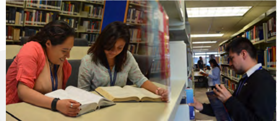
Alumnos del posgrado en la biblioteca del CIC

De este modo la comunidad del CIC tiene a su disposición un acervo de más de cien mil documentos que vinculan la investigación aplicada a la industria de las TIC´s. Resalta particularmente el estudio de aplicabilidad de futuras tecnologías en el ámbito industrial y de gobierno, es decir, informa y apoya a sus usuarios en cuanto a la toma de decisiones para definir las líneas de investigación pertinentes en el mundo real.