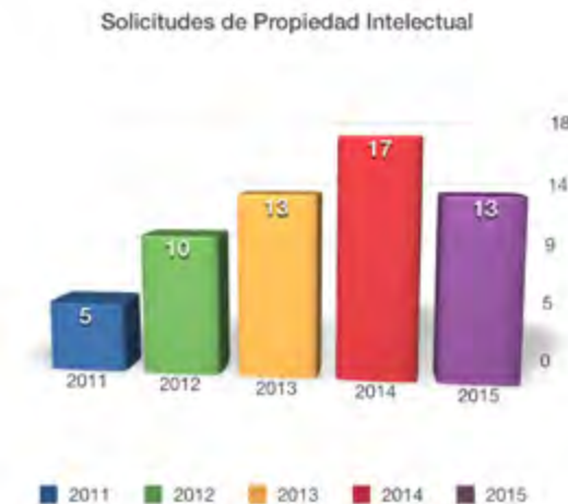
Solicitudes de propiedad intelectual en el periodo 2011-2015