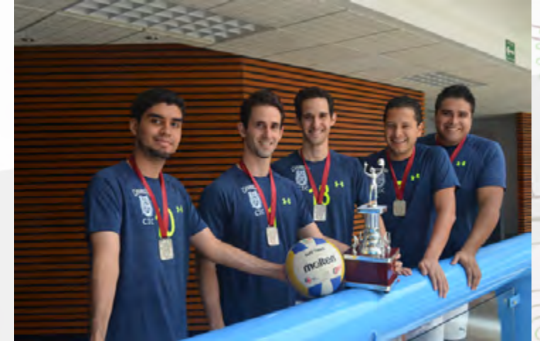
Equipo de Voleibol del CIC-CINVESTAV en el torneo 2015.

Las actividades deportivas y de cultura física que realiza en Instituto Politécnico Nacional tienen entre sus objetivos contribuir a la formación integral de sus alumnos, en este sentido, las autoridades destacaron la participación del equipo CIC-CINVESTAV e instaron al resto de los participantes a alcanzar los triunfos académicos que los integrantes de este conjunto ha logrado.