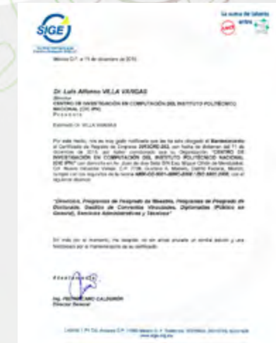
Certificado de Calidad de CIC obtenido en el 2015

Se anexa una evidencia una evidencia del Mantenimiento de Registro obtenido en el 2015 para el CIC.