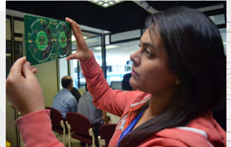
Tarjetas de circuito impreso en el CIC IPN

Este equipo de primer nivel se instaló en el CIC como parte de las inversiones llevadas a cabo por el Centro para fortalecer el área de nanotecnología. Por su parte, el mantenimiento que se realiza en este Centro está enfocado principalmente al mantenimiento preventivo, de tal manera que se cuenta con un programa anual de mantenimiento a desarrollar durante todo el año.