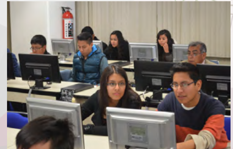
Cursos de capacitación en las aulas del CIC.