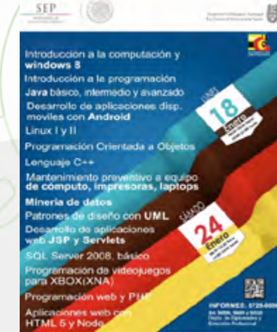
cartel promocional de los cursos de capacitación (ejemplo de cursos impartidos en el mes de enero)

Estudios recientes en el campo laboral revelan la existencia de un elevado déficit de profesionales a nivel mundial: se observa que existe un desajuste entre la demanda y la oferta de perfiles profesionales cualificados en el ámbito de las Tecnologías de la Información y la Comunicación (TIC) que limita el crecimiento del sector, en tal sentido, el CIC se dio a la tarea de ofertar estos cursos en las temáticas que mayormente exige el sector empresarial, procurando la formación de personal cualificado que se requiere en el sector TIC en términos de avanzar hacia mejores niveles de competitividad.