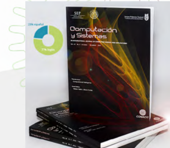
Revista Computación y Sistemas 2015

Editada por el Centro de Investigación en Computación del Instituto Politécnico Nacional, la revista CyS cumple con altos estándares el objetivo de dar a conocer los avances de investigación científica y desarrollo tecnológico de la comunidad científica internacional e iberoamericana en al área de las Tecnologías de la Información y la Comunicación (TIC).