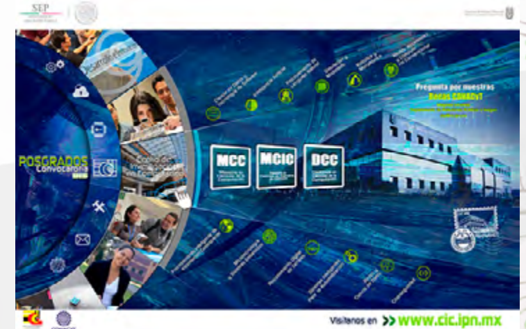
Promocional escénico 2015 de los programas de posgrado.

Destaca en este rubro el evento de difusión de los proyectos insignia de la Red de Computación que en el mes de diciembre convocó la asistencia de 863 alumnos del Instituto.