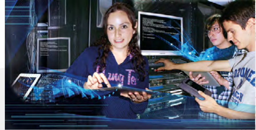
El Centro de Investigación en Computación ofrece 3 programas de posgrado con calidad PNPC

El análisis comparativo a nivel nacional de: la productividad científica, de sus aportes al desarrollo tecnológico, la efectiva formación de recursos humanos de alta especialización en los niveles de maestría y doctorado y el alto nivel de su planta docente confirman la posición de liderazgo que actualmente posee el Centro de Investigación en Computación del Instituto Politécnico Nacional.