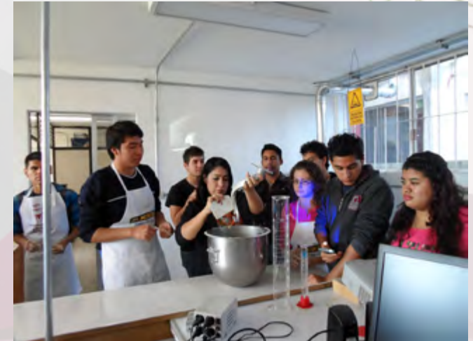
Alumnos del ITVG de visita al Laboratorio de Alimentos de este CIIDIR Durango.