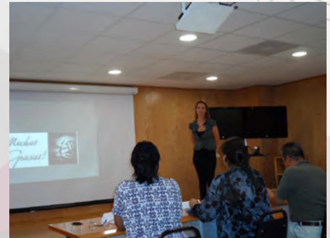
Durante la presentación de trabajos finales para concluir el Diplomado.