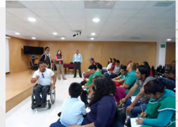
Personal de DIF Estatal compartiendo sus experiencias.

Se llevó a cabo la Plática “Sensibilización hacia las Personas con Capacidades Diferentes”, impartido por personal capacitado del DIF Estatal Durango. A fin de concientizar y promover entre la comunidad politécnica la inclusión de personas con capacidades diferentes.