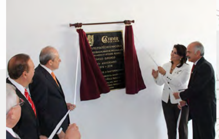
Develación de la placa conmemorativa por el Director General del IPN

Se llevó a cabo la plantación del árbol “Fundadores” y la develación de una placa conmemorativa de la Fundación de este CIIDIR Unidad Durango, además de un Recorrido a las instalaciones de este Centro.