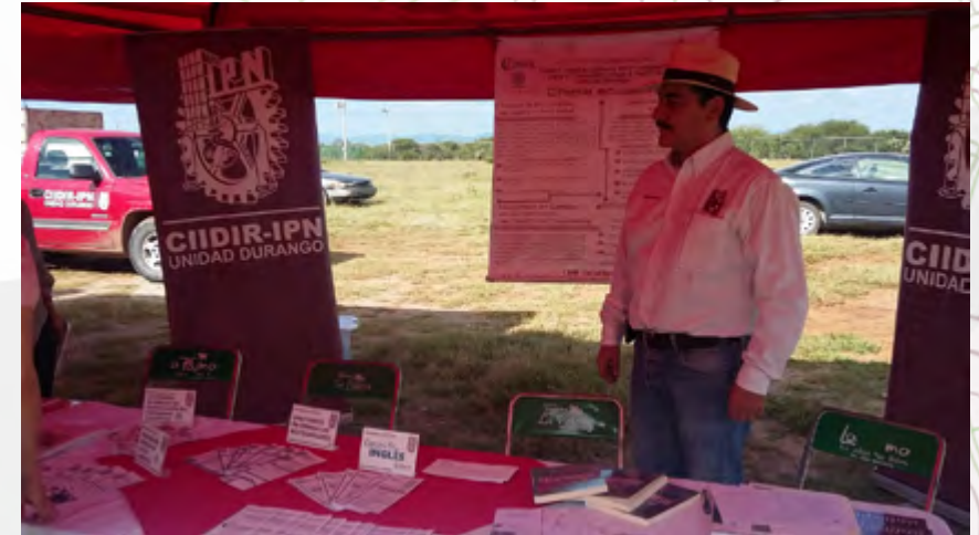
Promoción de la Oferta Educativa del CIIDIR Durango en el Pabellón del FESTAD 2015