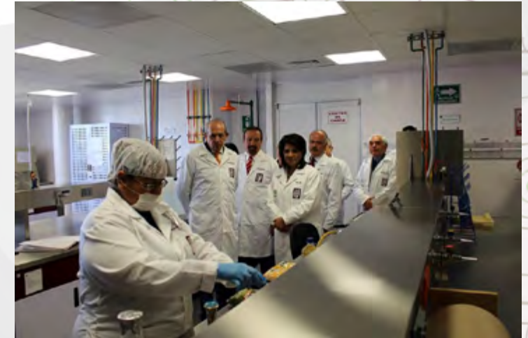
Recorrido a la Central de Instrumentación en la visita del director general del IPN