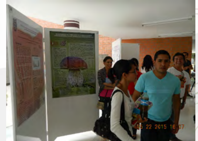
Con gran éxito se llevó a cabo el V Simposio Tópicos Biológicos dentro de las instalaciones de este CIIDIR Durango