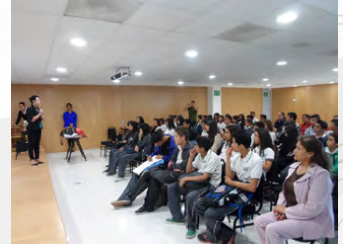
Personal de la CEDH, durante una plática donde se invitó a una Escuela Secundaria aledaña a este CIIDIR Durango

El CIIDIR Durango trabaja en conjunto con la Comisión Estatal de Derechos Humanos y con Centros de Integración Juvenil, A.C., impartiendo conferencias a la Comunidad Politécnica e invitando a instituciones Educativas de Nivel Básico y Medio Superior.