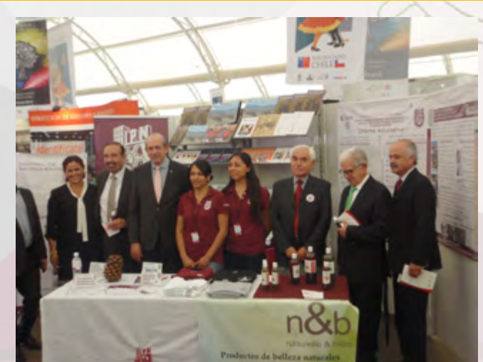
Autoridades del IPN, CEC Durango y del CIIDIR Durango durante la inauguración de la FIL Politécnica 2015