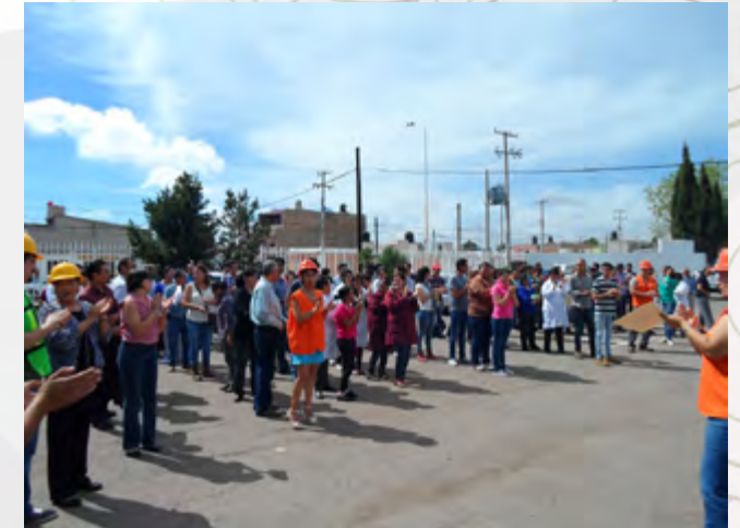
Comunidad Politécnica reunida en el Punto de Reunión durante Simulacro por Sismo