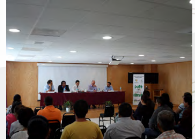
Investigadores participantes en el Foro Café Ciencia

Se impartieron cuatro Cursos de Propósito Específico durante el año: "Ecología General", "Estadística básica", "Geomática" y "Fundamentos Básicos de DSA-HPLC-TOF-MS"