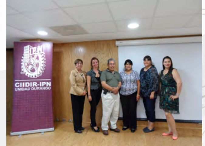
Personal que finalizó con éxito el Diplomado en Formación Docente