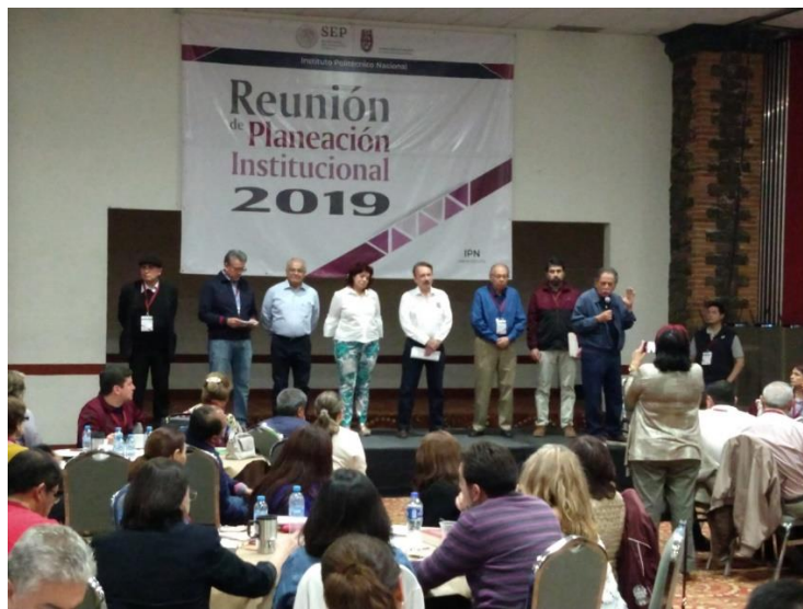
Reunión de Planeación Institucional 2019.