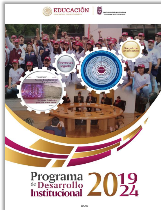
Presentación PDI 2019-2024.

Descripción detallada del evento 2: Se realizó la presentación del PDI 2019-2024 en la Tercera Sesión Ordinaria del XXXVIII Consejo General Consultivo (CGC).