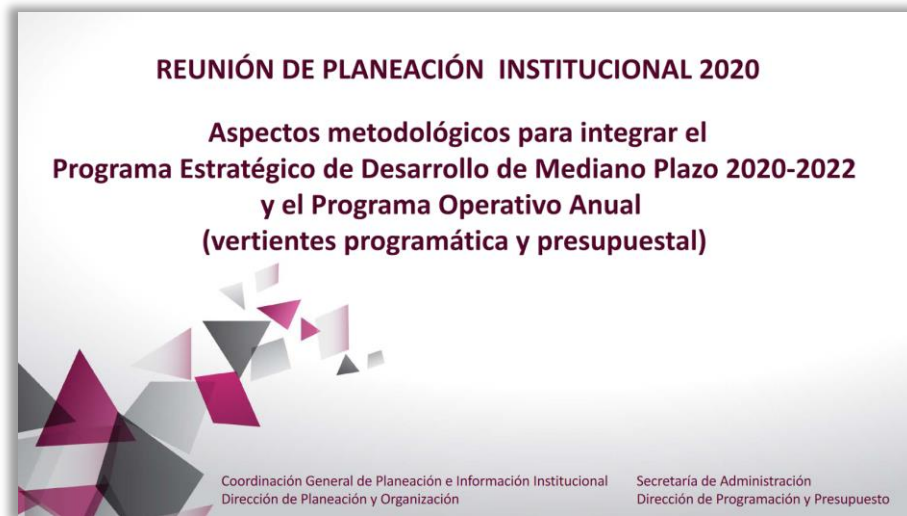
Reunión de Planeación Institucional 2020.

Descripción detallada del evento 3: La Dirección de Planeación y Organización diseñó la logística y realizó de manera virtual el Taller de Planeación, Programación y Presupuestación 2020 con la participación de las dependencias politécnicas.