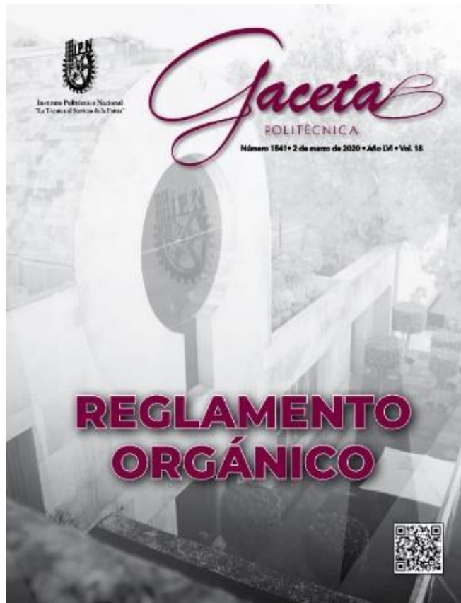
Actualización del Reglamento Orgánico del IPN.

Descripción detallada del evento 4: Se realizó la actualización del Reglamento Orgánico y fue publicado en el Número 1541, Año LVI, Vol. 18 de la Gaceta Politécnica.