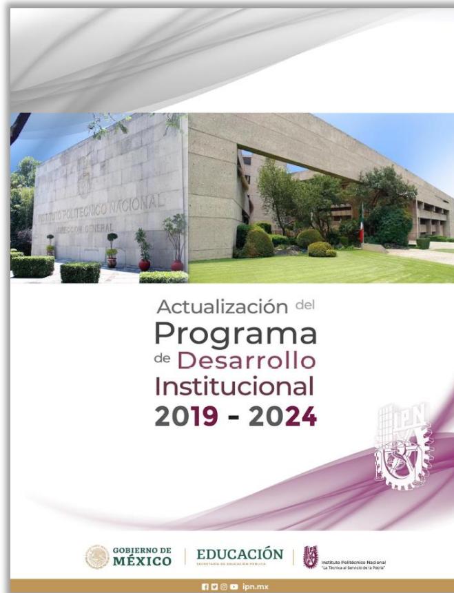
Actualización del PDI 2019-2024.