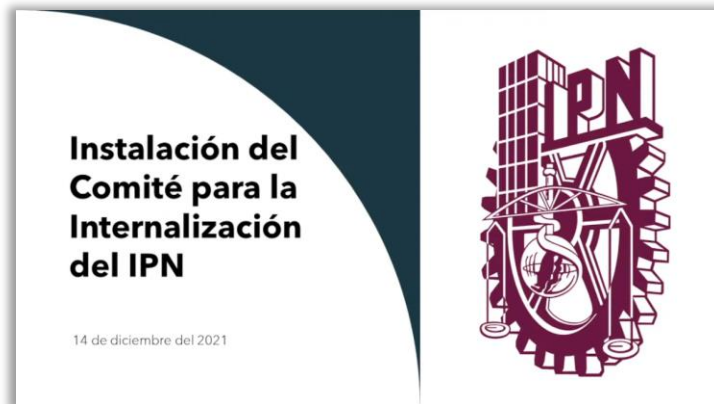
Comité para la Internacionalización del IPN (CIIPN).

Descripción detallada del evento 4: Se diseñaron los términos de referencia y la estrategia para impulsar la gestión del Eje Transversal 3. Internacionalización del IPN. Como parte sustantiva de esta estrategia para el impulso a la gestión, se realizó la conformación e instalación del Comité para la Internacionalización del IPN (CIIPN).