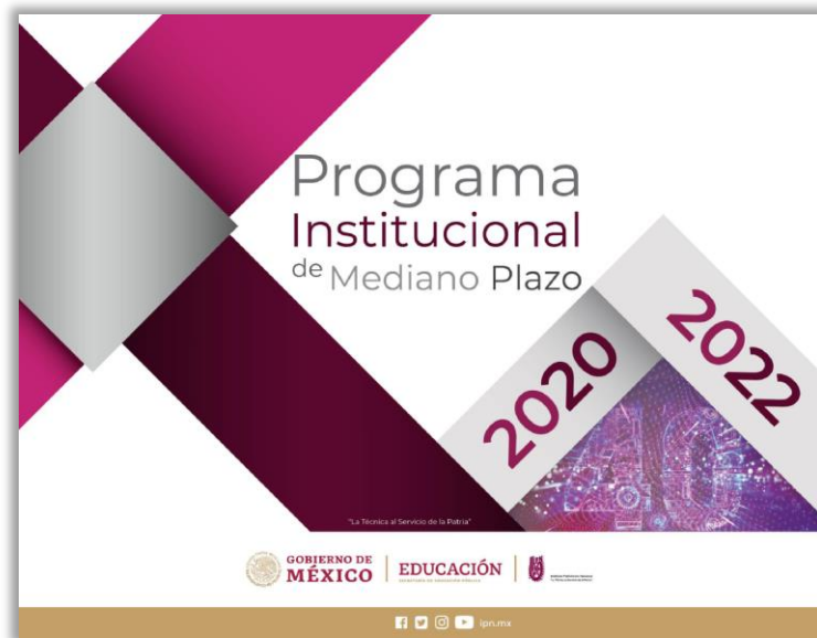
Presentación del PIMP 2020-2022.

Descripción detallada del evento 2: La Dirección de Planeación conformó el PIMP 2020-2022, con base en el programa de trabajo del Director General, y se realizó la presentación en la Séptima Sesión Ordinaria del XXXVIII del Consejo General Consultivo (CGC).