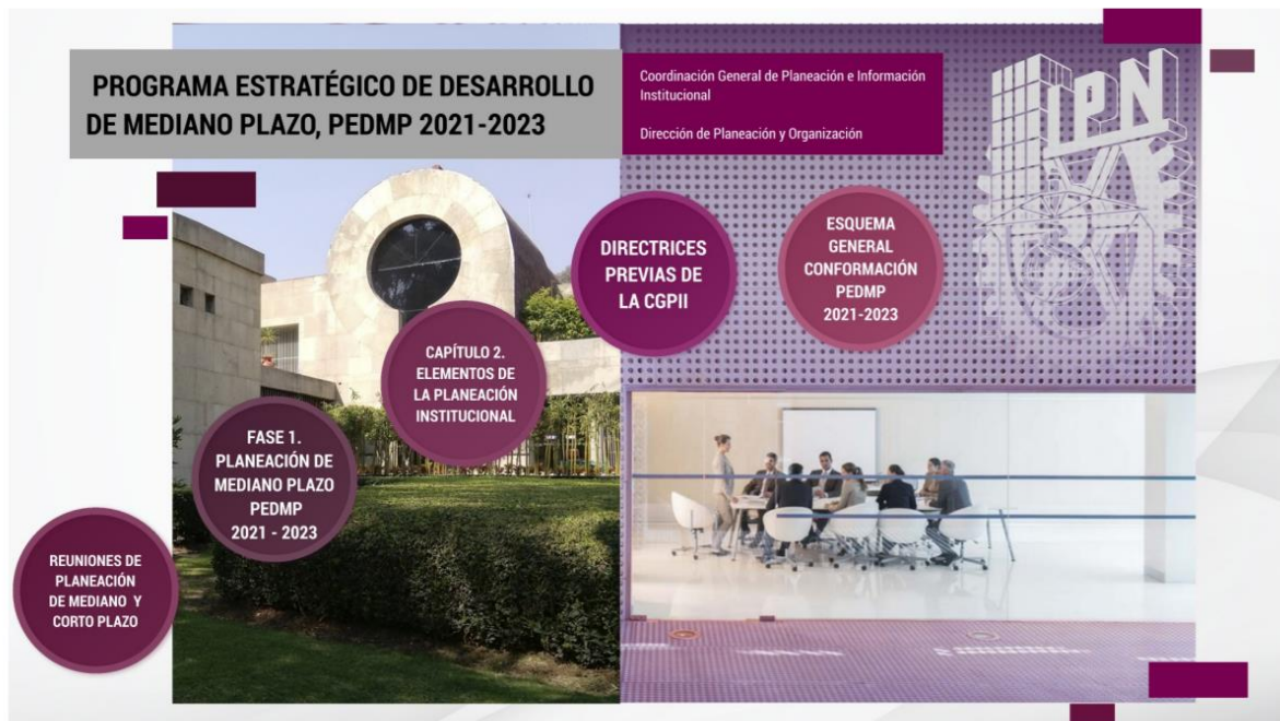
Reunión de Planeación Institucional 2021.

Descripción detallada del evento 3: La Dirección de Planeación y Organización diseñó la logística y coordinó la realización de la Reunión de Planeación Institucional 2021 de manera virtual, haciéndose la convocatoria a Titulares y enlaces mediante oficio número CGPII/392/2021 emitido por la Coordinación General de Planeación e Información Institucional, con el propósito de que todas las dependencias politécnicas elaboraran su programa estratégico de desarrollo 2021 -2023.