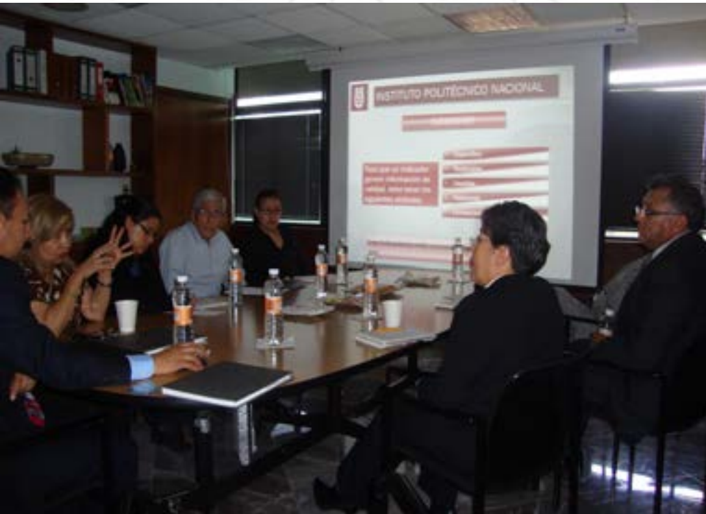
Reunión entre la DPP, DPL, CGSI y CSII.

Se realizó el proceso de convalidación de indicadores institucionales por proyecto que se utilizaron para formular el Programa Operativo Anual 2015 de cada una de las Dependencias Politécnicas, mismos que fueron enviados a la Coordinación General de Servicios Informáticos (CGSI), así como a la Coordinación del Sistema Institucional de Información (CSII), para su integración al Sistema de Administración de los Programas de Mejora Institucional (S@PMI).