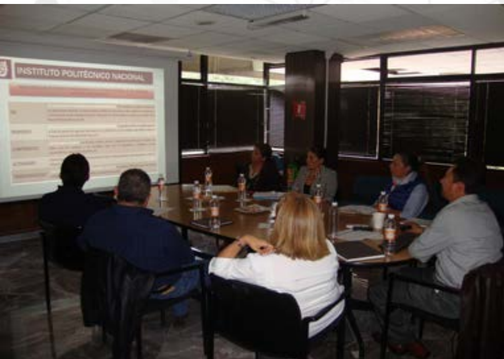
Reunión entre la DPP y la Oficina de Abogado General.