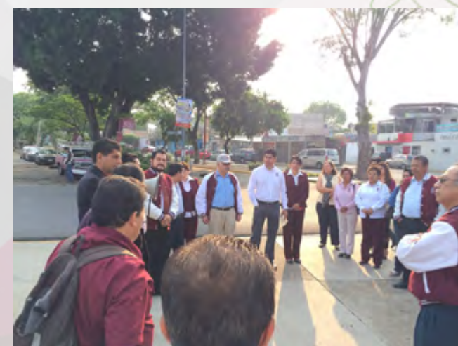
Comunidad del CEC y CIIDIR Oaxaca en la ceremonia del Día del Politécnico, junto a la estatua del General Lázaro Cárdenas del Río.