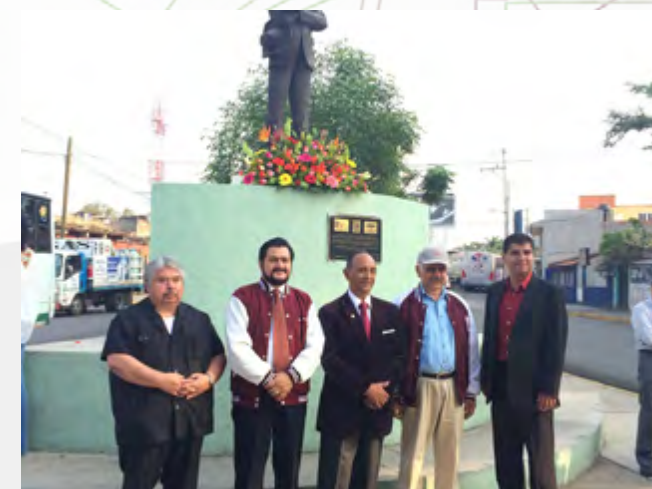
Guardia de honor en el monumento al General Lázaro Cárdenas del Río, por autoridades del CEC y CIIDIR Oaxaca.

Posteriormente, en el aula magna del Campus Politécnico en Oaxaca se llevó a cabo un evento cultural, por los 79 años de la fundación del IPN.