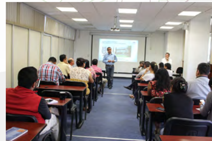
Participación del personal de CEC Oaxaca en la plática de Sensibilización a la Calidad.

En el marco del Sistema de Gestión de la Calidad, se impartieron los cursos de capacitación “Sensibilización al Sistema de Gestión de la Calidad”, “Mapeo y documentación de procesos”, y 2 de “Análisis e Interpretación de la Norma ISO 9001:2008”, en los que participaron 6 directivos, 9 docentes, 5 trabajadores interinos, 4 trabajadores de apoyo, y 7 de honorarios.