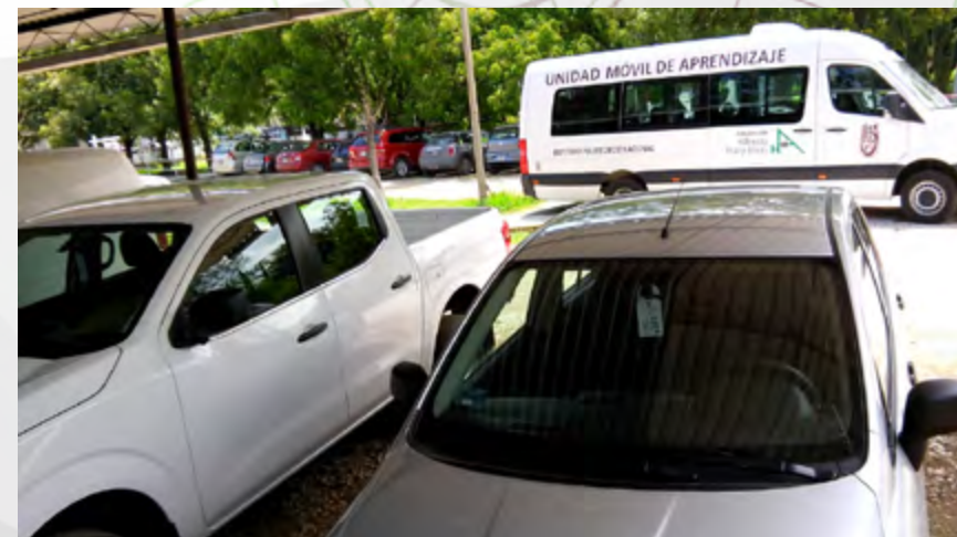
Unidad Móvil de Aprendizaje, Camioneta Pick Up y automóvil utilitario asignados en renta al CEC Oaxaca.

Con este incremento, se ampliaron las facilidades para el traslado de los instructores, la movilidad para el contacto con clientes potenciales, y la atención de los eventos académicos dentro y fuera del campus politécnico.