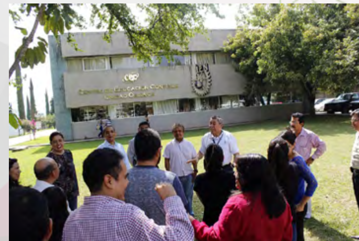
Personal de CEC Oaxaca, participando en el Simulacro de evacuación de Sismo.