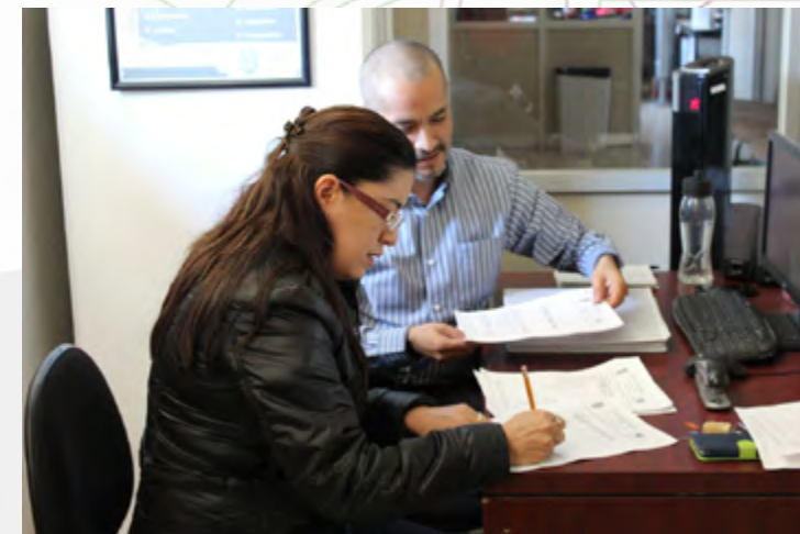
Auditor interno auditando el Proceso de los Servicios de Gestión de Educación Continua.

En el mes de diciembre de este año, se realizó la 1ª auditoría interna del Sistema de Gestión de la Calidad del CEC, en la que se auditó el “Proceso de los Servicios de Gestión de Educación Continua”, los procedimientos de “Capacitación”, “Compras” y “Mantenimiento” y los procedimientos de “Control de Documentos”, “Control de Registros” y “Revisión por la Dirección”.