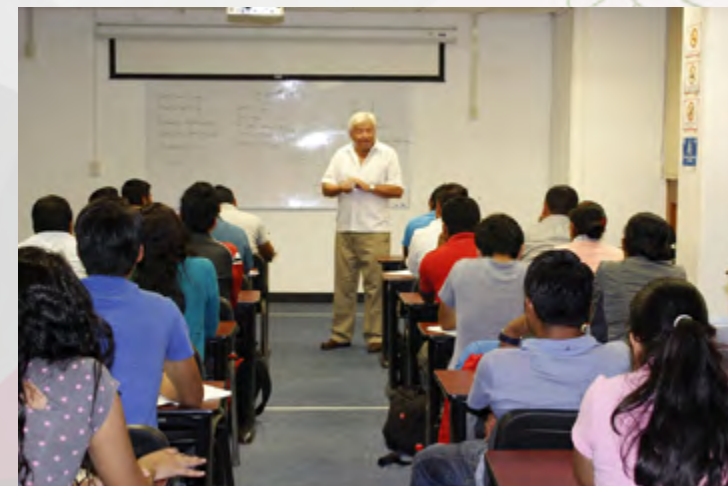
Alumnos en sesión del Seminario de Actualización con Opción a Titulación "Administración de Proyectos"