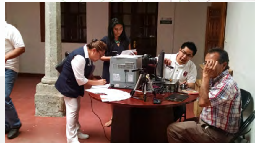
Personal de la Dirección de Egresados y Servicio Social, en la campaña de credencialización de egresados politécnicos en Oaxaca.

En el marco de la Campaña de Credencialización de egresados politécnicos que promueve el Instituto, con el apoyo y la participación de la Dirección de Egresados y Servicio Social, en esta año se convocó a los egresados politécnicos originarios y radicados en las regiones del estado de Oaxaca, para la obtención de la credencial de identificación como egresado de esta casa de estudios. A esta invitación acudieron más de 150 egresados.