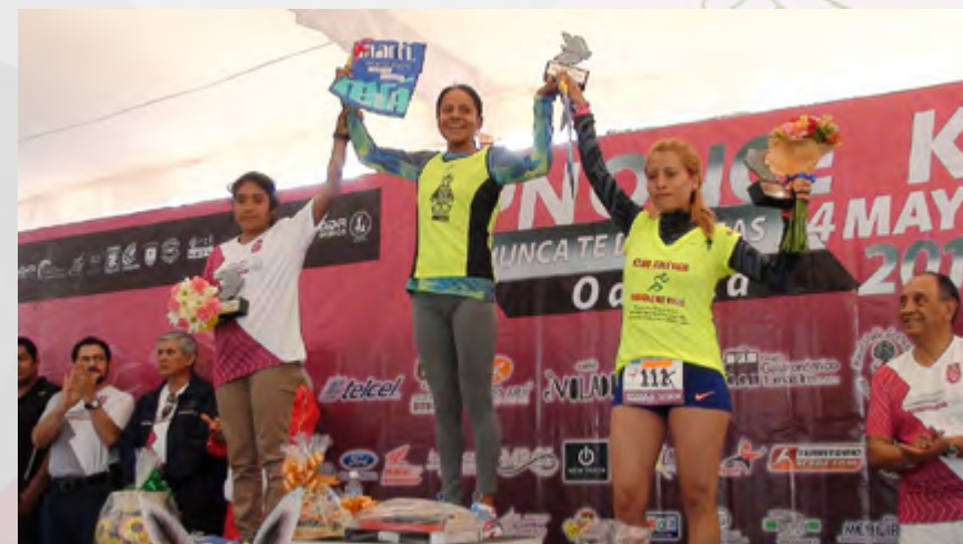
Premiación a las ganadoras de la carrera de 11 kilómetros en la IPNONCEK 2015.