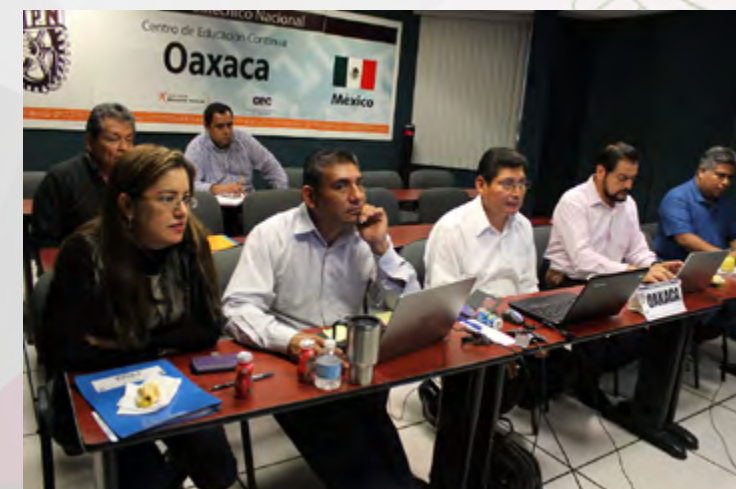
Funcionarios del CEC Oaxaca, participando en la conferencia sobre sustentabilidad, el 29 de junio.