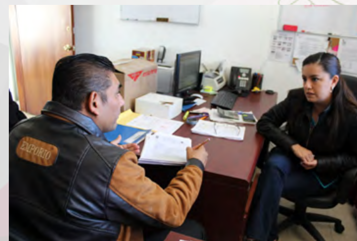
Auditor interno auditando el Procedimiento de adquisiciones de bienes y servicios.