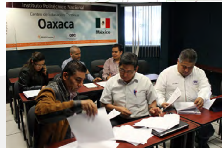
Personal del CEC Oaxaca desarrollando ejercicios en el Curso de Formación de Auditores Internos.

La capacitación formó parte de la estrategia de la (DEC) de impulsar la certificación del “Proceso de los Servicios de Gestión de Educación Continua” en los 18 Centros de Educación Continua del Instituto.