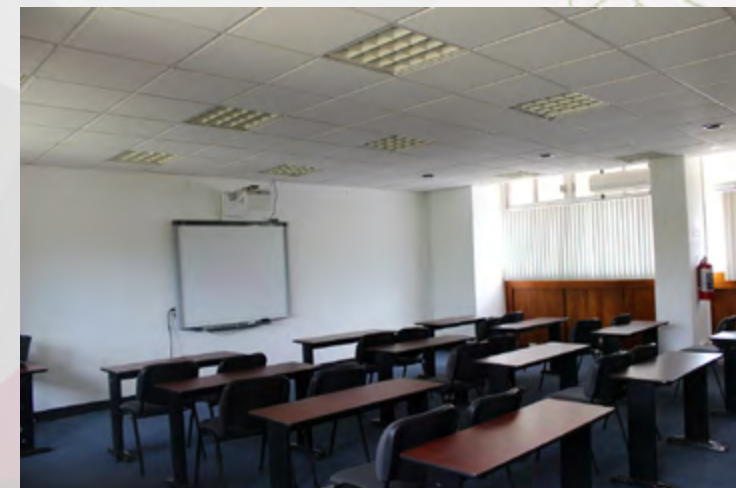
Aula "B" del CEC Oaxaca, después del mantenimiento correctivo.