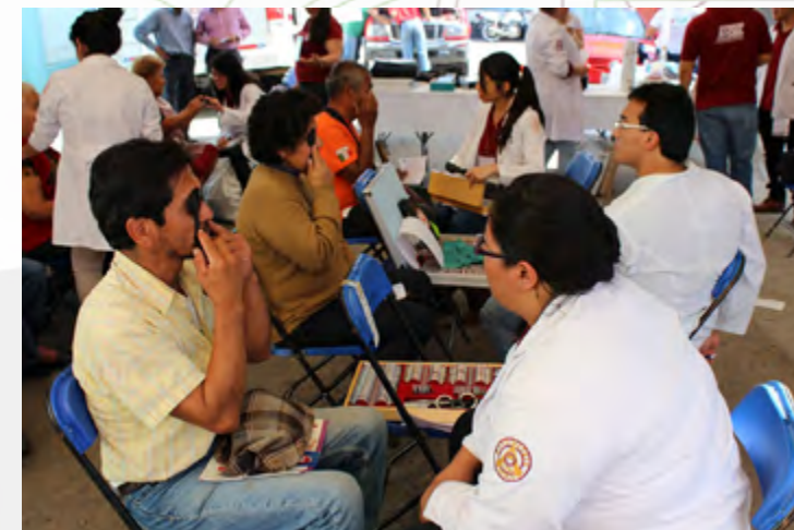
Brigadistas de servicio social del IPN, atendiendo a la población del municipio de Santa Cruz Xoxocotlán, Oaxaca.

En este año se contó con la intervención de brigadas de salud de la ESM, el CICS Santo Tomás, la ENMH y el CECyT 16 Hidalgo, en los municipios de Zaachila y Santa Cruz Xoxocotlán, en donde atendieron 654 usuarios en las áreas de optometría, odontología, medicina general, somatometría, realización de pruebas de resultado inmediato de antígeno prostático, VIH, sífilis, y pláticas sobre prevención de enfermedades, métodos anticonceptivos, enfermedades de transmisión sexual y bullying.