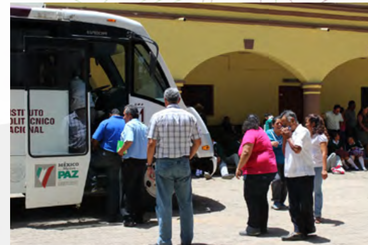
Adultos mayores del Municipio de San Sebastián Abasolo, ingresando a la Unidad Móvil de Aprendizaje.

Mediante la Unidad Móvil de Aprendizaje, en éste año se apoyaron 4 municipios del Estado: Tlacolula de Matamoros, Heroica Ciudad de Tlaxiaco, Putla Villa de Guerrero y Santa Cruz Xoxocotlán, Oaxaca, en donde se atendieron 2936 usuarios, a través de cápsulas educativas relacionadas con el cuidado de la salud, la prevención de enfermedades, derechos humanos, prevención de las adicciones y el cuidado del medio ambiente.