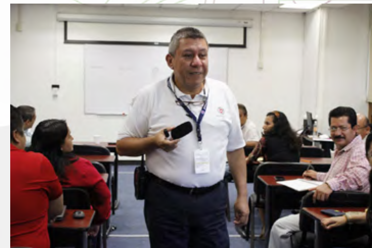
Personal de CEC Oaxaca, participando en la plática de Protección Civil.

En el segundo semestre, se actualizó el Acta de Instalación del Comité Interno de Protección Civil, y se impartió una plática de técnicas de seguridad y reacción en caso de sismo.