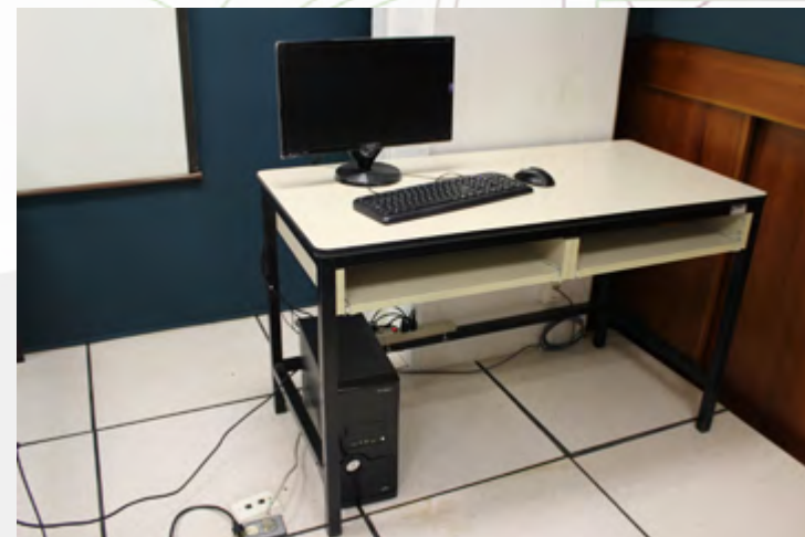
Equipo de cómputo donado e instalado en el aula "C" del CEC Oaxaca.

En este año se consiguió la donación de 8 computadoras de escritorio, las cuales se utilizaron en la sustitución de los equipos de cómputo obsoletos que utilizaban algunos trabajadores. La donación estuvo a cargo de un egresado politécnico.