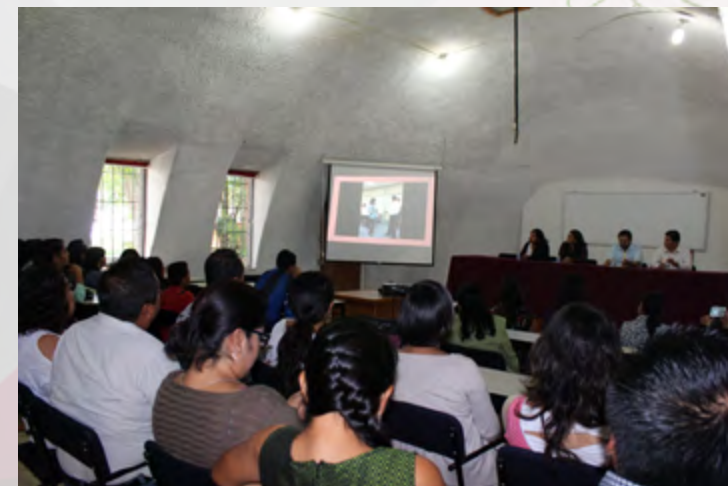
Clausura del 1er. Curso de Inglés, Nivel Avanzado.