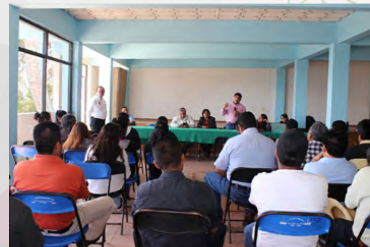
Promoción de la oferta de bachilleratos y licenciaturas en línea del IPN, en el municipio de San Pedro Cajonos, Oaxaca.