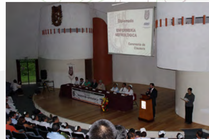
Clausura del Diplomado en Enfermería Nefrológica

Durante el año se implementaron 32 programas de formación de capacidades a lo largo de la vida, distribuidas en 41 cursos de capacitación, 4 seminarios de actualización con opción a titulación, y 10 diplomados, apoyados por especialistas de 6 escuelas de nivel superior del Politécnico, beneficiando a 750 usuarios de diversos sectores del estado de Oaxaca.