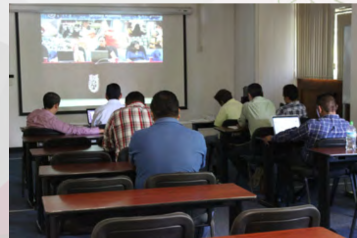
Participación del personal del CEC Oaxaca, en la plática de auditoría de la calidad.