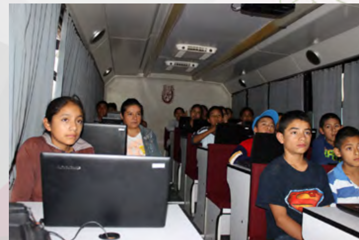
Estudiantes de Nivel Secundaria del municipio de Tlaxiaco, Oaxaca, participando en la Unidad Móvil de Aprendizaje.