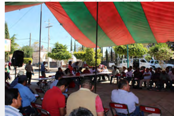
Promoción de la oferta de bachilleratos y licenciaturas en línea del IPN, en el municipio de San Juan Teitipac, Oaxaca.

El Centro de Educación Continua Unidad Oaxaca apoyó la difusión de las convocatorias 2015-1, y en la inscripción y aplicación de examen de ingreso a los aspirantes a cursar una de las licenciaturas o bachilleratos en línea. Se impartió un Curso de Preparación para el Examen de Ingreso al IPN en el que participaron 17 aspirantes.