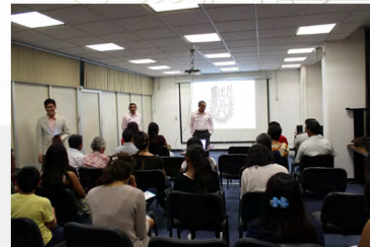
Bienvenida al Curso de Inglés Nivel Básico, por autoridades del CEC Oaxaca.

En este año se impartieron 23 cursos extracurriculares de lenguas extranjeras del idioma inglés: 11 de nivel básico, 7 intermedios y 5 de nivel avanzado, cada módulo con 40 horas de duración, correlacionados con los niveles de desempeño A1, A2, B1 y B2 establecidos en el Marco Común Europeo de Referencia para las Lenguas (MCER), atendiendo a 222 usuarios de la zona de los Valles Centrales de Oaxaca.