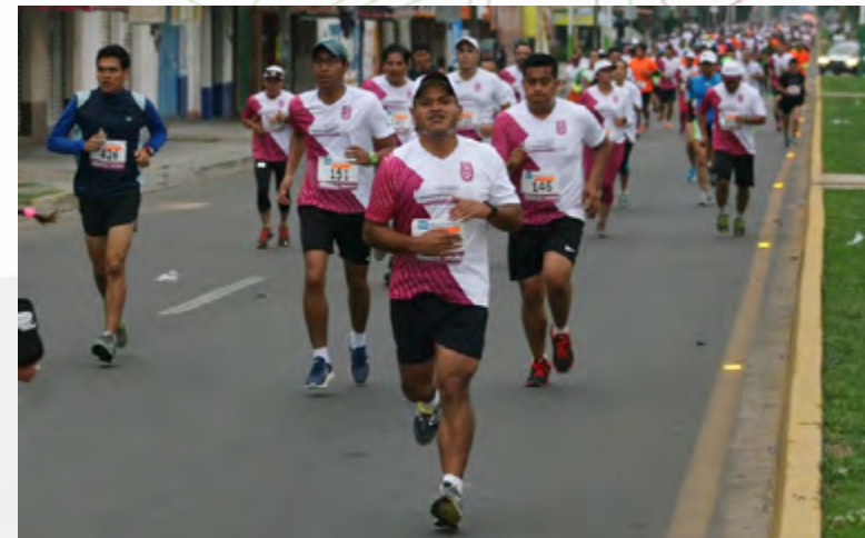
Atletas corriendo por la ruta de la IPNONCEK 2015 en Oaxaca.

El evento contó con el apoyo de un comité organizador conformado por 13 integrantes, y la solidaridad de 37 patrocinadores locales, quienes donaron los artículos que se entregaron a los ganadores y se rifaron entre los corredores.