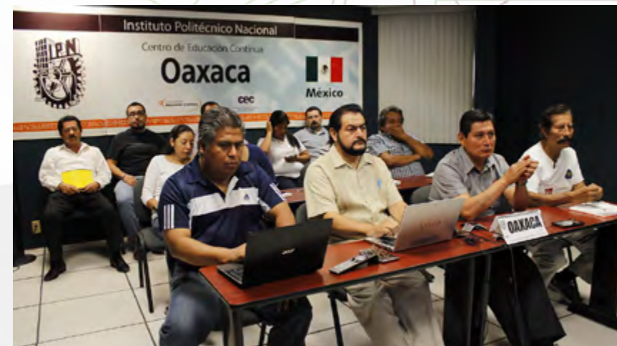
Personal de CEC Oaxaca, participando en el coloquio de Comités ambientales, el 26 de mayo.

En el marco del Programa de ambiental del Instituto, integrantes del comité ambiental del CEC e interesados participaron en 8 videoconferencias temáticas relacionadas con el cuidado del medio ambiente, que impartieron expertos de diversas instituciones, a convocatoria de la Coordinación Politécnica para la Sustentabilidad.