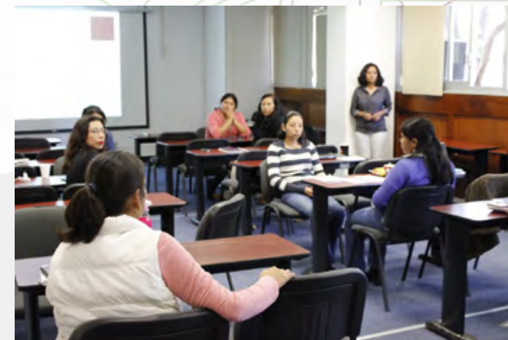
Personal de CEC participando en el curso de Ventas.

En este año se capacitaron 4 directivos, 9 docentes y 3 trabajadores de apoyo a la educación, a través de cursos de capacitación con temas de Ventas, Habilidades Directivas, Desarrollo Humano, y áreas de especialidad para la Gestión Directiva.