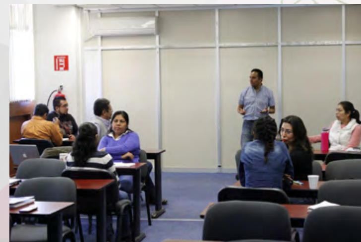
Personal Docente y de Apoyo a la Educación del CEC, en el curso de Ventas.