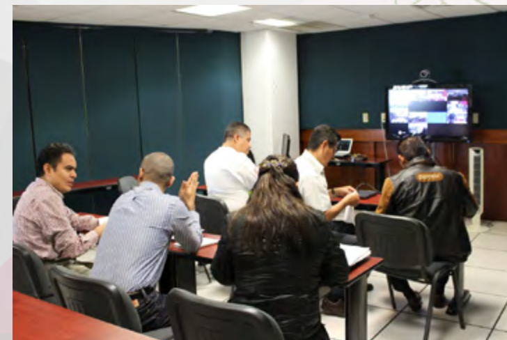
Personal de CEC Oaxaca participando en el curso de Formación de Auditores Internos.