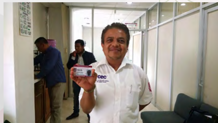
Egresado politécnico mostrando la credencial que lo identifica como egresado del IPN.