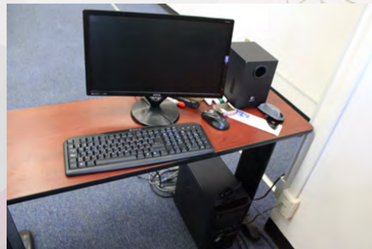
Equipo de cómputo donado y colocado en el aula "B" del CEC Oaxaca.