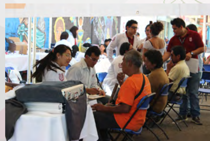
Población del municipio de Santa Cruz Xoxocotlán Oaxaca, recibiendo atención médica de brigadistas de servicio social del IPN.