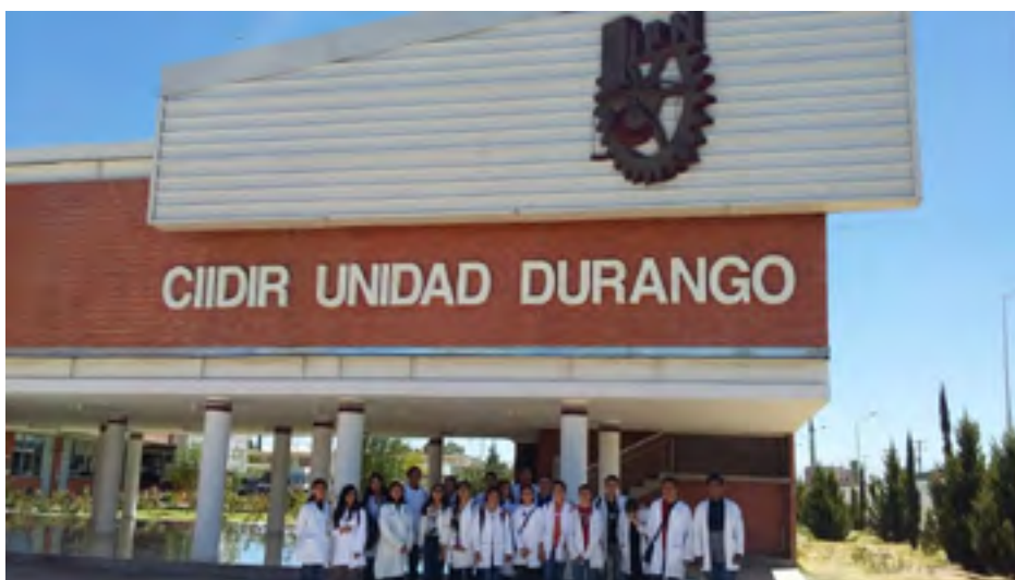
Recorrido durante la Jornada Infantil

Además el 18 de noviembre se llevó a cabo la 1 era Jornada Infantil “La Ciencia y Yo”, en la cual participaron las academias de Entomología y de Ecología y Sistemática de este CIIDIR Durango, se realizó en la Sala de Usos Múltiples, donde se hicieron recorridos y exposiciones a grupos de niños de primarias de esta ciudad explicando de manera simple y digerible temas de investigación.