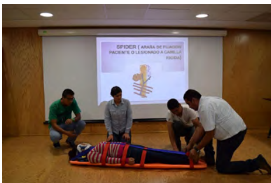
Poniendo en práctica los conocimientos