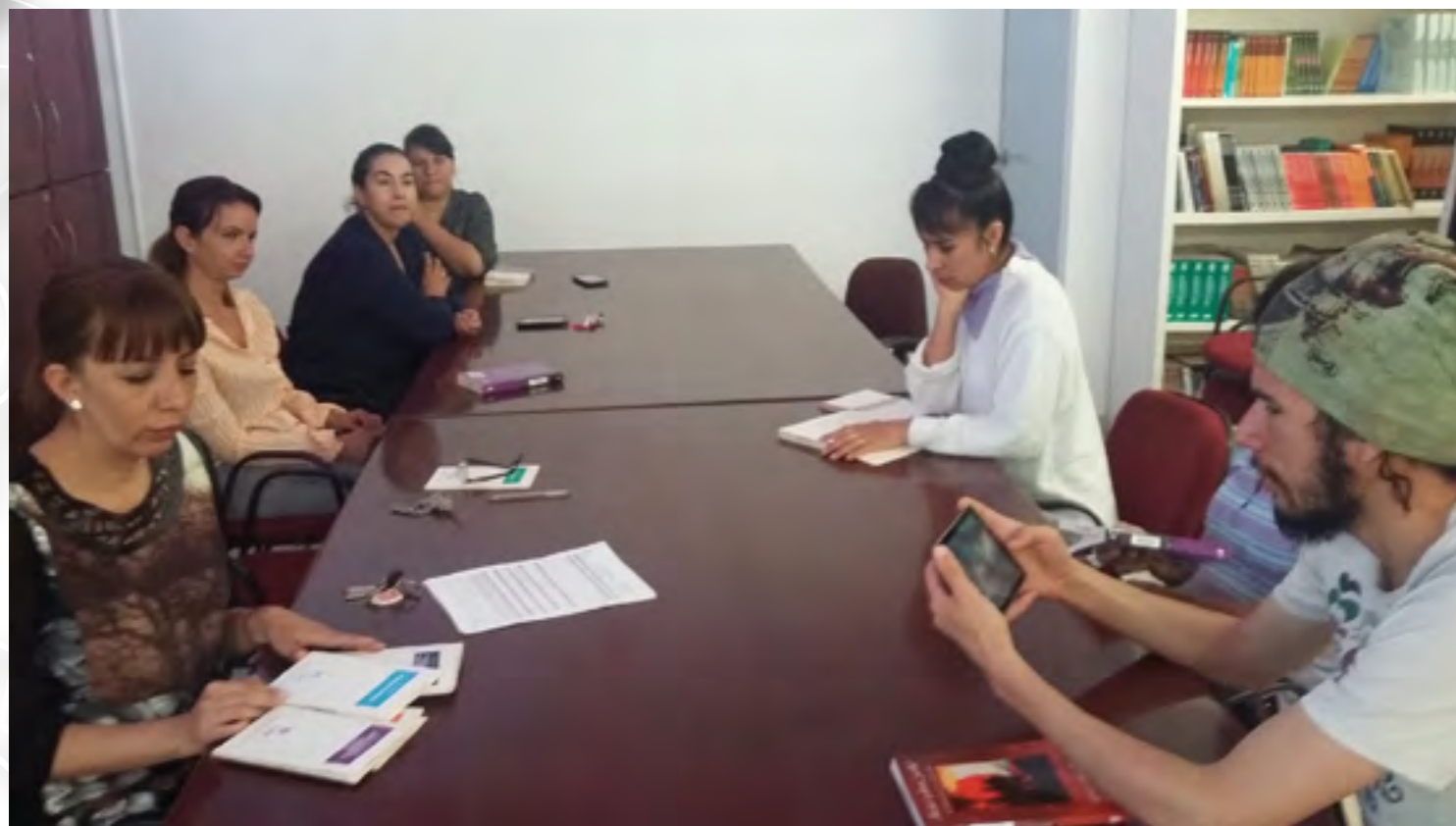
Círculo de lectura

Como parte de la conmemoración del “Día mundial del libro y del Derecho de Autor”, se realizó en la Biblioteca del CIIDIR Durango el “Círculo de lectura” donde los participantes disfrutaron una mañana amena de lectura y comentarios de diversas obras literarias.