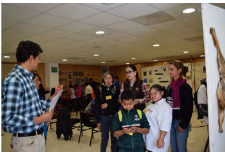
Grupo de niños que visitó la Central de Instrumentación