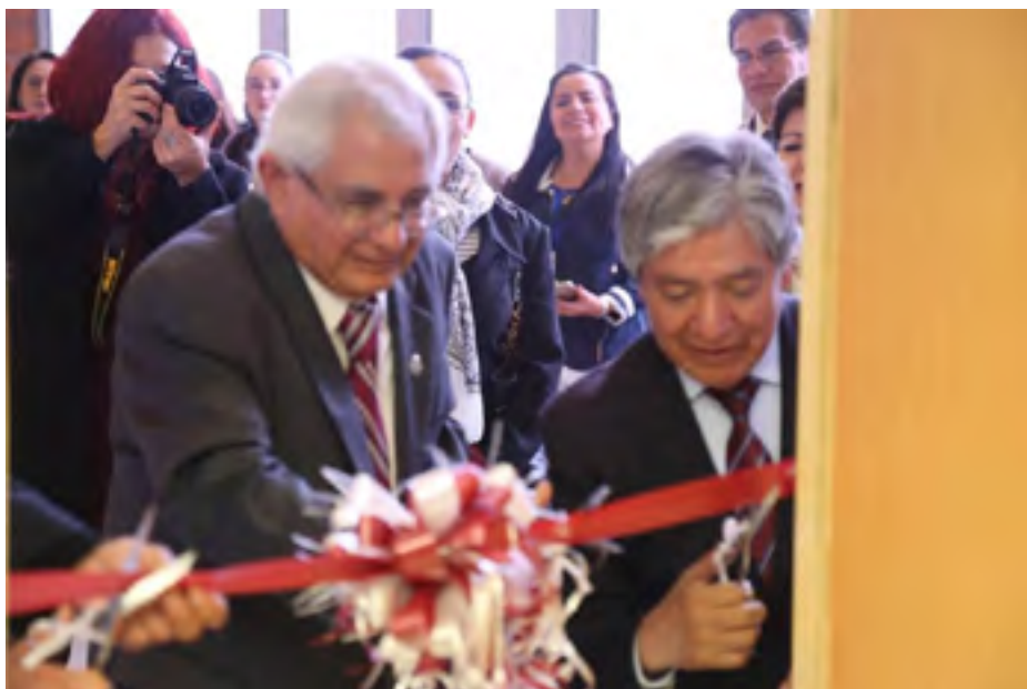
Cortando el listón