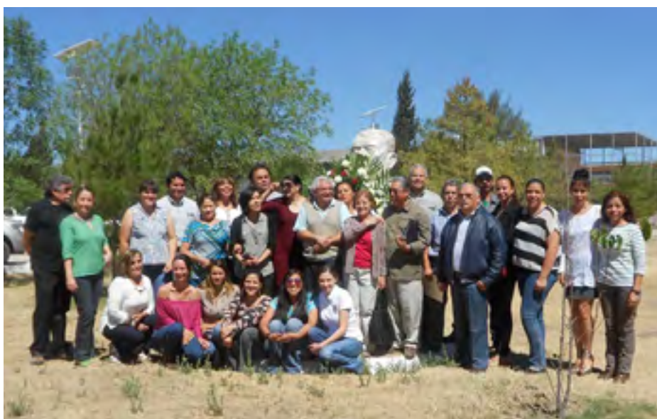
Comunidad Politécnica en la Ofrenda Floral