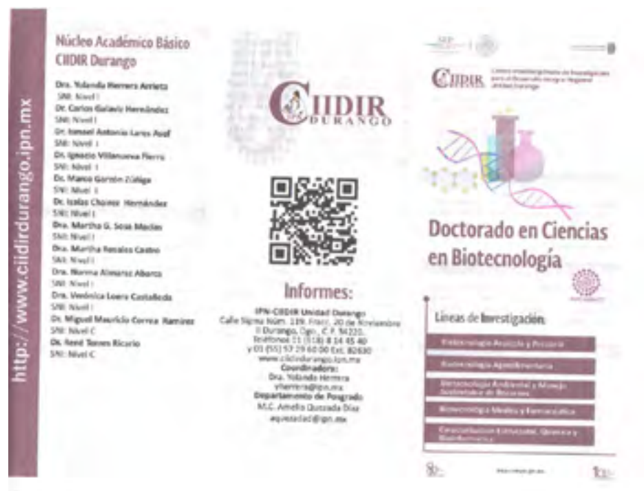
Tríptico del DCB

CIIDIR Durango con el propósito de cumplir con su compromiso de formar el capital humano con alta capacidad científica, tecnológica y de innovación e impulsar el desarrollo de la ciencia, ofertó durante este año tres Programas de Posgrado: “Maestría en Ciencias en Gestión Ambiental (MCGA)”, “Doctorado en Ciencias en Biotecnología (DCB)” y el “Doctorado en Ciencias en Conservación del Patrimonio Paisajístico (DCCPP)” todos acreditados ante el Padrón Nacional de Posgrados de Calidad (PNPC) del Consejo Nacional de Ciencias y Tecnología (CONACyT).