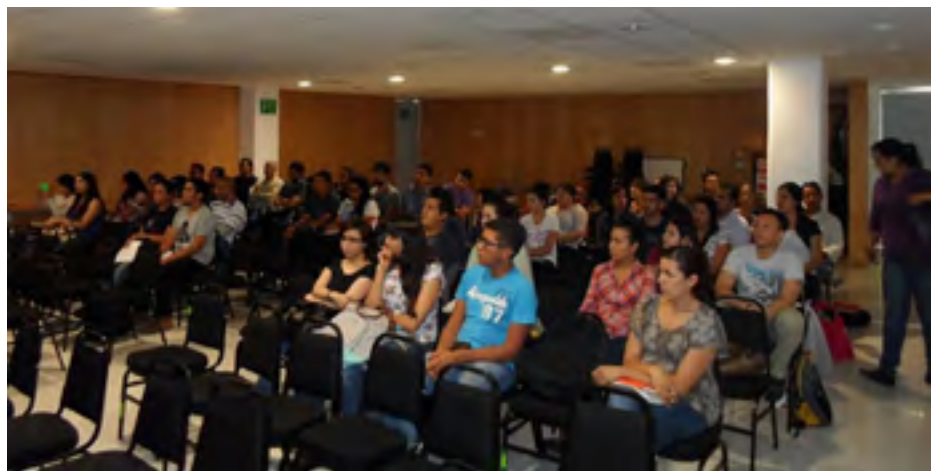
Aspirantes a ingresar a la MCGA