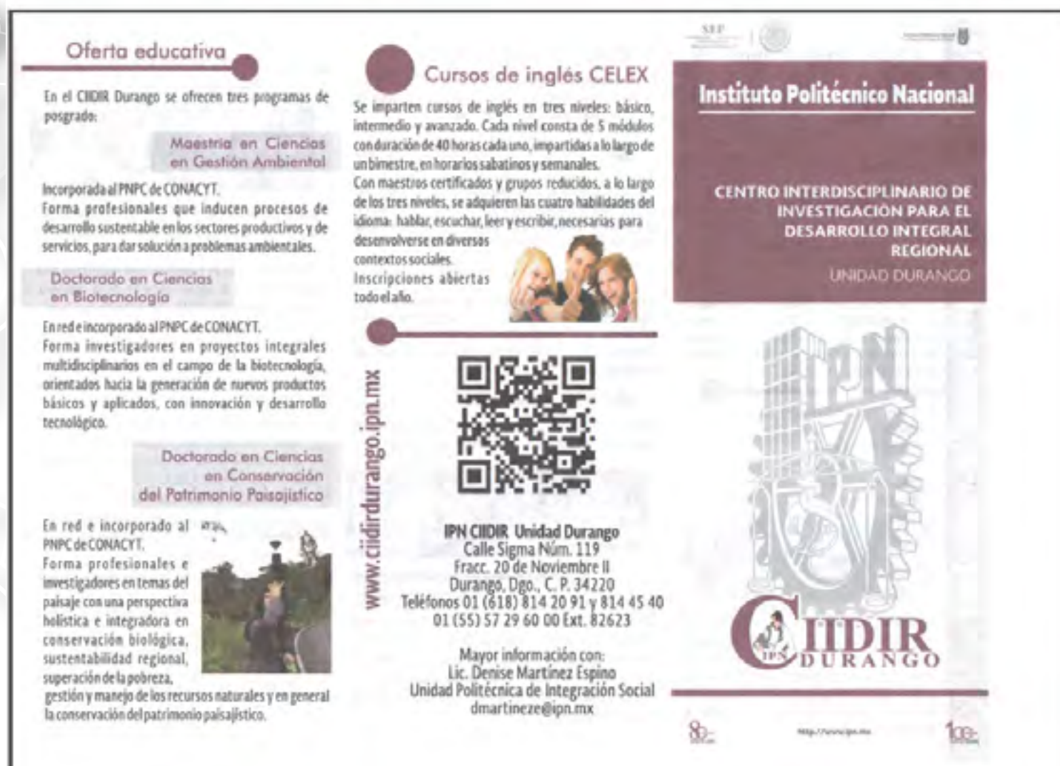
Tríptico del CELEX CIIDIR Durango

Se impartieron en este Centro los Cursos Extracurriculares de Lenguas Extranjeras (CELEX), por maestros certificados, grupos reducidos y atención personalizada; el sistema está estructurado en tres niveles bimestrales: Básico, Intermedio y Avanzado; por lo que durante el año se cursaron cuatro bimestres atendiendo a 78 personas.