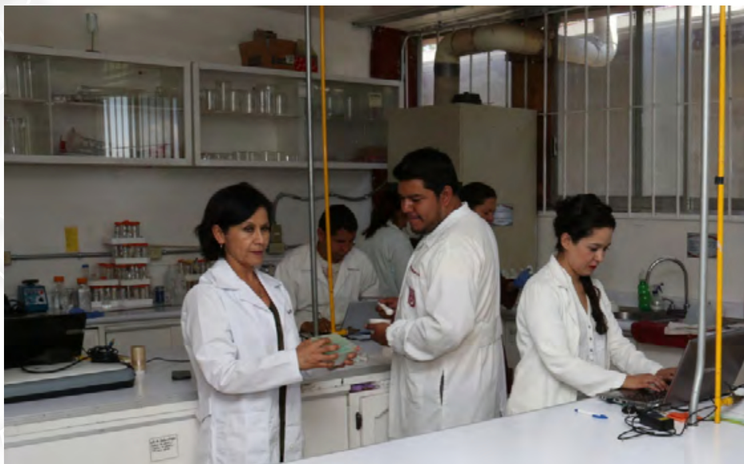
Personal del Laboratorio de Biotecnología

El CIIDIR da a conocer a la comunidad los resultados de sus investigaciones mediante publicaciones en revistas científicas nacionales e internacionales, la publicación de libros y en diversos foros nacionales e internacionales, fueron 21 publicaciones en revistas arbitradas, además de contar con la revista "Vid Supra", editada en este Centro, de distribución gratuita con un tiraje semestral de 500 ejemplares; 32 de sus académicos fueron miembros de las diferentes Redes de Investigación y Posgrado del Instituto Politécnico Nacional.