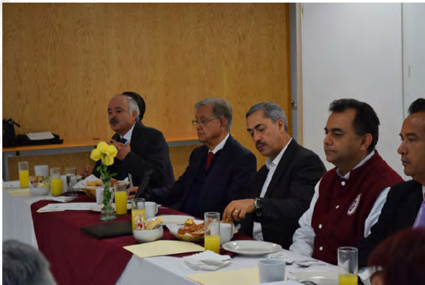
Reunión del Comité de Vinculación

Los temas que se abordan son los marcados por los lineamientos y los que no se encuentran en los lineamientos son para dar servicios a la comunidad. El CIIDIR Durango, con el afán de vincularse permanentemente con el entorno y en el deseo de incrementar la capacidad para convertirse en un agente de cambio, ofrece a los sectores empresarial y público así como a la comunidad en general, una gama de servicios especializados de capacitación, asesoría, investigación y servicios tecnológicos que son los puntos que se dan a conocer en estas reuniones para que puedan ser aprovechados por las demás instituciones o se complementen a su vez por el apoyo de los demás organismos federales.