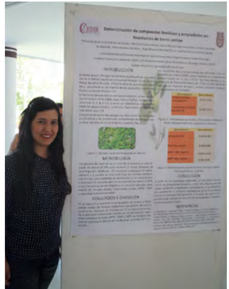
Presentación de Carteles durante el evento.

Se realizó con gran éxito el “VI Simposio Tópicos Biológicos” en el Aula de Usos Múltiples de este Centro, con la participación entusiasta de académicos y estudiantes de ésta y otras instituciones educativas de la ciudad en la pláticas, conferencias y muestra de carteles que durante este evento se llevaron a cabo.