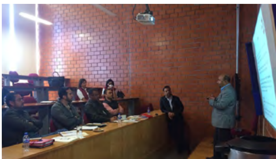
Director de la UIEBT dando a conocer los servicios que ahí se prestan