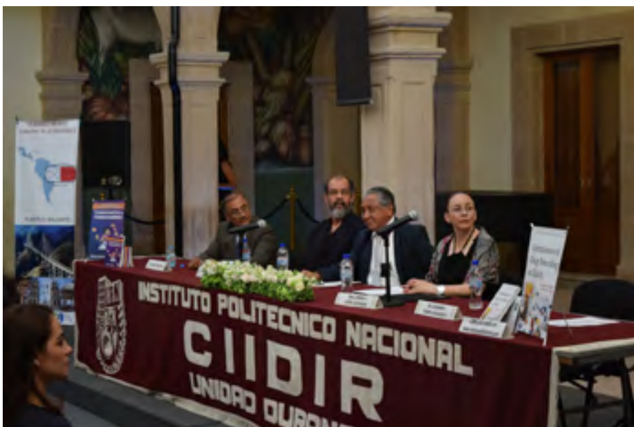
Durante la presentación del libro