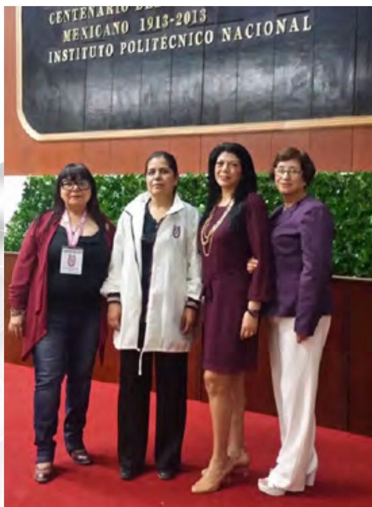
Compañeras politécnicas durante la develación de las letras doradas