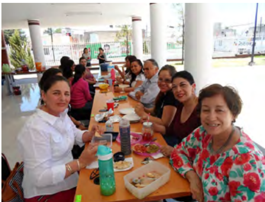
Disfrutando de la convivencia

Festejando el 80 Aniversario de nuestro querido Instituto Politécnico Nacional (IPN), en el CIIDIR Durango se realizó un agradable evento con ofrenda floral al Gral. Lázaro Cárdenas, se realizó un encuentro deportivo con la participación de Alumnos, Docentes y Personal de Apoyo y Asistencia a la Educación; para finalizar con una convivencia en donde se degustó exquisita comida preparada por personal del Centro. ¡Huélum, Huélum, Gloria A la Cachi Cachi Porra A la Cachi Cachi Porra, Pim Pom Porra Pim Pom Porra Politécnico, Politécnico Gloria!