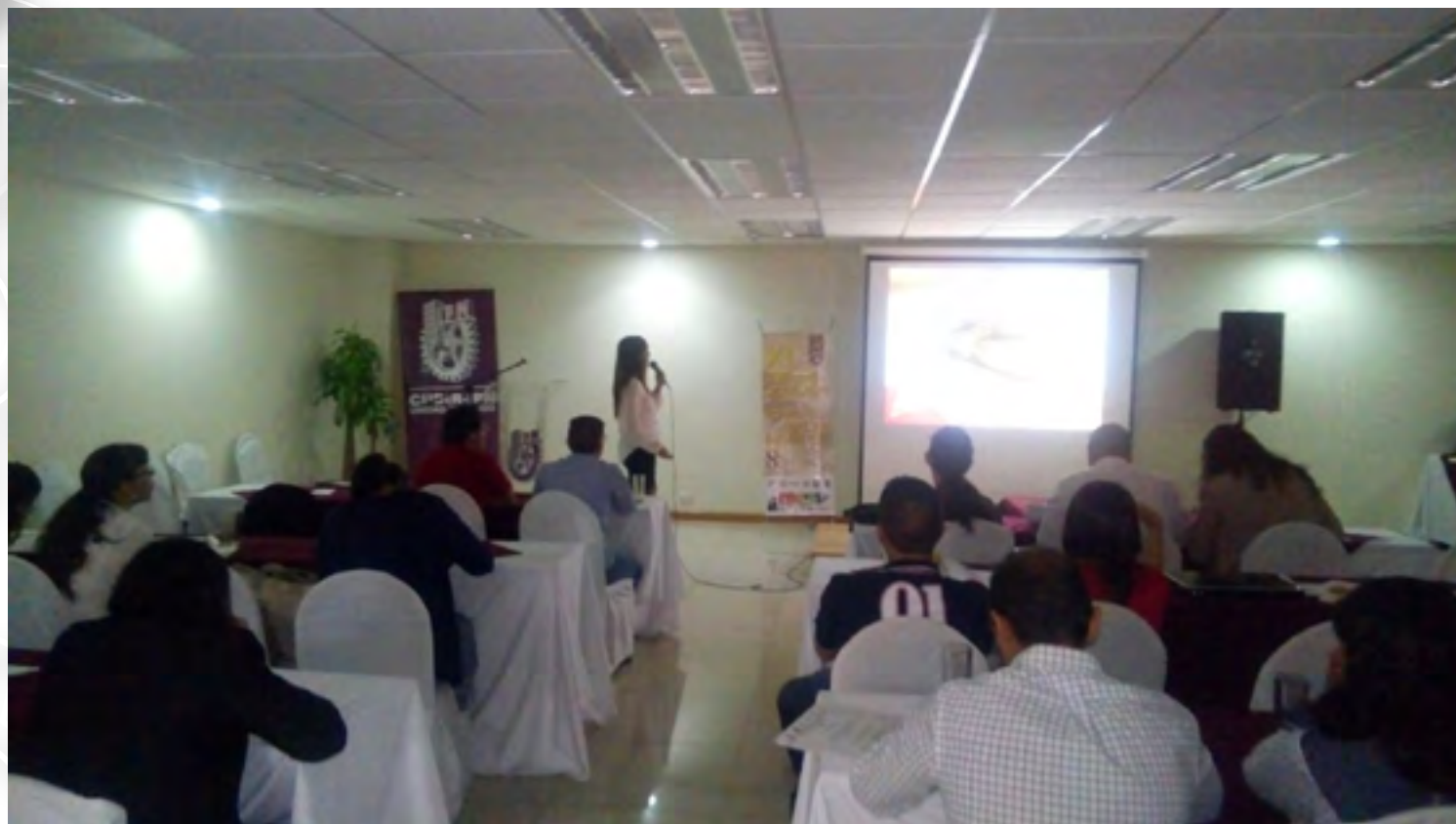
Presentación de proyecto en el Salón Best Western