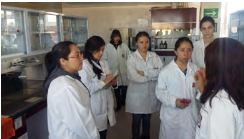
Alumnas de la UPIIZ en la Central de Instrumentación

CIIDIR Durango en vinculación y colaboración con las Instituciones Académicas de todos los niveles educativos, ofrece conferencias, prácticas y visitas guiadas a grupos en donde los investigadores comparten sus conocimientos y asesoran a los estudiantes sobre temas específicos.; el día primero de abril, alumnos de la Universidad Politécnica Interdisciplinaria de Ingeniería (UPIIZ) del IPN visitaron la Central de Instrumentación y realizaron prácticas en este laboratorio; el día 27 de abril recibimos con gusto la visita de estudiantes del Instituto Tecnológico del Valle del Guadiana (ITVG) de las carreras de Desarrollo Comunitario e Innovación Agrícola Sustentable, quienes visitaron el Invernadero y Macrotúnel de este Centro; día 27 de junio alumnos de la Universidad Tecnológica de Poanas (UTP) recibieron una plática sobre temas de Entomología; el siete de octubre alumnos del Instituto Tecnológico Superior de Santiago Papasquiaro de la carrera de Ingeniería en Industrias Alimentarias acudieron al CIIDIR con la finalidad de observar el equipo y los análisis que se realizan en las masas utilizadas en la elaboración de alimentos.