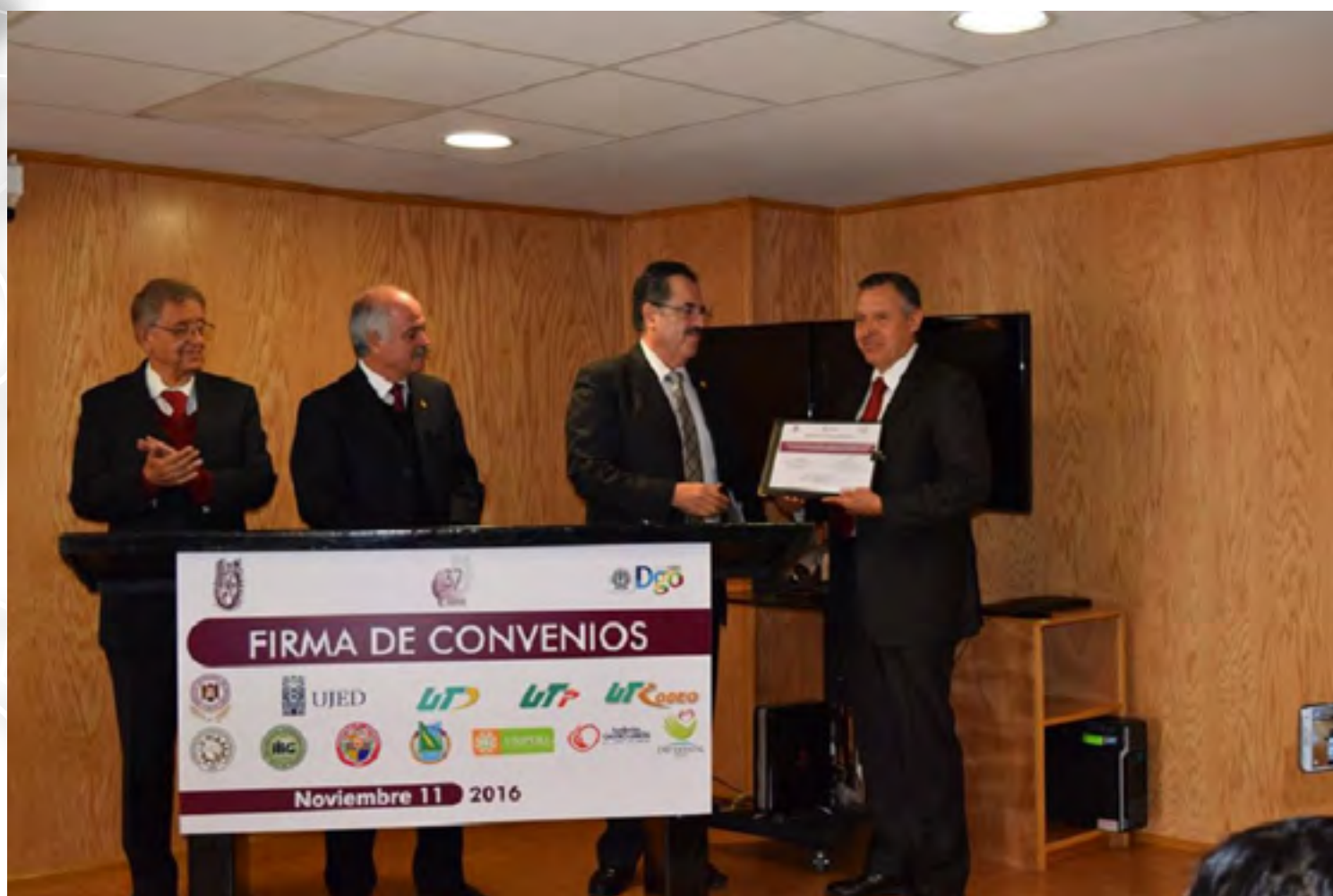
Evento de firma de convenios

En el marco de la Celebración del Aniversario 36 de este CIIDIR Durango se firmaron Convenios de Colaboración, que contempla el Intercambio de alumnos y el desarrollo de proyectos en común, con Instituciones Académicas de todos los niveles educativos y de todo el Estado: Universidad Tecnológica de Durango (UTD), Universidad Tecnológica de Poanas (UTP), Universidad Tecnológica de Rodeo (UTR), Universidad Juárez del Estado de Durango (UJED), Instituto Tecnológico de Durango (ITD), Instituto Tecnológico del Valle del Guadiana (ITVG), Universidad Politécnica de Durango (UNIPOLI), DIF Estatal.