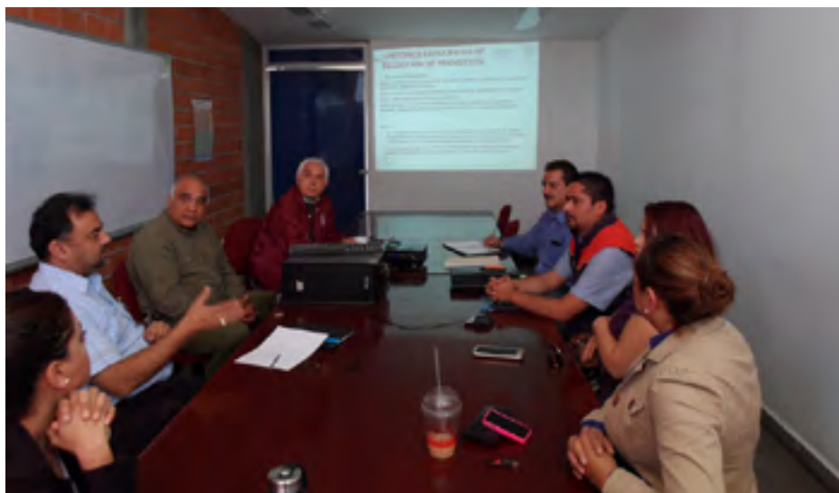
Reunión con delegados de SEDESOL y PROSPERA

Se llevaron a cabo reuniones de trabajo en este CIIDIR Durango, se contó con la presencia del Delegado y representantes de la Secretaría de Desarrollo Social (SEDESOL) en Durango, delegados del programa PROSPERA y del Instituto Nacional de Economía Social (INAES), también personalidades del Sector Ciencia y Tecnología con el equipo de planeación del Gobierno del Estado recién electo; donde se dieron a conocer los servicios que ofrece el Instituto Politécnico Nacional a través de sus tres Unidades en la ciudad, Centro de Educación Continua (CECUD) Unidad Durango, Incubadora de Empresas de Base Tecnológica (IEBT) y este CIIDIR Durango con el objeto de consolidar proyectos de colaboración, conjuntar habilidades y proyectos en beneficio del Estado.