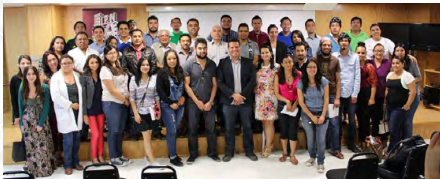
Alumnos participantes al final del evento