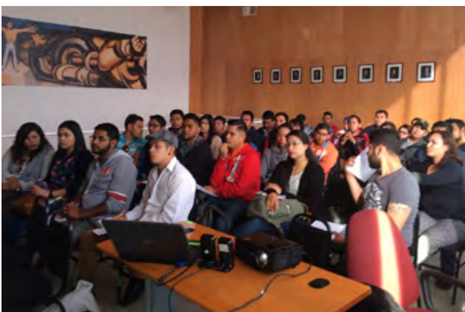
Alumnos del ITVG en plática antes de visitar Invernadero y Macrotúnel