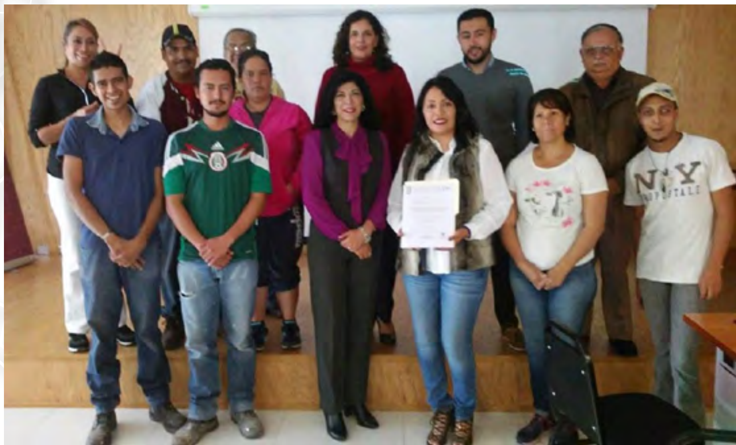
Personal del Centro después de la conferencia “Derecho a la protección contra la discriminación”

El Comité de Seguridad y Contra la Violencia (COSECOVI) en conjunto con la Comisión Estatal de Derechos Humanos y el Centro de Integración Juvenil A.C., se encargaron durante este año de impartir pláticas y conferencias orientadas a promover el respeto y fomentar los valores entre la Comunidad Politécnica. “Violencia y adicciones”, “Derecho a la protección contra todo tipo de discriminación”, “Información básica sobre el consumo de marihuana”, “Derecho a la protección contra la discriminación”, “Sensibilización en el respeto a las diferencias” y “Habilidades de Confrontamiento” fueron las Conferencias impartidas a personal del Centro y estudiantes de nivel básico que asistieron por invitación a nuestro Centro.