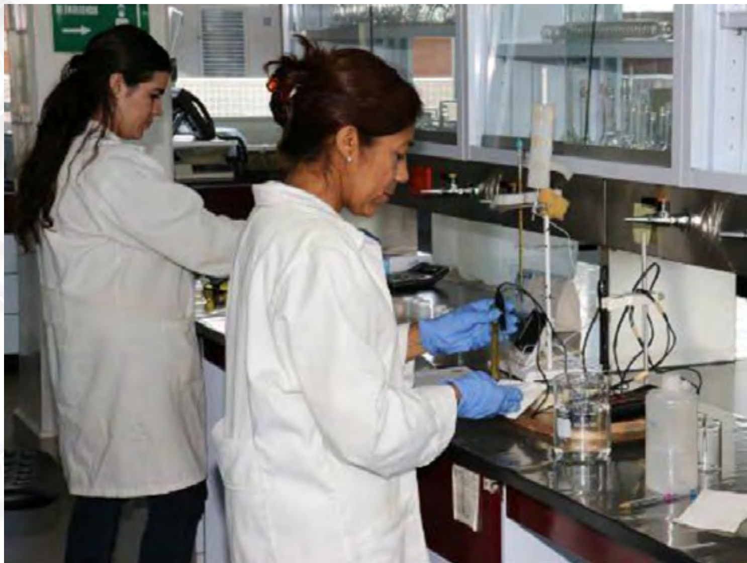
Personal docente de la CI

La Central de Instrumentación ha participado en ensayos de aptitud a nivel nacional e internacional, en programas de vigilancia sanitaria y en programas gubernamentales de calidad del agua para uso y consumo humano; en un marco de calidad, confiabilidad y respeto al Medio Ambiente, con personal académico, técnico y administrativo en capacitación continua, para desarrollar con eficiencia las actividades que les corresponden, de acuerdo a la organización interna, tanto del CIIDIR como del laboratorio.