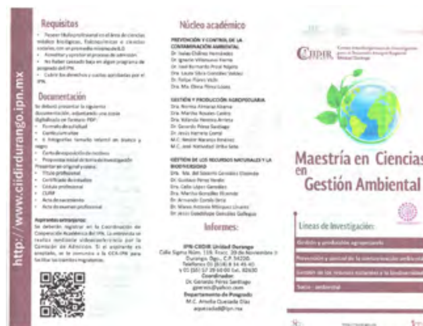
Tríptico de la MCGA