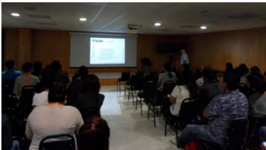
El Maestro Decano de este CIIDIR durante su presentación