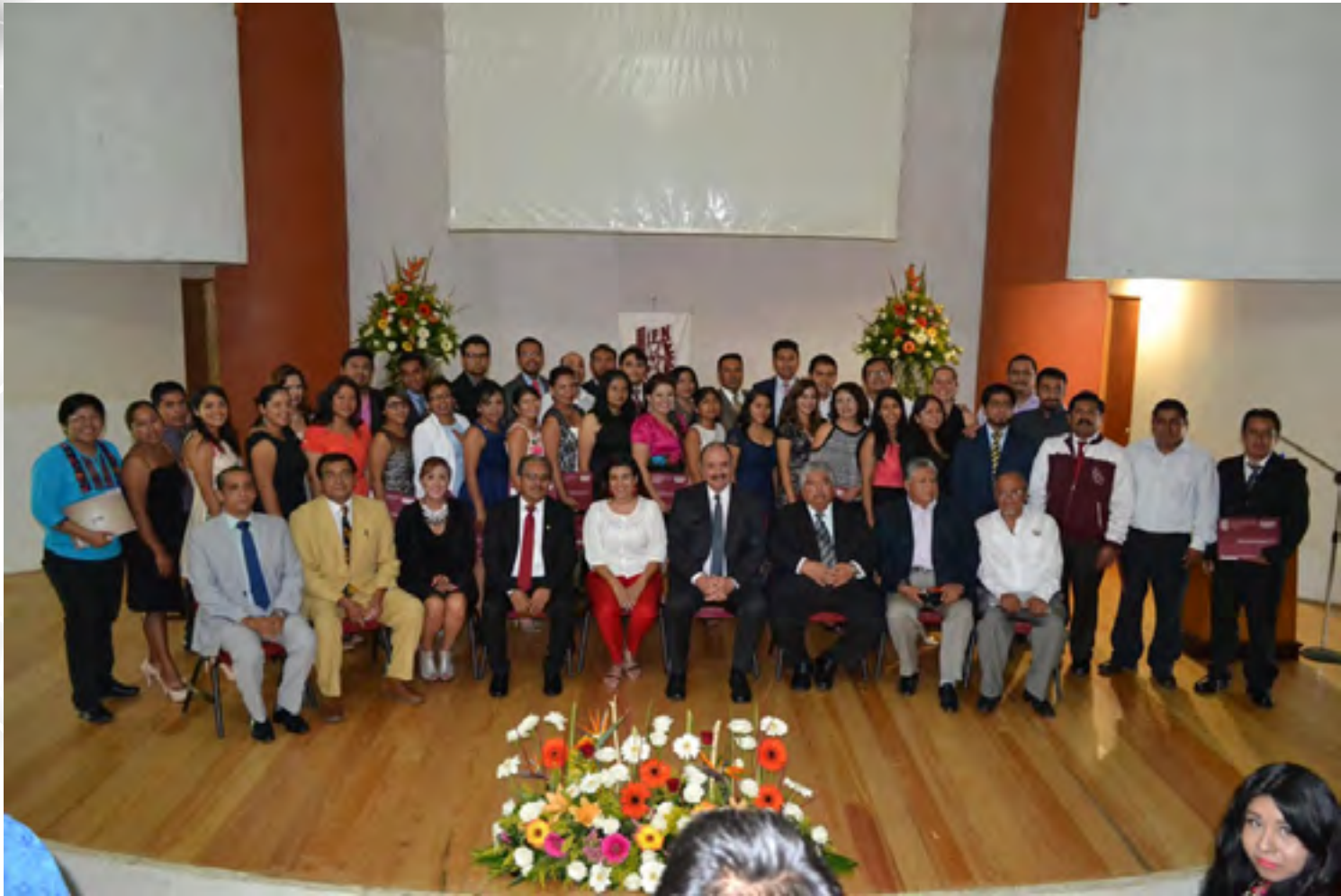
Programas de Posgrado

Se impartieron tres programas de posgrado “Maestría Ciencias en Conservación y Aprovechamiento de los Recursos Naturales” con un total de 82 alumnos, “Maestría en Gestión de Proyectos para el Desarrollo Solidario” con un total de 20 alumnos y “Doctorado en Ciencias en Conservación y Aprovechamiento de los Recursos Naturales” con un total de 53 alumnos.