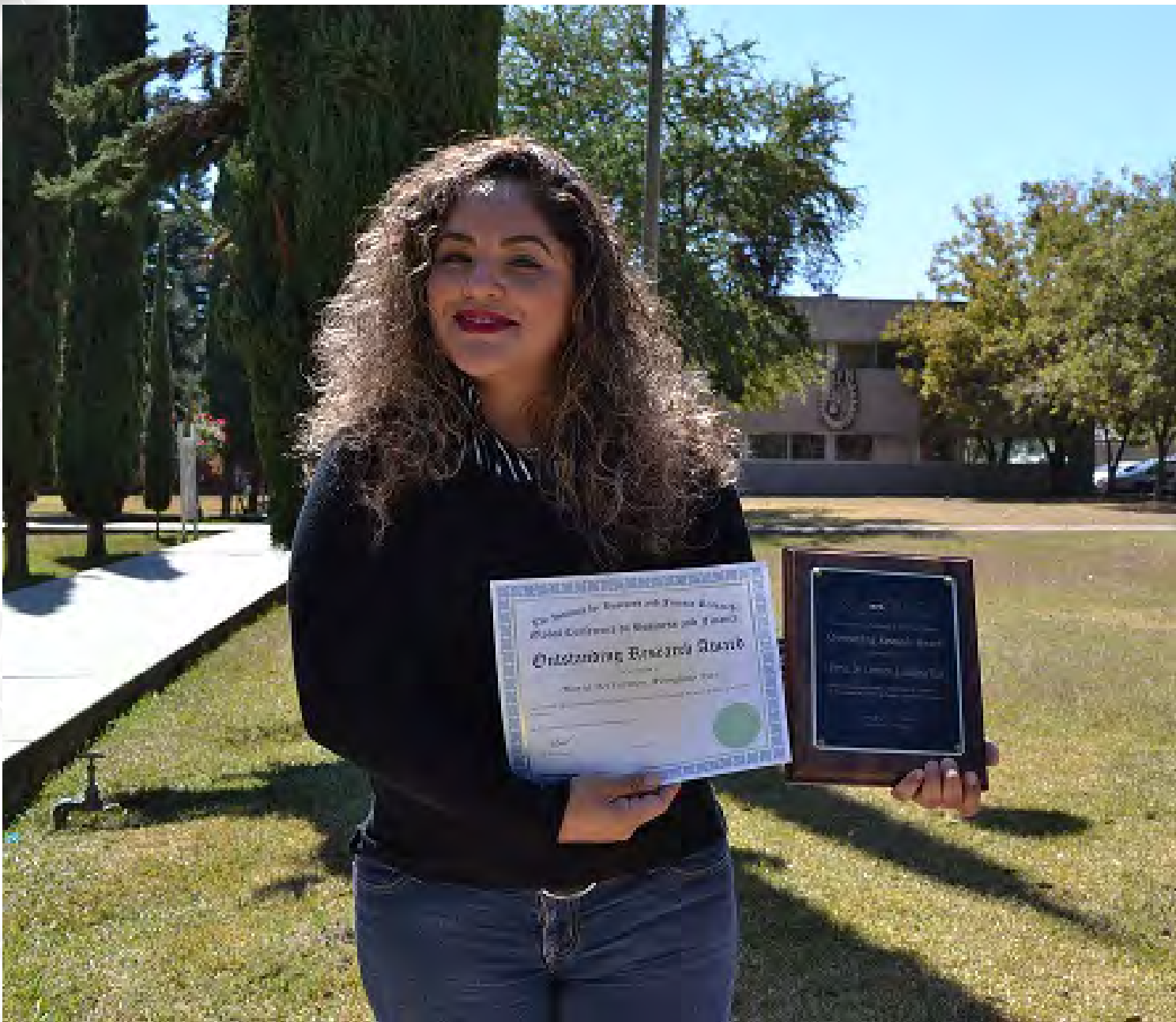
Premio “Outstanding Research Award”