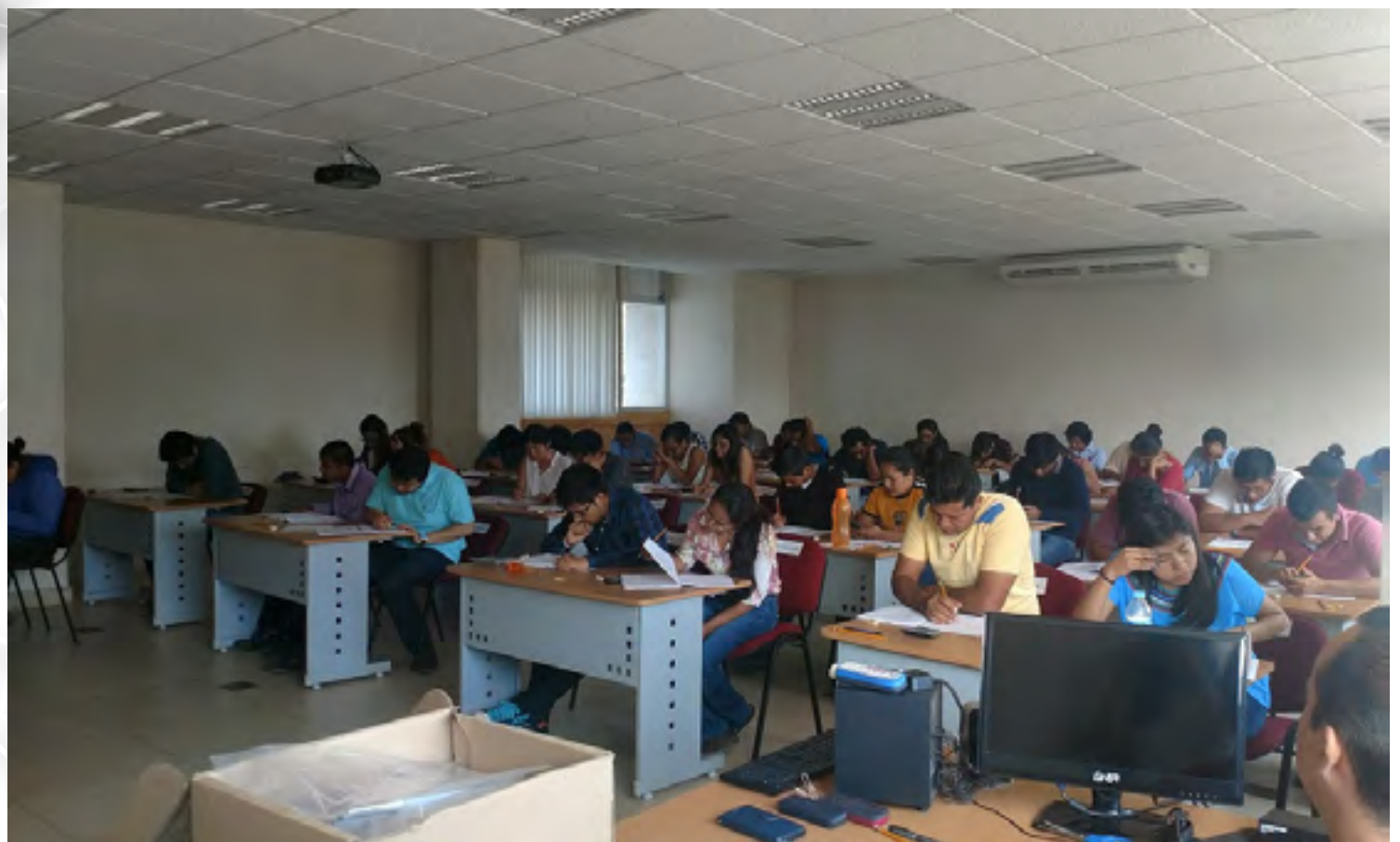
Aplicación de Examen EXANI III

Durante el proceso de admisión a los tres programas de posgrado que se ofertan en este Centro de Investigación, se aplicaron exámenes de inglés; 74 a aspirantes de nivel Doctorado y 124 a aspirantes de nivel Maestría.