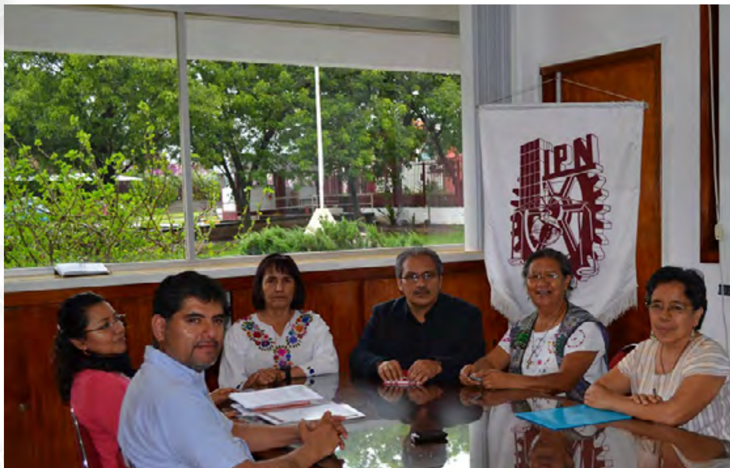
Firma de Convenios Vinculados

El monto de los convenios ascendió a un total de $3'941,000.00.