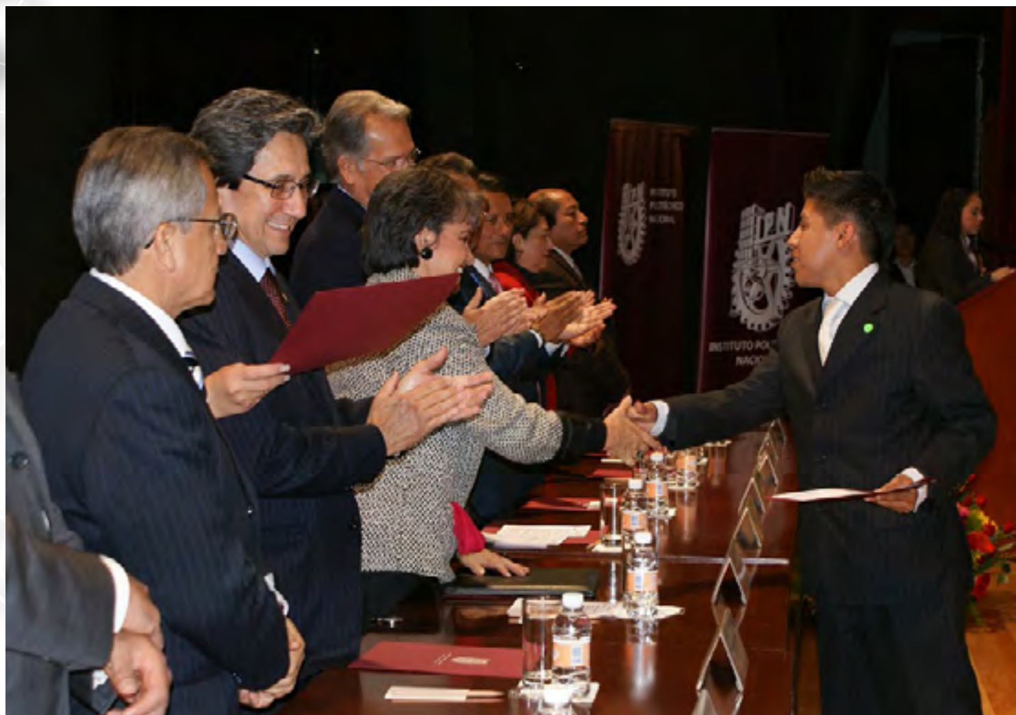
Premio al Desempeño Académico