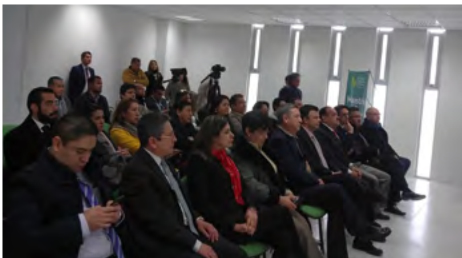
El IPN fue invitado de honor en la firma del convenio

El Instituto Politécnico Nacional fue invitado a la firma del convenio entre el Colegio del Estado de Hidalgo (CEH) y el Consejo Rector de Pachuca Ciudad del Conocimiento y la Cultura (PCCyC) cuyo objetivo será la elaboración del Programa Parcial de Desarrollo Urbano para el sector de ciencia, tecnología e innovación de PCCyC.