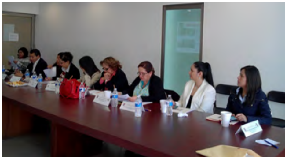
Comité externo llevando a cabo la evaluación de un proyecto

En las instalaciones del Consejo de Ciencia, Tecnología e Innovación Hidalgo (CITNOVA), se llevó a cabo el Comité Externo de Evaluación de Proyectos. Con la participación de 16 emprendedores hidalguenses en diferentes categorías. De dicha evaluación fueron seleccionados seis proyectos para incorporarse al proceso de incubación.