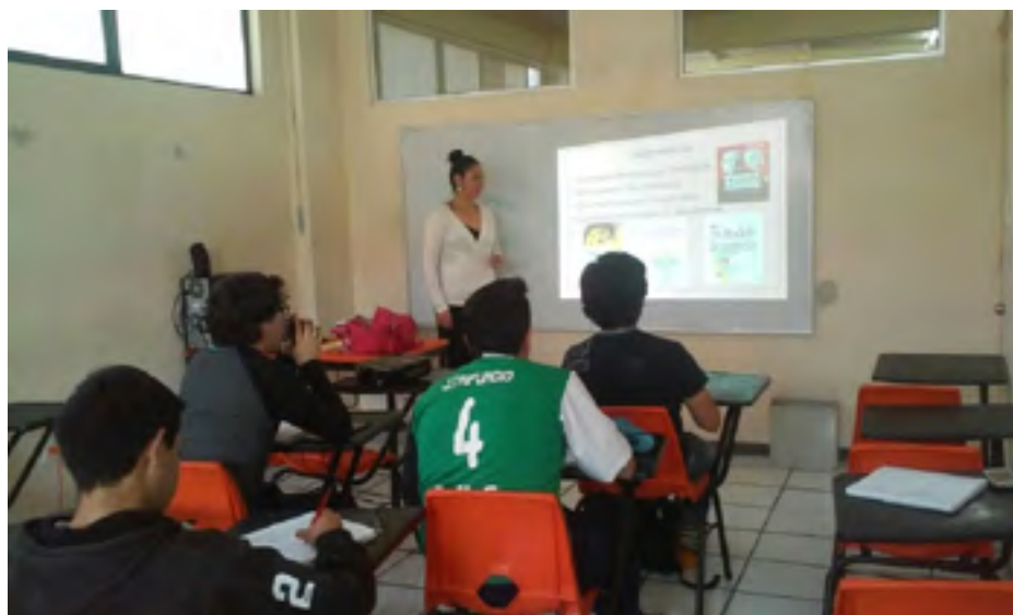
Alumnos del Cecyt No. 16 en el Taller “Actitud Emprendedora”

La Unidad Incubadora de Empresas de Base Tecnológica Hidalgo (UIEBTH), trabaja para fortalecer las habilidades de emprendimiento de la comunidad politécnica por medio de cursos y talleres. El 16 de mayo de 2016 se realizó el taller denominado “De la actitud emprendedora a la oportunidad de empresa” en las instalaciones del Centro de Estudios Científico y Tecnológicos (CECyT) No. 16. Respondieron a la convocatoria alumnos interesados conocer más acerca del tema.