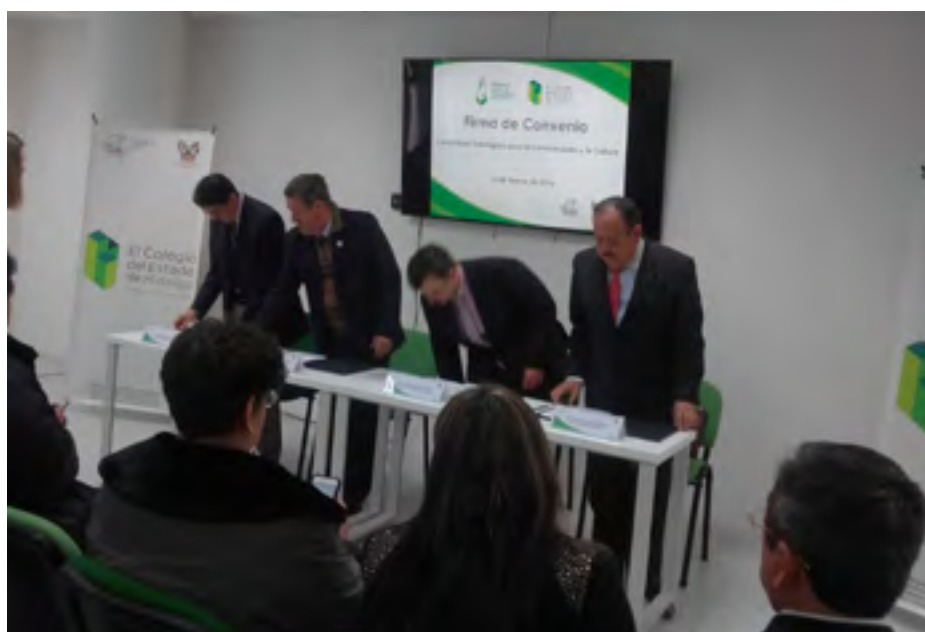
Firma del convenio de colaboración entre los funcionarios del Estado y el PCCyC