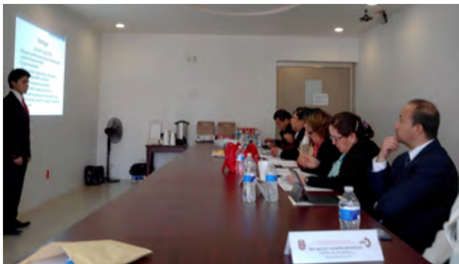
Emprendedor exponiendo su idea de negocio ante el comité evaluador