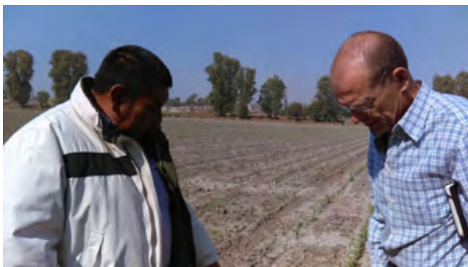
Agricultor hidalguense guía la visita del personal de la UIEBTH

La Unidad Incubadora de Empresas de Base Tecnológica Hidalgo (UIEBTH) brinda servicio de asesoría y capacitación a proyectos agro industriales en Hidalgo. Para ello se hace trabajo de campo con los emprendedores para recabar información que permita entender la naturaleza del negocio. El ocho de abril de 2016 se visitó en el municipio de Apan una empresa dedicada a la Lombricomposta, que produce tierra libre de semillas, patógena, pesticida y metales pesados muy útil para cultivos diferenciados en crecimiento.