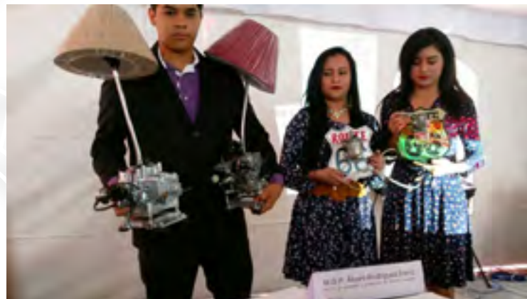
Alumnos del Centro Universitario Continental exponen su idea de negocio

Todos los años el Centro Universitario Continental (CUC) realiza en la ciudad de Pachuca, Hidalgo la Feria Expo Innova. En ella se presentan trabajos de los alumnos buscando fortalecer la innovación y el emprendimiento. El cuatro de mayo de 2016 la Unidad Incubadora de Empresas de Base Tecnológica (UIEBTH) participó como jurado en la pasarela de proyectos.