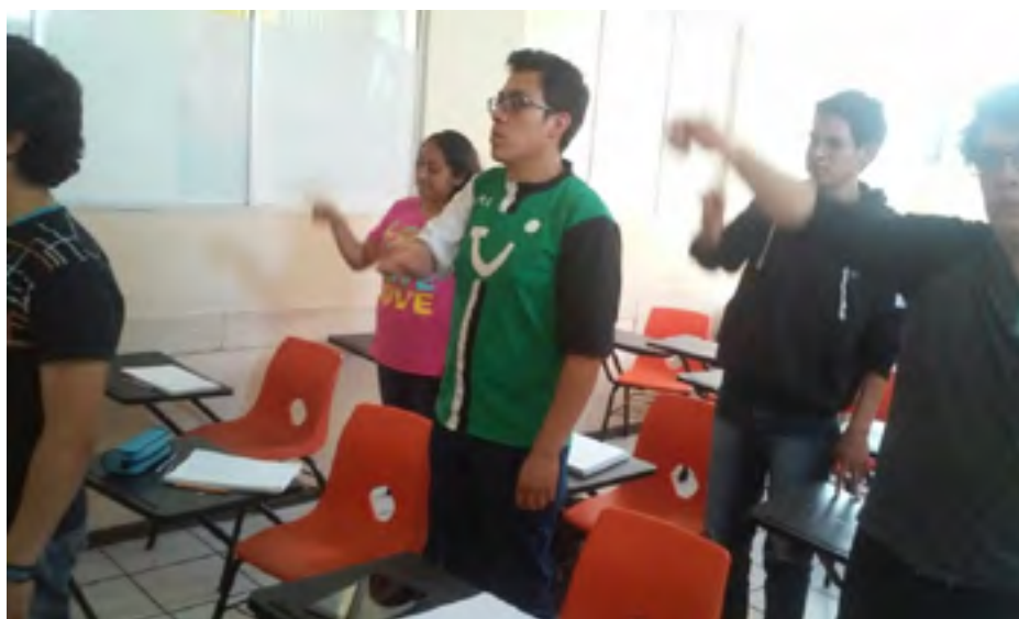
Actividades en el Taller “Actitud Emprendedora”