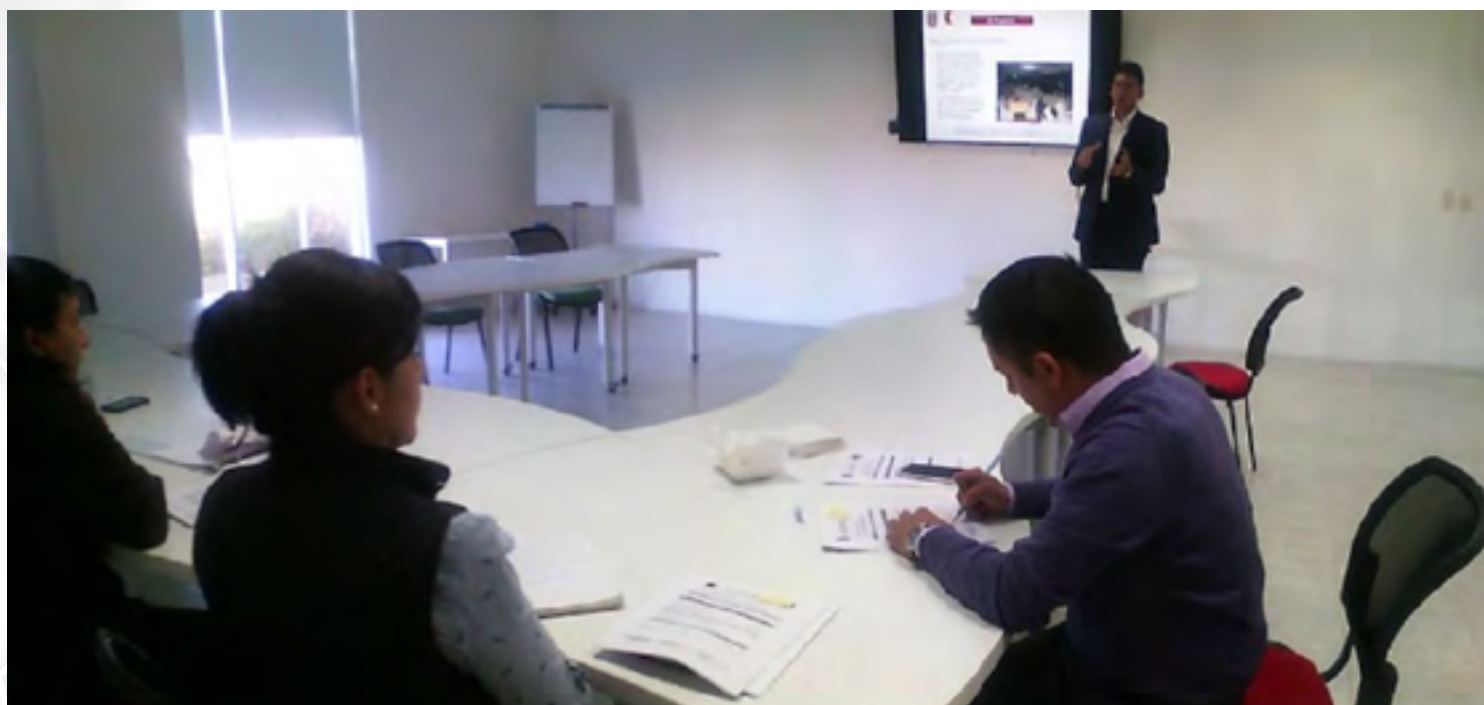
Emprendedor exponiendo su proyecto al Comité Interno