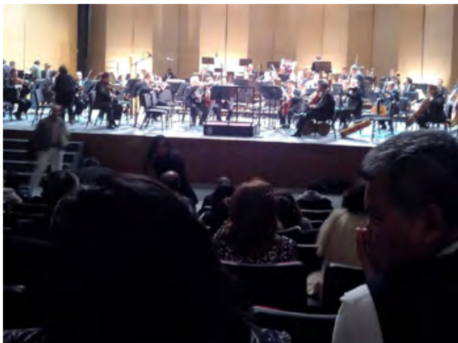
Desarrollo del concierto en el auditorio Gota de Plata