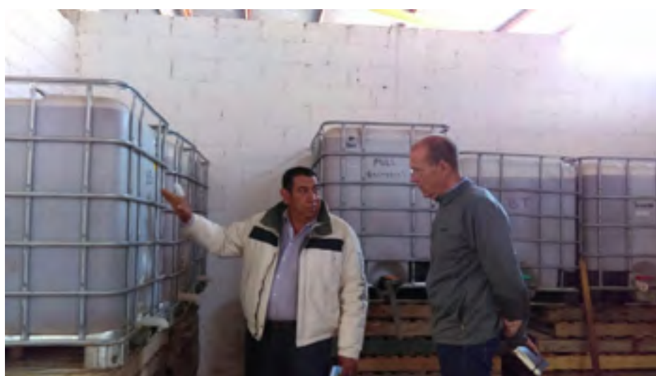
La UIEBTH revisa el proceso de la elaboración de la lombricomposta