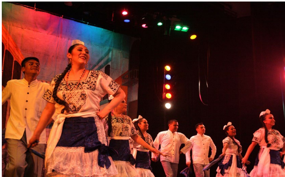
Día internacional de la danza.

Se efectuaron reuniones de trabajo con la Dirección de Difusión y Fomento a la Cultura para coordinar y dar seguimiento a las actividades artístico culturales que se realizaron en el Centro Cultural “Jaime Torres Bodet” y en las unidades académicas de los niveles medio superior y superior, tales como: danza, teatro, cine, exposiciones, programas temáticos y conciertos que ofreció la Orquesta Sinfónica del IPN (OSIPN).