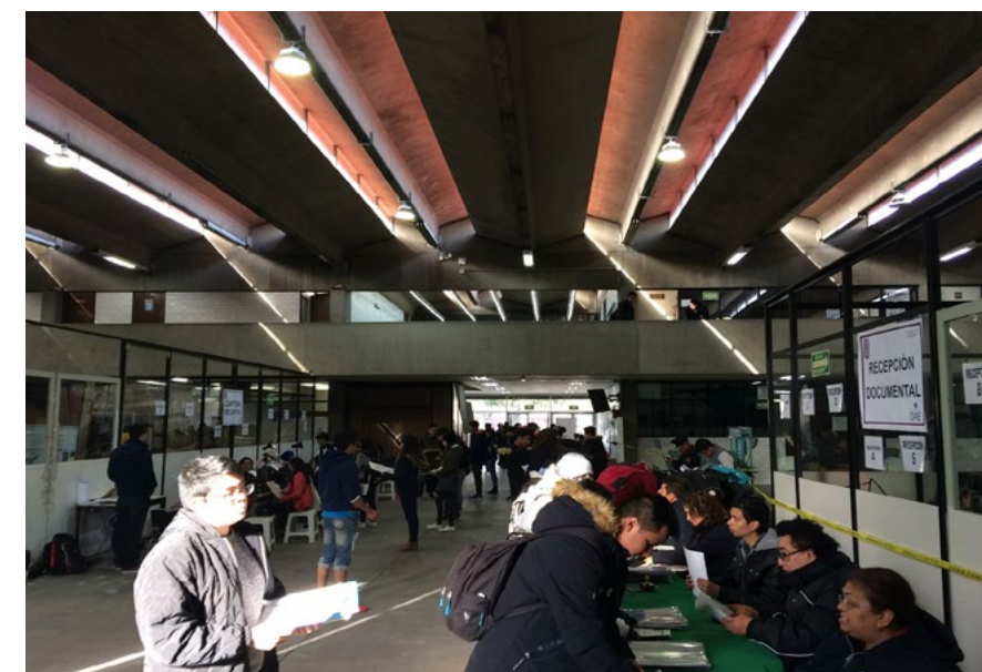
Alumnos de nuevo ingreso inscritos