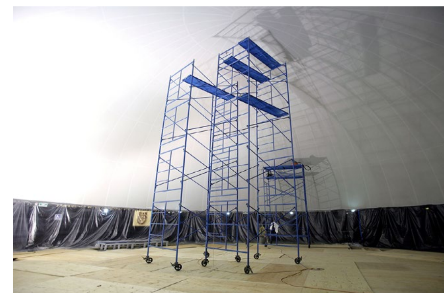
Trabajos de remodelación.