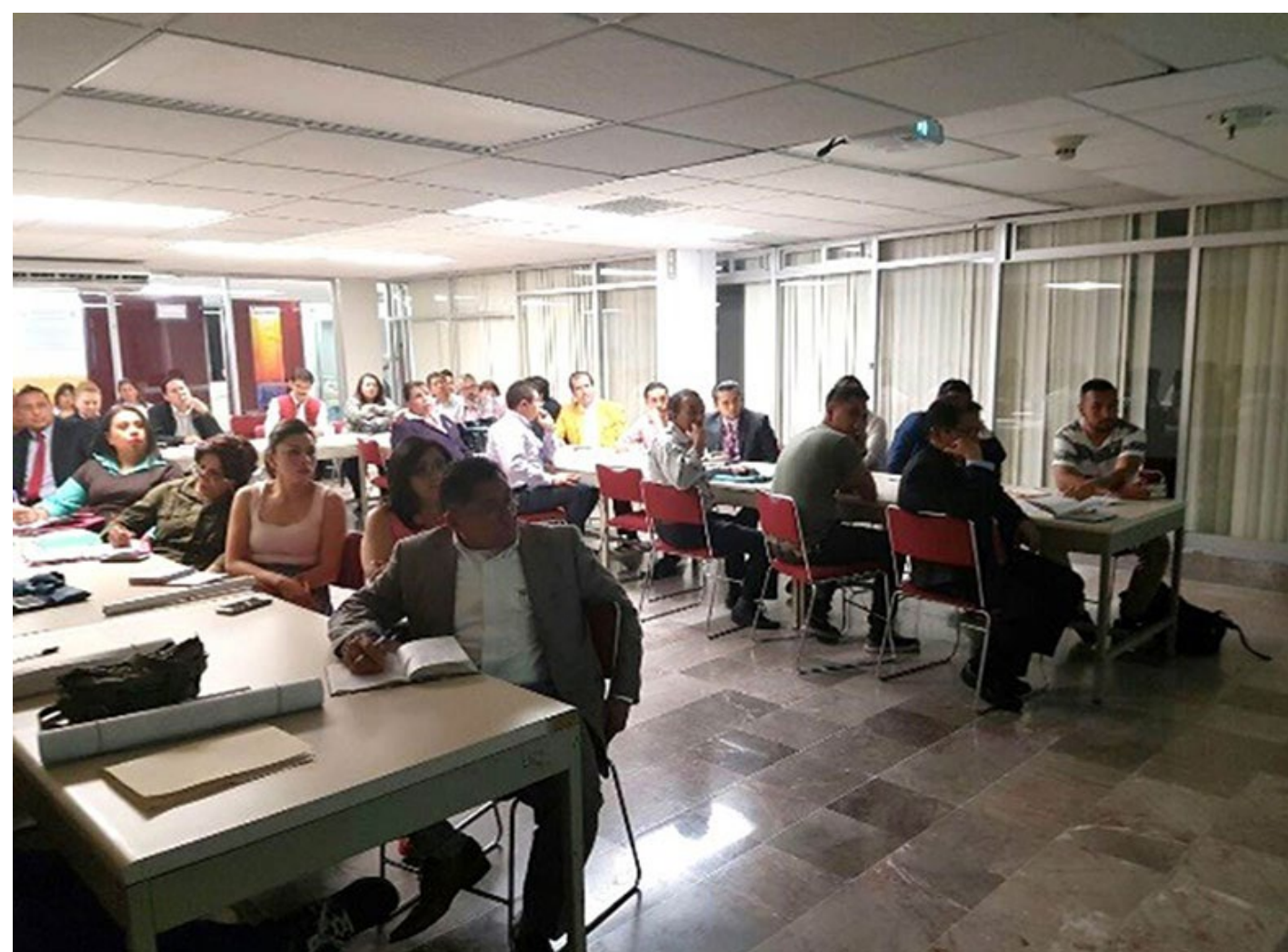
Encuentro Institucional de Bibliotecarios

Con el objetivo de mejorar la gestión de las 79 bibliotecas que integran la Red Institucional, en coordinación con la Dirección de Bibliotecas se realizó el Encuentro Institucional de Bibliotecari@s 2017 "Un desafío orientado a la calidad de los servicios", los responsables de estos recintos recibieron a través de ponencias y talleres, las herramientas para fortalecer sus funciones en beneficio de los usuarios.