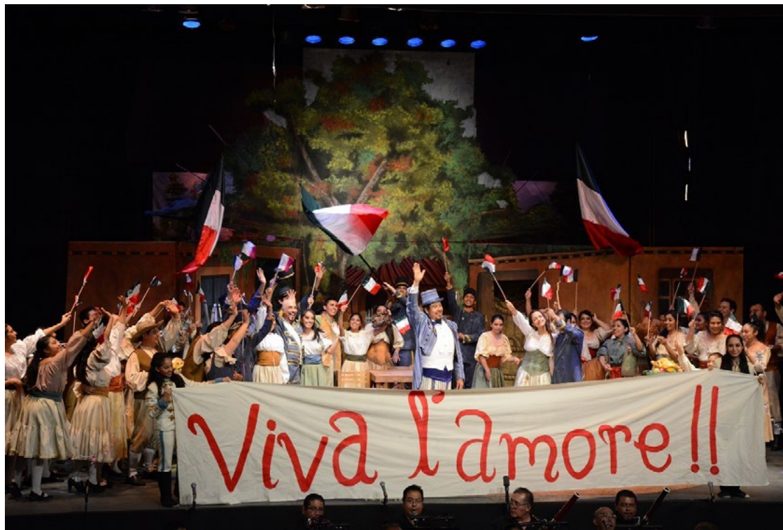
Orquesta Sinfónica del IPN (OSIPN)

Actividad: Reuniones de trabajo para coordinar y dar seguimiento a las diversas actividades sustantivas que desempeñan las Direcciones de Coordinación y Centro, que son parte de la estructura orgánica de la Secretaría Categoría: Deportiva Fecha de inicio: 1 de enero de 2017 Fecha de término: 31 de diciembre de 2017