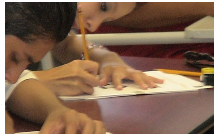
Aspirantes en aplicación del examen de admisión