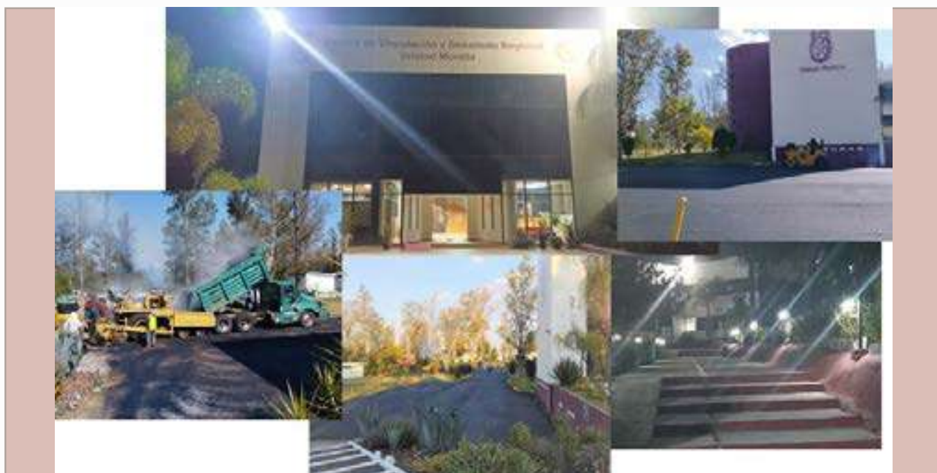
Iluminación de edificio, corredor y estacionamiento y asfaltado de estacionamiento.

Con el propósito de mejorar las condiciones de tránsito y resguardo de los vehículos tanto propiedad del IPN, como de la comunidad y usuarios del DVDR Morelia y la seguridad para el tránsito vespertino de personas, así como para mejorar la seguridad e imagen de las instalaciones del CVDR Morelia, con recursos generados por impartición de cursos, se llevó a cabo la instalación de cinco luminarias "Led" en azotea del edificio, así como cinco luminarias con paneles solares en el estacionamiento y se sustituyeron 13 luminarias de corredor y se llevó a cabo la pavimentación del Estacionamiento, con una carpeta asfáltica.