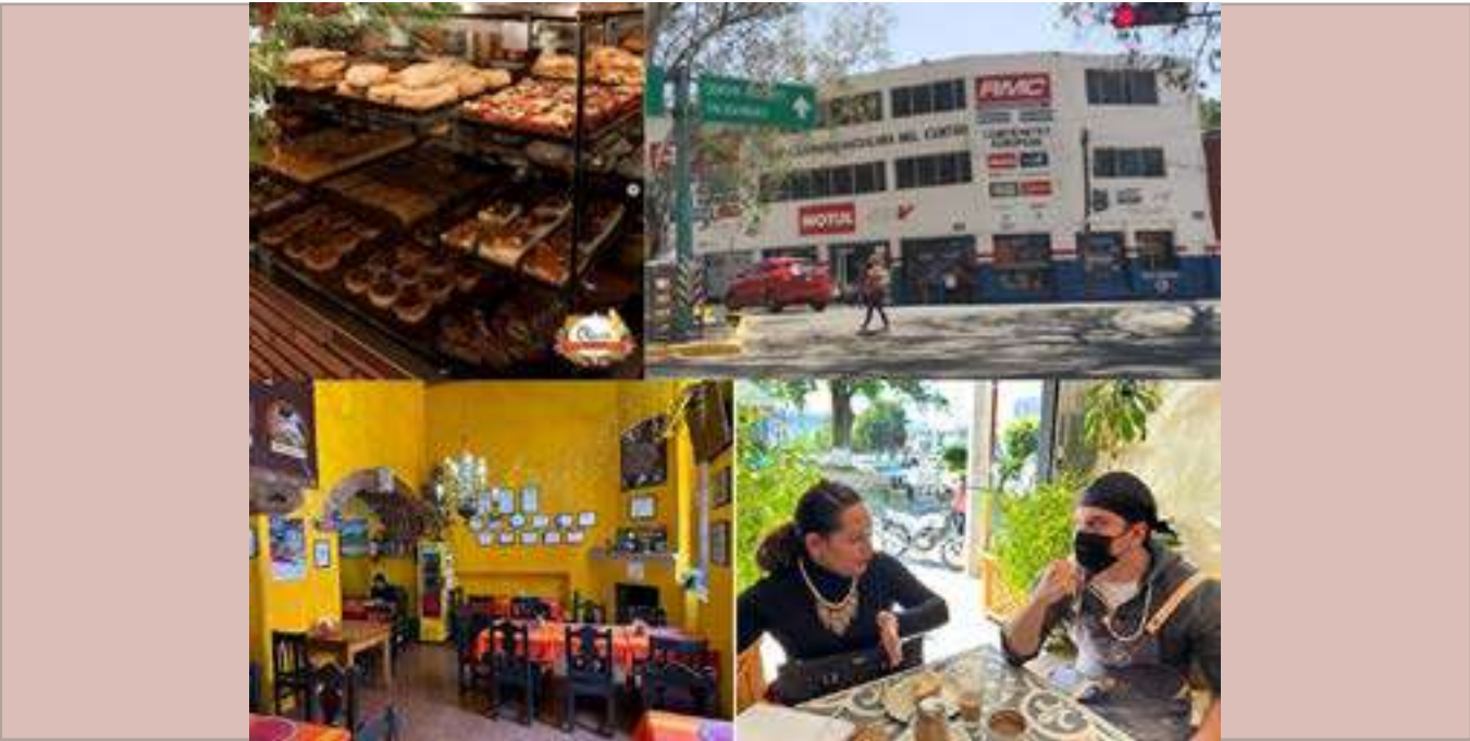
Diferentes empresas en las que se llevó a cabo el Mapeo de Procesos.

A partir del análisis de la información y la retroalimentación a los diferentes usuarios, se identificaron oportunidades de intervención con: diseño de Marketig Digital, Software para manejo de inventarios, Cursos y asesorías en Planeación estratégica. Se presentaron propuestas y se dio inicio con la capacitación a través de un curso de Planeación Estratégica.