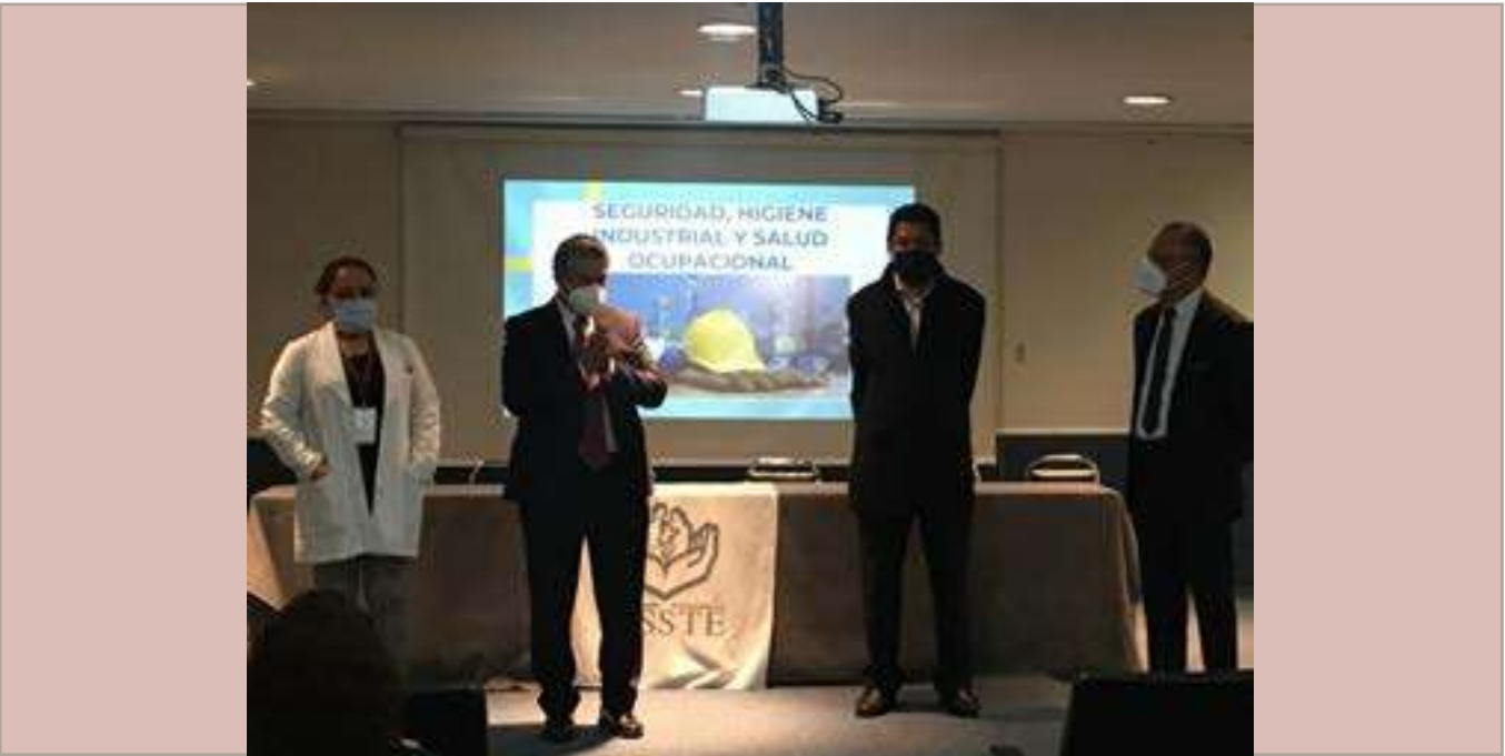
Atendiendo cursos en el marco del convenio, en el Hospital Regional del ISSSTE.