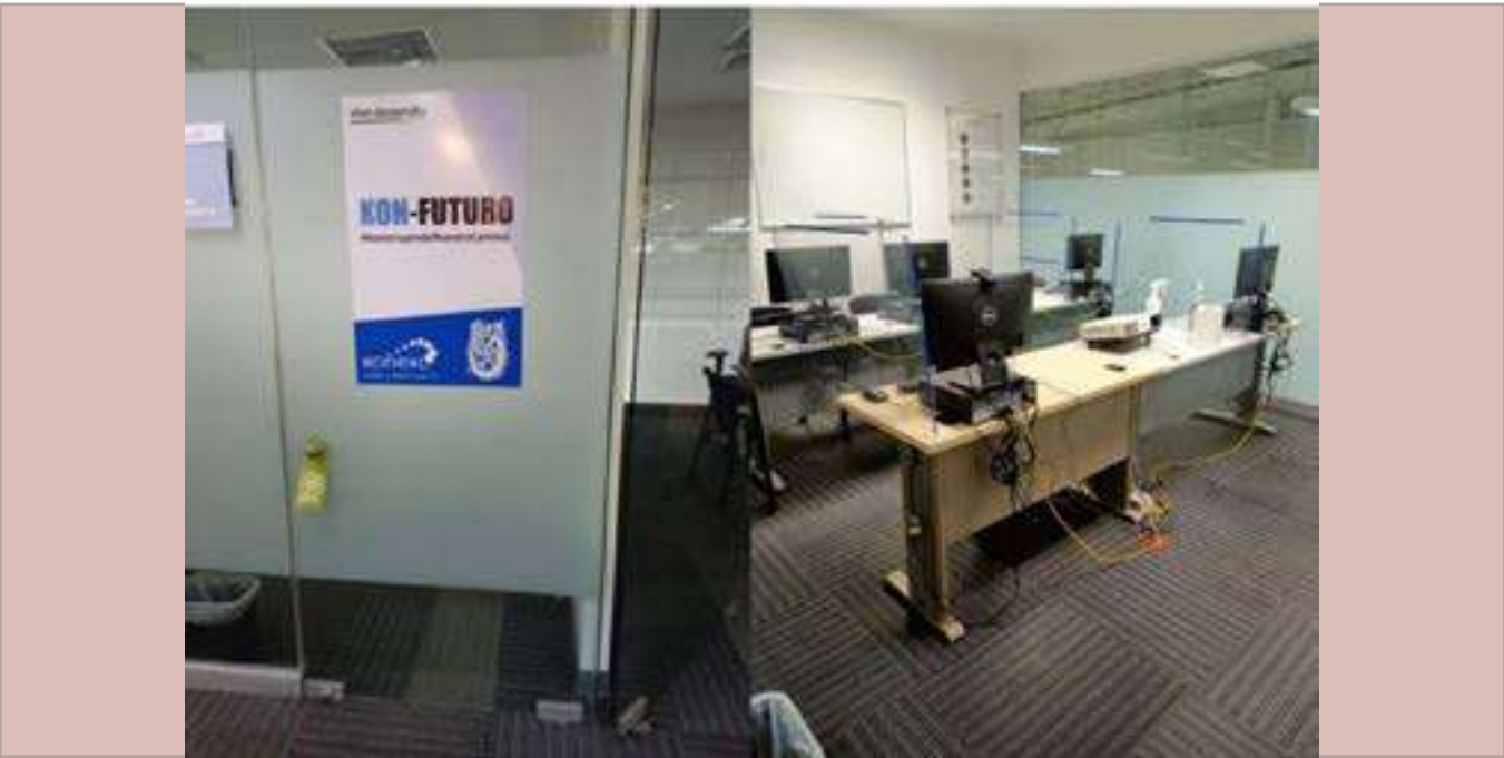
Aula IPN_KON-FUTURO en los "Call Center" Konexo de Grupo Posadas en Morelia.

Por quinto año consecutivo, se llevó a cabo el "Curso de preparación para ingreso al Nivel Superior" a trabajadores de la Empresa "Grupo Posadas S.A.B. de C.V.", este año contó con la participación de 19 aspirantes. Cabe hacer mención que el Grupo Posadas, en adición a patrocinar los cursos de preparación en apoyo a sus trabajadores; a los que estudian en la Modalidad a Distancia en el IPN, les brinda facilidades con dos aulas IPN, equipadas con computadoras, acceso a Internet, impresora y proyector de video.