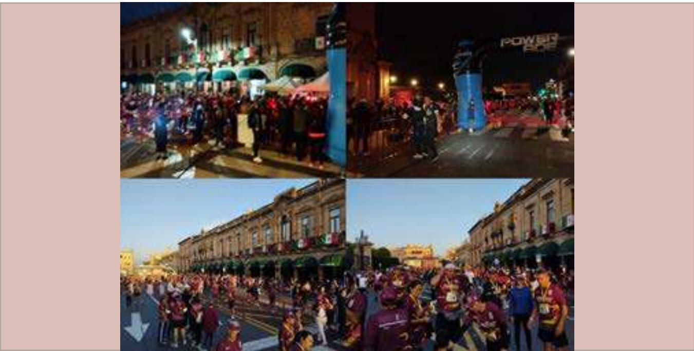
La Carrera IPN OnceK-2022 en el Centro Histórico de la Ciudad de Morelia.

ACTIVIDAD 4. Vinculación con la sociedad, el gobierno y el sector productivo CATEGORÍA 17. Emprendimiento e innovación con impacto social ACCIÓN 3. Gestionar alianzas de impulso y apoyo al emprendimiento con los sectores público y privado, de tal manera que se genere un marco de colaboración e intercambio científico, tecnológico y académico nacional e internacional.