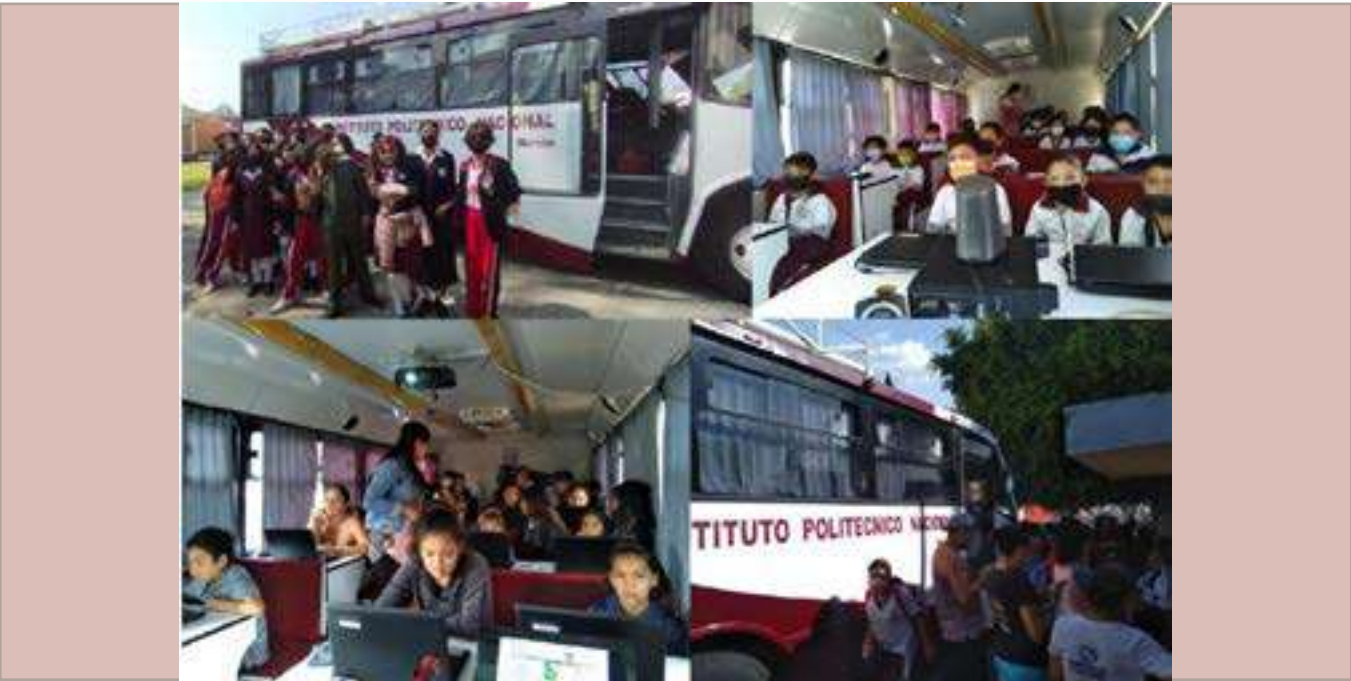
Actividades de la Unidad Móvil de Aprendizaje del CVDR Morelia.