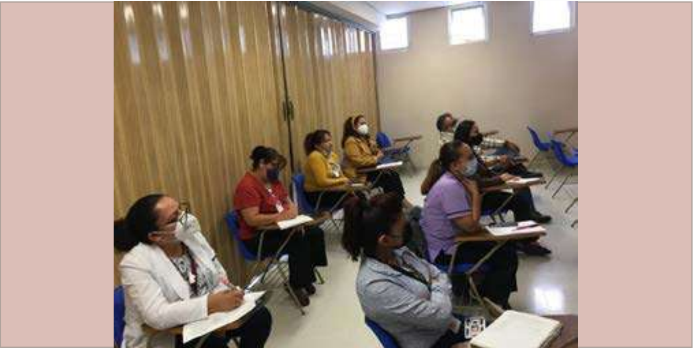
Personal del Hospital Regional del ISSSTE en capacitación.

ACTIVIDAD 4. Vinculación con la sociedad, el gobierno y el sector productivo CATEGORÍA 18. Capacitación, certificación de competencias e innovación tecnológica para promover el desarrollo regional ACCIÓN 2. Construir alianzas estratégicas para consolidar el modelo IPN como una contribución al proyecto de transformación nacional.