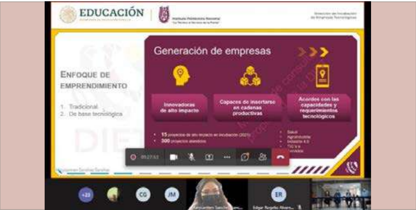
CVDR Morelia en capacitación para la transferencia del “Modelo de Emprendimiento Tecnológico”.