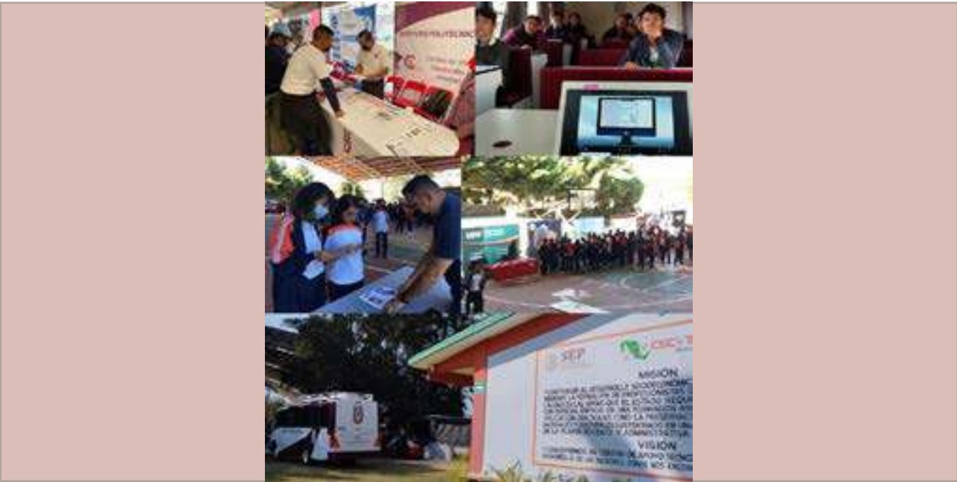
Promocionando la Modalidad a Distancia en Expoprofesiográficas IEMSSM.

ACTIVIDAD 4. Vinculación con la sociedad, el gobierno y el sector productivo CATEGORÍA 18. Capacitación, certificación de competencias e innovación tecnológica para promover el desarrollo regional ACCIÓN 2. Construir alianzas estratégicas para consolidar el modelo IPN como una contribución al proyecto de transformación nacional.