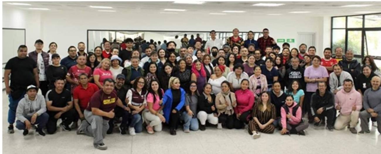
Participación entusiasta de entrenadores deportivos de la DAD.

Se llevó a cabo el curso taller de “Psicología Deportiva” en el Auditorio Rosario Iglesias Rocha impartido por profesores especialistas de la DAD en colaboración con el Instituto del Deporte de la Ciudad de México, en donde se participó en diversas dinámicas y se analizan los conceptos y finalidades de la aplicación de la psicología deportiva como una herramienta multidisciplinaria.