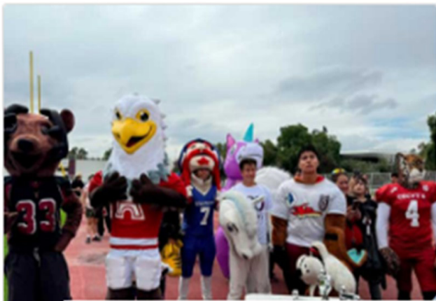
Participación de la comunidad politécnica y botargas representativas en eventos recreativos.

Con entusiasta participación se realizaron en cada trimestre, las carreras recreativas y las divertidas carreras de botargas, en el Estadio Wilfrido Massieu del IPN. Se dio cita la comunidad politécnica.