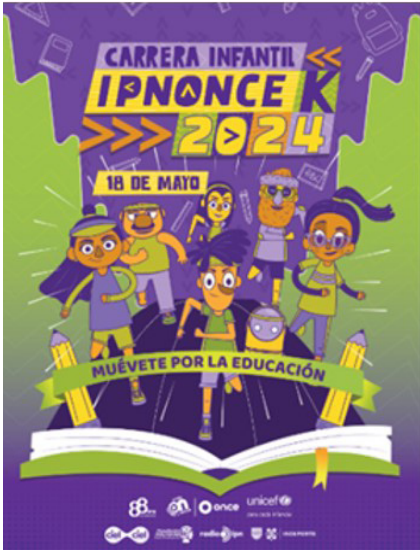
Carrera Infantil convocatoria.

Participación de la DAD en la realización de la tradicional carrera infantil once niños.