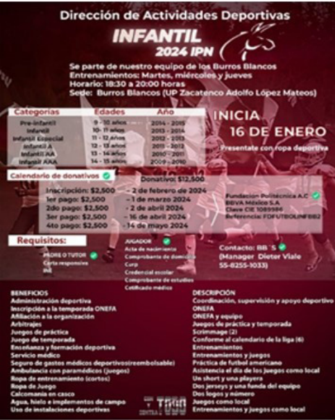
Flyer de convocatoria.

Reclutamiento de nuevos valores para la conformación de los equipos representativos de futbol americano.