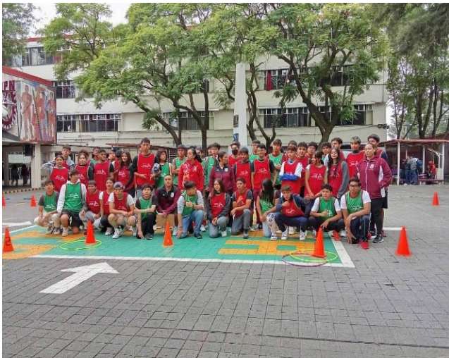
Semáforo Deportivo de la Dirección de Actividades Deportivas del IPN.

Se llevaron a cabo “Encuentros Recreativos” en colaboración con la Fundación Alfredo Harp Helú (AHH) Deporte, a través del programa Semáforo Deportivo con la participación de los centro educativos de nivel medio superior y superior del IPN.