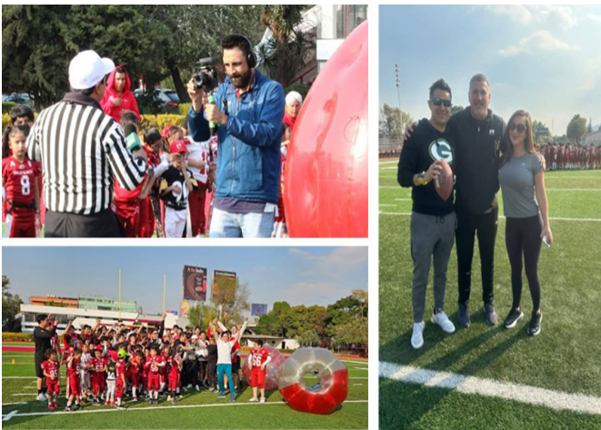
En las instalaciones de Águilas Blancas se realizaron diversas actividades para la grabación de capsula deportiva.

Participación de la Dirección de Actividades Deportivas en la grabación del programa “Mas Deporte” en la sección especial “Tu Fan NFL” con nuestros equipos representativos en diferentes categorías de Fútbol Americano.