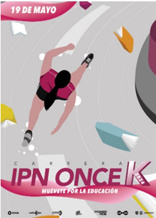
Flyer de convocatoria Carrera OnceK 2024.

Participación de la DAD en la realización de la tradicional carrera OnceK.