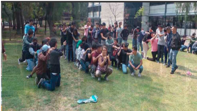
Unidades Académicas y Áreas Laborales se unieron en sinergia con una dinámica masiva de Activación Física Deportiva o Recreativa.

IPN Deportes agradece a la Comunidad Politécnica por su entusiasta participación y compromiso por una vida saludable.