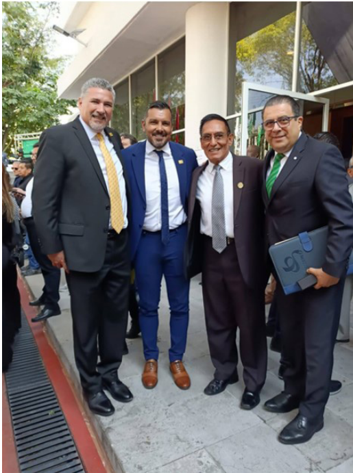
Premio Luchador Olmeca 2024.

La DAD estuvo presente en la entrega del “Premio Luchador Olmeca 2024” y la develación de placas para el “Salón de la Fama” de la Confederación Deportiva Mexicana CODEME. Reconocemos y felicitamos el talento y dedicación de los galardonados en diversas disciplinas deportivas.