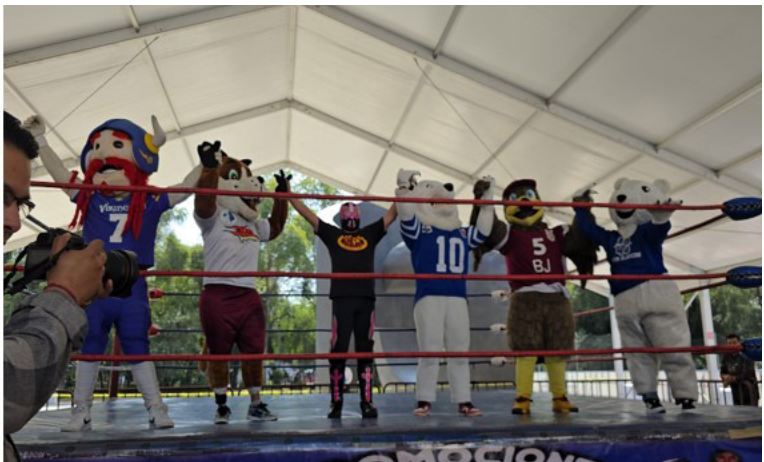
Lucha libre de práctica y exhibición.