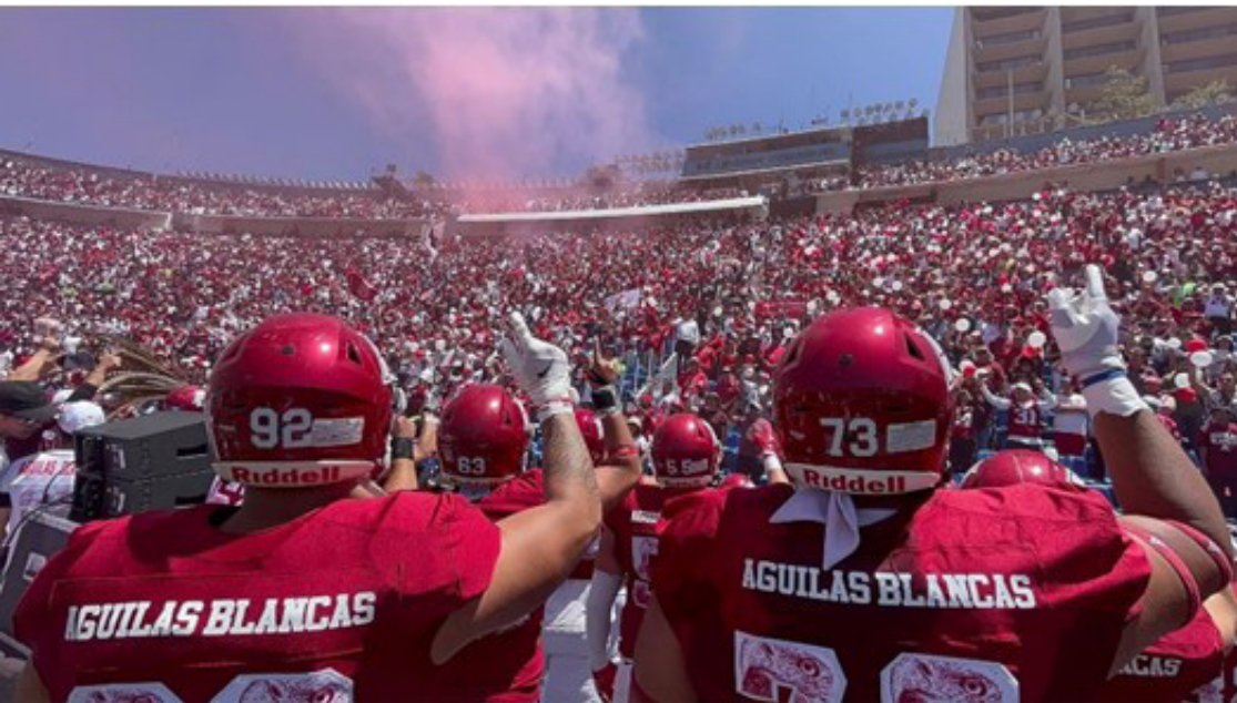
Estadio Olímpico México 68, escenario de los 14 Grandes de la ONEFA.

Y vaya que se podría dedicar una biblia entera con momentos y recuerdos, pero en esta ocasión solo hablaremos de esta nueva edición 2024 que disputarán los Pumas C.U. y las Águilas Blancas del IPN.