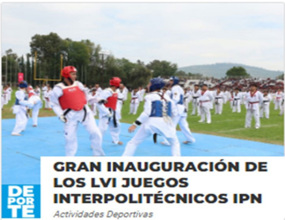
Juegos Deportivos Interpolitécnicos 2024.

Luego, se realizó una impresionante exhibición de Taekwondo con 400 participantes, demostrando su esfuerzo y disciplina en diferentes modalidades. Además, se llevaron a cabo demostraciones de equitación, esgrima, pentatlón moderno y tiro con arco, las cuales son algunas de las 38 disciplinas impartidas en el Instituto.