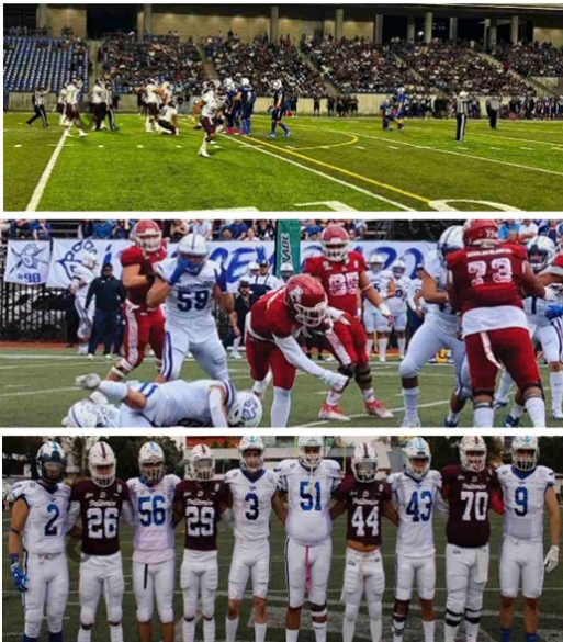
Liga mayor equipos representativos del IPN.

Se llevó a cabo la presentación a los medios de comunicación de sus tres icónicos equipos de Futbol Americano de cara a la Liga Mayor ONEFA 2024 Águilas Blancas, Búhos Guinda IPN, finalizando con Burros Blancos IPN.