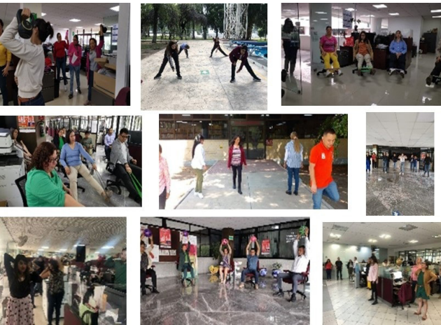
Personal de la comunidad Politécnica Realizando Pausas Activas.

Como parte del programa de activación física se realizaron pausas activas para la erradicación del sedentarismo dentro de IPN, los integrantes de la comunidad politécnica realizaron activación física en sus centros de trabajo.