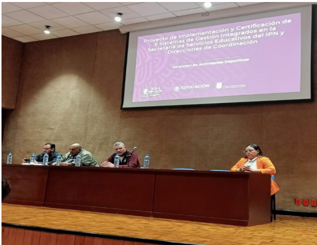
Presentación de proyecto de Gestión de la Calidad.

La Dirección de Actividades Deportivas (DAD) dio inicio al proyecto implementación y certificación de el Sistema de Gestión de la Calidad con base en la norma ISO 9001:2015, conjuntando todos y cada uno de los esfuerzos individuales para contar con la estandarización de procesos y mejorar la calidad en los servicios que se brindan a la Comunidad Politécnica.