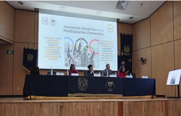
4º Congreso Internacional del Deporte y la Cultura Física.

El Director de Actividades Deportivas participó en la Bienvenida e Inauguración del 4.º Congreso Internacional del Deporte y la Cultura Física 2024, realizado en las instalaciones de la UNAM. Durante el evento, tuvo el honor de ser ponente en la mesa temática 2, abordando el tema: “El Deporte como herramienta de inclusión: Estrategias, promoción de la diversidad y grupos vulnerables”.