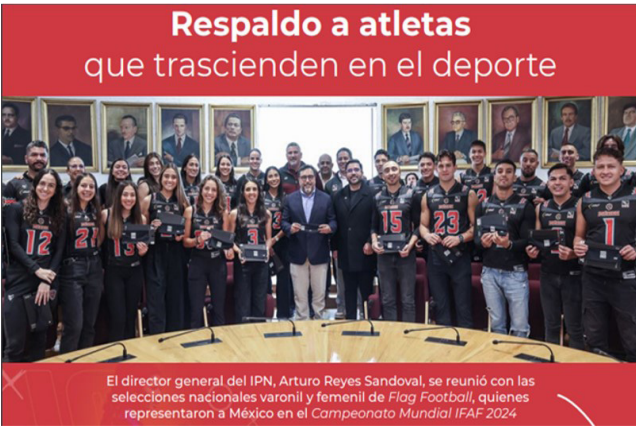
Director General del Instituto Politécnico Nacional, Arturo Reyes Sandoval y los integrantes de las selecciones nacionales varonil y femenil de Flag Football .

Como un ejemplo de perseverancia y disciplina, calificó el Director General del Instituto Politécnico Nacional (IPN), Arturo Reyes Sandoval, a las y los integrantes de las selecciones nacionales varonil y femenil de Flag Football , quienes representaron a México en el Campeonato Mundial de la Federación Internacional de Fútbol Americano 2024 (IFAF por sus siglas en inglés), en la ciudad de Lahti, Finlandia.