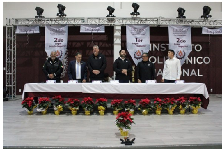
Un evento lleno de pasión y unidad que quedará en la memoria de nuestra comunidad politécnica, con la clausura de los juegos Interpolitécnicos 2024.

En el Gimnasio “El Carillón” del Casco de Santo Tomas, se llevó a cabo la Clausura de los Juegos Deportivos Interpolitécnicos, un evento que reunió a las unidades académicas de media superior y superior del IPN.