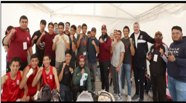
Participación de pugilistas de varias instituciones del IPN en el 1er Encuentro de Boxeo de Primavera 2024.

Alrededor de 40 combates de exhibición, que engalanaron el ring instalado en la Plaza del Carillón, en Zacatenco, con el objetivo de promover la activación física y el desarrollo deportivo con fines recreativos o de competencia como una forma de vida de la comunidad politécnica para tener mejores ciudadanos profesionistas.