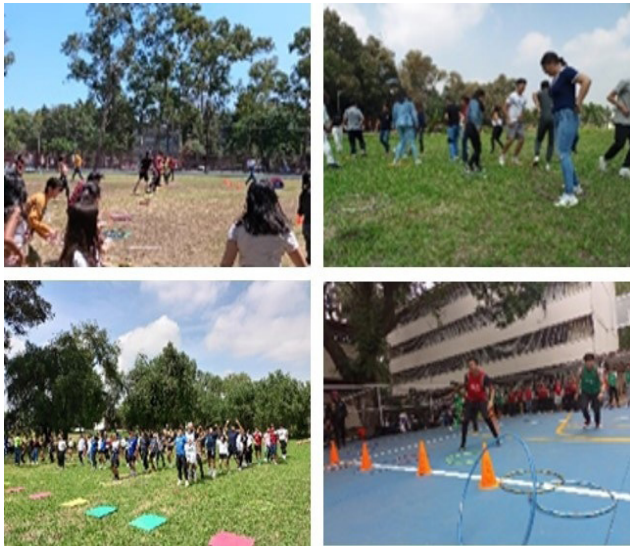
Tabatas de activación física para la comunidad Politécnica.

Se promovieron diversas tabatas de activación física recreativa de manera permanente entre la comunidad politécnica.