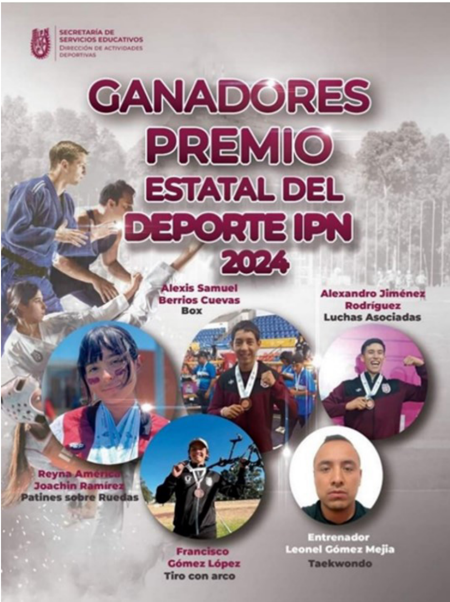
Ganadores del Premio Estatal del Deporte IPN 2024.

El jurado ha reconocido el talento y esfuerzo de cuatro deportistas destacados y un entrenador.