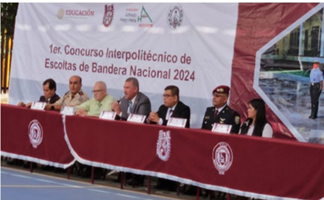
1er Concurso Interpolitécnico de Escoltas de Bandera Nacional 2024

Se llevó a cabo en el IPN, a través de la Dirección de Actividades Deportivas la invitación a las unidades académicas politécnicas a participar en el “1er Concurso Interpolitécnico de Escoltas de Bandera Nacional 2024”.