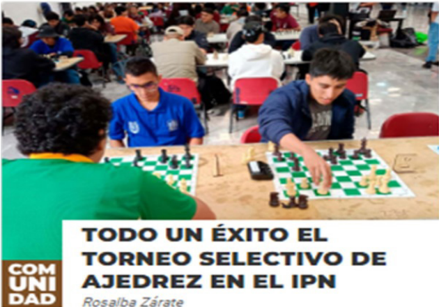
Torneo Selectivo de Ajedrez 2024.

El evento contó con la participación de diferentes escuelas y unidades del IPN, en la que asistieron 35 alumnos de 10 escuelas de nivel medio superior y 87 alumnos de nivel superior de las ramas femenil y varonil.