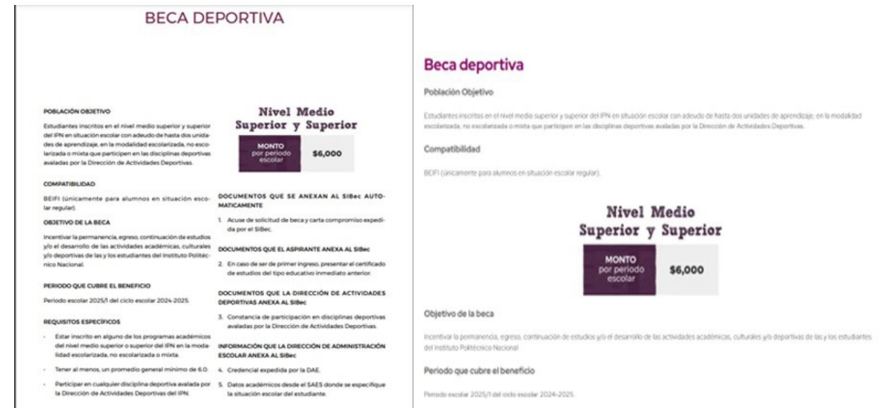
Beca Deportiva, Bases y convocatoria.

Publicación del programa de becas deportivas, difusión realizada por la Dirección de Apoyos a Estudiantes (DAES).