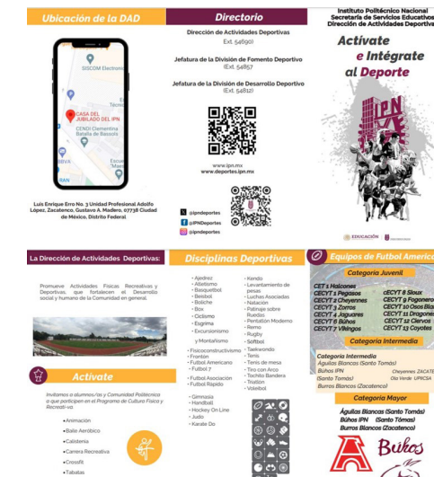
Flyer de Difusión y Promoción Deportiva.

Promoción de la publicación de convocatorias deportivas en la pág. Oficial DAD IPN.