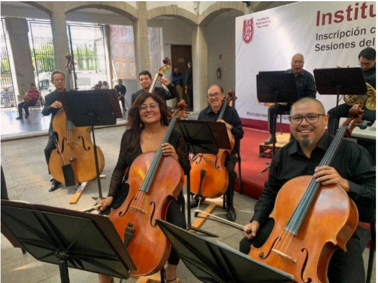
OSIPN en Tlaxcala.

La ceremonia estuvo acompañada por una destacada presentación de la Orquesta Sinfónica del IPN (OSIPN), que deleitó a los asistentes con una muestra de talento y pasión por la música.