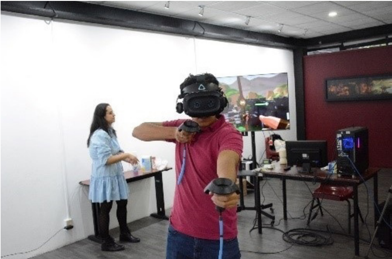
La base de los videojuegos.

El Festival Gamer Polígono fue una experiencia integral que combinó la educación, el desarrollo tecnológico, la innovación, el arte y la cultura, promoviendo el enfoque multidisciplinario que caracteriza al IPN, consolidándose como un punto de encuentro entre la comunidad gamer, los académicos y profesionales. Contó con una participación de más de 1,400 asistentes, tres primeros lugares en el Torneo de Tetris y fue más que bien recibido por nuestra comunidad politécnica.