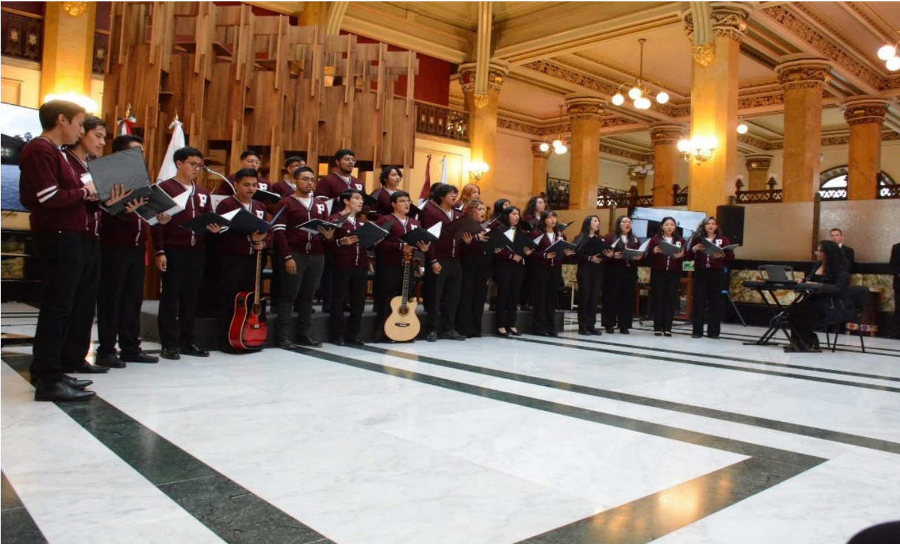
Coro del IPN en el Palacio Postal.

En este evento participaron integrantes del grupo artístico de Danza Azteca y del Coro del IPN.