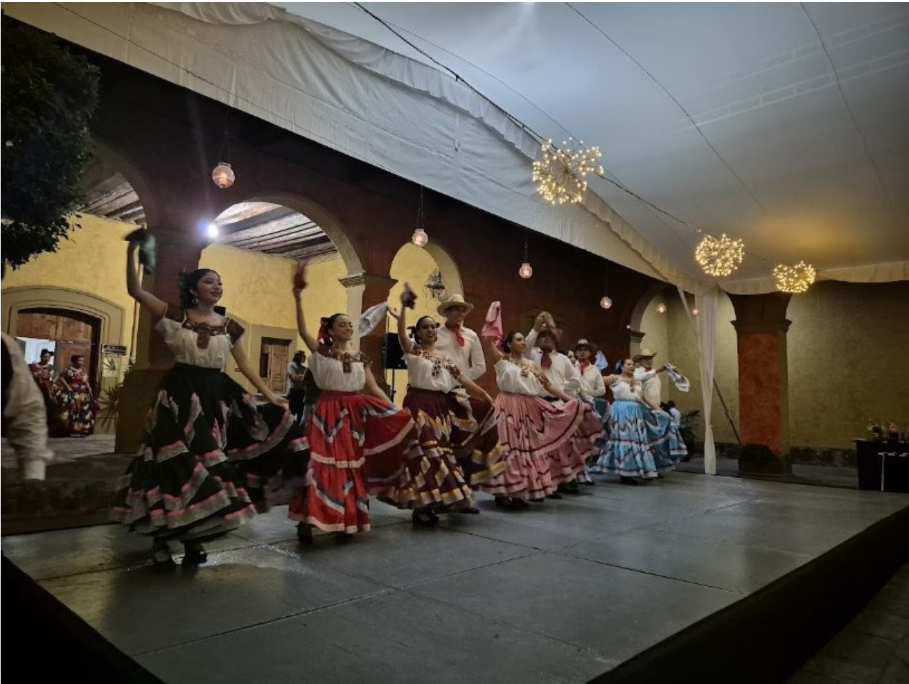
Presentación de danza en la “VI Cumbre de Rectores México-Japón”.

Participaron 26 de los integrantes del grupo artístico de Danza Folclórica.