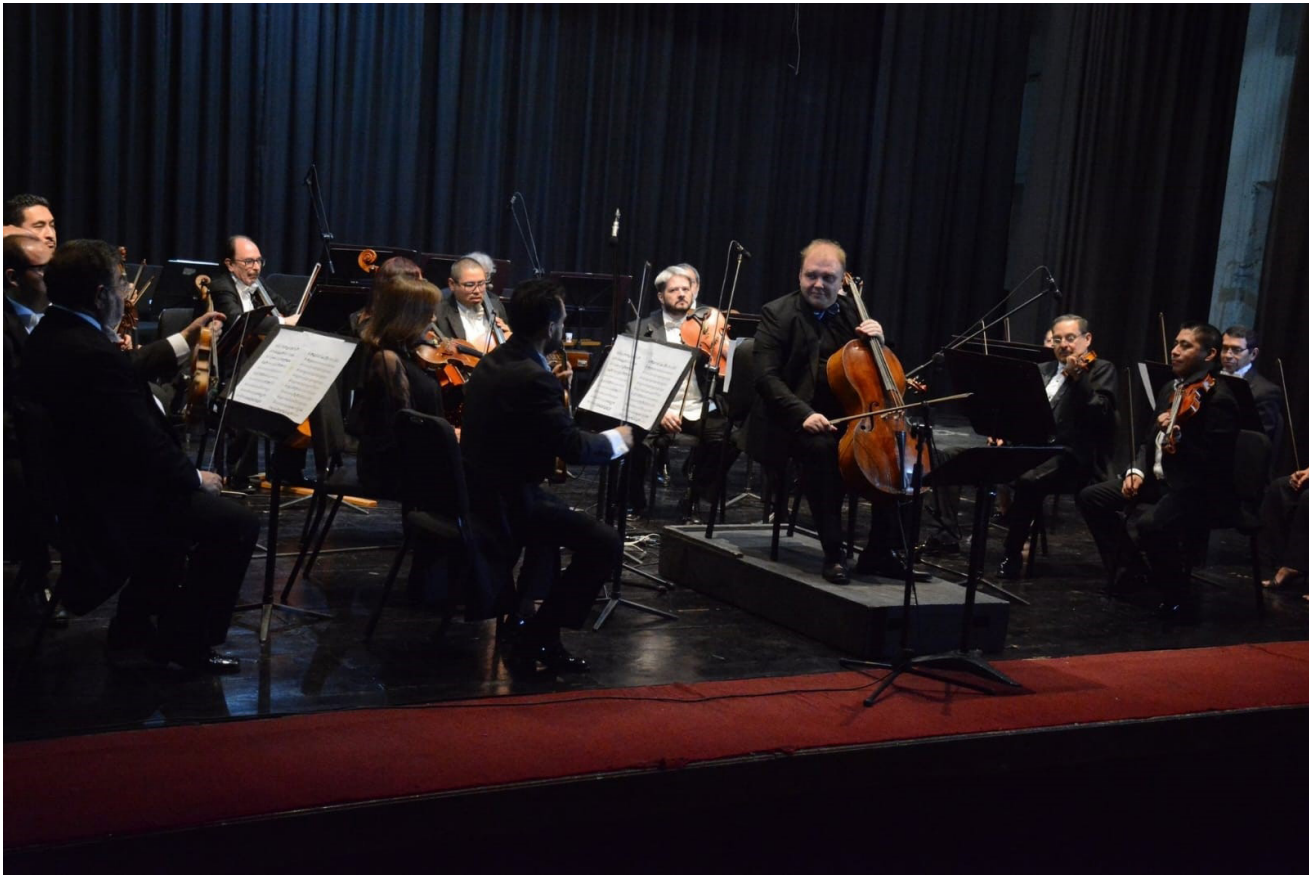
OSIPN en Teziutlán.

Esta conmemoración tiene como objetivo principal el ofrecer un programa muy completo que atraiga turismo a través de diversas actividades, teniendo el 15 de marzo. Por tal motivo se llevó a cabo la presentación de la Orquesta Sinfónica del Instituto Politécnico Nacional a las 19:00 horas en el Teatro Victoria.