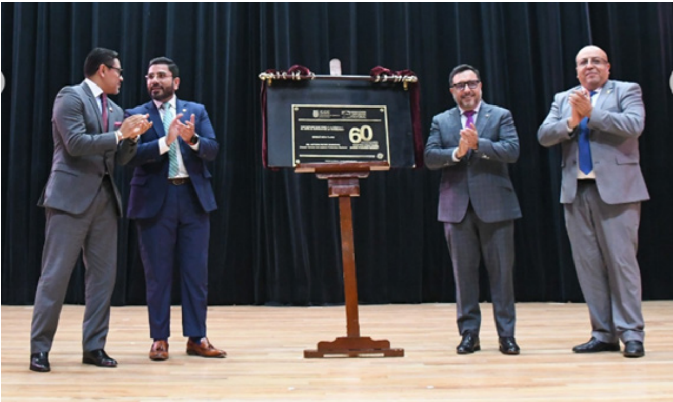
Develación de placa 60 Aniversario.

60 Años de ser un referente en la cultura en el norte de la ciudad, se celebró con la participación de los grupos artísticos del IPN así como la develación de la placa conmemorativa por el director general del Instituto y autoridades.