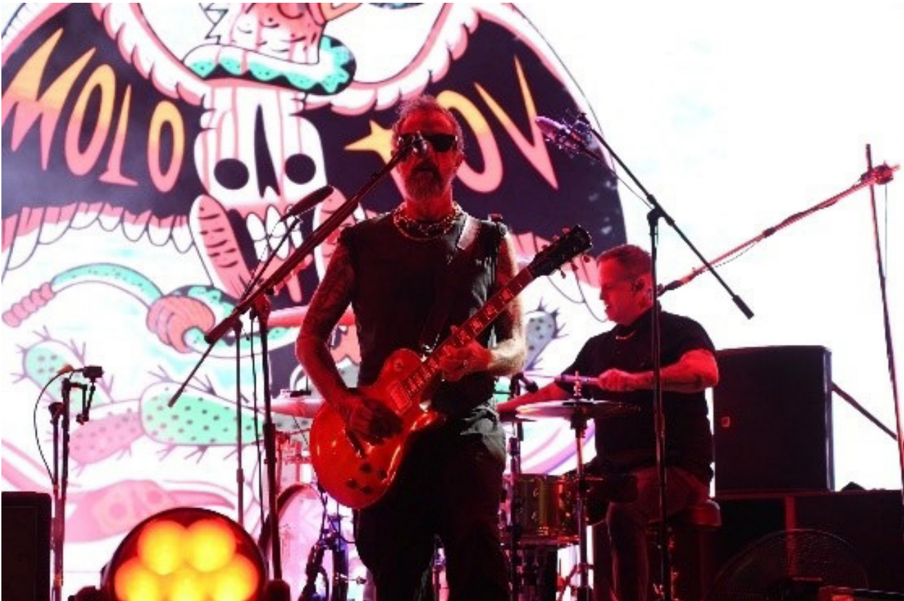
Concierto día del Politécnico.

Concierto masivo por el Día del Politécnico con la participación de Molotov, Dj Mariana Bo, Sekta Core, Dj La changa, los ganadores del concurso de Dj de Beat & Huélum y de rock & huélum.