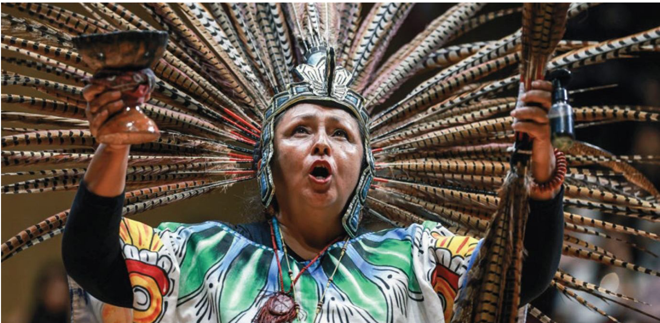
Festival de Lenguas.

Contó con cinco sedes participantes: CCJTb, EST, ESIT, ESMYH y el CENLEX Zacatenco. Se llevaron a cabo conferencias magistrales, exposiciones, talleres, exhibiciones artesanales, documentales y comparsa de danzantes. Se tuvo la participación de la comitiva de bordadores, cocineros, nahuablantes y herbolarios de San Sebastián y Teziutlán, Puebla.