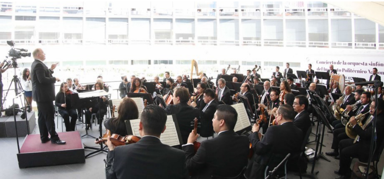
Concierto en el Senado de la República.

Previamente, en el Pleno se llevó a cabo la ceremonia solemne para develar, en el Muro de Honor del Salón de Sesiones, la leyenda "Instituto Politécnico Nacional. La Técnica al Servicio de la Patria".