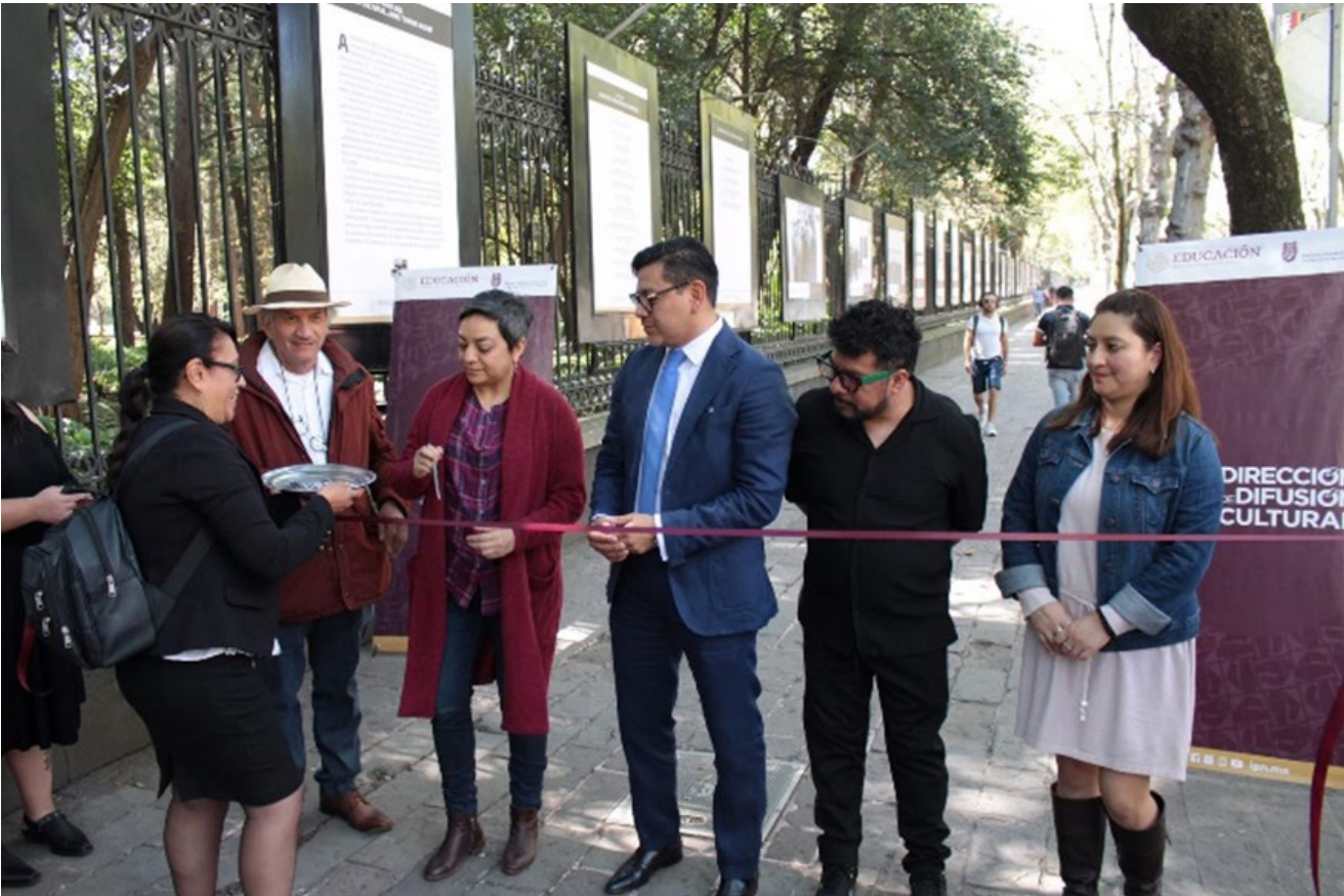
Inauguración de la Exposición en las rejas del Bosque de Chapultepec.

La misma se expuso en la galería abierta de las rejas del Bosque de Chapultepec, así como en la galería ubicada en Av.” Wilfrido Massieu”.