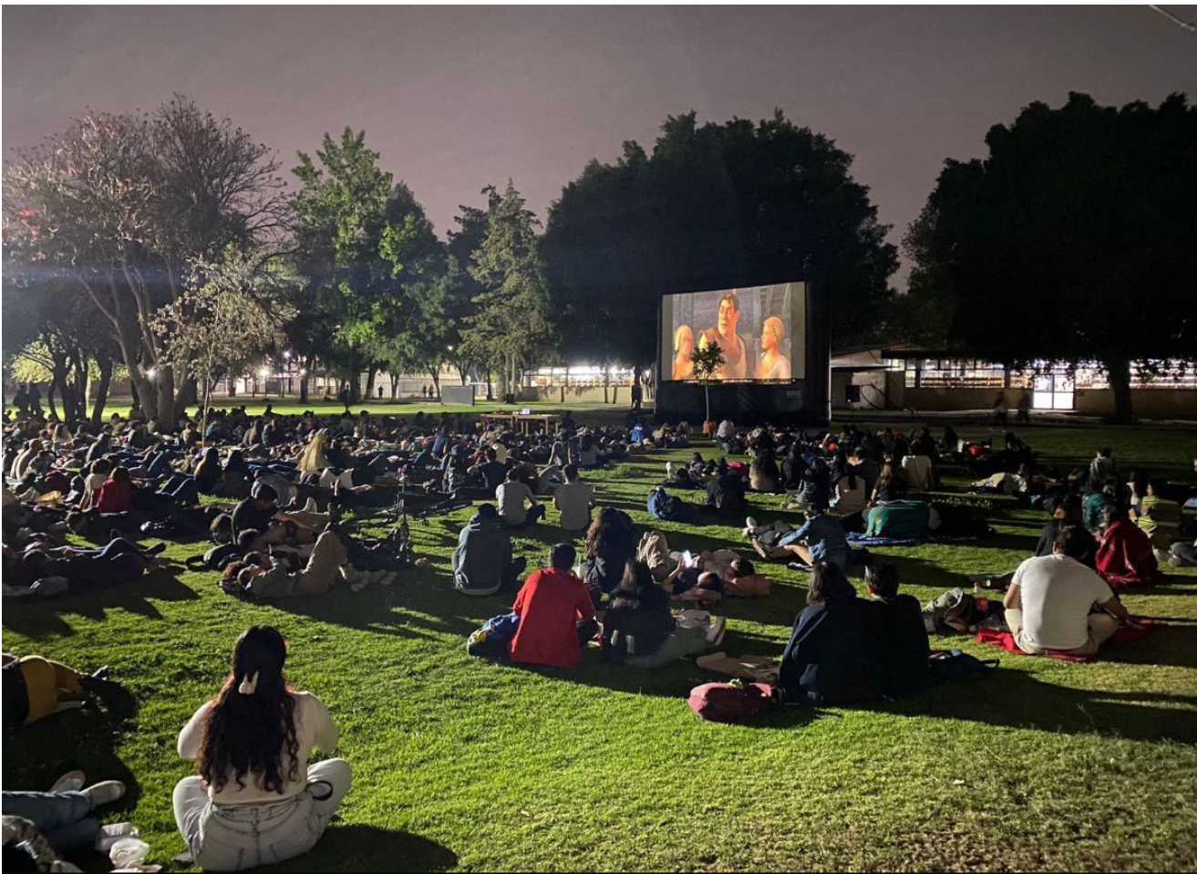
Cine en tu escuela.

Total de picnics: 15. Total de asistentes: 4,510 personas.