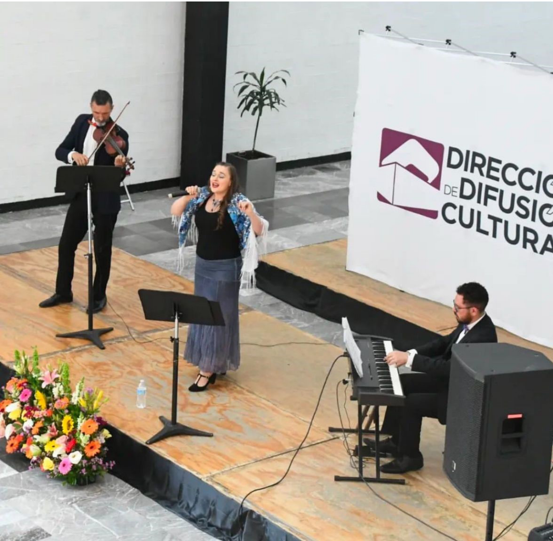
1er Festival Internacional.

La comunidad disfrutó de la cultura rusa, con gastronomía representativa, una exposición fotográfica "Ventana a Rusia" con los paisajes naturales y urbanos más hermosos de dicho país, así como un concierto de música tradicional rusa.