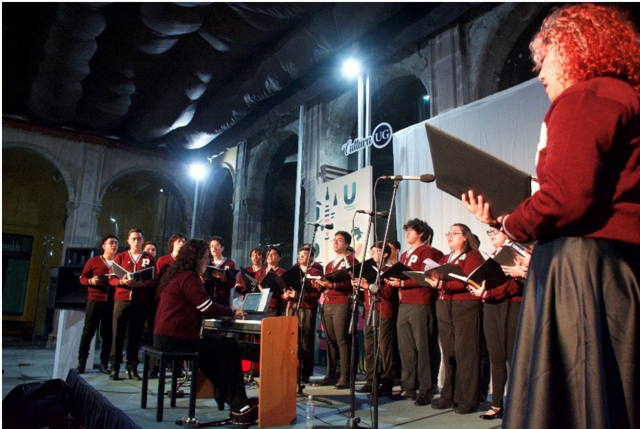
Coro IPN en Guanajuato.

La Universidad de Guanajuato invitó al Coro del IPN a participar en el programa artístico de la Universiada Cervantina. El día 11 de septiembre con un concierto en el “Patio Jesuita” y el 12 de septiembre como parte del Coro Monumental en las escalinatas de la Universidad.