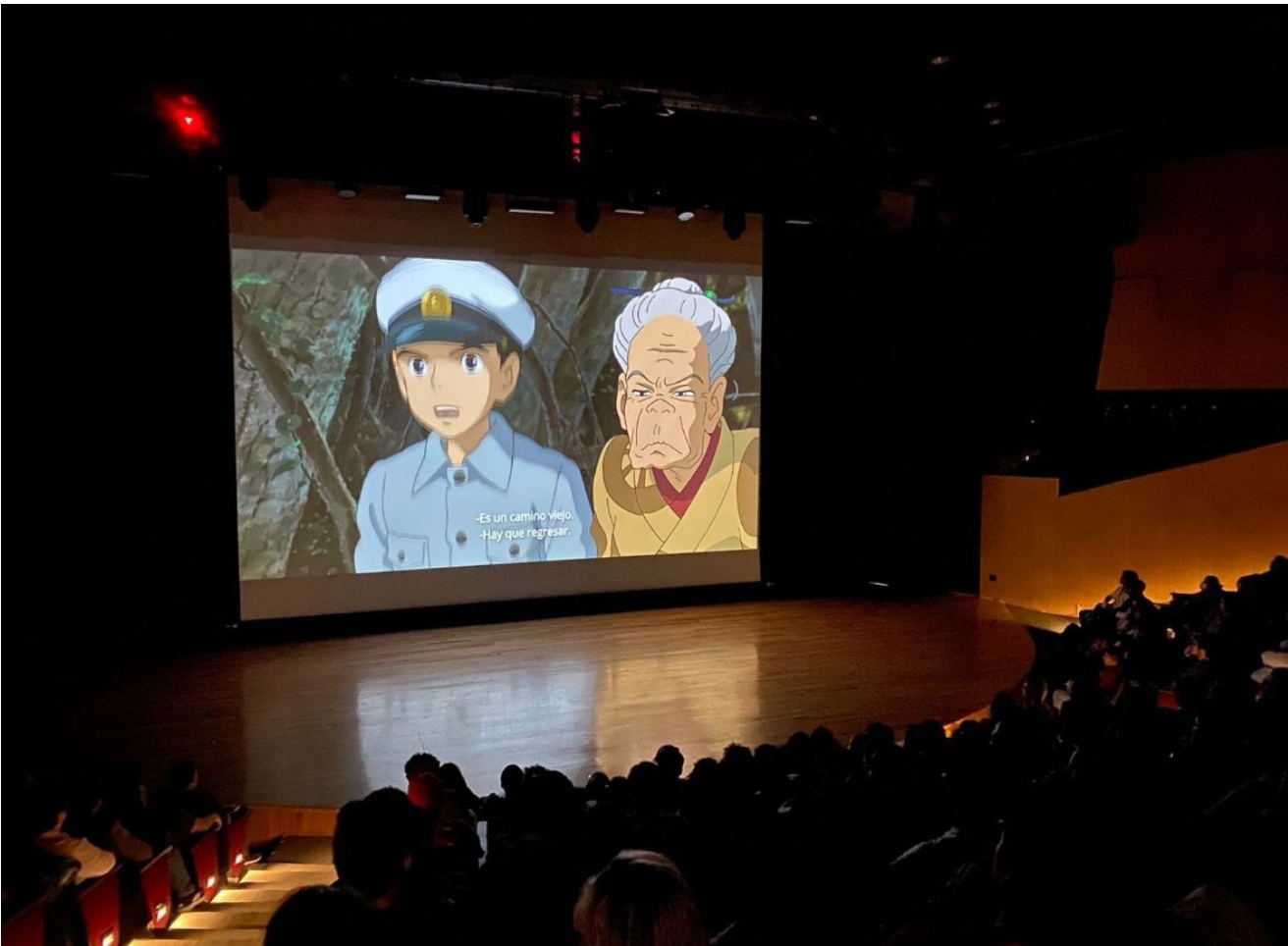
Película “El Niño y la Garza”.

Con motivo de los festejos del 88 aniversario del IPN y del 60 aniversario de Centro Cultural Jaime Torres Bodet, se realizaron las proyecciones especiales, con las película de Hayao Miyazaki y la aclamada película del director Pablo Berger , cumpliendo así con uno de los objetivos principales de esta dirección, que es proporcionar a sus estudiantes, experiencias cinematográficas que contribuyan a su formación integral y acercar a su comunidad a lo mejor del cine actual. Total de asistentes: 1,680 personas.