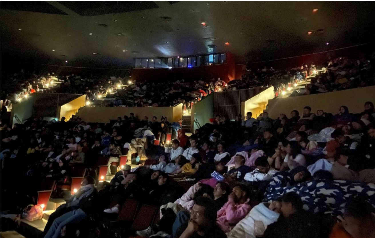
Noche de “Terror en el Queso”.