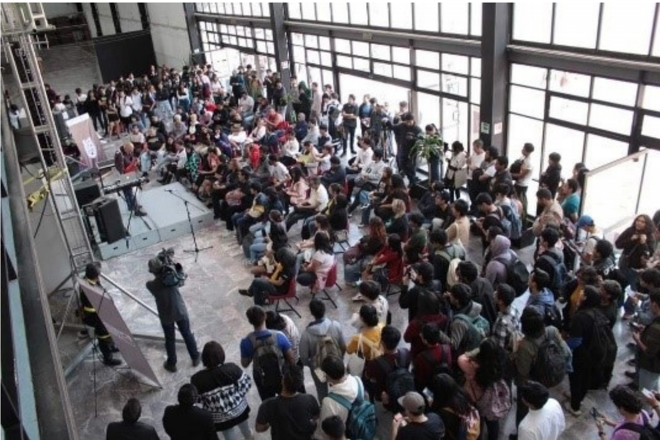
Participantes en “Un día en Japón”.

Dos días de actividades con más de 2,400 asistentes. Cabe mencionar que algunas de las actividades fueron en colaboración con la Embajada de Japón en México.