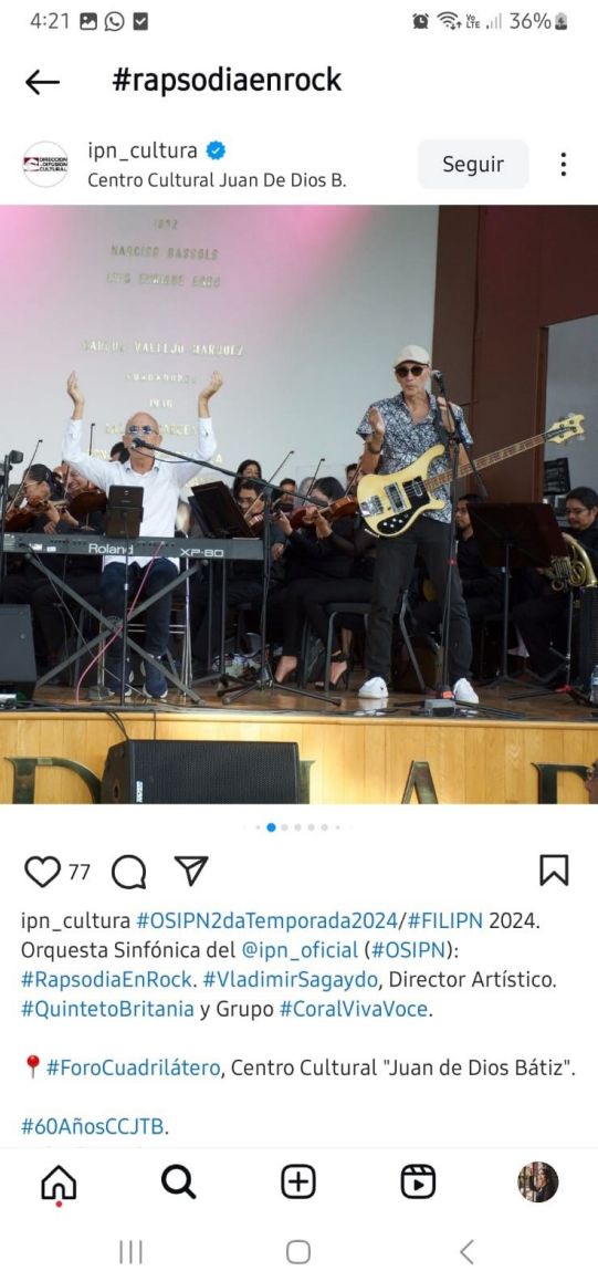
Leyendas de Vinilo.

En el marco de la Feria Internacional del Libro, la Orquesta Sinfónica del IPN junto con la banda Britania interpretó éxitos del grupo “The Beatles”.