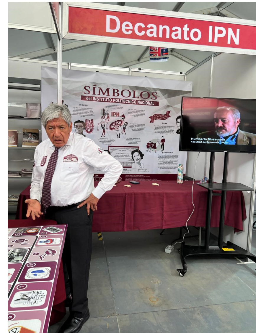
XLI Feria Internacional del Libro del Instituto Politécnico Nacional. Lugar: Stand de la Presidencia del Decanato.

La Presidencia del Decanato y su personal adscrito a las Subdirecciones y Departamento que la conforman participaron en el montaje de su stand de la feria donde habrá diferentes actividades lúdicas para divulgar la memoria e identidad institucional en un horario de lunes a viernes de 10:00 a 19:00 horas y sábado y domingo de 11:00 a 19:00 horas. Se atendió aproximadamente a 800 visitantes de la comunidad Politécnica. Mediante trivias en redes sociales se entregaron materiales bibliográficos a los ganadores.