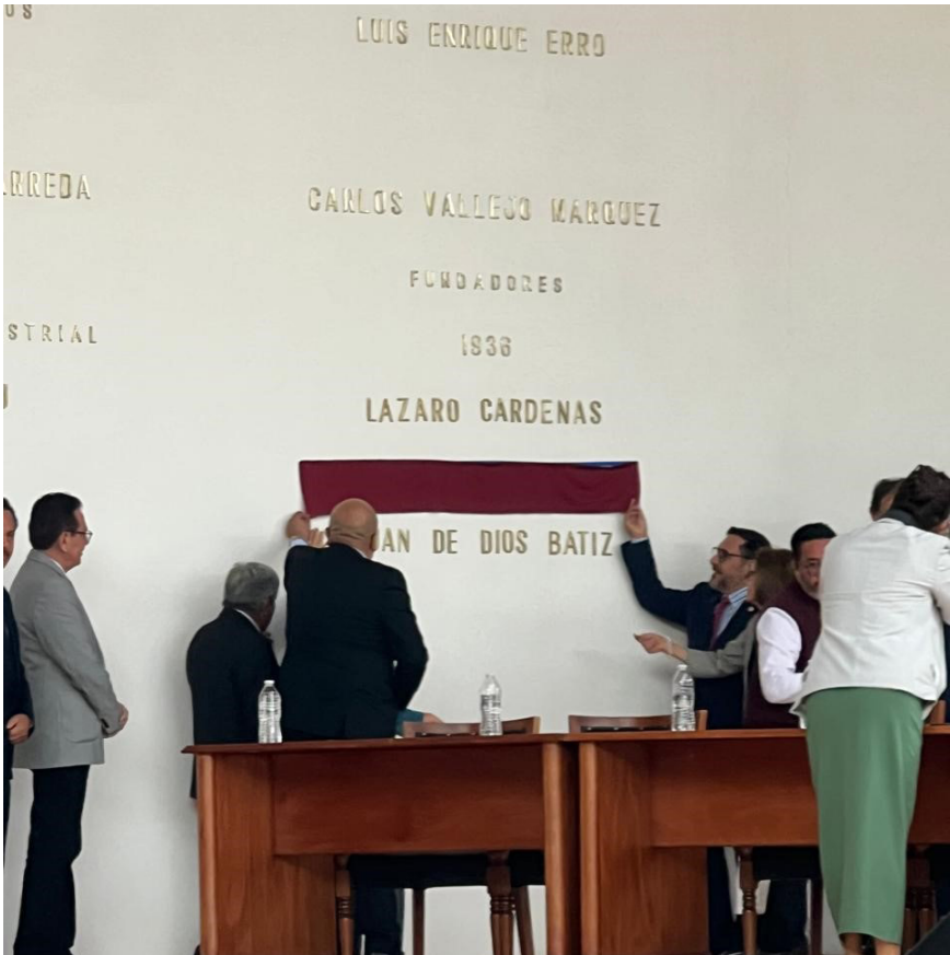
Develación de letras en Muro de Honor.