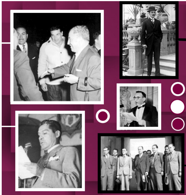
Fotografías recuperadas de los expedientes de personajes fundamentales para la historia del IPN, en colaboración con el archivo histórico de la UNAM.

La preservación y difusión de estos documentos representa una contribución importante al conocimiento colectivo sobre la historia de la educación en México, y abre nuevas oportunidades para que los investigadores, estudiantes y público en general profundicen en el estudio de los procesos históricos que han dado forma al IPN y a la sociedad mexicana en su conjunto.