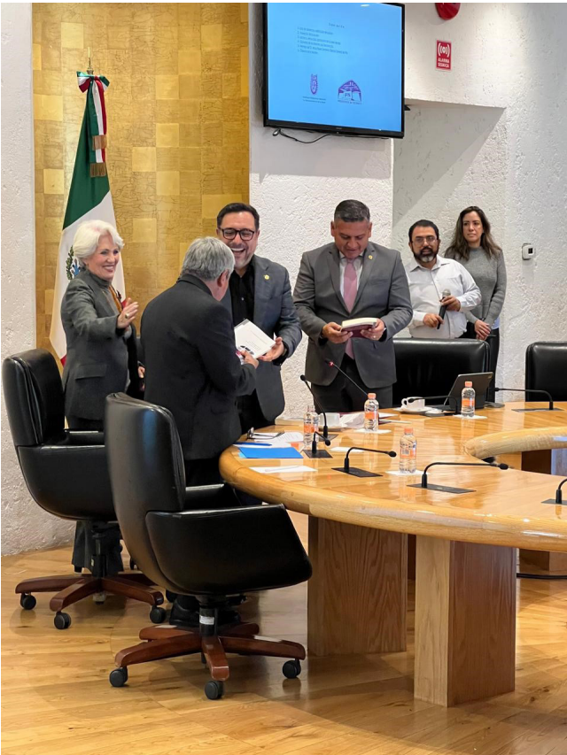
Reunión de Colegio de Decanos.

Se aprobó las aportaciones del cuerpo colegiado de maestros decanos sobre el texto de las convocatorias para elegir terna de profesores para designar director en las Escuelas de Centro o Unidad (ECUs).