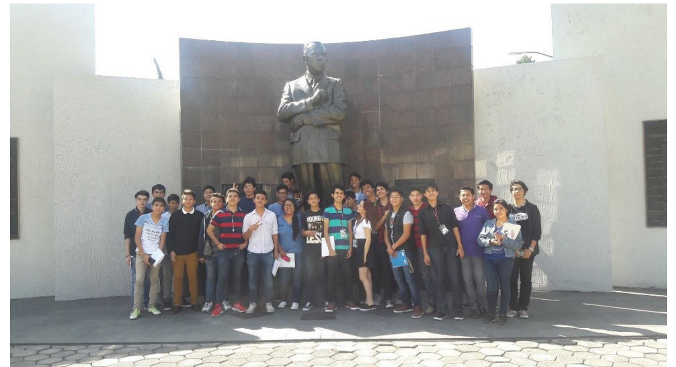
Visita guiada alumnos del CECyT No. 3 "Estanislao Ramírez Ruiz".

Durante dichas visitas, también se atendieron profesores, investigadores, funcionarios y egresados.