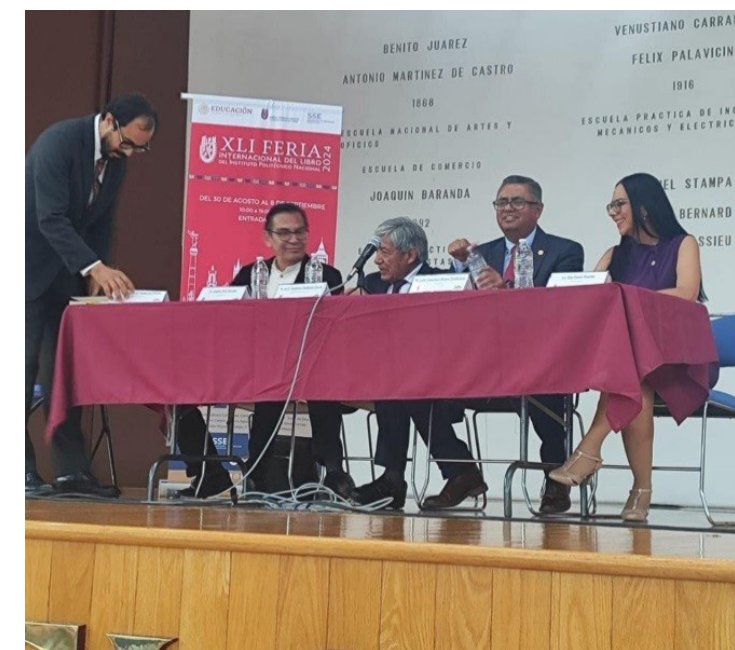
Presentación del libro "50 Testimonios del Proceso de Integración del IPN. Rescate Documental en el Archivo General de la Nación", en el marco de la XLI Feria Internacional del Libro del IPN.

La obra generó una cálida acogida por parte del público, especialmente entre investigadores, docentes y estudiantes, quienes expresaron su entusiasmo por la relevancia del material para la historia del Instituto. Durante el evento, se distribuyeron ejemplares entre los asistentes, lo que incrementó el interés por conocer más sobre el legado del IPN. Este evento subraya el firme compromiso del Archivo Histórico con la preservación y difusión del patrimonio cultural del IPN, reafirmando su papel como guardián del conocimiento y la memoria institucional.