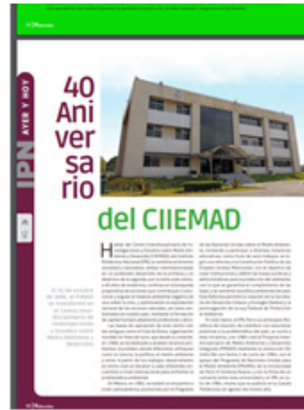
"IPN ayer y hoy", 40 Aniversario del CIIEMAD, Lugar: Gaceta Politécnica Selecciones: Fecha:30 de junio de 2024.