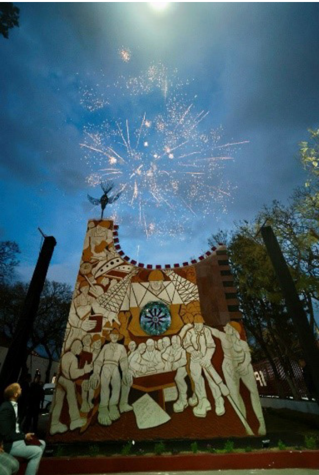
Mural escultural: “Hijos de obreros y campesinos”.

Esta gran obra de arte ya es parte del acervo cultural del Instituto Politécnico Nacional.