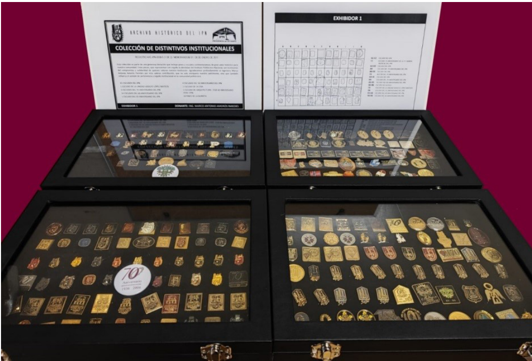
Participación de la Subdirección de Archivo Histórico en la Cuarta Sesión Extraordinaria y Solemne del XLII Consejo General Consultivo del Instituto Politécnico Nacional (IPN).

Este esfuerzo de reorganización no solo mejoró la accesibilidad y visibilidad del archivo, sino que también fortaleció las condiciones de conservación de documentos y objetos esenciales para la memoria histórica, gracias al compromiso y apoyo de los estudiantes, quienes sumaron su conocimiento y dedicación al proceso.