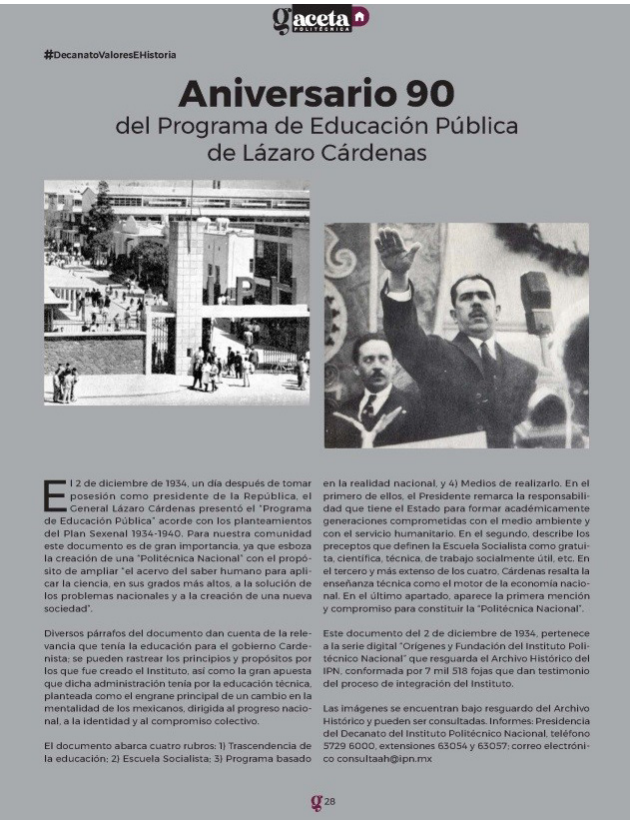
Artículo “Aniversario 90 del Programa de Educación Pública de Lázaro Cárdenas”, publicado en la Gaceta Politécnica Número 1833 el 15 de diciembre de 2024.

Estas contribuciones continúan siendo una herramienta esencial para la reflexión y el reconocimiento de la trascendencia del IPN en la historia educativa y política de México.