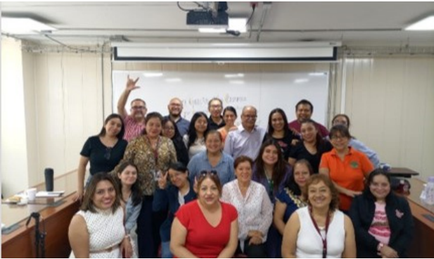
"Aplicación de la normatividad en el IPN", en la ESIME Culhuacán

Del total de las AF (cursos, talleres y diplomados), 478 se registraron para docentes, 36 para directivos, 42 para personal de apoyo y asistencia a la educación y 309 de tipo transversal (para los tres tipos de personal).