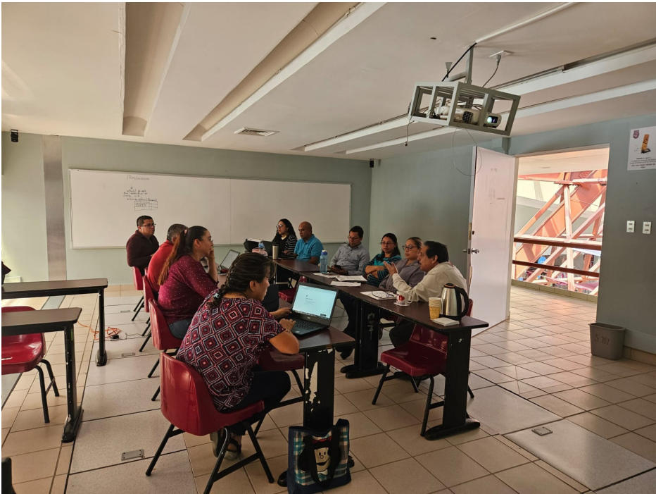
Taller Documentación de prácticas educativas.

Actualmente ocho prácticas educativas se encuentran en etapa de documentación.