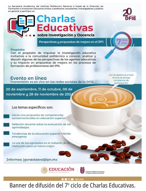
Banner de difusión del 7º ciclo de Charlas Educativas.

La participación ascendió a 55 asistentes aproximadamente por sesión.