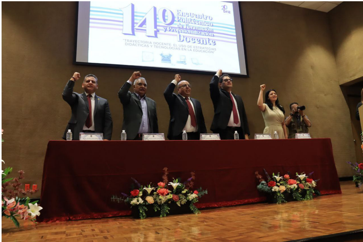
Ceremonia inaugural del 14° Encuentro Politécnico de Formación y Profesionalización Docente.

El propósito de la actividad fue facilitar un espacio de intercambio entre docentes para compartir estrategias, experiencias y desafíos relacionados con la implementación de estrategias didácticas y herramientas tecnológicas. Este Encuentro tuvo como finalidad promover la innovación y mejorar las prácticas docentes, fortaleciendo al mismo tiempo la identidad politécnica y la mejora continua de la educación. Este evento académico contó con una participación de 391 asistentes, de los cuales 344 correspondieron a personal docente, 10 de apoyo y asistencia a la educación y 37 personas externas.