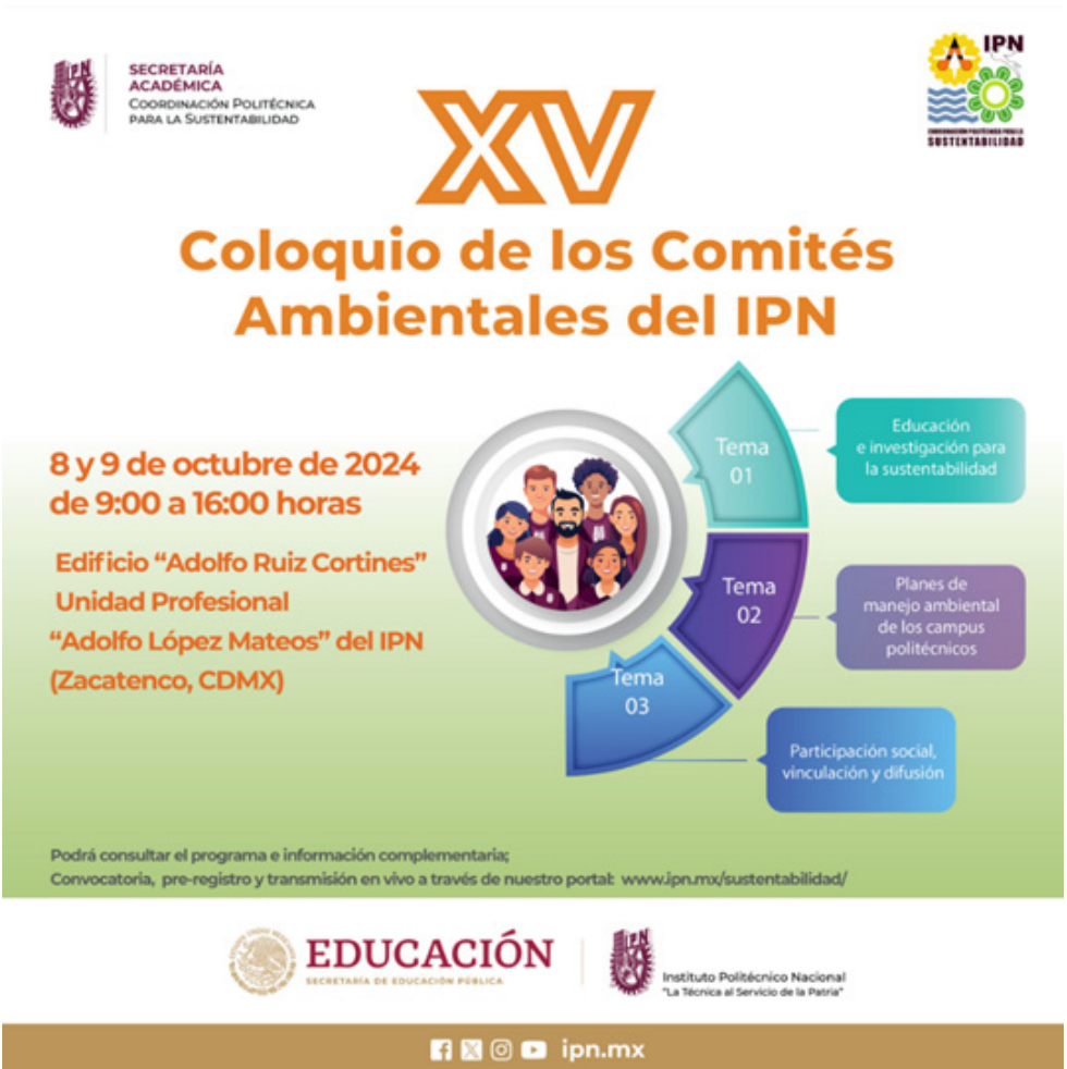
Banner de difusión del XV Coloquio de los Comités Ambientales del IPN.

Los eventos académicos que realizan las dependencias politécnicas para impulsar la formación, capacitación y/o actualización del personal y que someten a valoración ante la DFIE, reciben un registro una vez que cumplen con los requisitos establecidos, lo cual significa el reconocimiento institucional. Durante este año, las dependencias con mayor número de eventos académicos registrados fueron las siguientes de un total de 147 registros: ESCA, Unidad Santo Tomás con 17; CICS, Unidad Santo Tomás con 15; ENMH 12, ESIME, Unidad Culhuacán con 10 y la DFIE con 8.