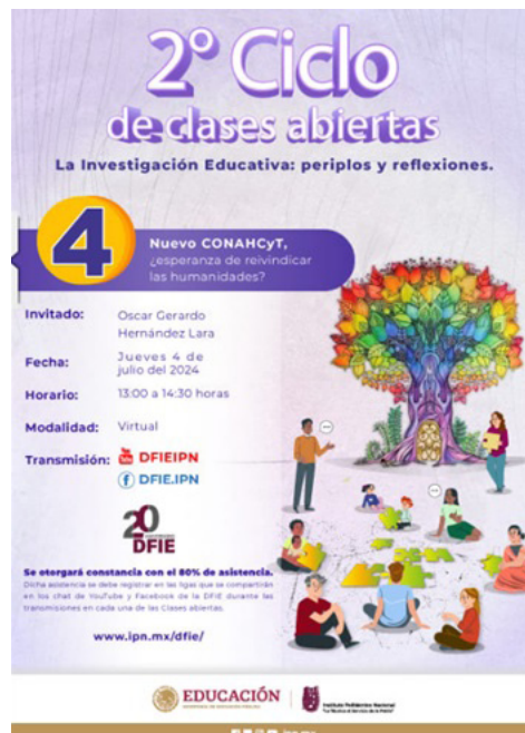
Banner de difusión 2do Ciclo de Clases Abiertas.

La asistencia al evento virtual fue de 32 personas.