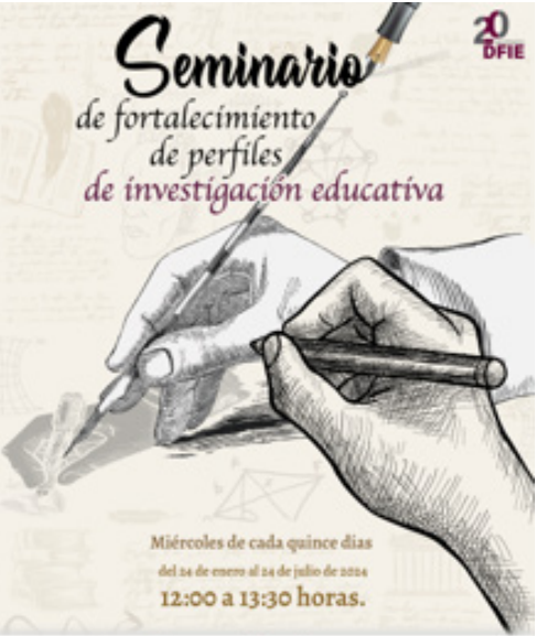
Banner de difusión del Seminario de fortalecimiento de perfiles de investigación educativa.

Las sesiones del seminario se realizaron quincenalmente de forma virtual y contó con la participación de 50 personas, aproximadamente.