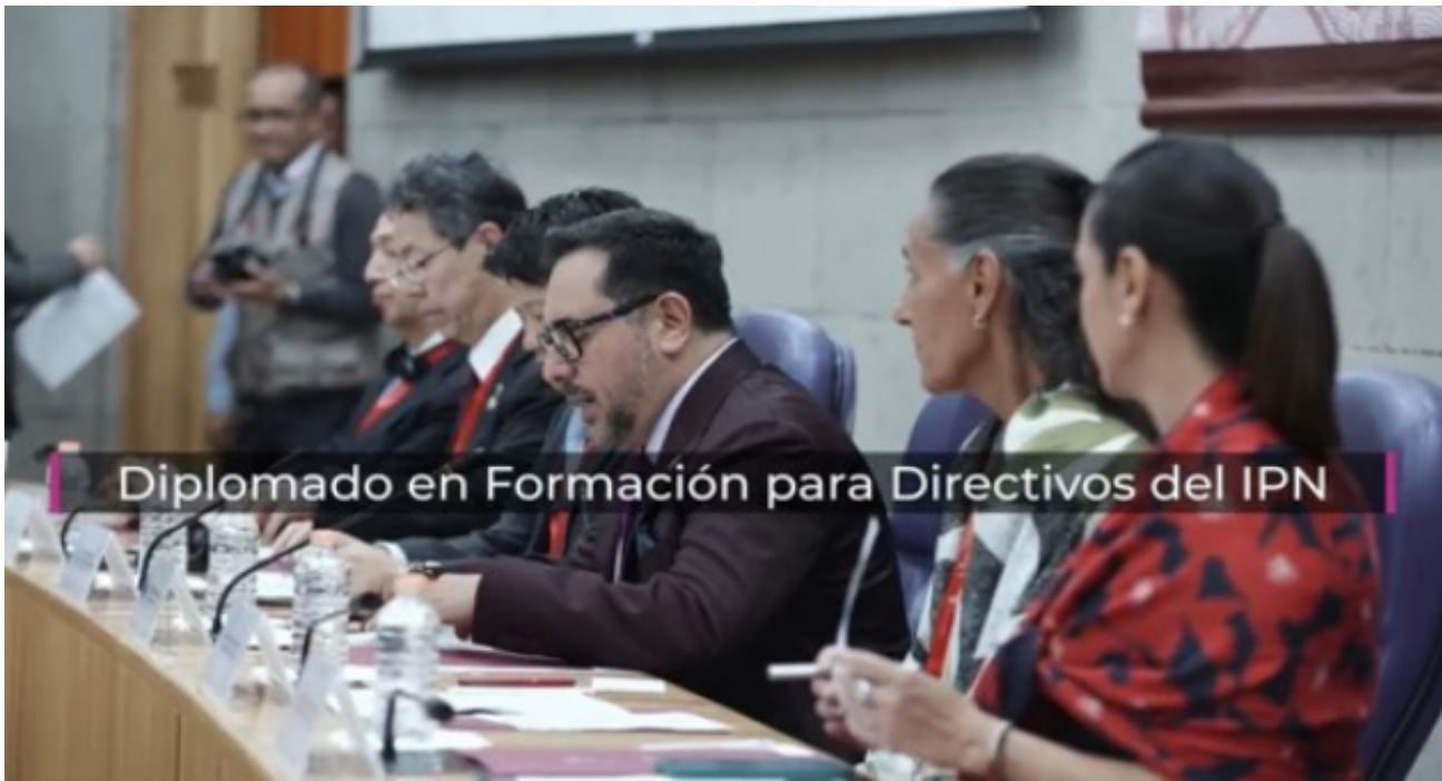
Diplomado en Formación para Directivos del IPN

En colaboración con expertos de diversas dependencias politécnicas se realizó el diseño y desarrollo del diplomado, el cual tiene como objetivo proporcionar herramientas y conocimientos que permitan al personal del IPN con nombramiento de nivel jerárquico de directivo, ejecutar sus funciones conforme a la norma según corresponda; tomar decisiones más certeras; y diseñar las directrices para el cumplimiento de los objetivos establecidos en el IPN. Esta acción de formación se implementará a principios de 2025.