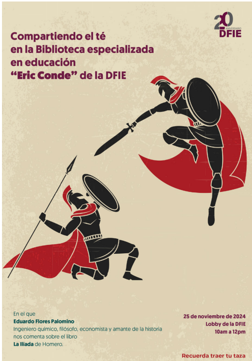
Banner de invitación a la actividad “Compartiendo el té en la biblioteca”.