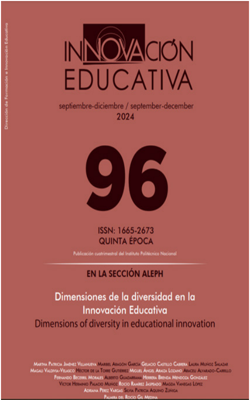
Número 96 de revista Innovación Educativa.

Derivado de la participación en la convocatoria “Fortalecimiento a publicaciones periódicas politécnicas” de la Secretaría de Investigación y Posgrado, la revista fue beneficiada, lo que permitirá la impresión de ejemplares, conversión de archivos, capacitación personal, entre otros.