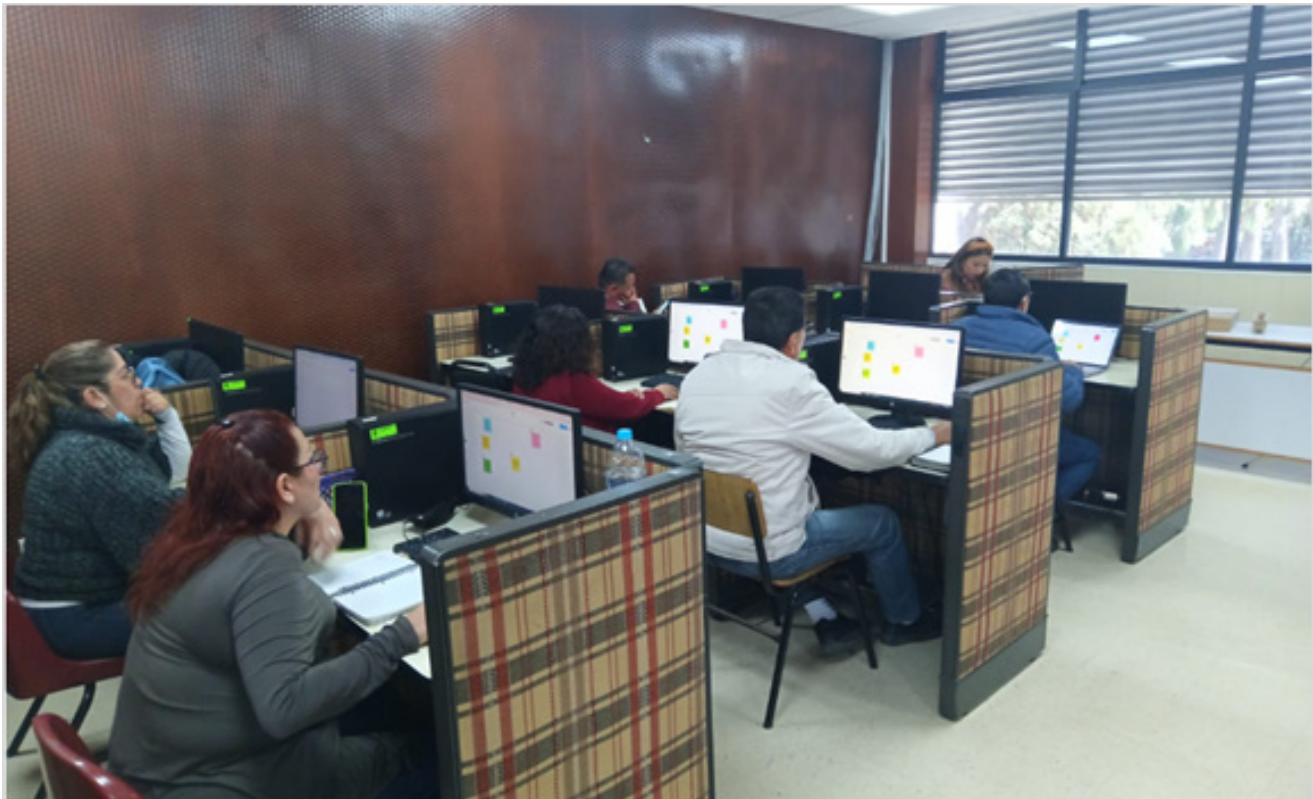
"Aprendizaje basado en proyectos a través de las herramientas colaborativas de Microsoft Teams y Google Classroom" en CECyT 11.

La formalización de estas AF permite garantizar su implementación y, con ello, se fortalece la capacidad de la DFIE para ofrecer programas formativos validados y alineados con las necesidades de actualización del personal.