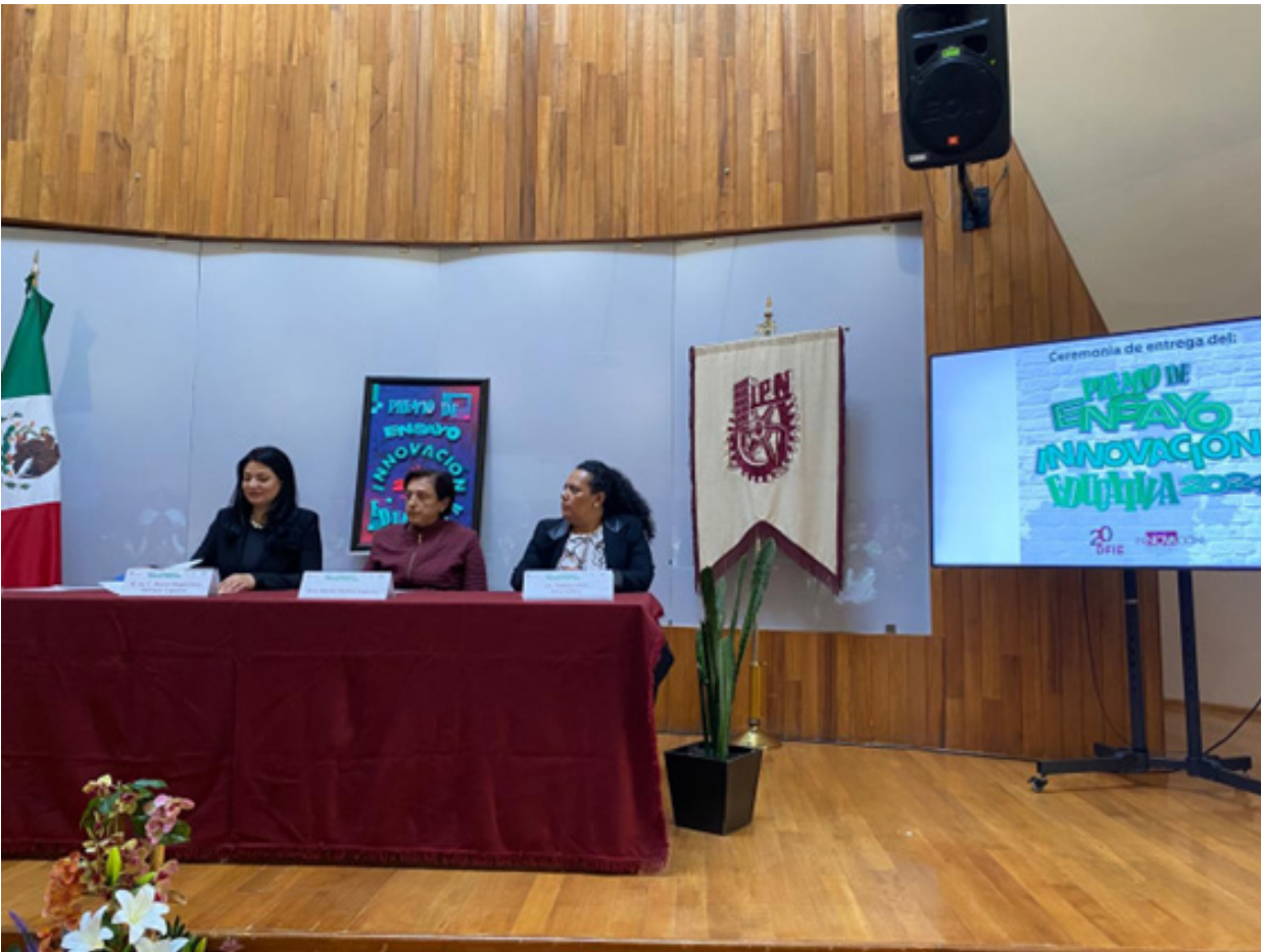
Ceremonia de premiación en el auditorio cónico de la DSETT.