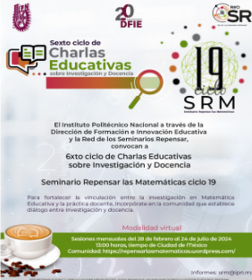
Banner de difusión del 6º ciclo de Charlas Educativas y Seminario Repensar las Matemáticas.

La asistencia fue de un total de 53 personas, 38 mujeres y 15 hombres.