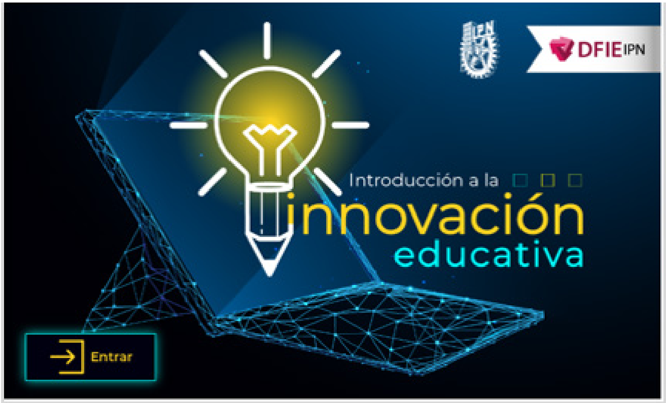
Banner de acceso al curso virtual "Introducción a la innovación educativa".