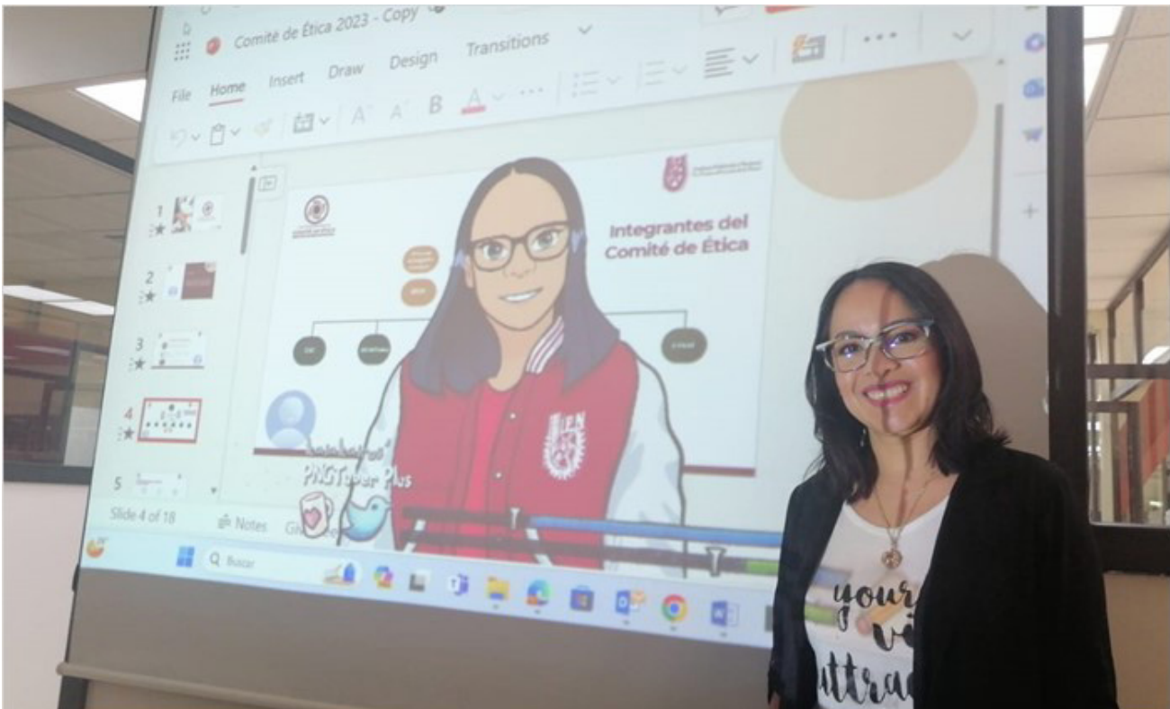
Creación de avatar para la cápsula del Comité de Ética.