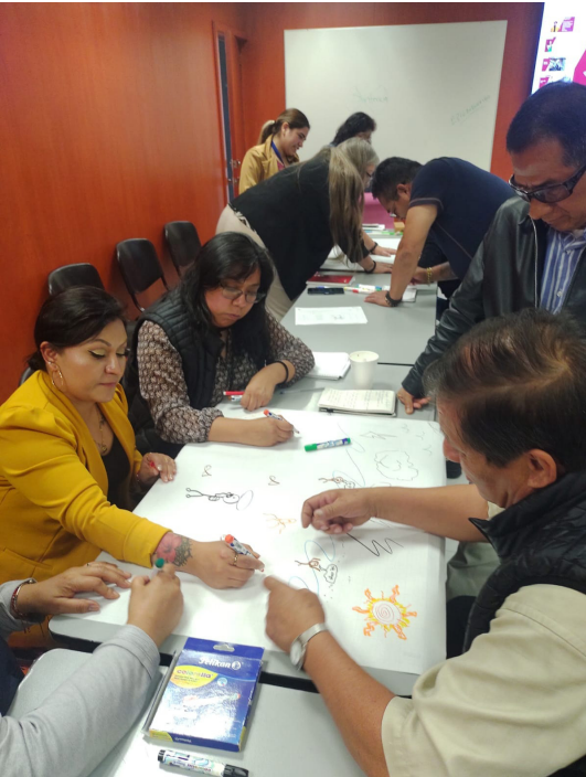
Actividad presencial "Disminuyendo el estrés laboral con atención consciente".

En su primera emisión se registraron 30 participantes.