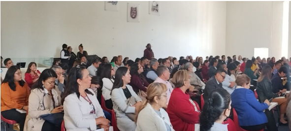
Reunión presencial con enlaces para el DNF

El propósito de la DNF es identificar áreas de oportunidad en la formación, actualización y capacitación del personal del IPN, con el fin de diseñar programas formativos que respondan a sus necesidades y fortalezcan sus competencias, alineándose a los objetivos institucionales. La DNF se concretó con la aplicación de una encuesta que abarcó a personal directivo, docente (de unidades académicas y centros de investigación) y de apoyo y asistencia a la educación (PAAE), analizando perfiles, años de servicio y necesidades formativas específicas.