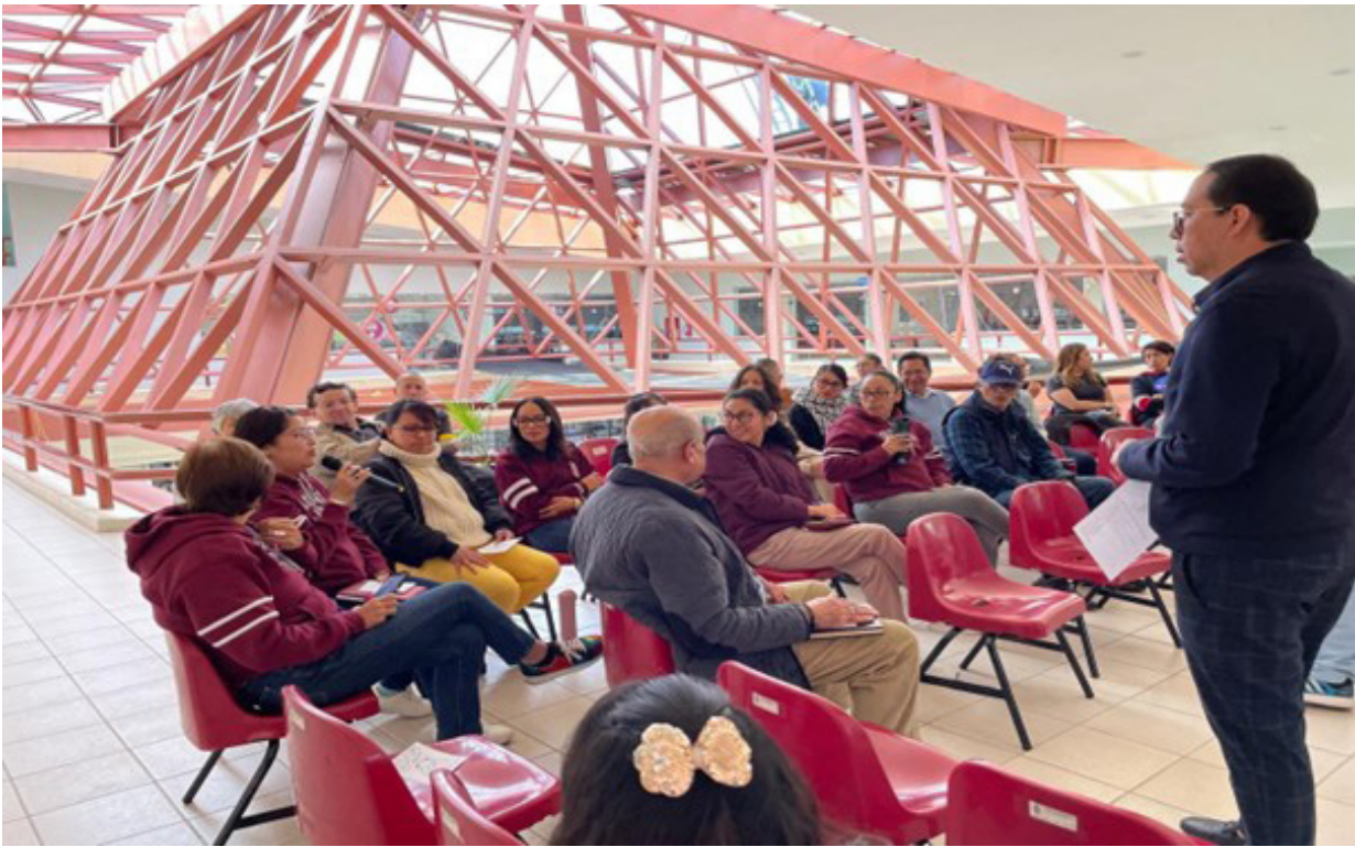
Desarrollo de la actividad “Conversando sobre masculinidades”.