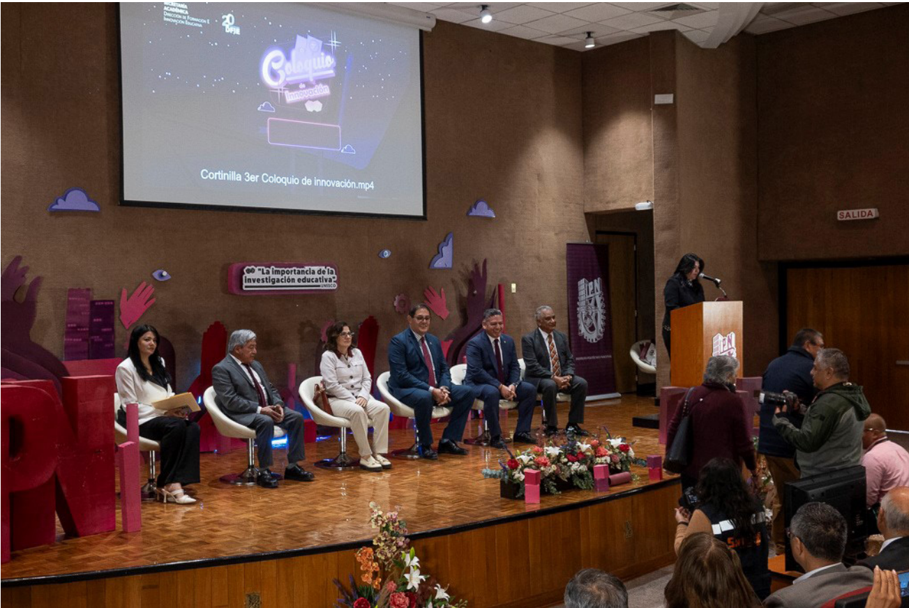
Ceremonia de inauguración del 3er Coloquio de Innovación e Investigación Educativas.

La participación fue de 806 asistentes tanto de forma presencial como virtual.