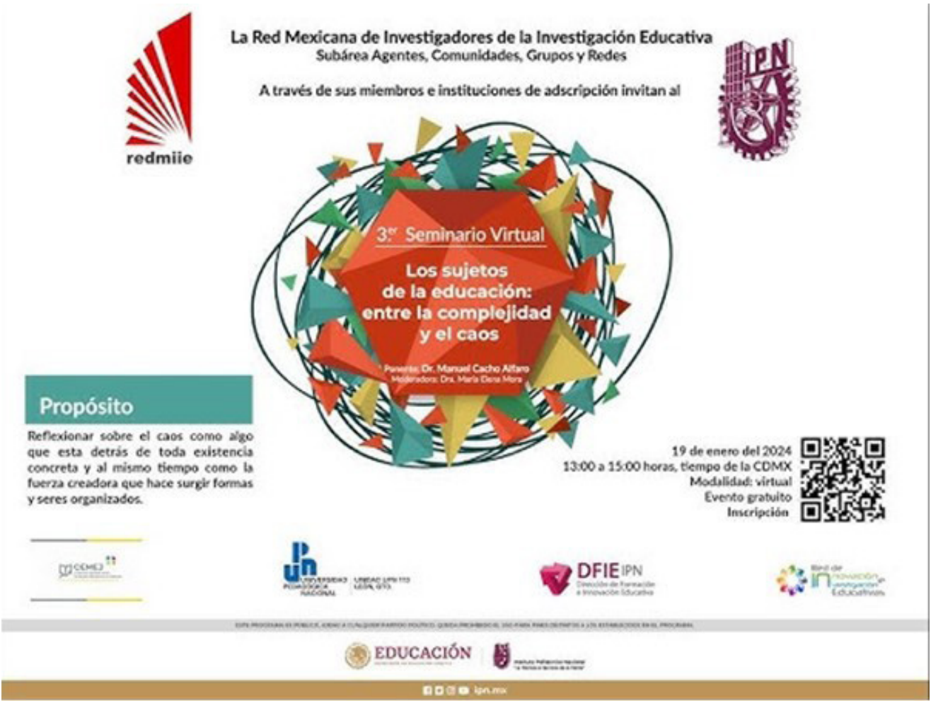
Banner de difusión 3er Seminario Virtual.

Discutir sobre cómo una perspectiva teórica puede ser reflexionada y transformada, reconociendo que hay tantas realidades como sujetos posibles, así como la necesidad de luchar por la recuperación de un pensamiento más propio. La asistencia a este evento virtual fue de 140 participantes.