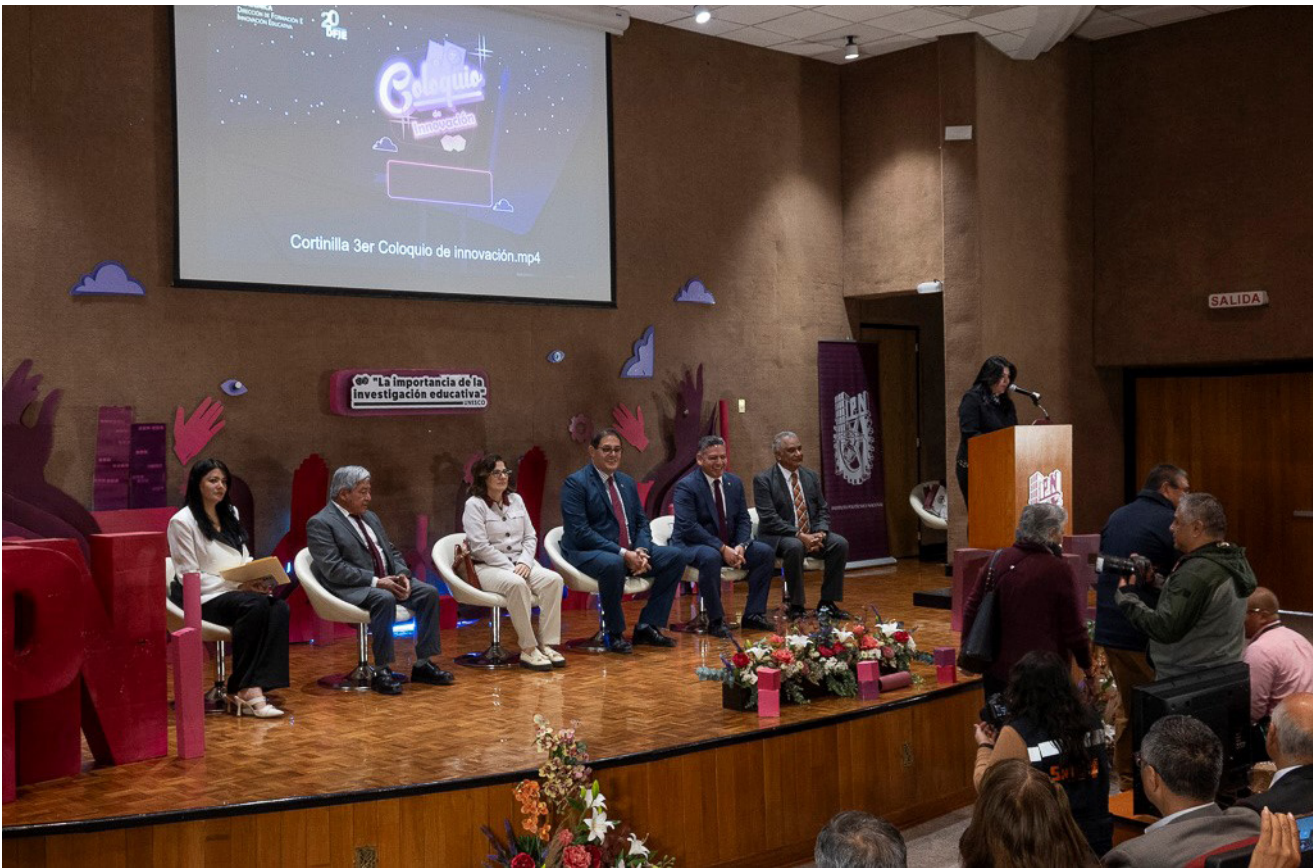
Ceremonia de inauguración del 3er. Coloquio de Innovación e Investigación Educativas.

El programa del evento estuvo conformado por dos pláticas magistrales: “La importancia de la investigación educativa” y “Las funciones ejecutivas y la metodología lúdica como un aliado estratégico en el proceso de aprendizaje”, así como una presentación estelar “Neuroeducación: El arte de enseñar con el cerebro”. Complementaron el evento diversas actividades simultáneas durante los dos días de trabajo.