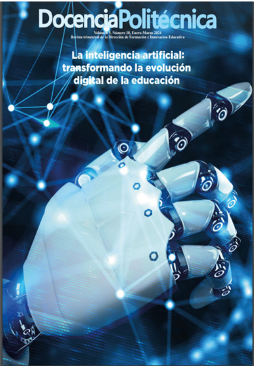
Número 18 de la revista Docencia Politécnica.

Asimismo, se realizó el trámite de renovación de la Reserva de Derechos para su versión impresa.