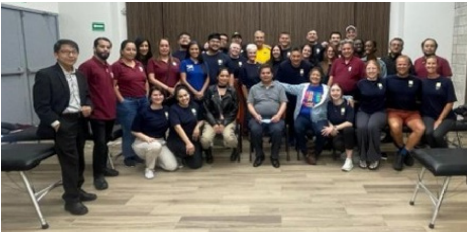
Clínica Quiropráctica Gratuita, 28 de marzo de 2024.

Se apoyó con el servicio de traducción e interpretación con un grupo de 12 profesores de inglés de los Centros de Lenguas Extranjeras (CENLEX) Unidades Santo Tomás y Zacatenco coordinados por la Dirección de Formación de Lenguas Extranjeras (DFLE), con motivo de la visita de un grupo de doctores de la Life West University College Chiropractor , realizado en las instalaciones de la Sección 60 del Sindicato Nacional de Trabajadores de la Educación (SNTE) con apoyo de la Dirección de Recursos Humanos del IPN.