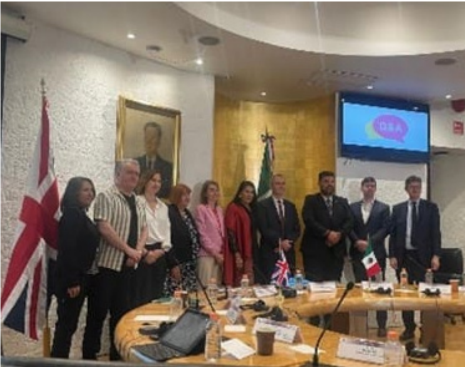
Presentación de resultados del primer semestre del Proyecto para el Fortalecimiento de la Enseñanza del Idioma Inglés en el IPN, 13 de febrero de 2024.

En dicha ceremonia se dieron a conocer las acciones realizadas por ambas instancias en pro de la mejora de la enseñanza del idioma inglés en el IPN.