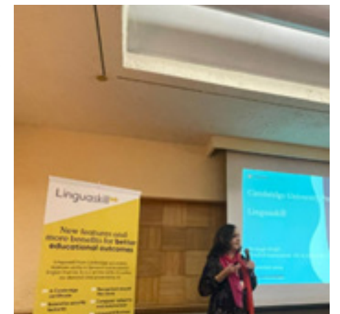
Conferencia “ Reach new heights with Linguaskill certified ”, 29 de noviembre de 2024.

Una delegación integrada por docentes y autoridades académicas de la Dirección de Formación de Lenguas Extranjeras (DFLE) y de los Centros de Lenguas Extranjeras (CENLEX) Unidades Zacatenco y Santo Tomás, asistieron a la conferencia “ Reach new heights with Linguaskill certified ” organizada por Cambridge, en la que se trató todo lo relativo a la certificación Linguaskill para valorar su impacto y utilidad en la comunidad politécnica.