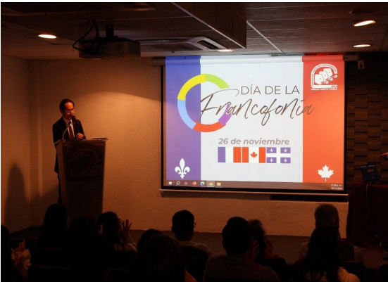
La “Journée de la Francophonie”, una jornada dedicada a la difusión de la lengua francesa y la cultura francófona, 26 de noviembre de 2024.

En el Centro de Lenguas Extranjeras Unidad Santo Tomás se realizó la primer aplicación del IELTS el día 29 de noviembre de 2024, siendo esta una de las certificaciones con mayor reconocimiento y prestigio internacional que prueba el dominio de la lengua inglesa y esta dirigida principalmente a hablantes no nativos que buscan estudiar o trabajar en países o ambientes angloparlantes.