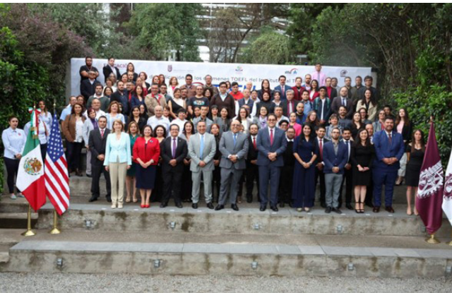
Primera aplicación del examen TOEFL ITP, 10 de julio de 2024.