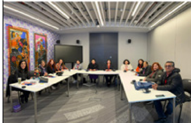
Sesión de trabajo en la sede del Consejo Británico, Londres, Reino Unido, 16 de abril de 2024.

En esta reunión se consolidaron las acciones que se realizarán como parte del Proyecto para el Fortalecimiento de la Enseñanza del Idioma Inglés en el IPN.