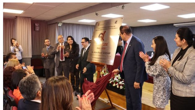
Celebración del 60 Aniversario del CENLEX Unidad Zacatenco, 06 de noviembre de 2024.

Este aniversario fue un reflejo de seis décadas de esfuerzo conjunto.