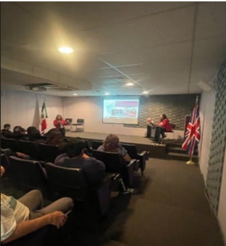
Primera sesión de sensibilización para la implementación del Proyecto para el Fortalecimiento de la Enseñanza del Idioma Inglés en el IPN, 19 de enero de 2024.