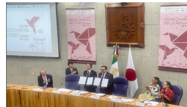
Sexta Cumbre de Rectores México-Japón, 5 de septiembre de 2024.

Durante las sesiones de trabajo se generaron vínculos y acuerdos de colaboración mutua entre las instituciones de educación superior de ambos países.