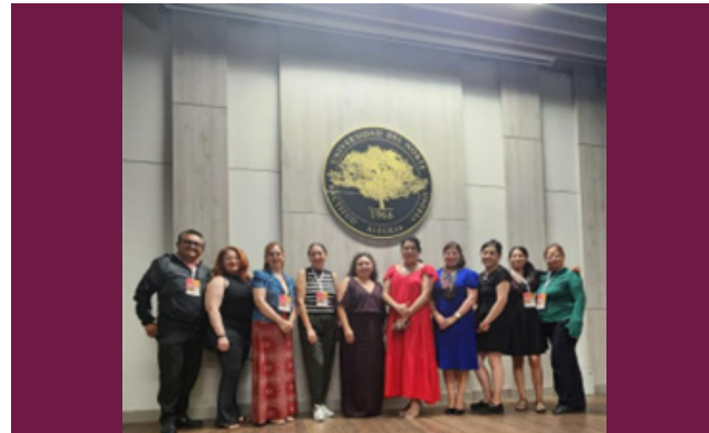
Conferencia “ Democracy and Language Education: Teaching and Assessing for Social Justice ”, 03 de octubre de 2024.

Asistió una delegación del IPN, a la Conferencia “ Democracy and Language Education: Teaching and Assessing for Social Justice ”, realizada por la Asociación Colombiana de Profesores de Inglés (ASOCOPI), se colaboró con la Latin American Association for Language Testing and Assessment (LAALTA), en Barranquilla, Colombia, a fin de dar continuidad a las actividades de internacionalización establecidas en el Acuerdo de Alianza Operacional que el IPN firmará con el Consejo Británico, con el fin de establecer alianzas estratégicas con otras instituciones asistentes a este evento.