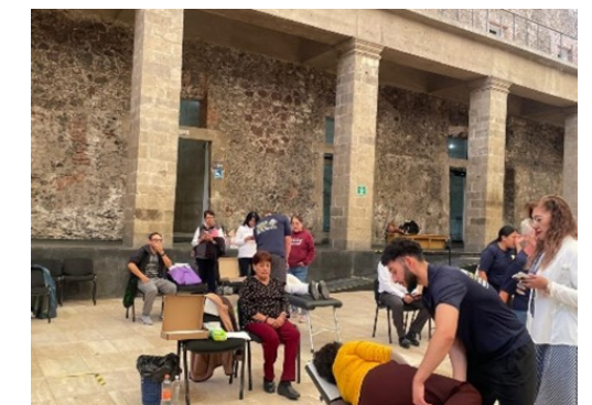
Clínica Quiropráctica Gratuita, 23 de septiembre de 2024.

El evento se realizó en el Centro Cultural del México Contemporáneo en el Centro Histórico de la Ciudad de México, organizado por la Sección 60 del Sindicato Nacional de Trabajadores de la Educación (SNTE) y la Dirección de Recursos Humanos del IPN.