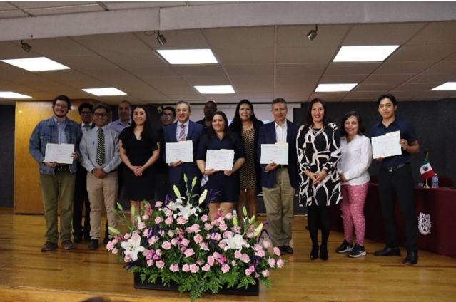
Entrega de certificados DFLE, 17 de mayo de 2024.

Se realizó la entrega de los certificados Diplôme d'études en langue française (DELF), un hito importante en el camino educativo de nuestros alumnos, quienes trabajaron arduamente para superar las exigencias del DELF, un reconocimiento internacionalmente aceptado que avala sus competencias en lengua francesa.