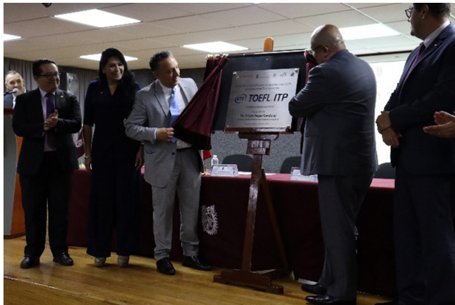
Develación de Placa de Centro aplicador del examen TOEFL ITP, 10 de julio de 2024.

Con estas acciones se potencian las competencias de las y los politécnicos como parte de la internacionalización que se promueve en esta casa de estudios.