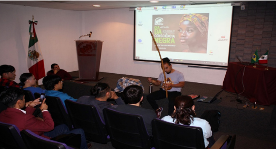
Día de la Conciencia Negra, 21 de noviembre de 2024.

El Día de la Conciencia Negra no solo recuerda los hechos históricos, sino que también sirve para reflexionar sobre la actualidad del racismo estructural y la lucha por la igualdad racial en Brasil. Fue una jornada de visibilización y denuncia, así como una oportunidad para celebrar la rica cultura afrobrasileña. Es una fecha de memoria, resistencia y orgullo, que invita a la sociedad a continuar luchando por la justicia racial y a reconocer la invaluable herencia.