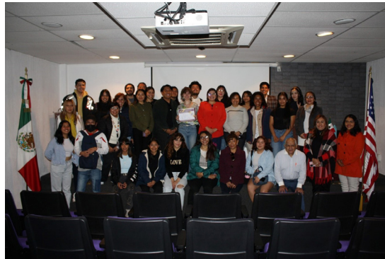
Presentación de los asistentes de inglés por parte de COMEXUS, 25 de noviembre de 2024.

Con un enfoque interactivo, se busca que los estudiantes perfeccionen sus habilidades de comunicación en un ambiente multicultural.