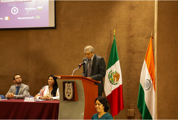
Ceremonia inaugural del 10° Encuentro de Profesores de la Lengua del IPN, 26 de junio del 2024.