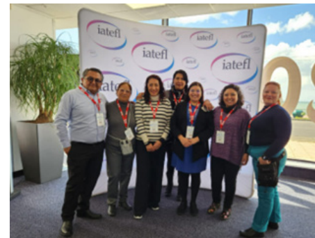
Asistencia a la IATEFL, 17 de abril de 2024.

Asimismo, se asistió a las conferencias con la finalidad de conocer sobre las nuevas tendencias en la enseñanza del inglés y se tuvo la oportunidad de reunirse con grupos de intereses específicos, promoviendo la creación de nuevos vínculos para propiciar acuerdos e intercambios y con ello fortalecer la enseñanza y aprendizaje del idioma inglés.