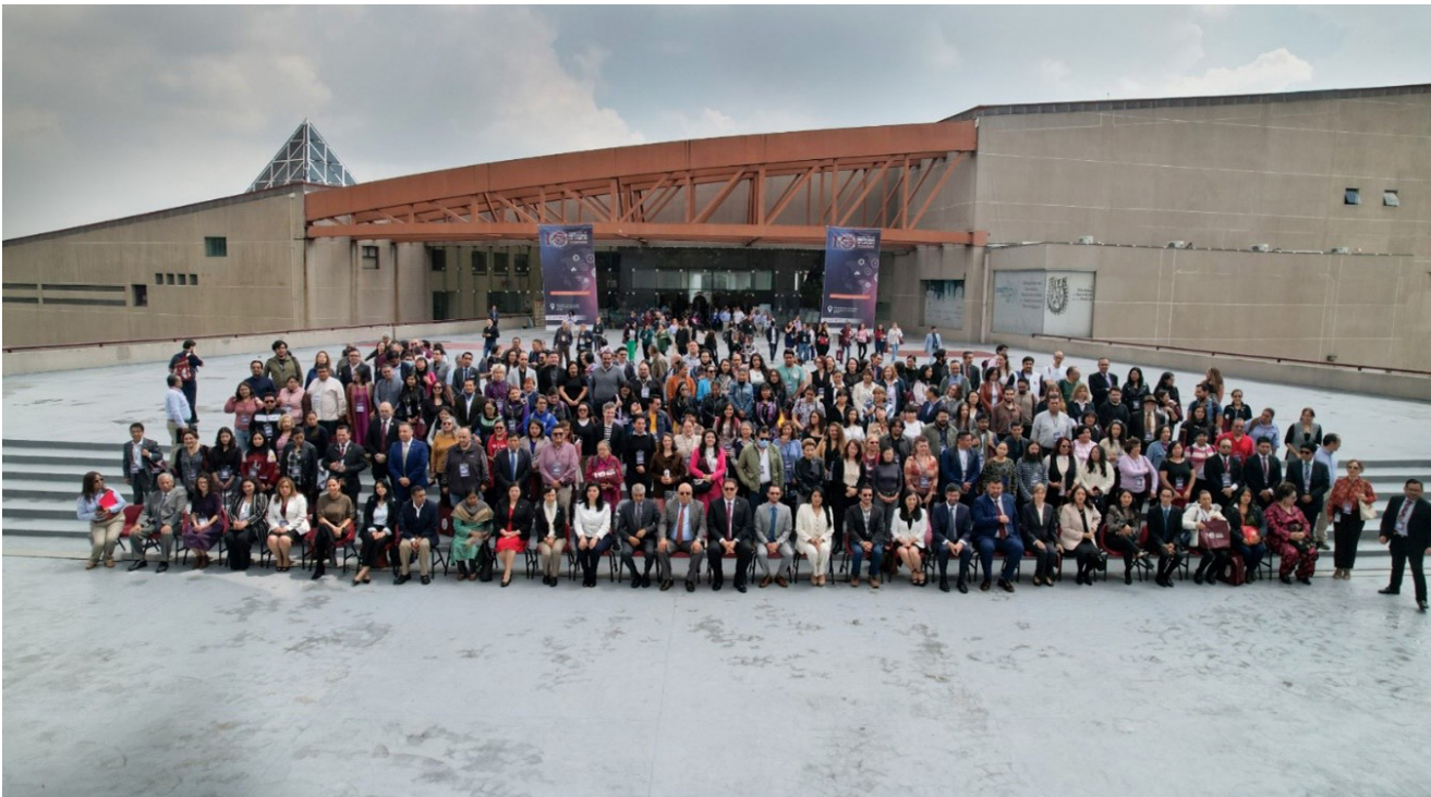
10° Encuentro de Profesores de Lenguas del IPN, 26 de junio de 2024.

Durante el evento se llevaron a cabo 27 ponencias y 13 talleres académicos, contó con una exposición de ilustraciones de Xilografías de Cordel, cuatro talleres culturales, cuatro ponencias magistrales, 12 stands editoriales y la presentación de la Orquesta del Instituto de la Juventud (INJUVE) en la clausura.