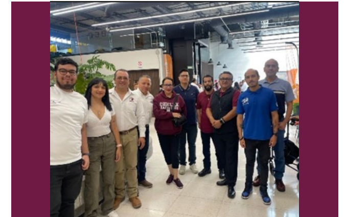
Clínica Quiropráctica Gratuita, 19 de junio de 2024.

El evento fue organizado por la Sección 60 del Sindicato Nacional de Trabajadores de la Educación (SNTE) y la Dirección de Recursos Humanos del IPN.