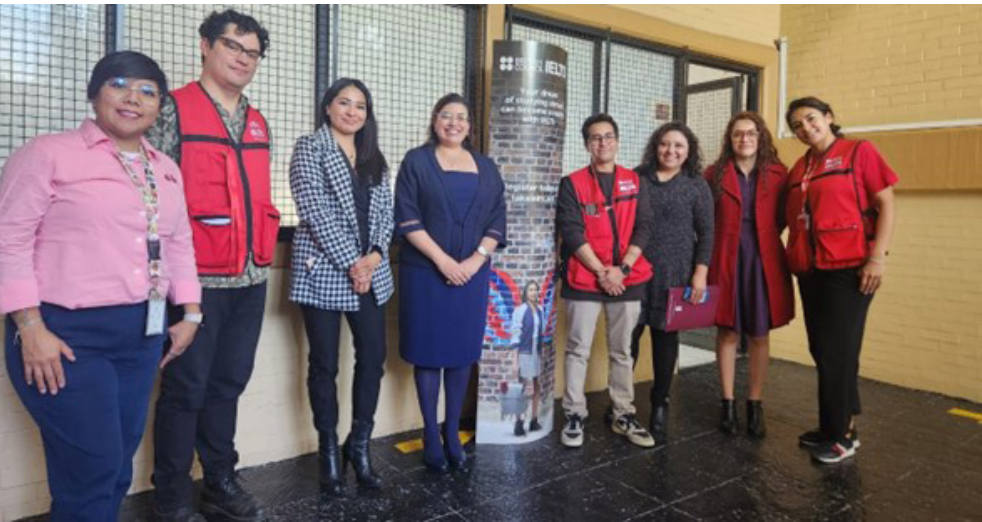
Primera aplicación del examen IELTS en el CENLEX UST, 29 de noviembre de 2024.