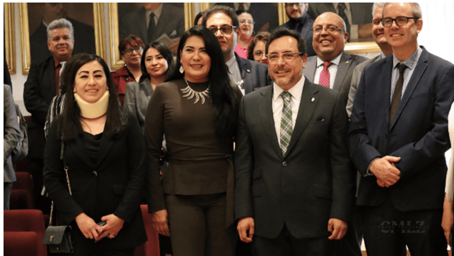
Firma de Convenio IPN-Consejo Británico, 26 de septiembre de 2024.

Nuestro Director General firmó un convenio con el Consejo Británico, para que los Centros de Lenguas Extranjeras puedan ofrecer las certificaciones IELTS ( International English Language Testing System ) y Aptis, con las cuáles los jóvenes politécnicos podrán certificarse en el idioma inglés para abrirse más puertas en el ámbito académico y profesional a nivel internacional.