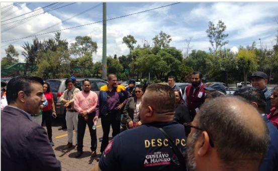
Tercer recorrido del grupo Interinstitucional contra el porrismo Lugar: Diversos planteles de la Alcaldía Gustavo A Madero Fecha: 18 de agosto de 2024.

Con el propósito de identificar puntos de riesgo, así como de tomar acciones para erradicar la influencia de grupos generadores de violencia, en contra de la comunidad del IPN, se llevaron a cabo diferentes acciones en el marco del Grupo Interinstitucional contra el porrismo.