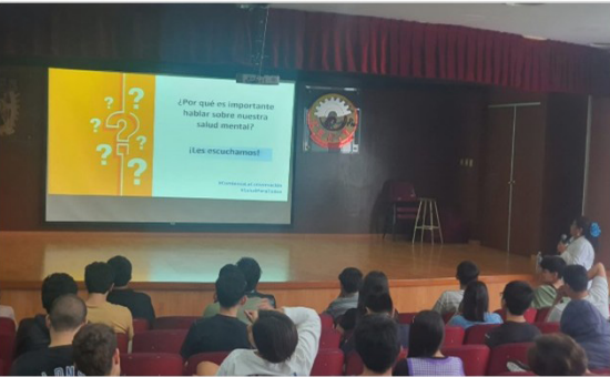
Plática Prevención del Suicidio impartida por CIJ – Septiembre amarillo Lugar: CECyT 9 “Juan de Dios Bátiz” Fecha: 12 de septiembre de 2024.

Con la finalidad de difundir información sobre los daños y riesgos ocasionados por el consumo de sustancias psicoactivas, se llevaron a cabo pláticas sobre el tema violencia y adicciones impartidas por personal de Centros de Integración Juvenil.