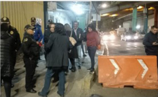
Recorrido – Circuito Escolar Oceanía Lugar: CECyT 10 y escuelas aledañas Fecha: 06 de diciembre.

Con el propósito de realizar las gestiones correspondientes para mantener las condiciones mínimas de seguridad en el entorno de las Unidades Académicas del Instituto.