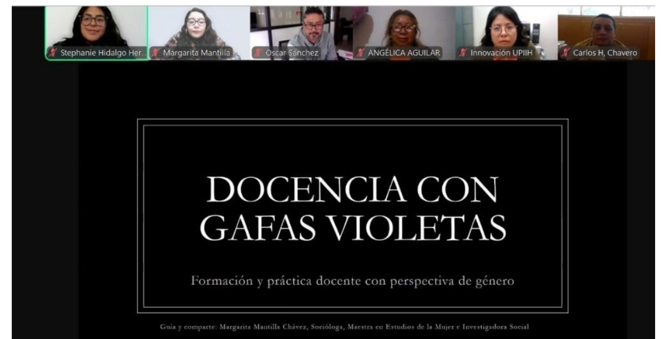
“ Formación docente con Perspectiva de Género”.

En el marco del nuevo Programa de Formación Docente con Perspectiva de Género, el cual derivó del desarrollo del Modelo de Transversalidad Curricular de la Perspectiva de Género, que tiene por objetivo promover la consolidación de la igualdad sustantiva a través de procesos de formación docente que doten de herramientas teóricas, metodológicas y didácticas al profesorado del IPN para integrar dicha perspectiva desde sus dimensiones éticas y políticas a su práctica cotidiana, se llevaron a cabo dos emisiones del curso “Docencia con gafas violetas: Formación y práctica docente con perspectiva de género” dirigido a personal de las jefaturas de innovación educativa de las unidades académicas de nivel superior y la segunda, a personal de las Subdirecciones Académicas de Nivel Medio Superior.