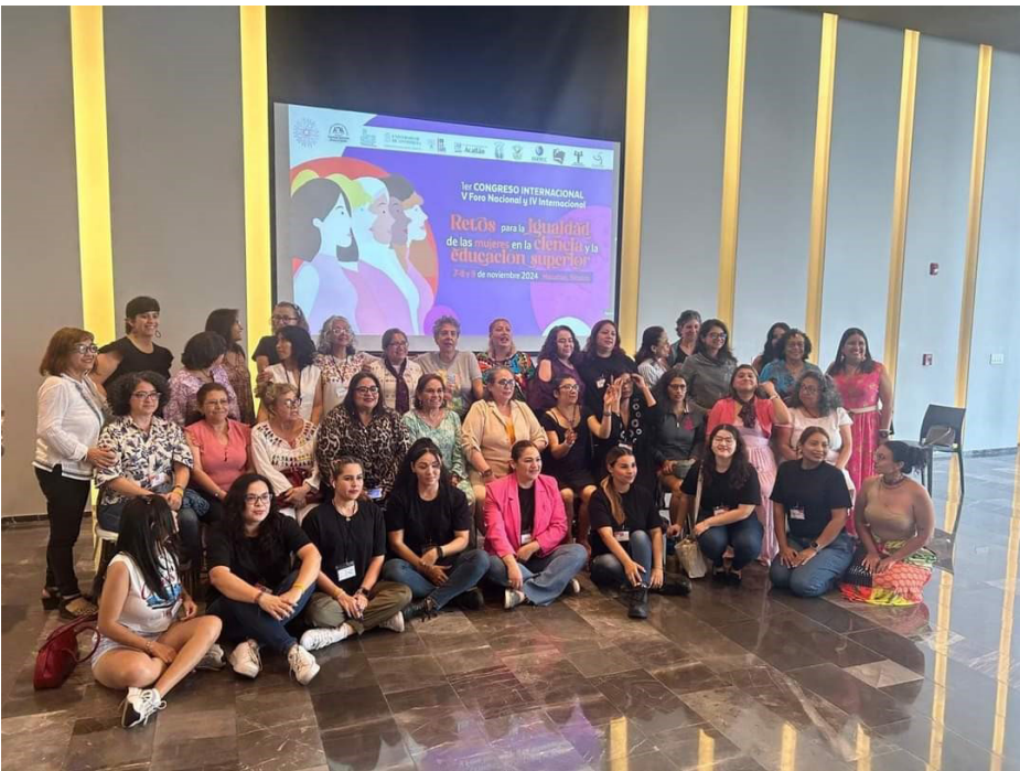
Eventos académicos para la difusión de hallazgos de investigaciones realizadas.