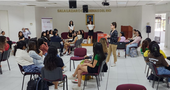
“Proyecto Inspiring Girls”.

En este sentido, se llevaron a cabo las pláticas y talleres de sensibilización a mujeres estudiantes de CECyT 6, 16, 17, 18, 20 y ESCA, Unidad Santo Tomás.