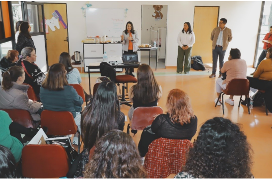
“Diplomado Formación Integral para las Redes de Género 3ra Generación”.

Acción que se llevó a cabo por tercera ocasión formando a integrantes de las Redes de Género, la Cual tuvo por objetivo desarrollar herramientas teóricas y metodológicas que fortalezcan la figura de las “Redes de Género” como núcleo fundamental en el proceso de sensibilización y prevención de la violencia de género en el IPN. Se contó con la participación de 138 participantes de la comunidad politécnica (71 hombres y 67 mujeres).