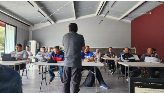
“ Proyecto de Intervención con Hombres para la Consolidación de una Cultura de Paz”.

Con el objetivo de promover una cultura de prevención de la violencia de género entre la comunidad estudiantil del IPN mediante la elaboración de productos digitales creativos (Tik Tok). Se llevo a cabo el concurso “Politécnico naranja: 60 segundos contra la violencia “, los vídeos realizados por el estudiantado visualizaron problemáticas relacionadas con la violencia de género, así como propuestas para la creación de espacios seguros en el Instituto Politécnico Nacional. Se recibieron 15 vídeos de nivel medio superior y 23 de nivel superior.