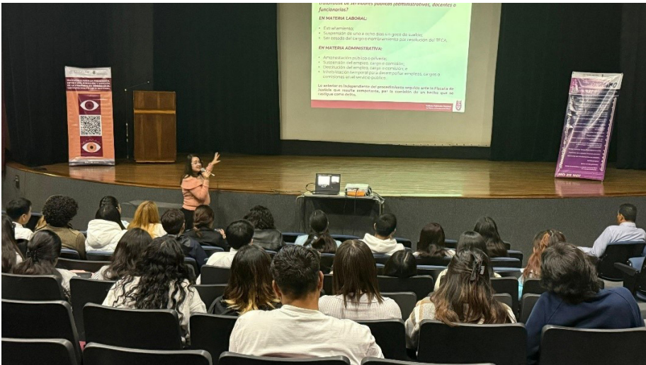
“Pláticas, talleres y mesas de atención en las “Jornadas Politécnicas #GéneroConCiencia”.

Estas pláticas se impartieron en unidades académicas de nivel medio superior CECyT 2,3,4,5,6,7,8,10,11,12,16,17,18,19,CET 1; y nivel superior ESIA Tecamachalco, ESIA Ticomán CICS Santo Tomás, UPIIG, EST, ESIT, ESCA Tepepan, ESCA Santo Tomás UPIIT, ESEO, ESE, CICS Milpa Alta, ESCOM,UPIICSA,UPIITA, ESFM, UPIEM, ENMH, ESIME Ticomán, ESIME Azcapotzalco, ESIME Zacatenco,ESIME Culhuacán, UPIEM, UPIBI,ESM,ESIQIE, ENCB, así como a unidades de área central como la Dirección de Educación Superior (DES). Se contó con una asistencia total de 10,119 hombres y 10,997 mujeres con un total de 21,116 personas.