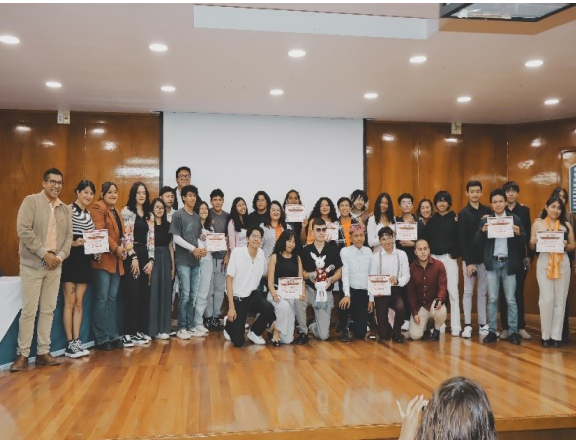
Concurso “Politécnico Naranja:60 segundos contra la violencia”.