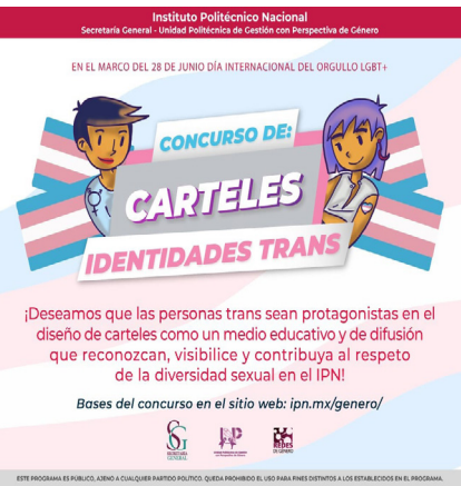
Concurso de carteles “Identidades trans”.

En este concurso se recibieron 15 carteles de nivel medio superior y 36 de nivel superior.