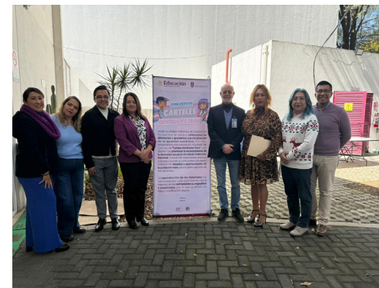
Exposición de carteles “Identidades Trans” en las instalaciones de la USIPT.

Asistencia a acto inaugural de la exposición de carteles denominados “Identidad Trans” en la Unidad de Salud Integral para Personas Trans, material desarrollado por la Unidad Politécnica de Gestión con Perspectiva de Género.