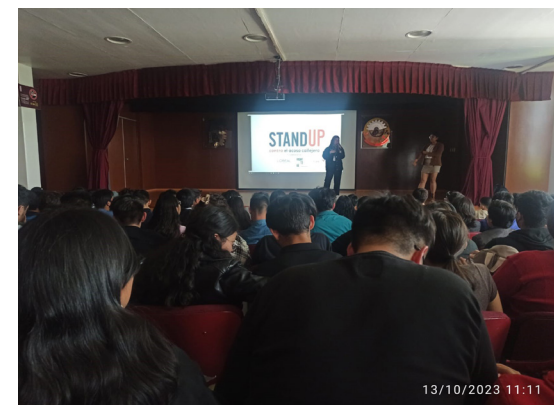
“Stand up contra el acoso callejero”, Casa Gaviota A.C.

Las pláticas impartidas tuvieron como propósito aprender a enfrentar el acoso callejero a través de la metodología 5 “D” (Distraer, delegar, documentar, dar asistencia y dirigir).