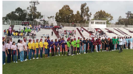
Concurso “SexOlimpiadas Politécnicas”.

Se contó con la inscripción de 47 equipos de nivel medio superior y 88 equipos de nivel superior.