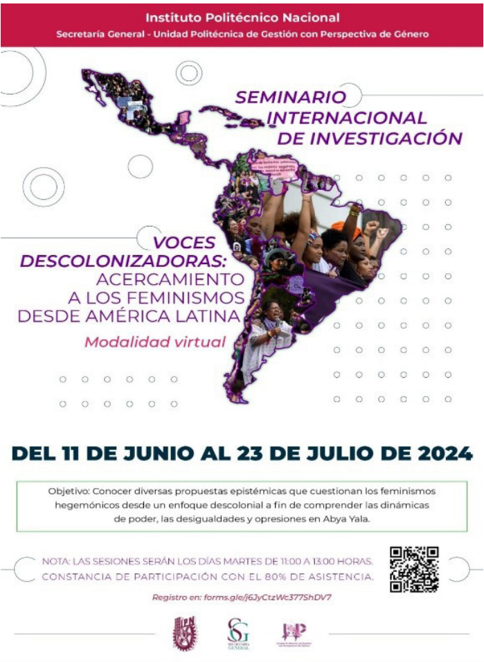
“Seminario Internacional de Investigación: Voces Descolonizadoras: acercamiento a los feminismos desde América Latina”.

Fueron siete sesiones virtuales dictadas semanalmente por especialistas, donde participaron personal del IPN, así como docentes, investigadoras, investigadores, estudiantado, asociaciones de la sociedad civil y público en general de distintos países (Argentina, Bolivia, Brasil, Colombia, Costa Rica, España, Estados Unidos, Italia, Nicaragua, Paraguay, Perú y Venezuela), contando con la participación total de 38 hombres y 266 mujeres.