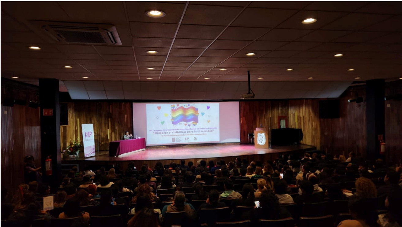
“1 er Congreso Internacional de Diversidad Sexual y Género en Educación”.

El “1 er Congreso Internacional de Diversidad Sexual y Género en Educación” fue un espacio de intercambio, diálogo y discusión en torno a los desafíos, tensiones y alternativas para la inclusión y reconocimiento de la diversidad sexual y de género en espacios educativos, en colaboración con la Red Mexicana de Investigación Educativa sobre Diversidad Sexual (ReMIEDS), dirigido a la comunidad politécnica y público en general, donde participaron más de 60 investigadores/as de 18 estados de la República Mexicana y de ocho países: México, Brasil, Argentina, Colombia, Cuba, Chile, España y Guatemala.