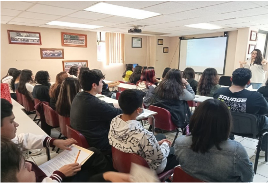
Taller "Deconstruyendo mi amor romántico".

En el participaron 347 mujeres y 286 hombres.