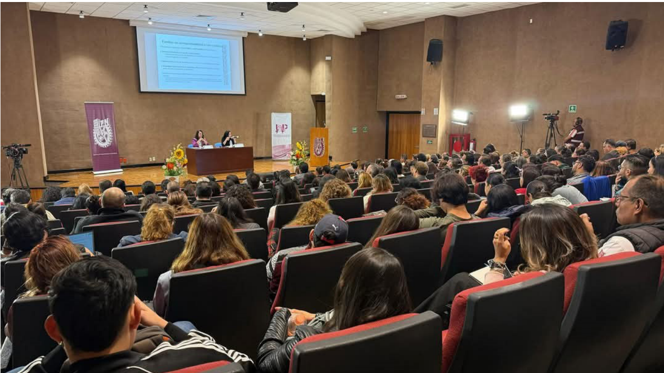
“Encuentro Interinstitucional hacia la construcción de la Política de Igualdad en el IPN”.

“El Encuentro Interinstitucional hacia la Construcción de la Política de Igualdad en el Instituto Politécnico Nacional”, fue un espacio de discusión y diálogo con la comunidad politécnica, en la que participaron especialistas de organizaciones civiles, gobierno y academia a través de cinco conferencias magistrales dirigidas a estudiantado, personal docente, personal de apoyo y asistencia a la educación y funcionariado de nuestro instituto, el cual estuvo encaminado a la construcción de la “Política Institucional de Igualdad del IPN”, con la visión de ser el documento rector que establecerá objetivos, estrategias y líneas de acción que conviertan al Instituto Politécnico Nacional en un referente en materia de su compromiso institucional y responsabilidad social con la no discriminación, la igualdad y la erradicación de la violencia para alcanzar la igualdad sustantiva en todas las esferas y tareas.