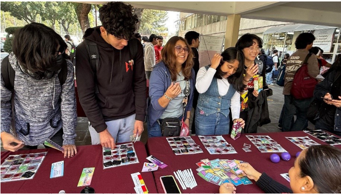
“Talleres y actividades lúdicas sobre educación sexual integral”.

Se contó con una asistencia total de 9,991 hombres y 10,491 mujeres con un total de participación de 20,482 personas.