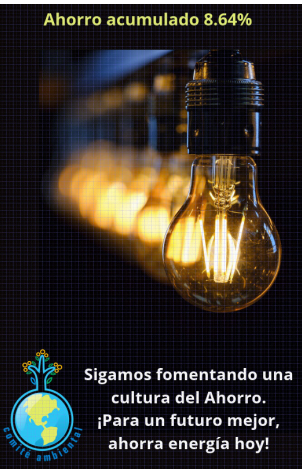
Ahorro de energía.

Además del cumplir con la normatividad aplicable al manejo de los residuos.