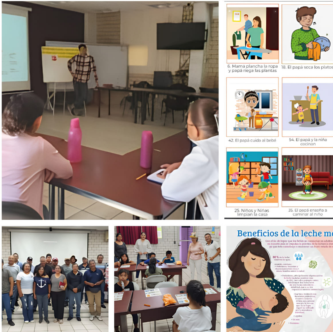
Red de Género.

Respecto a la Red de Género del Centro de Desarrollo de Productos Bióticos, se contó con un programa anual de actividades de sensibilización y capacitación, lo que se realizó mediante conferencias, pláticas, cursos, entre otros, todos impartidos por especialista en el tema, lo que coadyuvó a la integración con un enfoque de género.