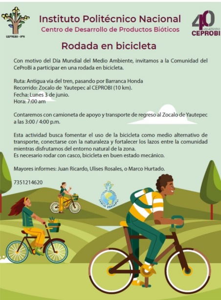
Rodada de Bicicleta.

La sensibilización con respecto a las actividades para preservar nuestro medio ambiente, son la clave para poder cumplir con el compromiso social, por ello se fomentó el uso de la bicicleta como medio de transporte entre otras actividades.