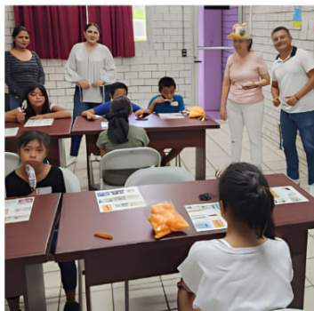
Cultura de Inclusión.