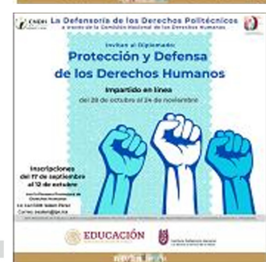
Actividades de derechos humanos.