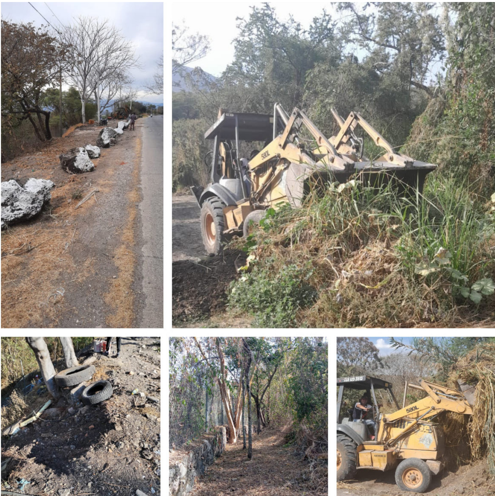
Materiales e Infraestructura.

Los insumos son necesarios para el desarrollo de las actividades de docencia e investigación que se llevan a cabo en esta Institución, resultando necesario para la transparencia informar de todas aquellas contrataciones realizadas y registradas, en el periodo que se informa se hicieron 12 informes dirigidos al Director de Recursos Materiales e Infraestructura del Instituto Politécnico Nacional.