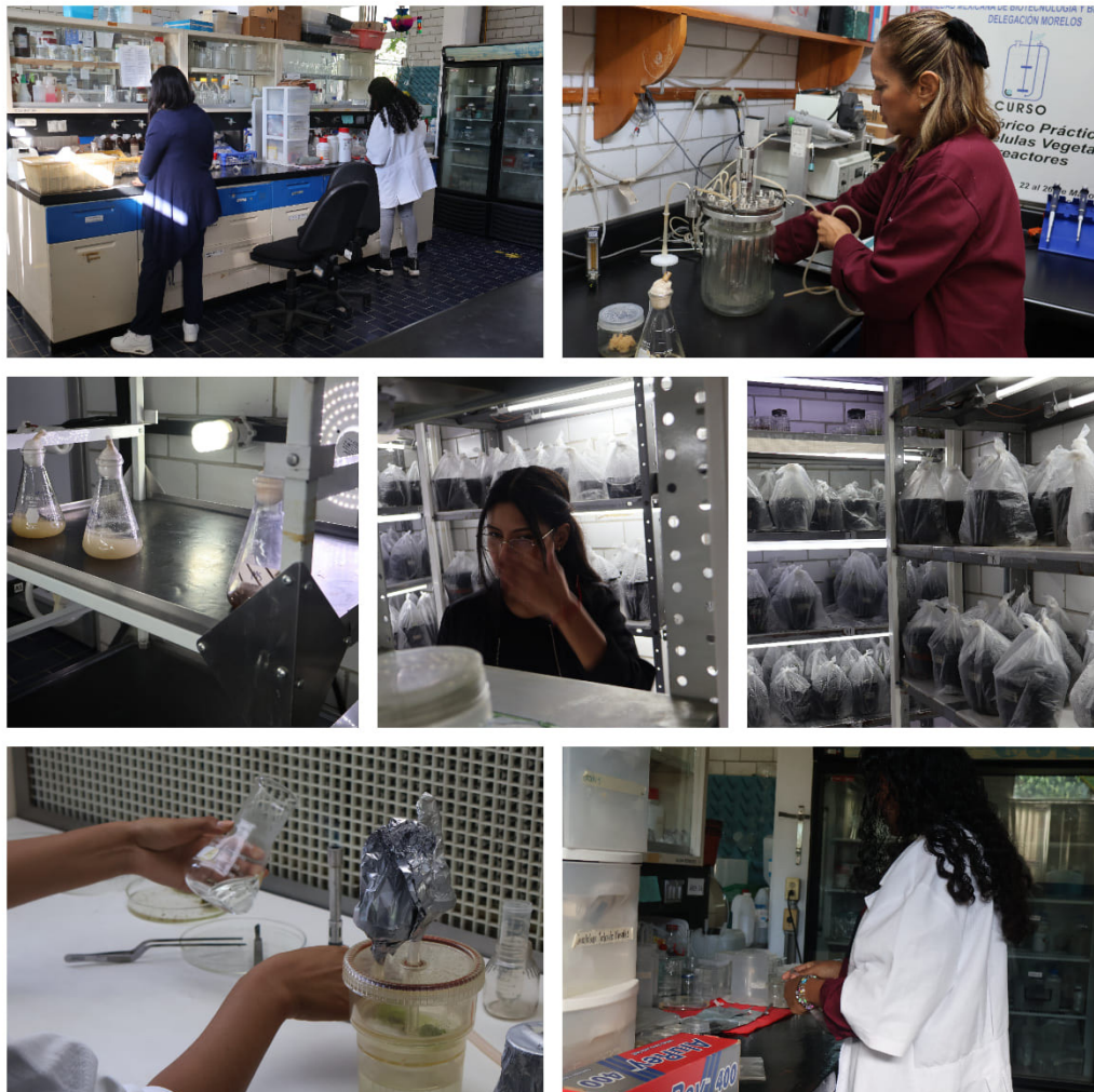
Proyectos de Investigación.

Se desarrollaron 45 proyectos de investigación, cumpliendo con uno de los objetivos fundamentales del Centro de Desarrollo de Productos Bióticos, así como con el compromiso con los diversos sectores de la sociedad.