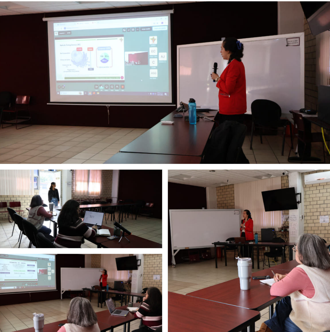
Formación Tecnológico Ambiental para la Sustentabilidad.

Los docentes trabajaron incansablemente para mantener a la vanguardia nuestra oferta educativa y en este contexto tres docentes capacitados en Formación Tecnológico Ambiental para la Sustentabilidad (FORTAS) participaron en el proceso de diseño, rediseño y/o actualización de nuestros programas académicos.