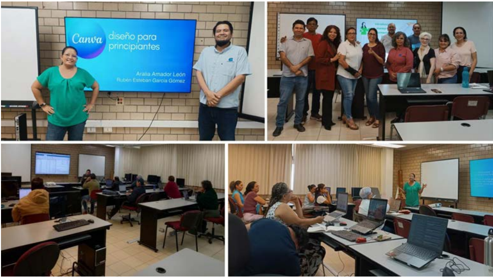
El CICIMAR ofreció cuatro acciones formativas para fortalecer el desempeño del personal docente y PAAE.