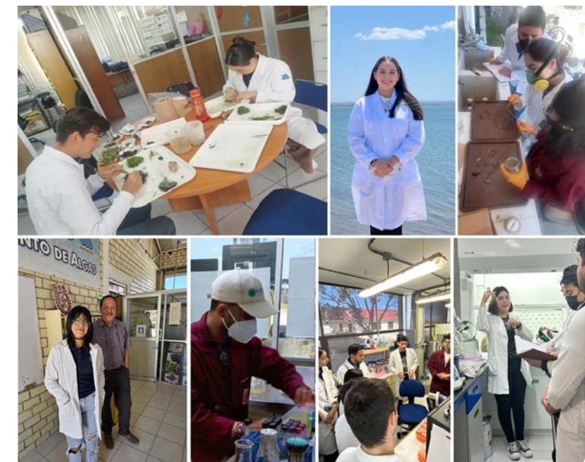
El CICIMAR recibió alumnos visitantes de instituciones de distintos niveles educativos para complementar su formación.

Del total de estudiantes recibidos el 49 por ciento correspondió a visitantes de instituciones del propio estado, el 37 por ciento a estudiantes provenientes de otras entidades del país, y el 14 por ciento fueron movilizaciones de otros países.