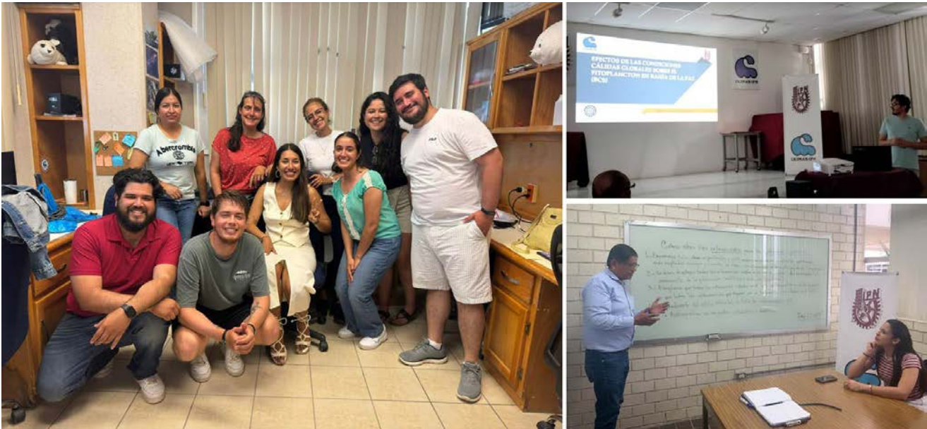
CICIMAR brindó a sus alumnos diferentes apoyos y becas para su formación como futuros investigadores.

Respecto a los apoyos otorgados a los alumnos para fomentar su permanencia y conclusión exitosa de los estudios, así como para formarse como futuros investigadores, el CICIMAR puso a su alcance becas institucionales y externas. Para el año que se informa, el apoyo más importante provino del Consejo Nacional de Humanidades, Ciencia y Tecnología (CONAHCyT), al contar con becas de manutención el 91 por ciento de los alumnos matriculados, mientras el Programa de Beca de Estímulo Institucional de Formación de Investigadores (BEIFI); registró una cobertura del 70 por ciento de los alumnos en activo. Adicionalmente se otorgaron 37 apoyos provenientes del Programa de Becas Institucionales otorgadas por el IPN a través de la SIP, en sus modalidades Becas de estudio, Becas Tesis y Becas de Transición. Solo el cuatro por ciento de la matrícula total no obtuvo ningún apoyo, y correspondió a estudiantes que no cumplieron con los requisitos para aplicar a ninguna de convocatorias disponibles a lo largo del año. Por otro lado, dos alumnos recibieron apoyo de la Dirección de Relaciones Internacionales (DRI) del IPN para movilidad académica presencial, y cinco estudiantes más se hicieron acreedores a los apoyos otorgados por la SIP para asistencia eventos académicos de cobertura internacional.