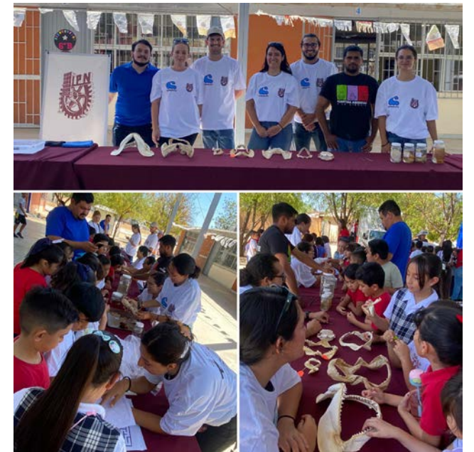
CICIMAR realizó actividades de divulgación de la ciencia en los eventos del Programa “Ciencia Pública” del COSCYT.

El CICIMAR registró una destacada participación dentro de los programas de comunicación de la ciencia denominado “Ciencia Pública” y “Puertas Abiertas”, impulsado por el Consejo Sudcaliforniano de Ciencia y Tecnología (COSCYT), con el propósito de despertar las vocaciones científicas en las infancias llevando mes a mes a diferentes escuelas de nivel básico, exposiciones científicas demostrativas, pláticas informativas y actividades dinámicas que enriquecieron los conocimientos de los estudiantes participantes al tener un acercamiento con las labores de investigación que se realizan en el Centro.