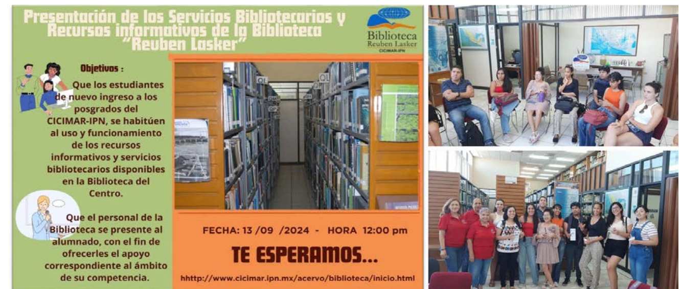
El personal de la Biblioteca "Reuben Lasker" fomentó el desarrollo de habilidades y competencias para el acceso y uso adecuado de las colecciones y demás recursos disponibles.

Finalmente se puede mencionar que el 13 de septiembre, el personal de la Biblioteca "Reuben Lasker" llevó a cabo una plática informativa dirigida a los alumnos de nuevo ingreso en particular, con el fin de dar a conocer los servicios bibliotecarios y de información disponibles para que la comunidad logre desarrollar nuevos conocimientos.