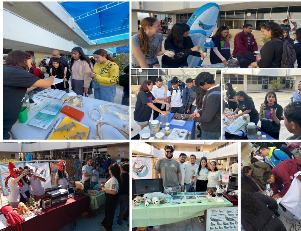
Jóvenes estudiantes de bachillerato experimentaron el quehacer científico en el CICIMAR.

De esta manera se demostró que la divulgación científica no solo es un puente entre el conocimiento y la sociedad, sino es además una semilla de inspiración para las futuras generaciones de científicos, ya que la ciencia no solo explica el mundo, sino inspira a imaginar nuevos horizontes.