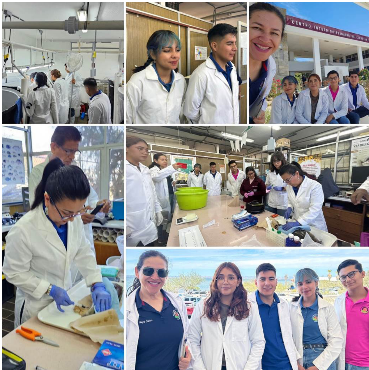
Una experiencia muy gratificante compartir con alumnos de los distintos niveles educativos que visitan los laboratorios del CICIMAR.

Se organizaron también actividades dentro de la propia institución a través de visitas guiadas por los laboratorios y colecciones de la institución como parte del Programa "Asómate a la Biodiversidad Marina en CICIMAR", marco en el que se atendieron grupos de alumnos de todos los niveles educativos, y donde profesores de los distintos laboratorios, y apoyados por del grupo de divulgadores del CICIMAR, organizaron actividades dinámicas para enriquecer los conocimientos de los estudiantes.