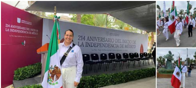
El CICIMAR estuvo presente en el desfile conmemorativo del Aniversario del Inicio de la Independencia en México.

El CICIMAR demostró su firme compromiso con la patria y su dedicación a la educación superior y al desarrollo de la ciencia.