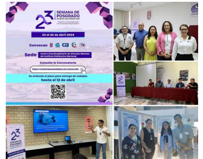
Se llevó a cabo en el CICIMAR la edición anual de la Semana de Posgrado en Baja California Sur.

Sin duda este evento ofreció a los participantes un ambiente de aprendizaje e intercambio de conocimientos, permitiendo además explorar los avances más recientes en sus disciplinas.