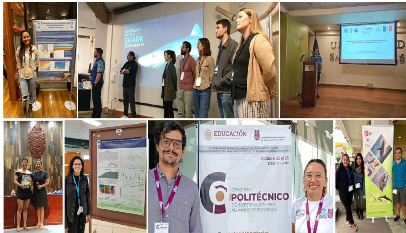
Alumnos del CICIMAR compartieron con la comunidad científica nacional e internacional los avances de sus tesis.

Mediante fondos provenientes de otras instancias, once alumnos realizaron sus estancias de intercambio académico en Instituciones educativas mexicanas como fueron la UNAM y el propio IPN, dos en el extranjero, en Canadá y en Costa Rica respectivamente. Finalmente se debe mencionar que cinco alumnos recibieron autorización para cursar acciones formativas de manera intensiva extramuros.