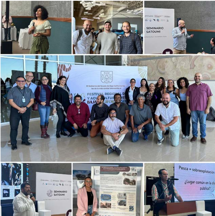
CICIMAR contribuyó al éxito del 3er Festival Regional de Pesca y Acuicultura Sostenible.

El festival no solo fue un espacio de aprendizaje y colaboración, sino también un ejemplo de cómo la ciencia puede integrarse con las comunidades para construir un futuro más equitativo y respetuoso con los océanos, logrando en unidad trabajar por un mar más sostenible.