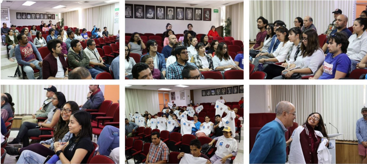
Al inicio del primer semestre se brindó una cálida bienvenida a los alumnos de nuevo ingreso a los programas de posgrado.

Finalmente les deseó una estancia llena de aprendizajes enriquecedores y logros gratificante como científicos en formación, con valores y compromiso de servir a la sociedad.