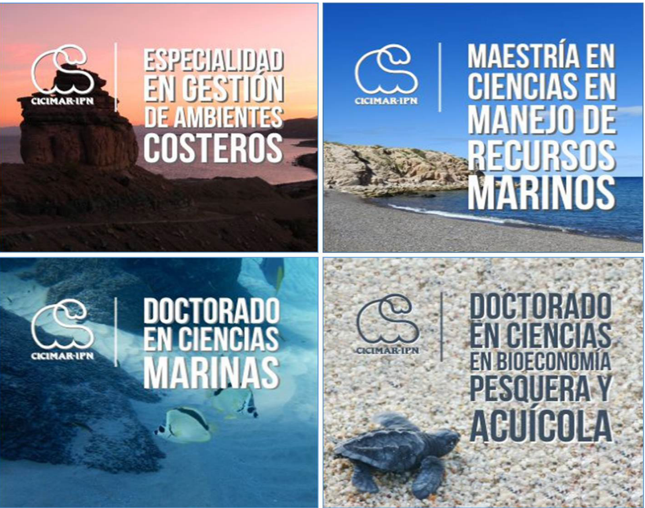
El CICIMAR ofreció cuatro programas de posgrado, todos acreditados por el Sistema Nacional del Posgrado del CONAHCYT.

El CICIMAR durante el año impartió cuatro programas de posgrado: la Maestría en Ciencias en Manejo de Recursos Marinos, el Doctorado en Ciencias Marinas, el Doctorado en Ciencias en Bioeconomía Pesquera y Acuícola; y la Especialidad en Gestión de Ambientes Costeros, con el propósito de formar especialistas del más alto nivel con habilidades para abordar con enfoque ecosistémico los estudios de investigación y conservación en ciencias marinas y pesqueras necesarios para proteger los recursos de los mares y costas del país, y promover políticas de desarrollo sostenible. Los cuatro programas ofrecidos contaron con acreditación dentro del Sistema Nacional de Posgrados (SNP) del Consejo Nacional de Humanidades, Ciencias y Tecnologías (CONAHCYT), los tres primeros considerados como posgrados de investigación y el último como posgrado con orientación profesionalizante.