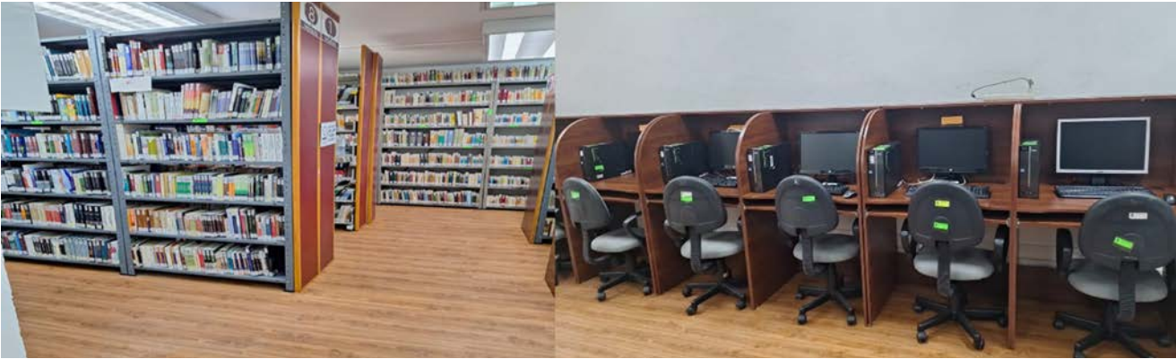
Mejoras en la Biblioteca “De la Mujer de Ciencia”.

En primera instancia se reubicó el acervo en el Departamento de Servicios Educativos y el área de soporte técnico, el movimiento se realizó respetando el orden de acuerdo a la clasificación LC (por tema y de acuerdo al orden alfanumérico), para una vez remodelado el espacio, integrar el acervo bajo ese mismo orden, además de considerar las condiciones físicas y ambientales de los espacios que ocupa tanto el acervo como el tránsito de los usuarios, finalidad que se cumplió bajo la supervisión de la Encargada de la Biblioteca.