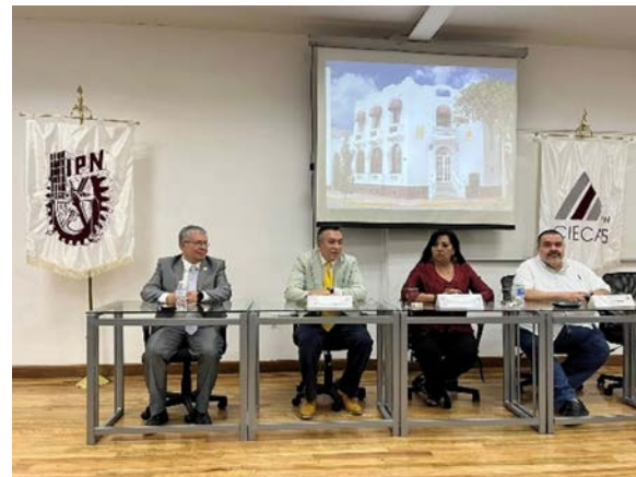
Ceremonia del 40 aniversario de la Maestría en Ciencias en Metodología de la Ciencia llevada a cabo en el auditorio del CIECAS del IPN.

Como parte del festejo del 40 Aniversario de la Maestría en Ciencias en Metodología de la Ciencia (MCMC), se llevó a cabo una ceremonia con la historia de la Maestría y una comida con los egresados y profesores que formaron y forman parte de esta. Esta actividad estuvo encaminada también a la comunicación de la cultura científica y tecnológica del CIECAS.