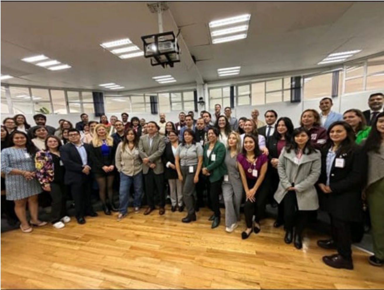
Asistentes al Encuentro de Egresados CIECAS 2024.

Se destacó la importancia de promover colaboraciones interdisciplinarias e impulsar iniciativas innovadoras que respondan a los desafíos actuales.