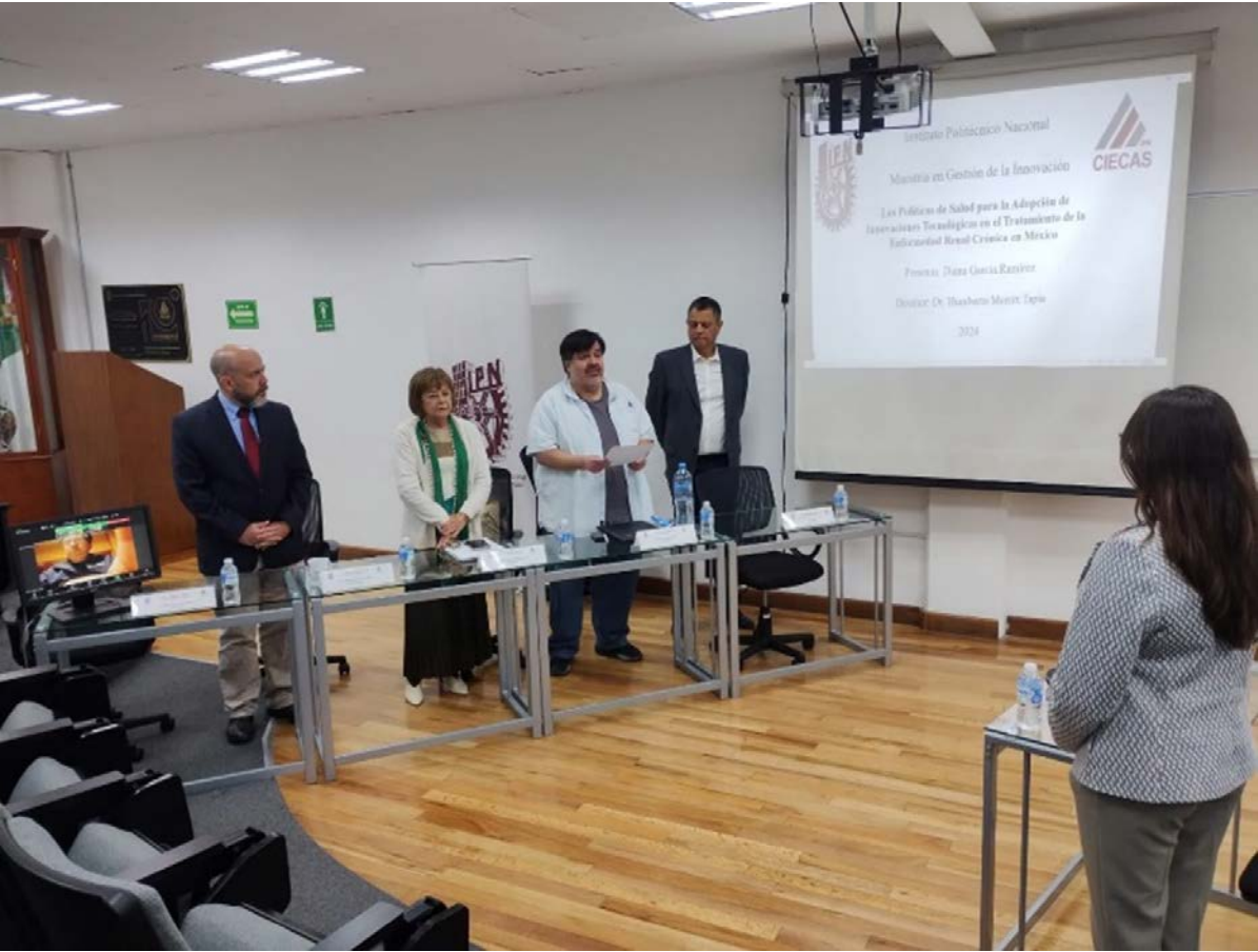
Sustentación de examen de grado de Maestría en el CIECAS.

En el CIECAS estamos comprometidos con brindar un servicio de calidad que permita y facilite el egreso de educandos. Es por ello por lo que, durante el 2024, se atendió en el proceso de egreso a un total de 17 estudiantes, de los cuales nueve son hombres y ocho mujeres.