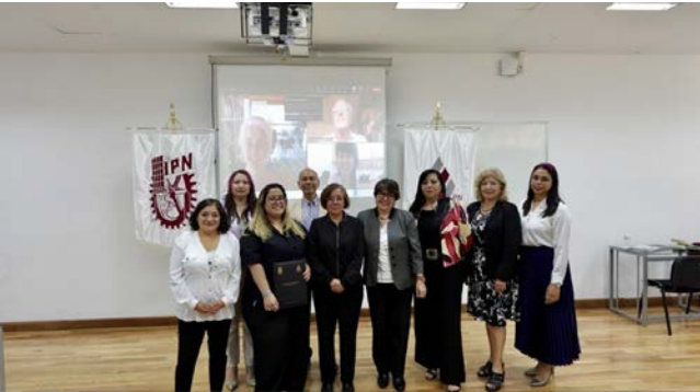
Examen de grado del DIAL – Doctorado Dual, realizado en el Auditorio del CIECAS del IPN.

De igual manera sentó un precedente para que futuros estudiantes realicen actividades de movilidad o estancia.