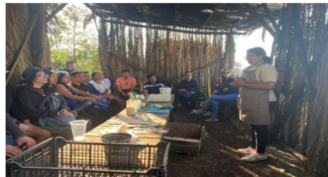
Estudiantes en práctica de campo de Milpa Alta.

El objetivo fue conocer las experiencias de las empresas sociales que contribuyen a generar iniciativas de desarrollo comunitario y local, además de estrechar los lazos de colaboración entre la Alcaldía Milpa Alta y el Centro de Investigaciones Económicas, Administrativas y Sociales (CIECAS).