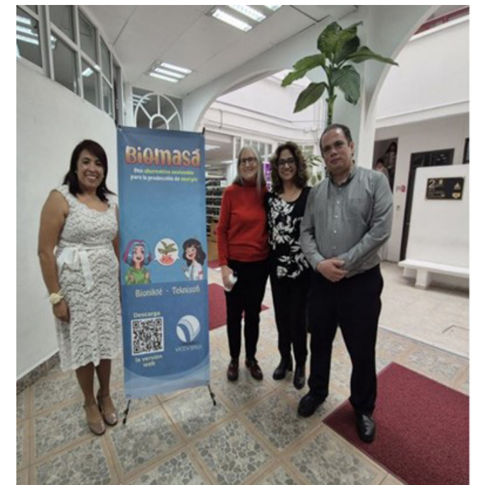
Fotografía del Foro Nacional Energías Renovables y Sustentabilidad.