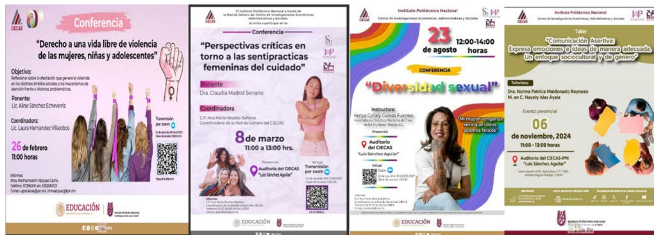
Carteles de invitación a las actividades con Perspectiva de Género.