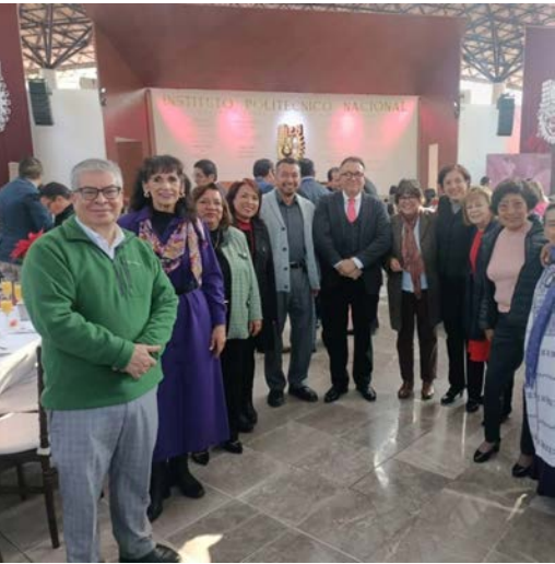
Evento de Estímulo a Investigadores SNII. Centro Histórico y Cultural “Juan de Dios Bátiz” de la Unidad Profesional “Lázaro Cárdenas.

El objetivo fue que los estudiantes desarrollaran habilidades blandas y duras, cualidades de liderazgo y emprendimiento, así como mejorar su dominio del inglés.