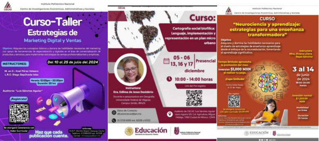
Carteles de invitación a las actividades.

Cabe señalar que estos cursos tuvieron una duración de 20 horas en modalidad virtual y presencial.