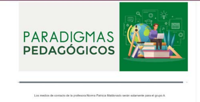
Banner del curso Paradigmas Pedagógicos en Polivirtual.