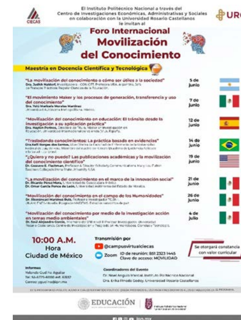
Cartel del 1er Foro Internacional Movilización del Conocimiento Internacional.

Se realizó por la plataforma Zoom y por el canal de YouTube de la Unidad TEyCV llevándose a cabo del 5 de junio al 4 de julio el "1er Foro Internacional Movilización del Conocimiento" con la participación de ocho ponentes, cuatro internacionales y cuatro nacionales, quienes a través de sus conferencias compartieron con la sociedad sus conocimientos sobre el desarrollo tecnológico en esta área.