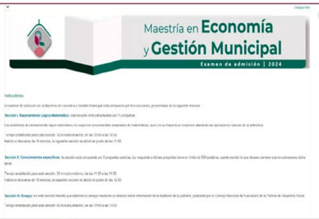
Banner del examen MEGM en Polivirtual.

Se actualizó el diseño del examen de la MEGM para una navegación más eficiente para los aspirantes y docentes dentro de la plataforma Polivirtual.