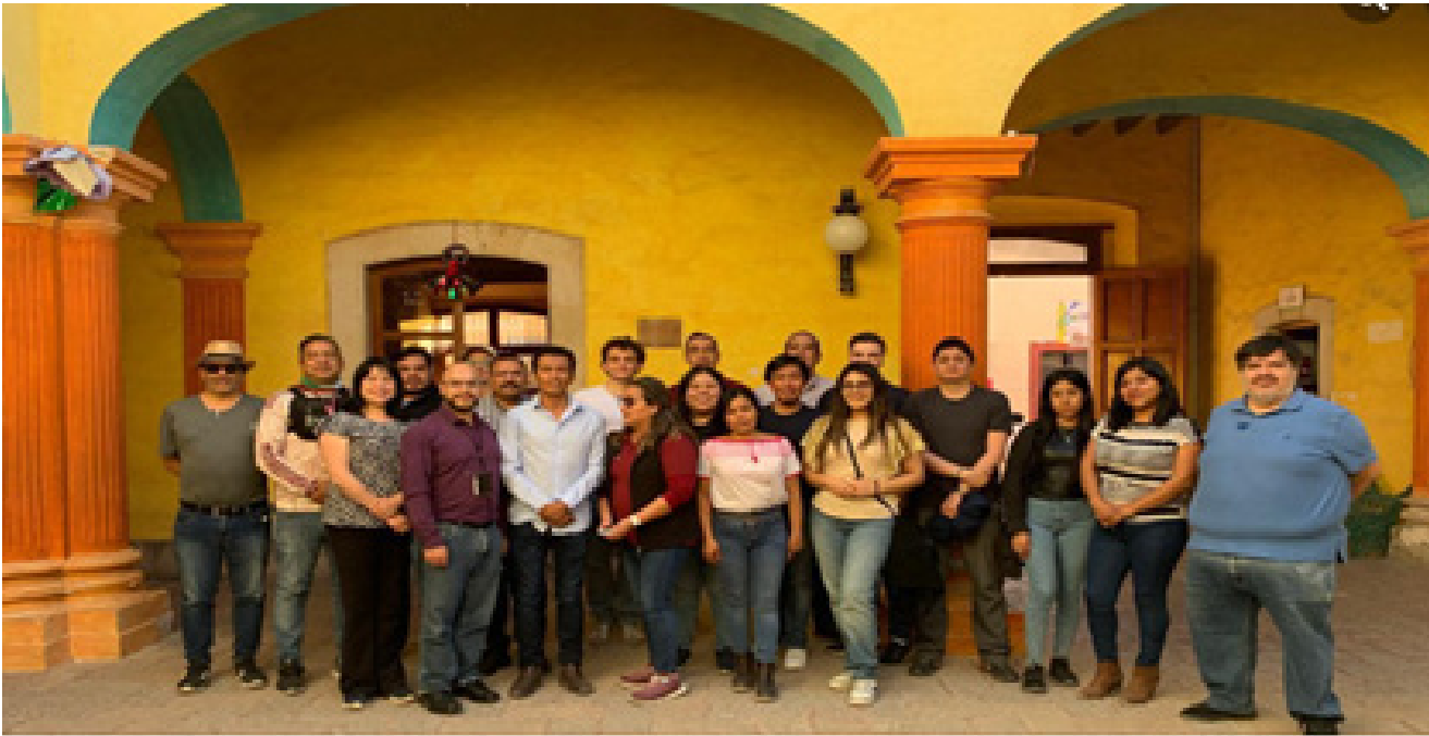
Participantes de la práctica escolar en Querétaro.

En el mismo CICATA recibieron capacitación para el trabajo en campo, en las comunidades Otomíes. Lo anterior permitió que los estudiantes fortalezcan sus conocimientos y habilidades para contribuir en el desarrollo de soluciones innovadoras que respondan a desafíos globales y locales.