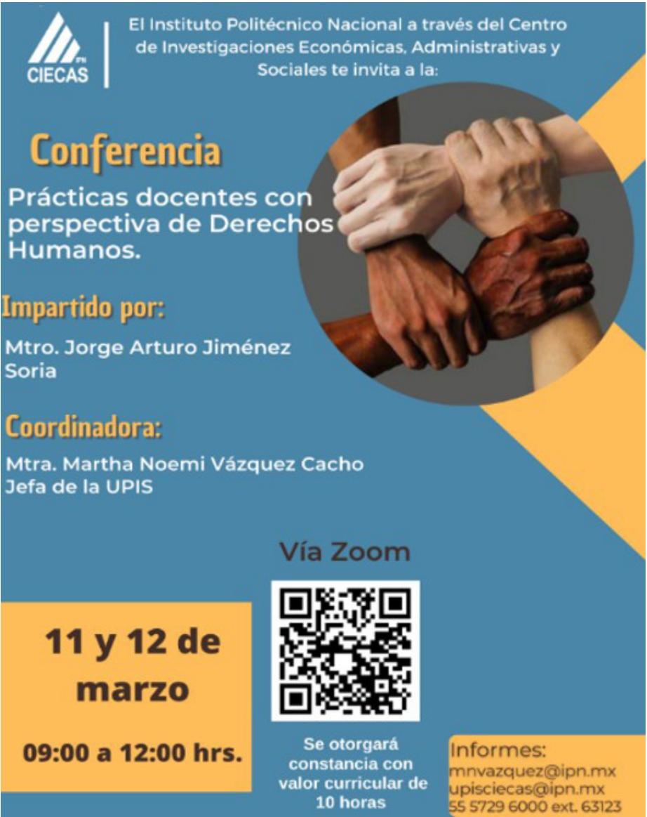
Carteles de invitación a las actividades en Derechos Humanos.

Se realizaron eventos en materia de Derechos Humanos entre los que destaca el curso “Prácticas Docentes con Perspectiva de Derechos Humanos”, que cuenta con un número de registro DVDR/CIECAS/C/018/2024-2026 y un taller denominado “De la teoría a la acción: estrategias para incorporar derechos humanos en el aula”.