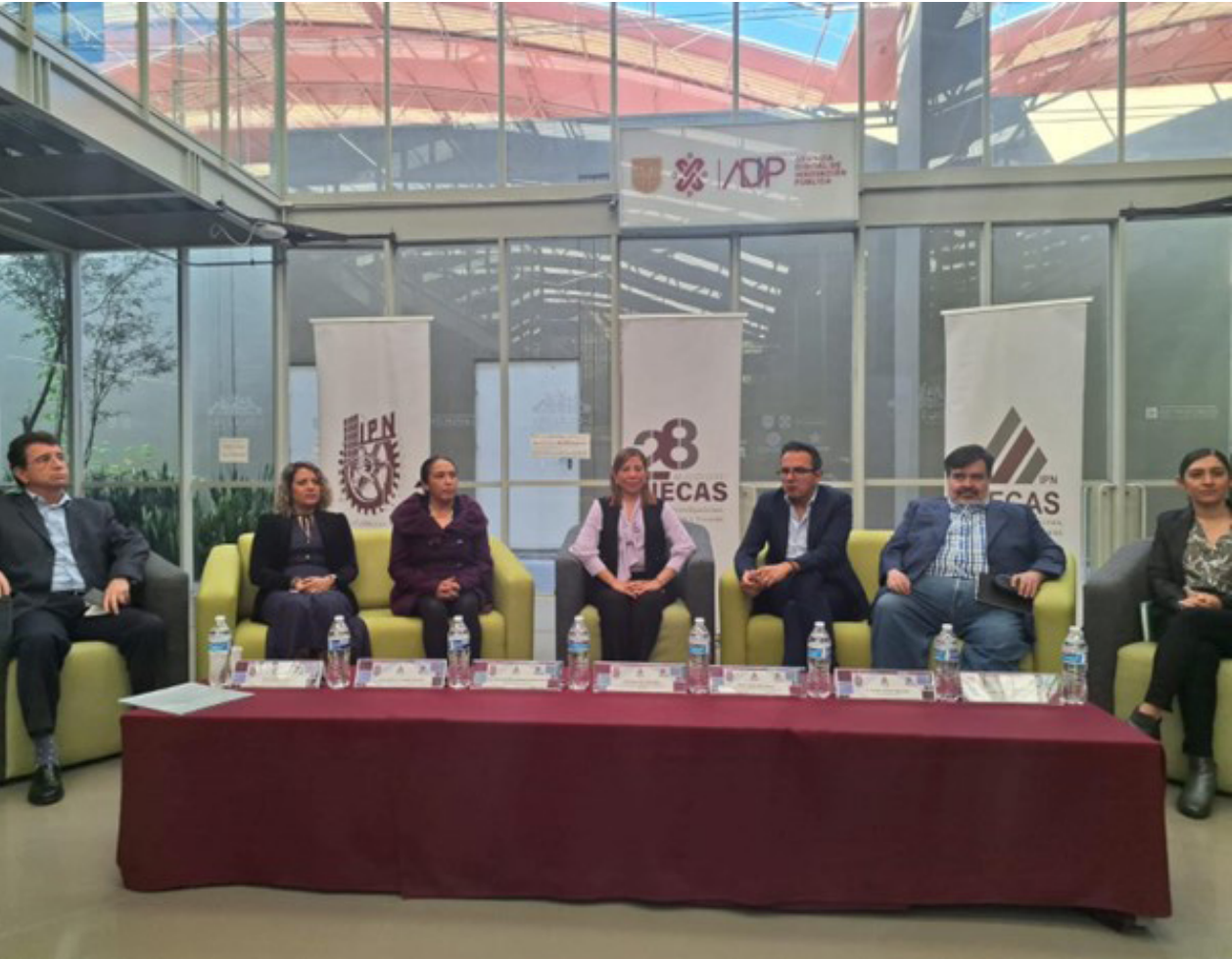
Aniversario 28 del CIECAS.