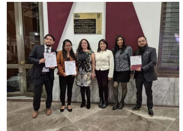
Galardonados del CIECAS al Premio al Mejor Desempeño Académico 2024.

La Secretaría de Investigación y Posgrado otorgó los reconocimientos y los apoyos institucionales al Mérito Politécnico a los alumnos con mejor desempeño académico por programa, de los cuales cuatro alumnos de DIAL, MCMC, MDCyT y MGI fueron galardonados por sus contribuciones que atienden los cambios sociales.