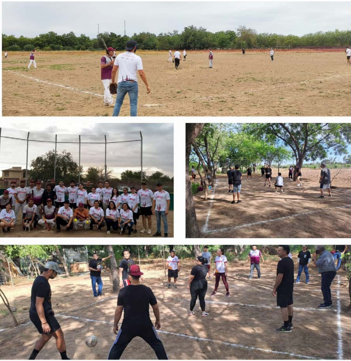
Torneo de voleibol y partido de softbol alumnos y profesores del CIIDIR Sinaloa.

El enfrentamiento entre los estudiantes y los trabajadores del CIIDIR Sinaloa fue todo un éxito. Ambos equipos demostraron gran habilidad, espíritu deportivo y compañerismo. ¡Felicidades a los equipos ganadores y a todos los que hicieron posible este evento memorable!