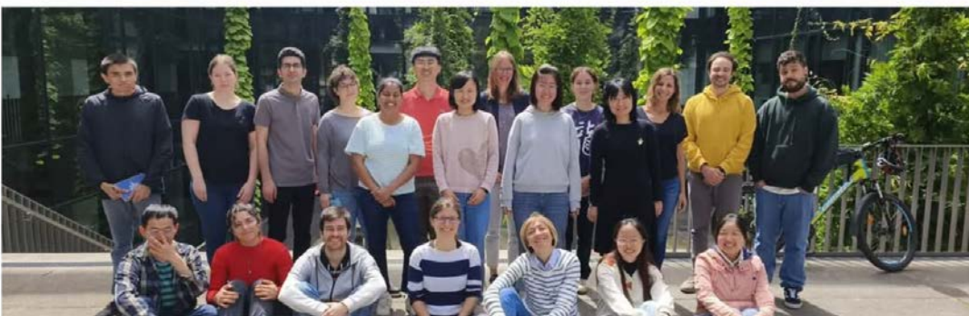
Alumnos e investigadores en el extranjero.