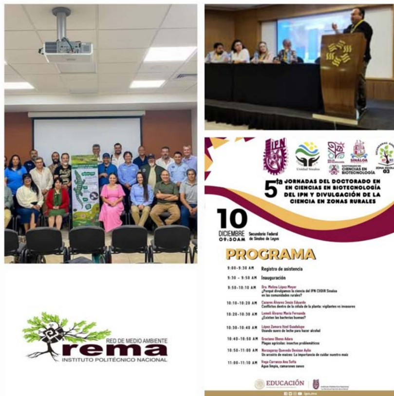
Redes donde participan investigadores del CIIDIR Sinaloa.

Entre muchas otras actividades sobresalientes donde las redes de investigación del IPN están trabajando arduamente para resolver problemas reales en nuestro entorno.