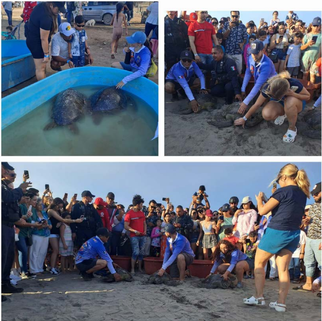
Liberación de tortugas.

El CIIDIR Sinaloa-IPN, a través del Laboratorio de Vida Silvestre y Enfermedades Emergentes y en coordinación con el H. Ayuntamiento de Guasave y otros organismos de la región, durante el evento Guasave en la Playa 2024, se llevó a cabo la liberación de tortugas rehabilitadas en este Centro. En estos eventos no solo celebra la belleza de nuestra fauna marina, sino también el compromiso y esfuerzo de nuestros investigadores y voluntarios por la conservación de estas increíbles criaturas, Familia y amigos son parte de esta maravillosa experiencia y contribuye a la protección de nuestro medio ambiente.