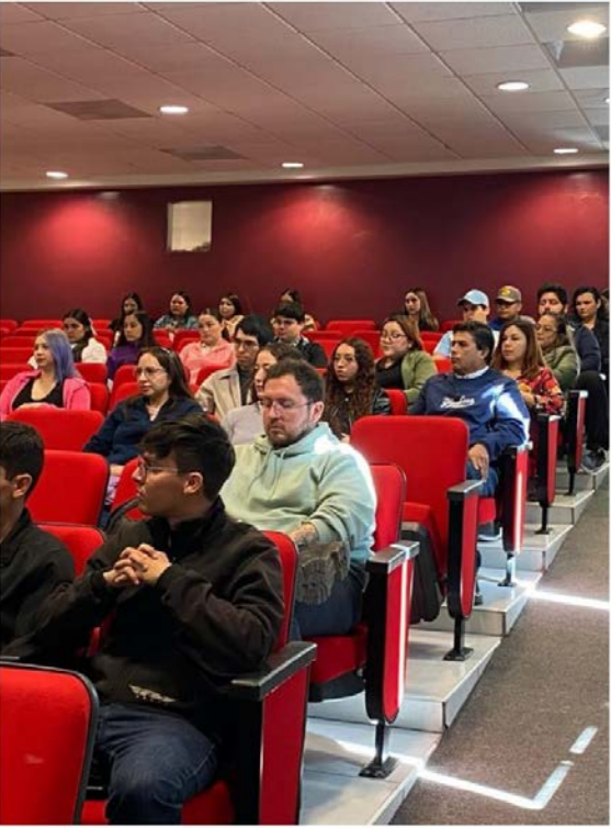
Bienvenida a los alumnos de nuevo ingreso al posgrado.