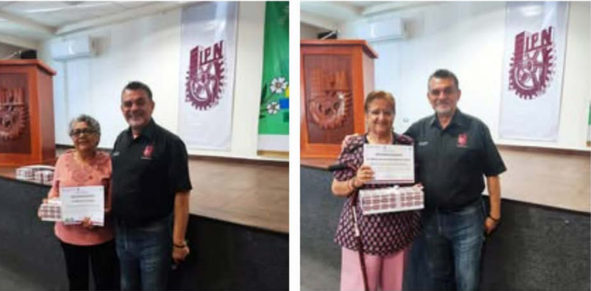
Entrega preseas y reconocimientos.