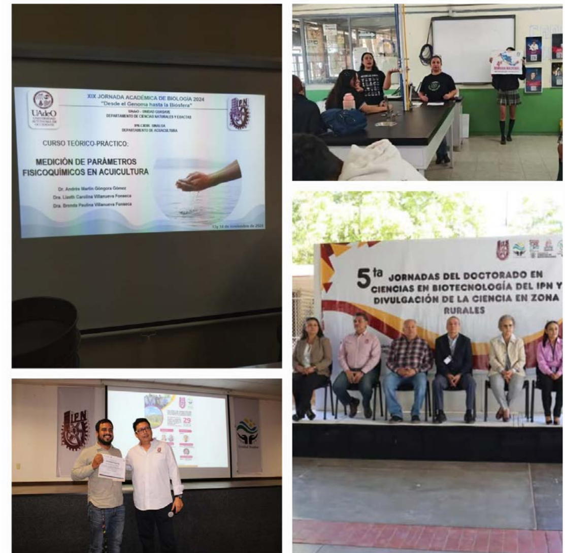
Eventos de divulgación donde participan profesores y alumnos del CIIDIR Sinaloa.

En el transcurso del año 2024, el CIIDIR Sinaloa, realizó diversas actividades de divulgación científica y tecnológica, entre las que se encuentran: cursos, talleres, conversatorios, conferencias, foros, visitas a instituciones educativas fde la región, Jornadas académicas donde investigadores comparten su conocimiento y pasión por la ciencia con las nuevas generaciones, fomentando el interés en la investigación y el aprendizaje en nuestro país y nuestros estudiantes del posgrado presentan sus trabajos de tesis quienes se esforzaron por mostrar sus investigaciones de manera que fueran comprensibles y que despertaran el interés científico entre los presentes.