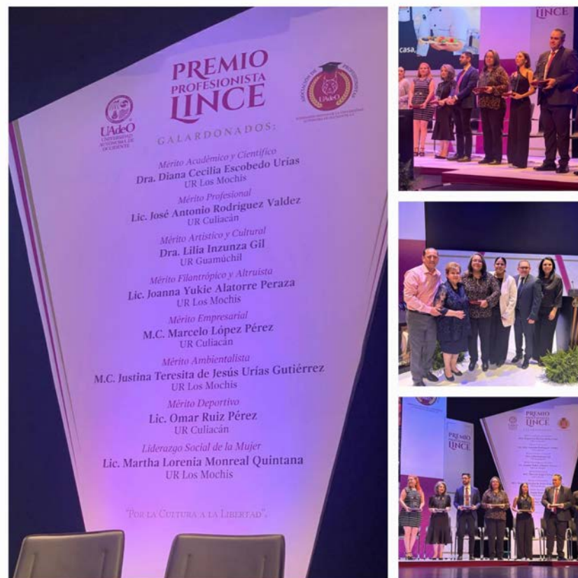
Premio Lince categoría de Mérito Académico Científico.

En el CIIDIR Sinaloa valoramos profundamente su dedicación, esfuerzo y pasión, cualidades que enriquecen a nuestro equipo y nos motivan a seguir contribuyendo al desarrollo de Sinaloa y México.