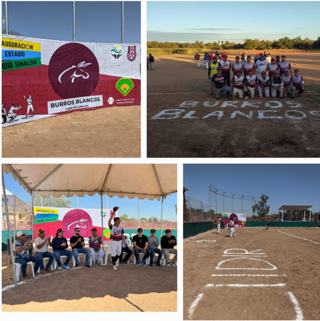
Inauguración del estadio de Béisbol, CIIDIR Sinaloa.

Estuvieron presentes alumnos, personal docente, administrativos y público en general, así como invitados especiales peloteros profesionales dando relevancia a este importante evento .