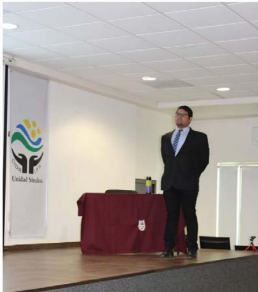
Presentación de examen de grado, alumnos del posgrado.