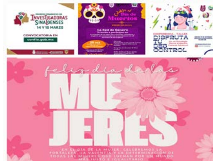
Eventos realizados por la Red de Género.

En Coordinación con la Unidad Politécnica de Gestión con Perspectiva de Género del IPN y la Red de Género del CIIDIR Sinaloa, conforme al Plan anual de Trabajo, realizaron diferentes eventos donde se expusieron temas de gran interés para la comunidad.