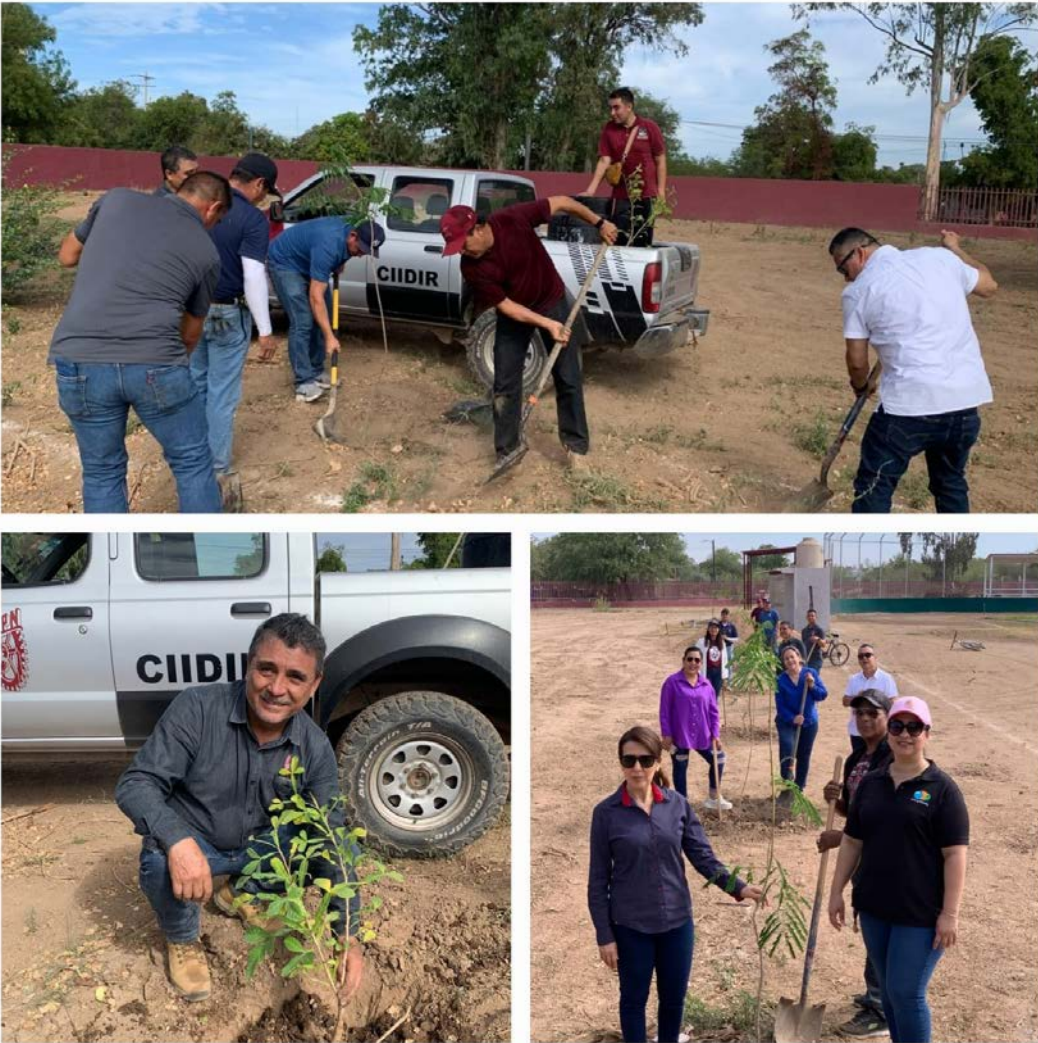
Campaña de reforestación instalaciones del CIIDIR Sinaloa.

Se llevó a cabo una exitosa jornada de plantación de árboles en las instalaciones de CIIDIR Sinaloa. Con la participación entusiasta de nuestros estudiantes, profesores y personal administrativo, hemos dado un paso importante hacia la promoción de la sostenibilidad y la mejora de nuestro entorno. Este esfuerzo no solo contribuye a embellecer nuestro centro, sino que también refuerza nuestro compromiso con el cuidado del medio ambiente