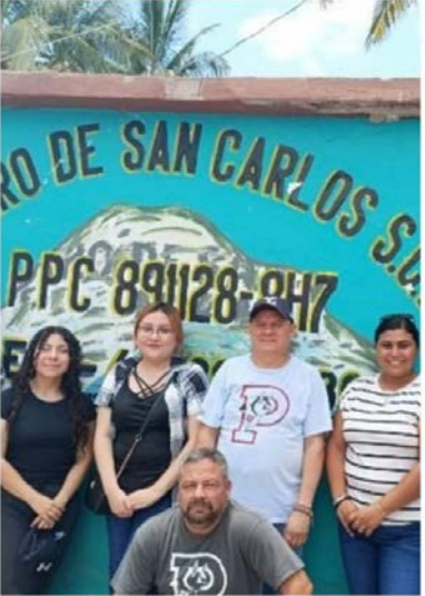
Difusión en materia de compromiso social y sustentabilidad.