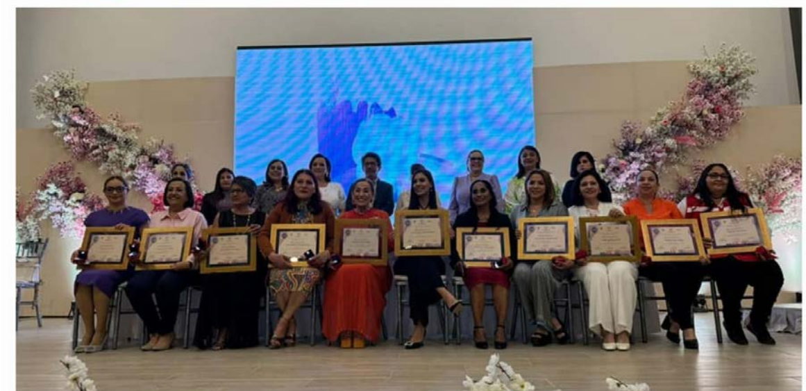
Premio Mujer 2024 en categoría científica.