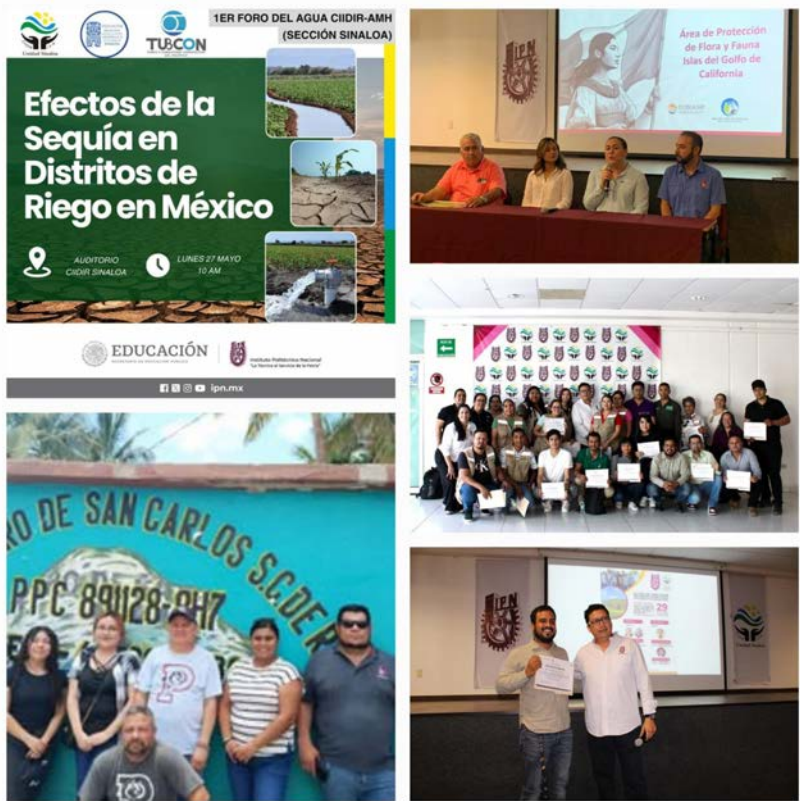
Reuniones con diferentes sectores de la región.