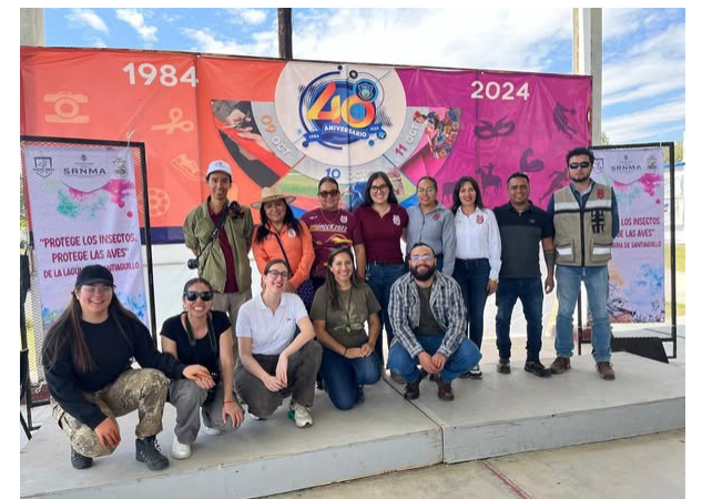
Parte del Staff del evento.

Atendiendo la invitación de la Secretaría de Recursos Naturales y Medio Ambiente del Estado de Durango, estudiantes inscritos en los tres programas de posgrado, docentes de la academia de Entomología e integrantes del grupo de trabajo del JEED del CIIDIR Durango, participaron en la "Feria Ambiental 2024" con actividades lúdicas e informativas para sensibilizar a la comunidad estudiantil de Nuevo Ideal y áreas aledañas sobre la protección e importancia de los insectos y las aves en nuestro entorno y específicamente en la Laguna de Santiaguillo, lo anterior en el marco de la celebración del Día Mundial de las Aves Migratorias.