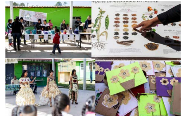
Actividades realizadas durante el evento.

Considerado sagrado en la cultura indígena y parte esencial de la cocina mexicana, el maíz es el protagonista de este festival que se llevó a cabo en la comunidad de La Guacamayita, Mezquital, Dgo.