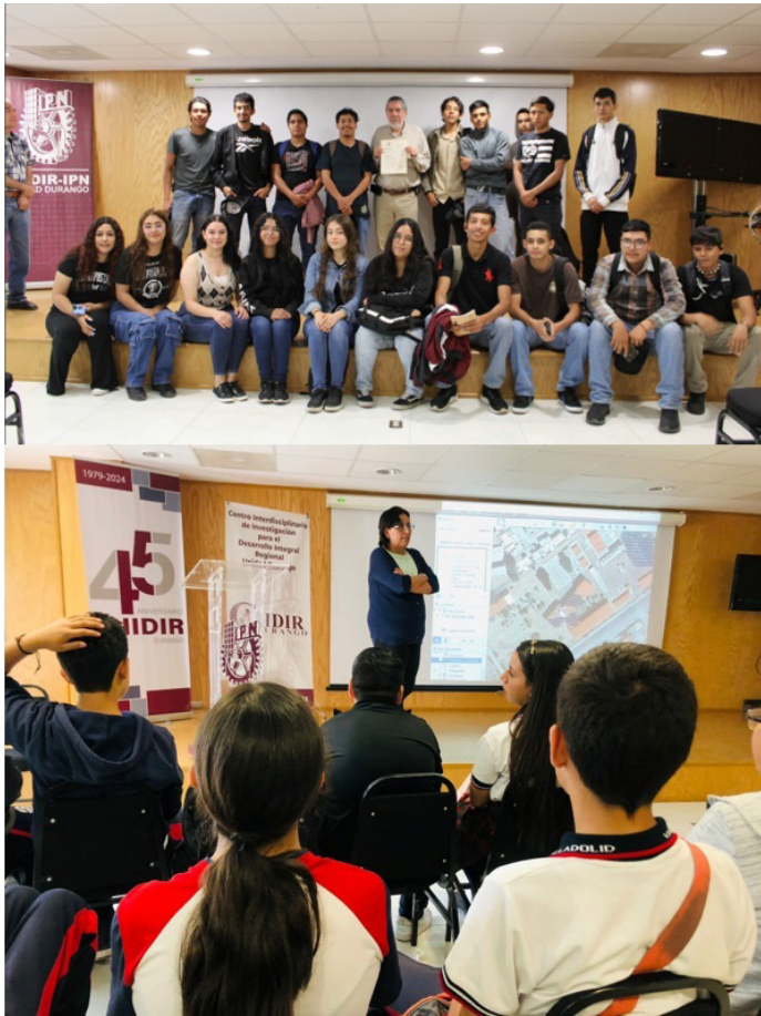
Alumnos de planteles de educación básica.

Asimismo, docentes de nuestro Centro visitaron instalaciones de centro educativos con el fin de divulgar ciencia en beneficio de aproximadamente 2,100 alumnos.