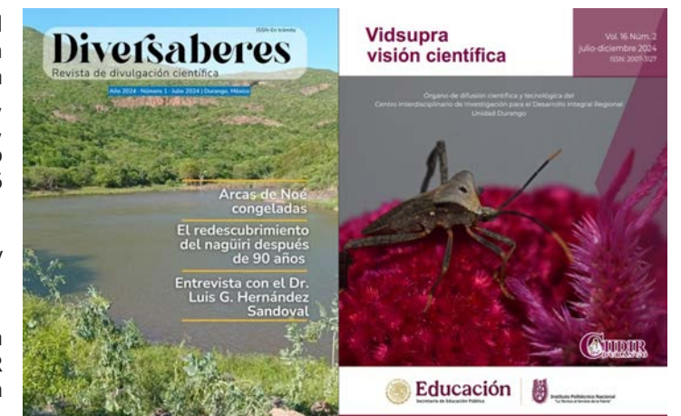
Revistas de difusión científica de CIIDIR Durango.

Diversaberes es una publicación semestral editada Herbario CIIDIR y JEED en colaboración con CIIDIR Durango, durante este primer año se publicaron Volumen 1 Número 1 y Volumen 1 número 2.