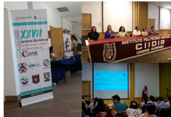
Jornadas de Biotecnología.

Este foro reunió a cerca de 300 asistentes entre estudiantes, docentes, investigadores y público en general, quienes intercambiaron ideas, propuestas de colaboración y socialización de proyectos de investigación.