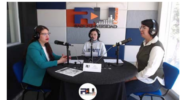
Alumnas de la MCGA promocionando el "7º Encuentro de estudiantes del medio ambiente".

https://www.facebook.com/RadioUJEDOficial