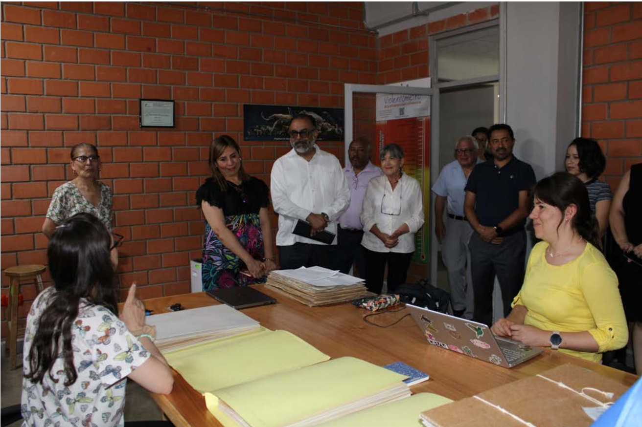
Recorriendo las instalaciones del Herbario.