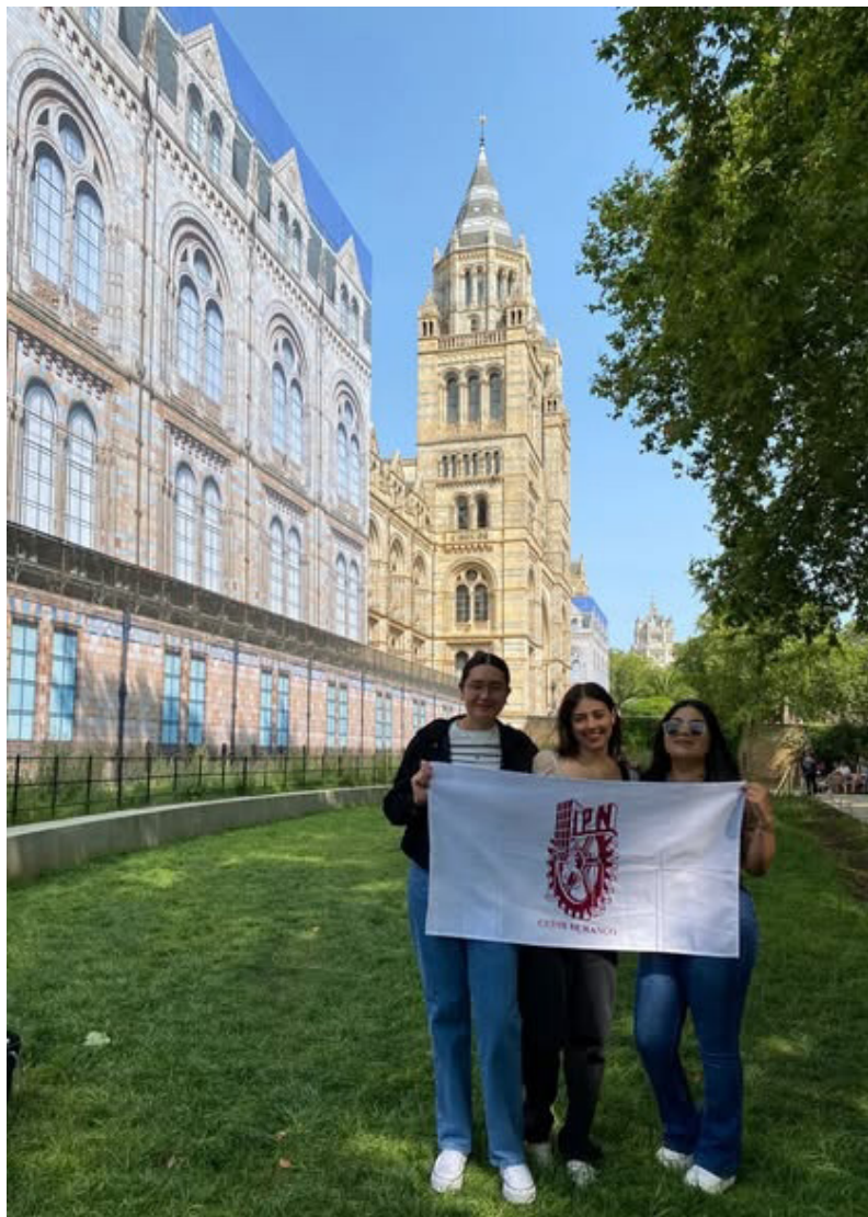
Alumnas de la MCGA en Londres.

Estancia internacional de tres semanas en las instalaciones de la Queen Mary University of London para contribuir al desarrollo profesionales con cualidades de liderazgo y emprendimiento, y el desarrollo de habilidades blandas y duras así como reforzar el dominio del inglés y vivir una inmersión cultural en el extranjero. Asimismo, dos estudiantes del DCB realizaron una estancia en España.