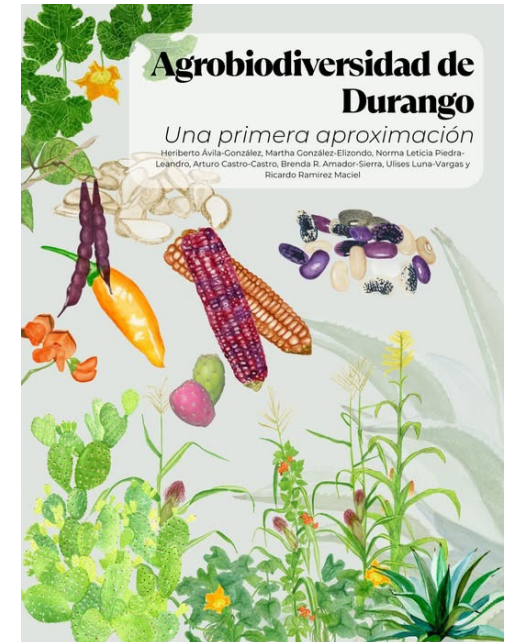
Producto importante de la colaboración del Herbario CIIDIR Durango y el JEED.

Link para descarga: https://drive.google.com/file/d/1mEqr-V0NbnpM4r_Tse64DTr3HrFVxGYD/view?fbclid=IwZXh0bgNhZW0CMTAAR1VADzUQEpd1ws6zGEu8AiI-YqTc0r_pB_u-8xyxey56ONbRTLgSMzS5U_aem_HRYXQ5av-fN-NU1-I0swDA