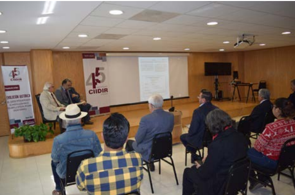
Evento de presentación del libro "Evolución histórica del CIIDIR Durango".