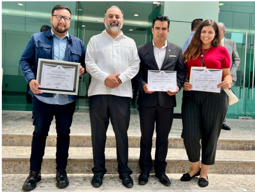
Docentes de CIIDIR Durango pertenecientes al SEI.

21 docentes y tres Posdoctorantes de este Centro formaron parte del Sistema Estatal de Investigadores (SEI) del Consejo de Ciencia y Tecnología del Estado de Durango (COCYTED), que tiene como objeto reconocer públicamente y estimular el desempeño de los integrantes de la comunidad científica del estado de Durango, así como promover e impulsar las actividades científicas y tecnológicas de los integrantes de la comunidad científica del Estado, propiciando el incremento de la productividad, el mejoramiento de la calidad y su participación en la formación de nuevos investigadores que colaboren en el desarrollo del Estado.