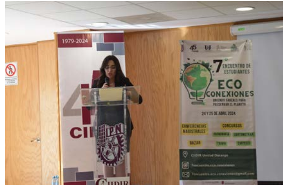
Los estudiantes de la MCGA conduciendo con éxito esta séptima edición del Encuentro de estudiantes del medio ambiente.