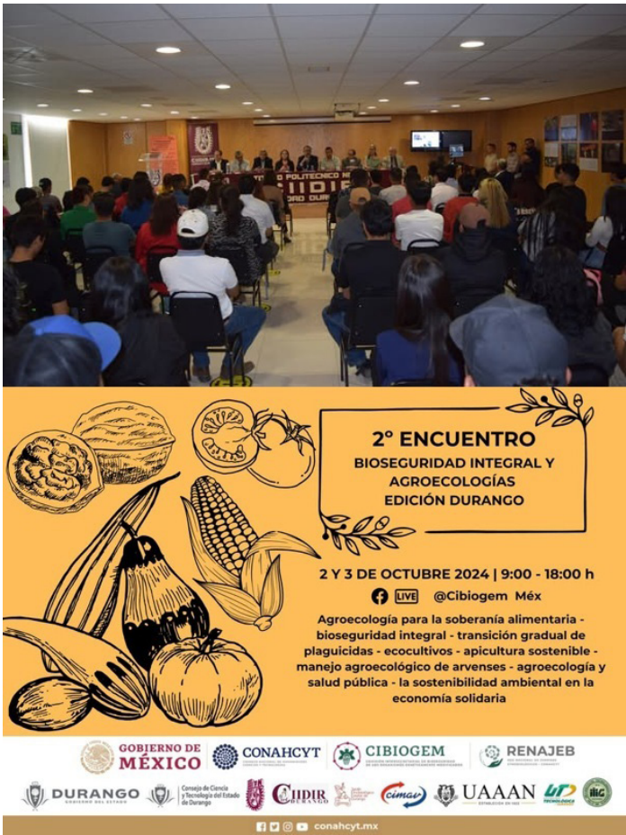
Participación nutrida en este interesante evento.

Organizado por el CONAHCYT, la Secretaría Ejecutiva de la Comisión Intersecretarial de Bioseguridad de los Organismos Genéticamente Modificados (CIBIOGEM), el CIIDIR Durango, el JEED, el Centro de Investigación en Materiales Avanzados Durango (CIMAV-Dgo.) y el Consejo de Ciencia y Tecnología del Estado de Durango (COCYTED), contando además con la presencia, a través de sus titulares y/o representantes, de importantes instituciones como SRNyMA, Universidad Tecnológica de Durango (UTD), Universidad Autónoma Agraria Antonio Narro, Instituto Nacional de Investigaciones Forestales Agrícolas y Pecuarias (INIFAP), Secretaría de Educación del Estado (SEED) y Universidad Juárez del Estado de Durango (UJED).