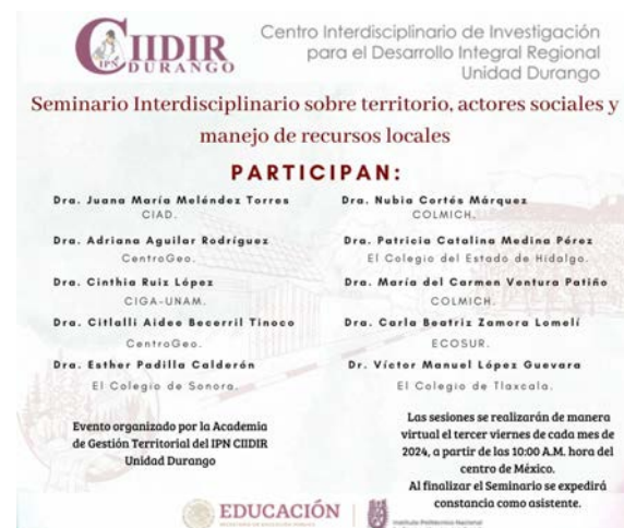
Póster de propaganda del Seminario.

En este foro, registramos a más de 120 asistentes entre profesionales, investigadores, académicos y público en general que aportaron conocimientos y experiencias exitosas para solucionar y mitigar problemas del entorno ambiental a través de seis conferencias magistrales, concursos de fotografía, cortometrajes, carteles y trivia ampliamos el conocimiento, actitudes, competencias y compromisos sobre diferentes disciplinas en beneficio del medio ambiente.