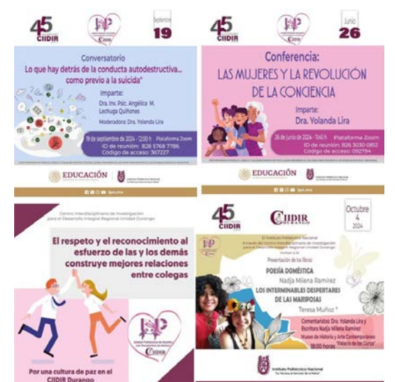
Posters de algunas de las actividades promovidas por la Red de Género.