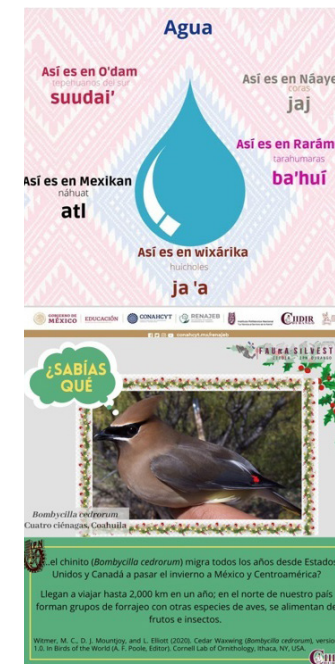
Cápsulas informativas del JEED y de la Academia de Fauna Silvestre respectivamente.

La divulgación científica es acercar la ciencia al público general no especializado; es toda actividad de explicación y difusión de los conocimientos, la cultura y el pensamiento científico y técnico, aprovechando las redes sociales, la Academia de Fauna Silvestre a través de su cápsula ¿Sabías que..? da a conocer datos importantes y relevantes de especies animales, así como sus respectivas referencias; también el Herbario CIIDIR a través de la página del JEED, con su cápsula “Así se dice” promoviendo las lenguas originarias del Estado.