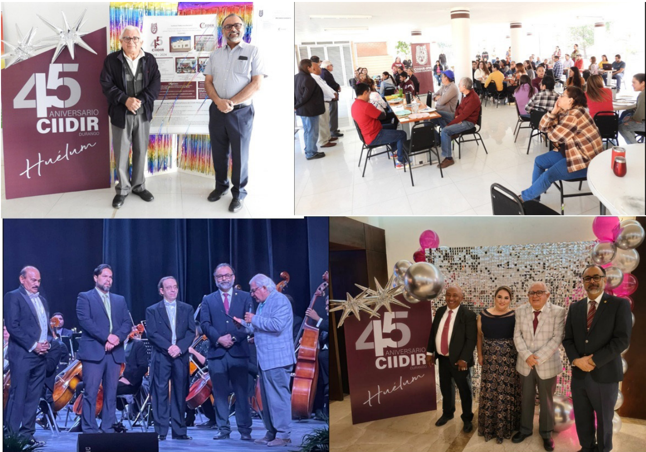
Eventos en el 45 Aniversario de CIIDIR Durango.