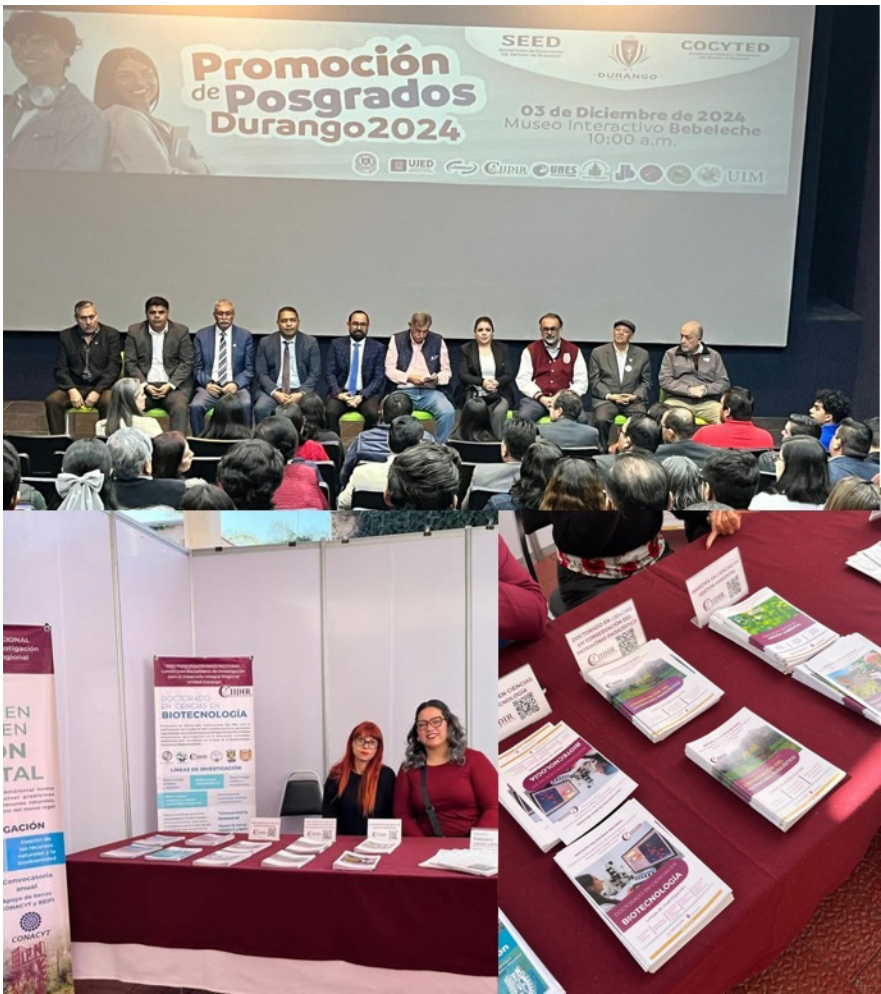
Evento de promoción de Posgrados.

El 03 de diciembre, CIIDIR Durango atendió la convocatoria del COCYTED al evento “Promoción de Posgrados Durango 2024”, un espacio perfecto para mostrar nuestra oferta profesional.