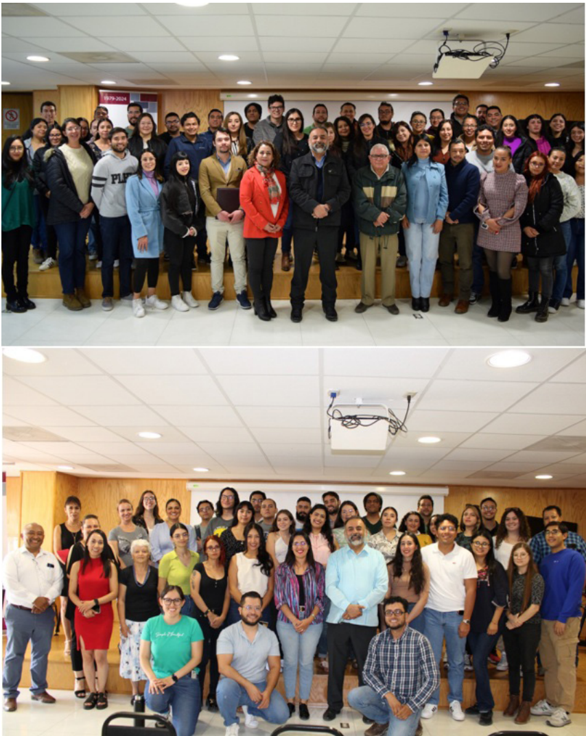
Bienvenida a estudiantes a semestres A24 y B24.

El 28 de agosto se llevó a cabo la bienvenida al semestre B24 a nuestros alumnos de reingreso y a quienes inician a formar parte de nuestra familia politécnica en los programas de Maestría y Doctorados, deseando que su estancia en el CIIDIR signifique una grata experiencia académica y personal.