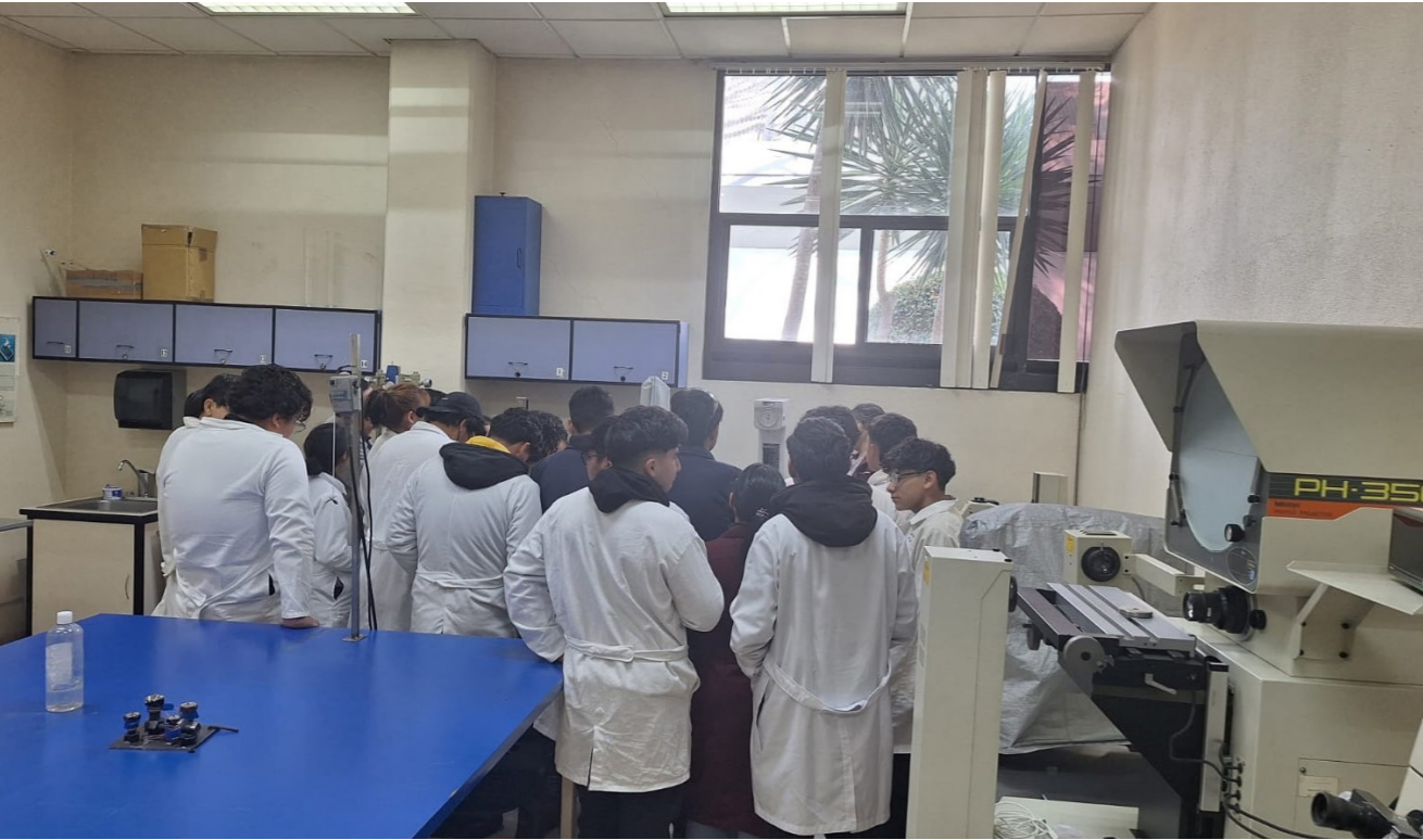
Visita de alumnos del programa Control y Automatizado ESIME.

Se recibieron un total de 74 alumnos provenientes de diferentes unidades académicas del Instituto, los cuales se encuentran realizando su servicio social en los programas ofertados por el Centro.