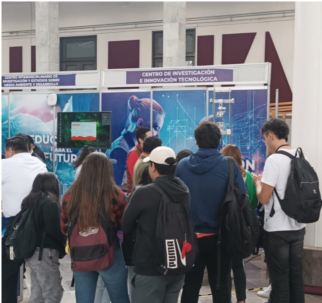
Visitantes de la Feria Innovación, en el stand de información del CIITEC.

El evento se llevó a cabo los días 08 y 09 de octubre en el recinto histórico y cultural “Juan de Dios Bátiz Paredes”.