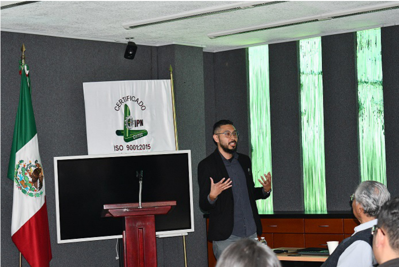
Participación de egresado del PTA compartiendo sus experiencias durante la 3a. Reunión de Egresados.

El día 25 de octubre se llevó a cabo la 3a. Reunión de Egresados de los Posgrados en Tecnología Avanzada (PTA). Los participantes tuvieron la oportunidad de compartir su experiencia en el campo laboral donde se desempeñan.