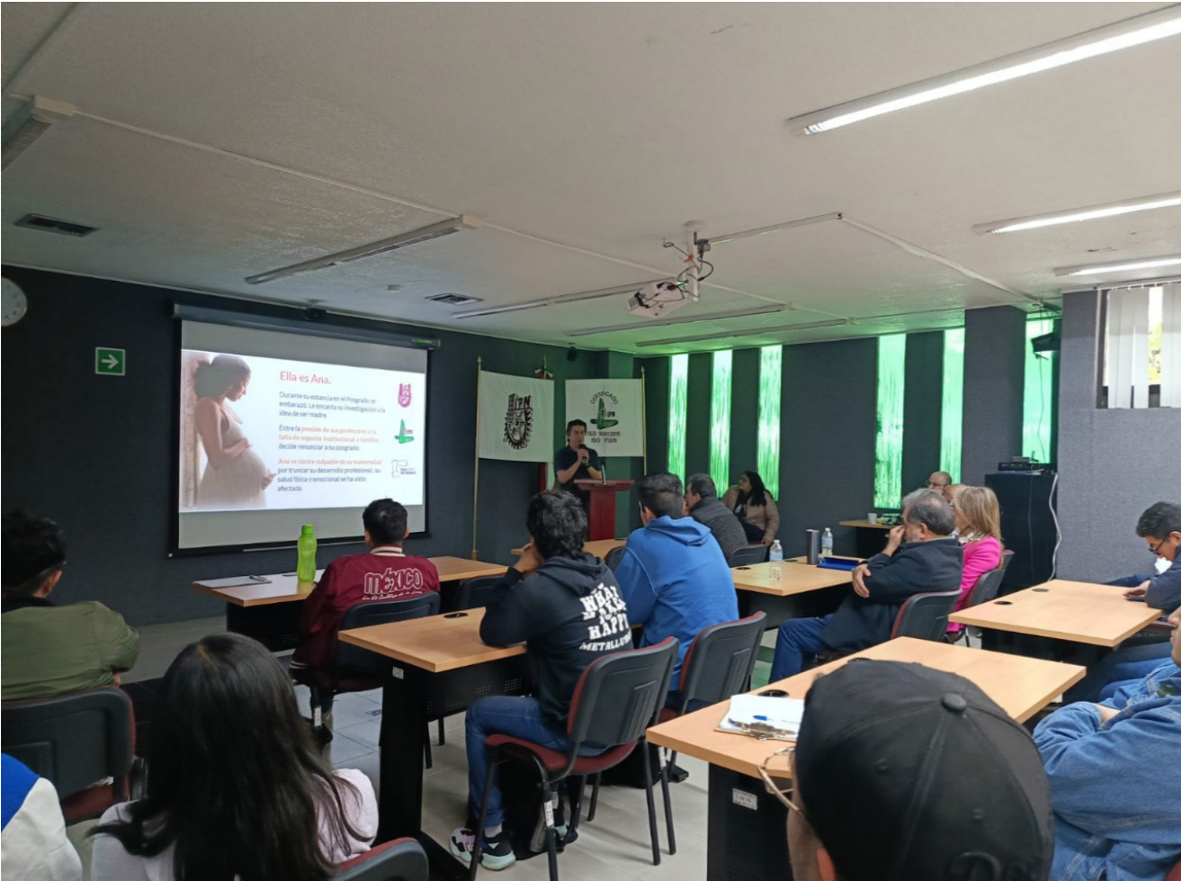
Presentación del Comité de Red de Genero del CIITEC con la comunidad estudiantil del PTA.

El Comité de Red de Género del CIITEC llevó a cabo 12 acciones en temáticas de perspectiva de género. Tres integrantes del Comité acreditaron diversos cursos de capacitación con temática de perspectiva de género.