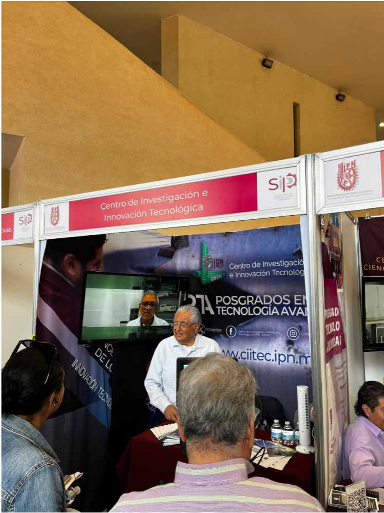
Atención de visitantes en el stand del CIITEC durante la Expo-Posgrados 2024.

El CIITEC participó en la Expo Posgrados 2024 del IPN del 17 al 19 de abril, donde se promovieron los Posgrados en Tecnología Avanzada que se ofertan en este Centro. A los interesados se les dio a conocer: el proceso de admisión, información relacionada con las líneas de investigación que se desarrollan, así como algunos de los principales proyectos que se realizan en los diferentes laboratorios.