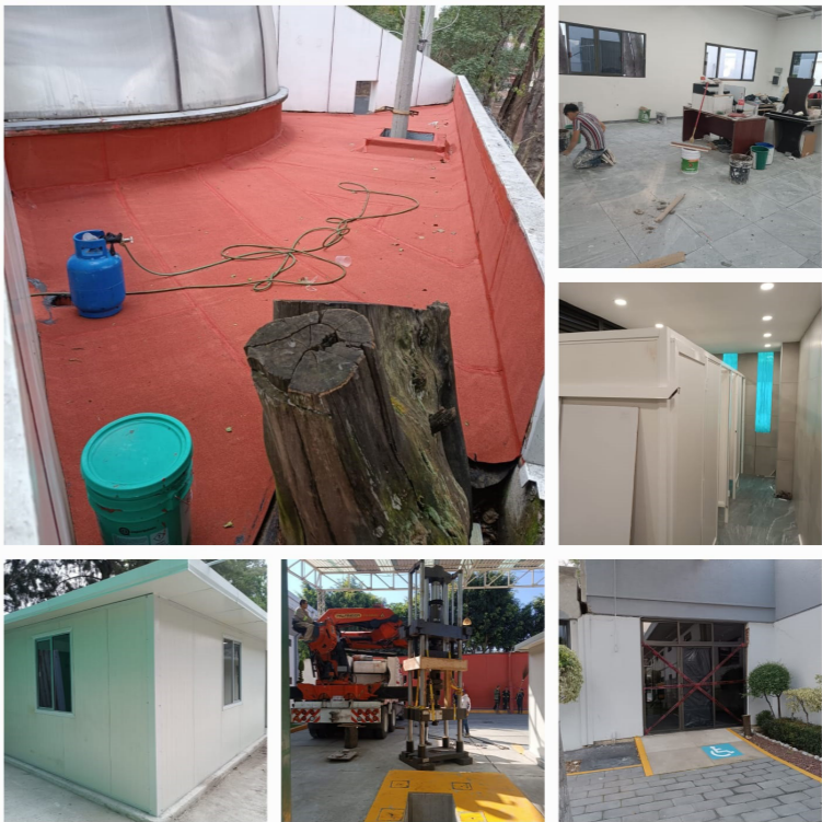
Remodelaciones y mejoras a la infraestructura del CIITEC.