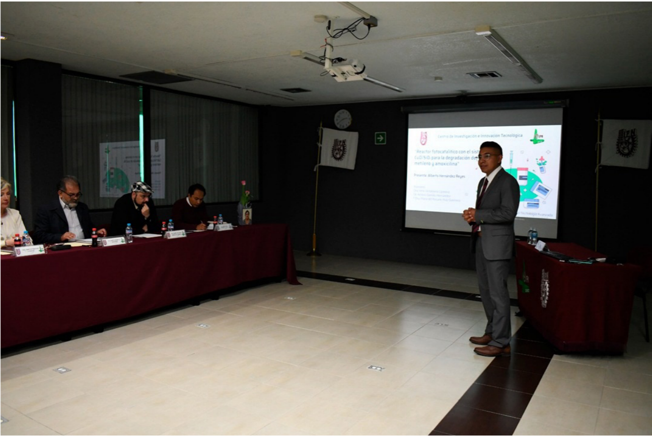
Estudiante del Posgrado en Tecnología Avanzada durante su examen de grado.

Se graduaron siete alumnos de la MTA y dos del DTA, alcanzando con esto una eficiencia terminal del 83 por ciento.