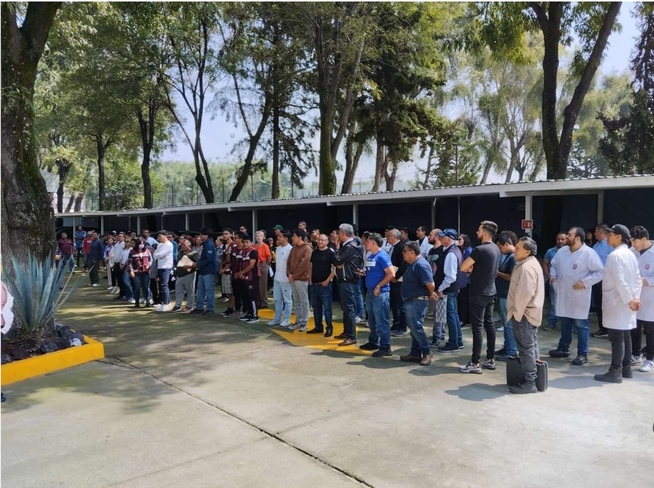
Comunidad del CIITEC participando en simulacro organizado por la Unidad Interna de Protección Civil.

En este periodo se realizaron tres simulacros en los que, con la coordinación de la Unidad Interna de Protección Civil del Centro, tanto el Personal de Apoyo y Asistencia a la Educación (PAAE), docentes y estudiantes cumplieron con los lineamientos establecidos para su protección en caso de presentarse algún siniestro durante su estancia dentro de las instalaciones.