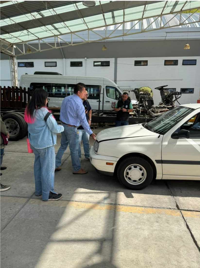
Personal de CIITEC, dictaminación de auto antiguo.

Se elaboraron un total de 780 dictámenes de auto antiguo y 76 reportes técnicos de homologaciones de autobuses y ambulancias.